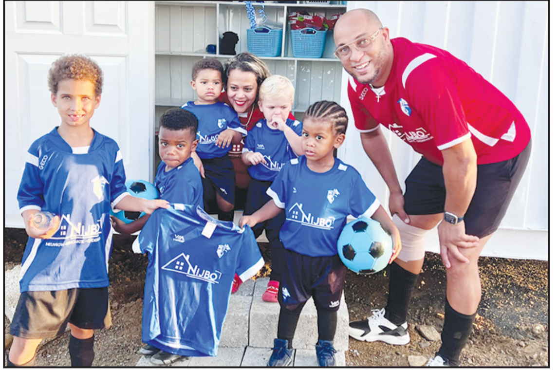
Deporte rei ta karga su nòmber