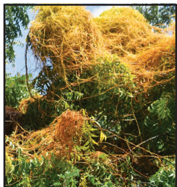
Hilu di diabel riba un foto di djasabra ultimo.

Van Buurt ta sigui su relato tokante hilu di diabel pa BONERIANO: “E ta un parasit ku ta chupa e sapnan di otro mata, loke ta debilitá nan i asta por mata nan. Tambe e ta pone ku lus no por yega na blachinan di e mata ku e ta parasitando.