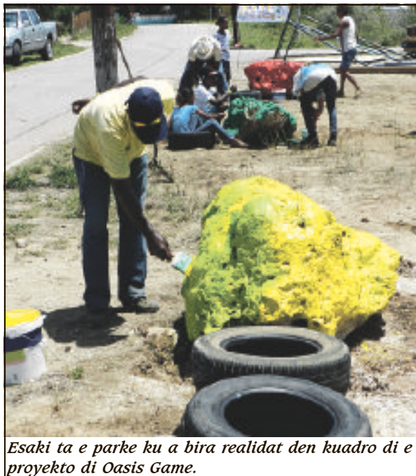
Esaki ta e parke ku a bira realidat den cuadro di e proyekto di Oasis Game.