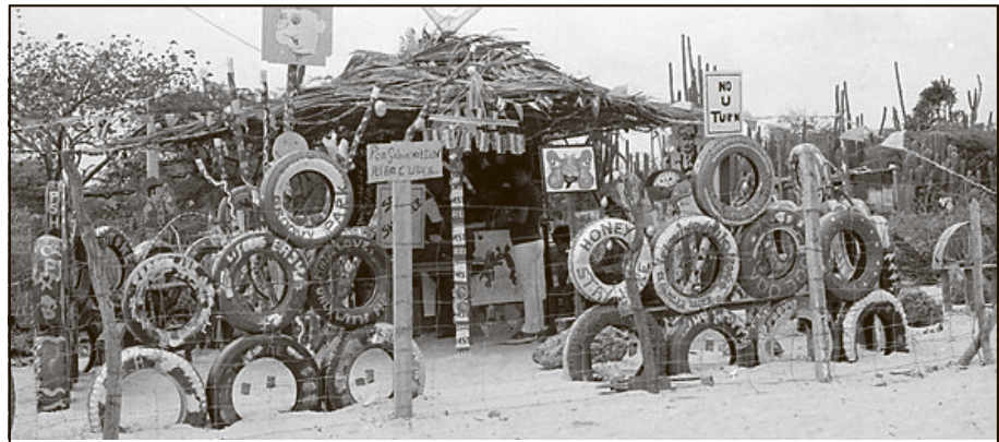
Parke na Mentor, na unda awor tin fasilidatnan manera mesa i banki.

E otro parke a bira realidat algun siman pasá den cuadro di e proyekto di Oasis Game. Aki den tin tambe aparatonan na unda muchanan mas chikito por dibertí, di manera pues ku e ta desvia den e sentido ei por di e pensamentu original di ‘high flying park’.