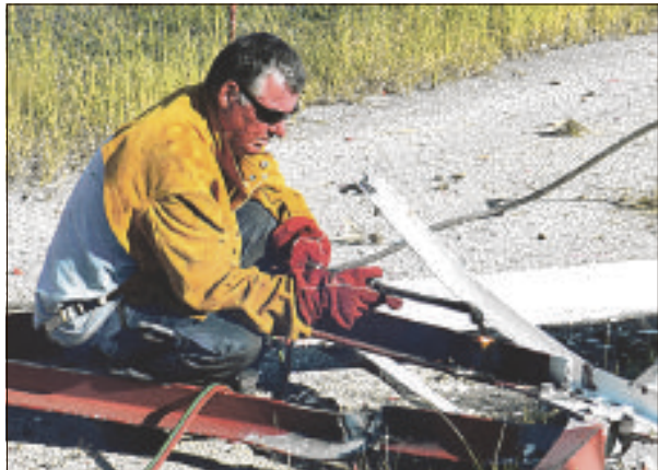
Trabounan pa kita partinan di mast ku a kai riba kaminda pa bai e edifisyonan di RNW.

Mientrastantu ayera tardi a yega un skèr grandi di kòrta heru. Ku esaki lo kòrta e mastnan aki na pida pida i eksportá nan pa dirti nan i traha artefaktonan nobo di heru. No sa ainda pa kua pais lo eksportá nan.