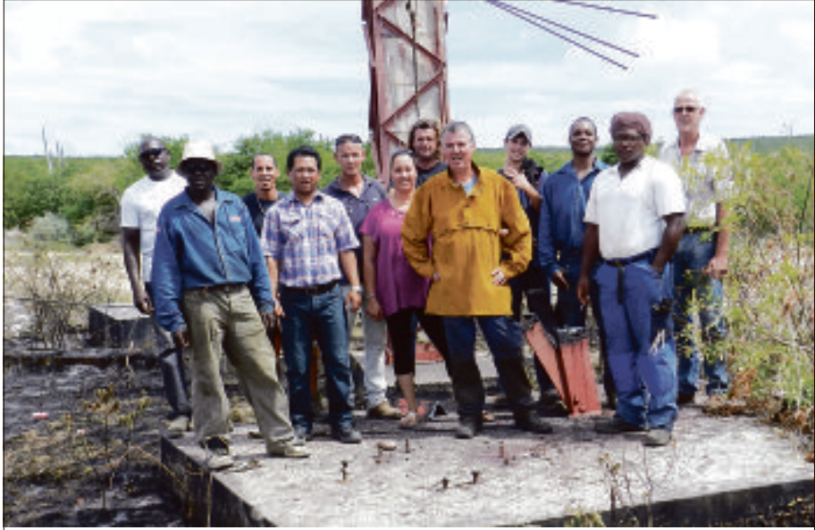
E grupo di trahadó di Miles ku a hasi e trabou pa tumba e antènenan.