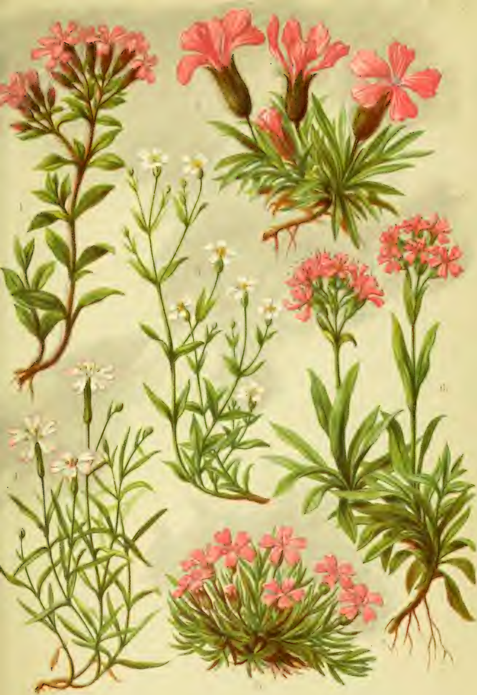
1. Saponaria ocymoides . 2. Silene Pumilio . 3. Silene rupestris . 4. Silene acaulis . 5. Silene acaulis .