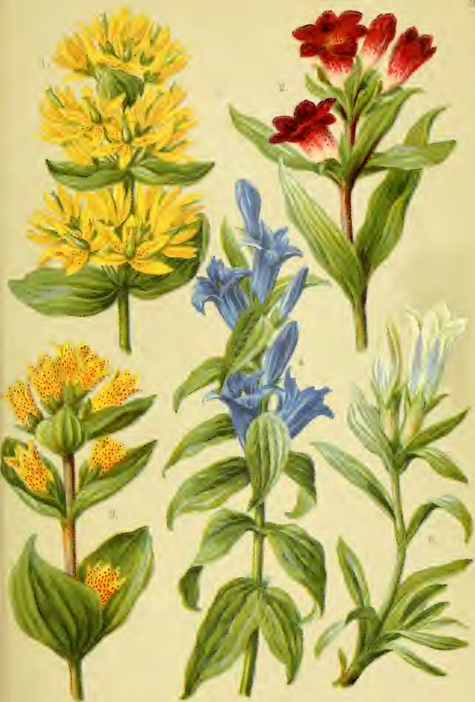
1. Gentiana lutea . 2. Gentiana purpurea . 3. Gentiana punctata . 4. Gentiana asclepiadea . 5. Gentiana frigida .