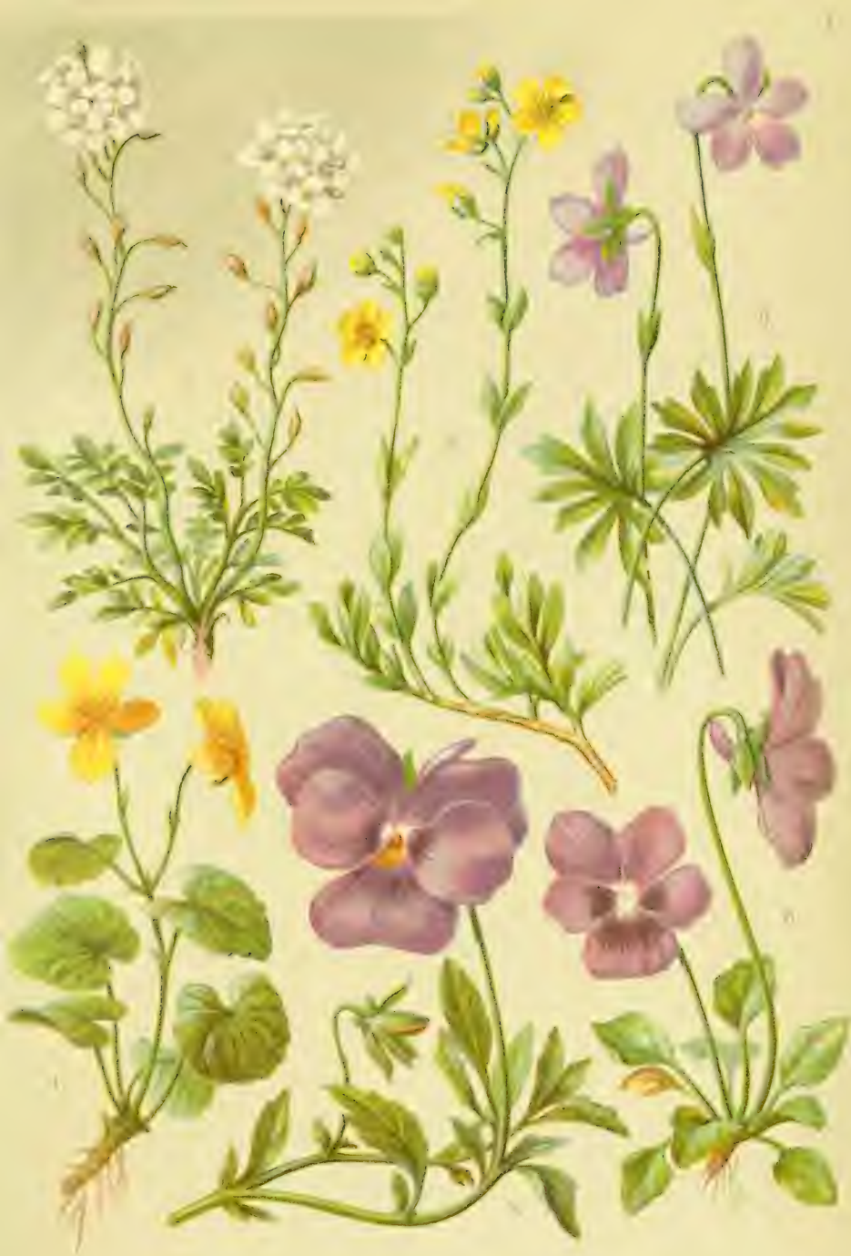
1. Hutchinsia alpina . 2. Helianthemum alpestre . 3. Viola pinnata . 4. Viola biflora . 5. Viola calcarata . 6. Viola alpina .