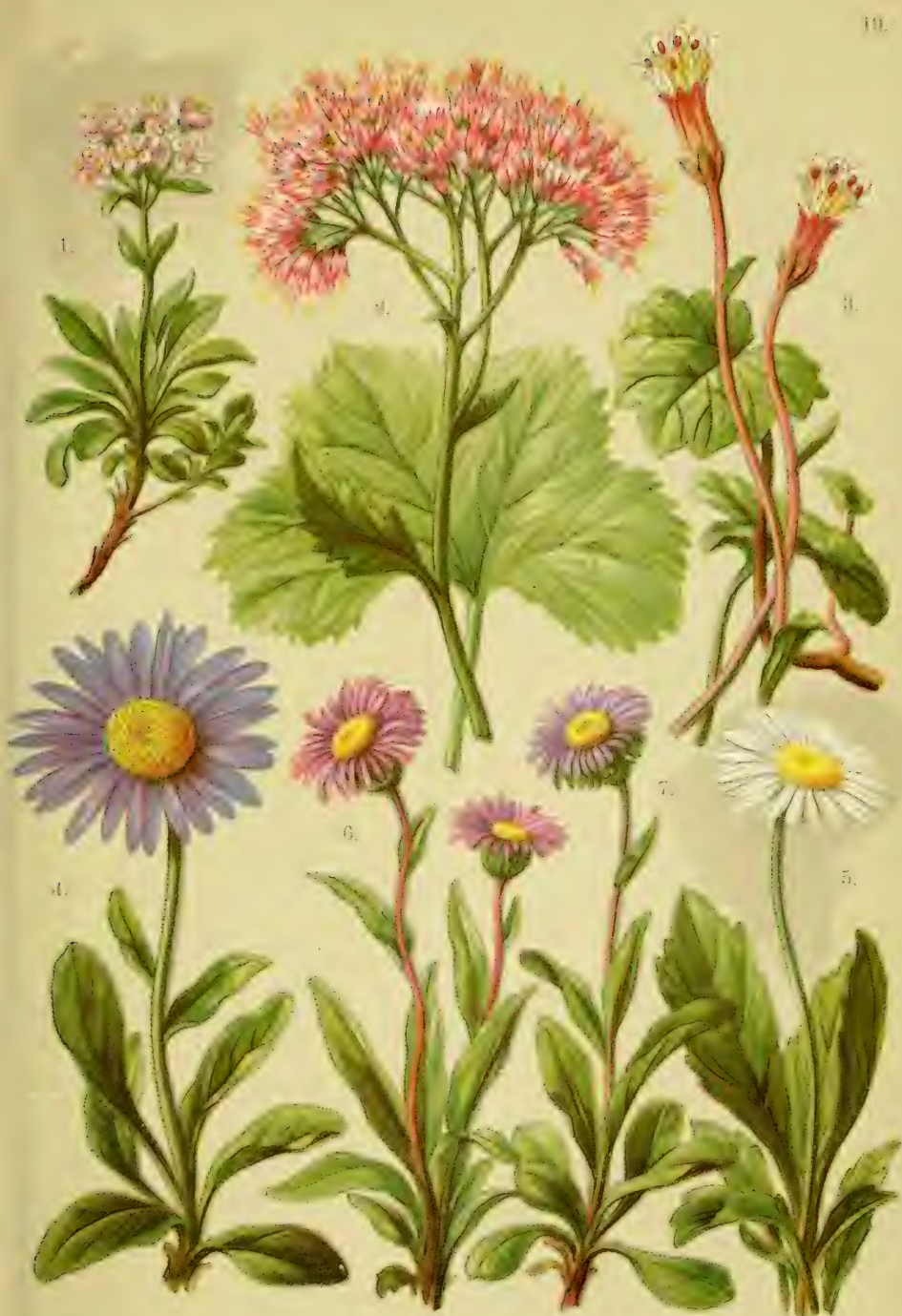
1. Valeriana supina. 2. Adenostyles alpina. 3. Homogyne alpina. 4. Aster alpinus. 5. Bellidiastrum Michellii. 6. Erigeron alpinus. 7. Erig. uniflorus.