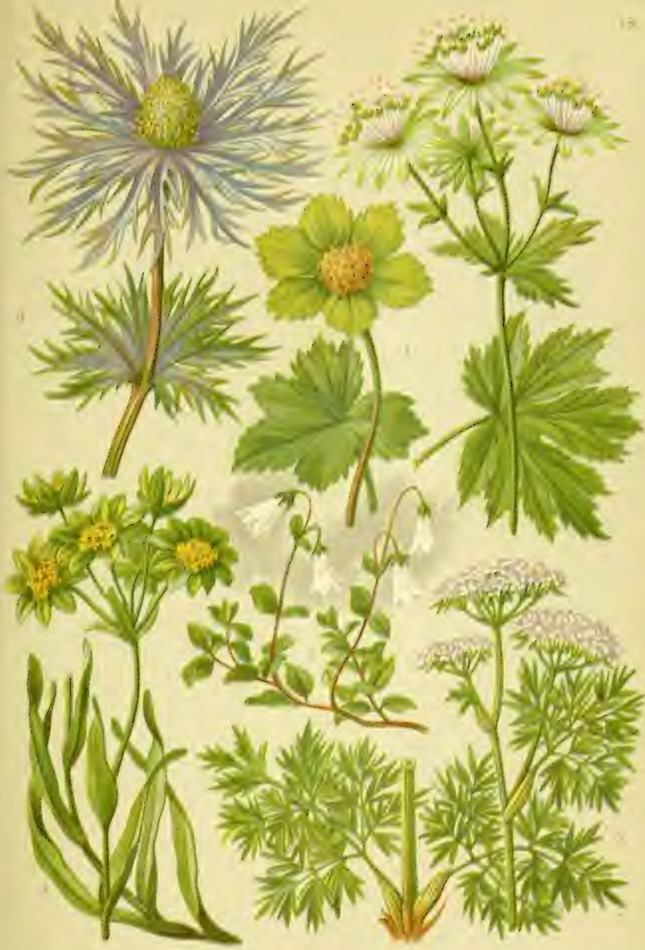
1. Hacquetia lychnis var. caerulea (L.) DC. 2. Prunella sp. 3. Malva sp. caerulea (L.) DC. 4. Malva sp. 5. Malva sp. 6. Malva sp.