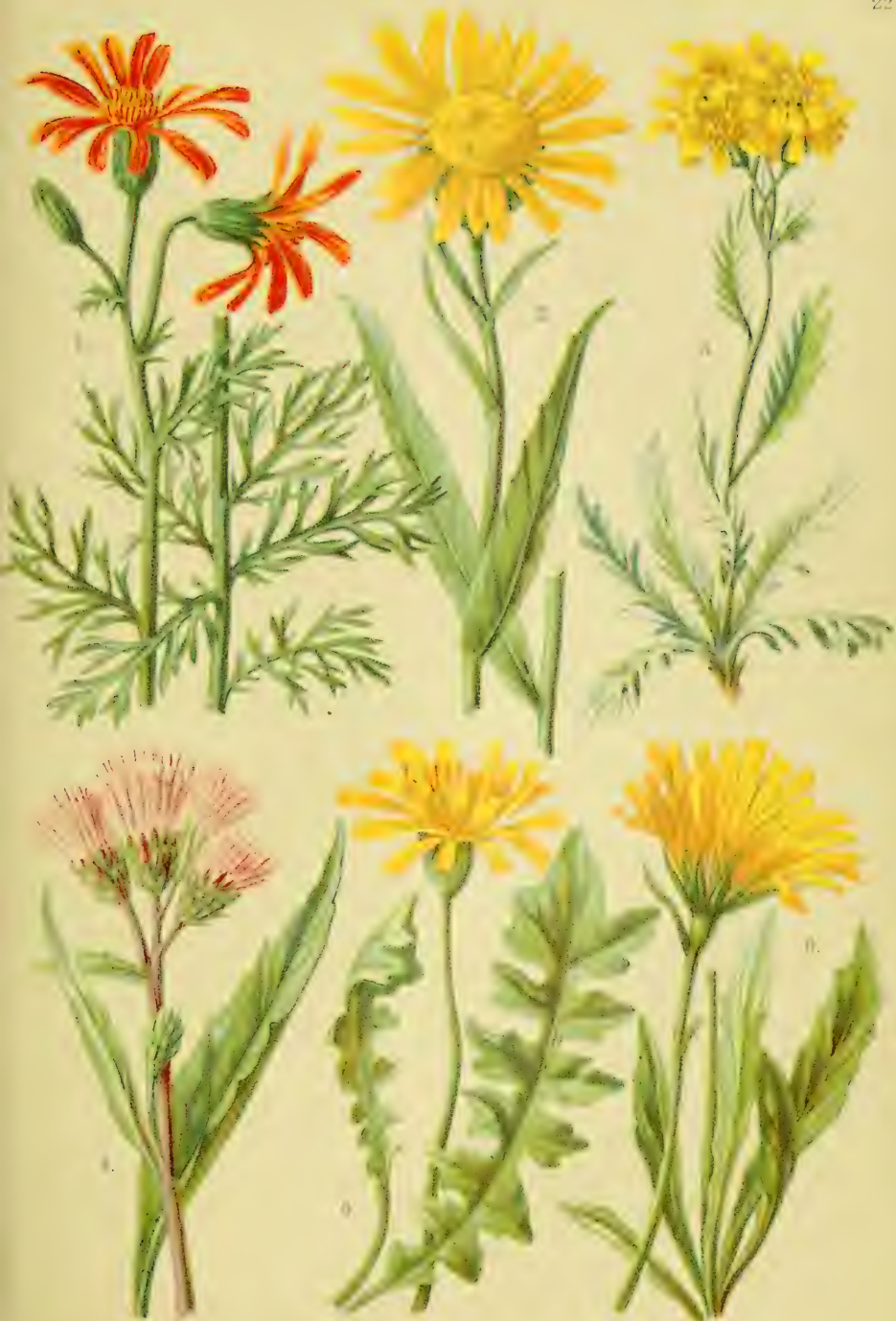
1. Senecio abrotanifolius . 2. Senecio Doronicum . 3. Senecio incanus . 4. Saussurea alpina . 5. Aposeris foetida . 6. Leontodon pyrenaicus .