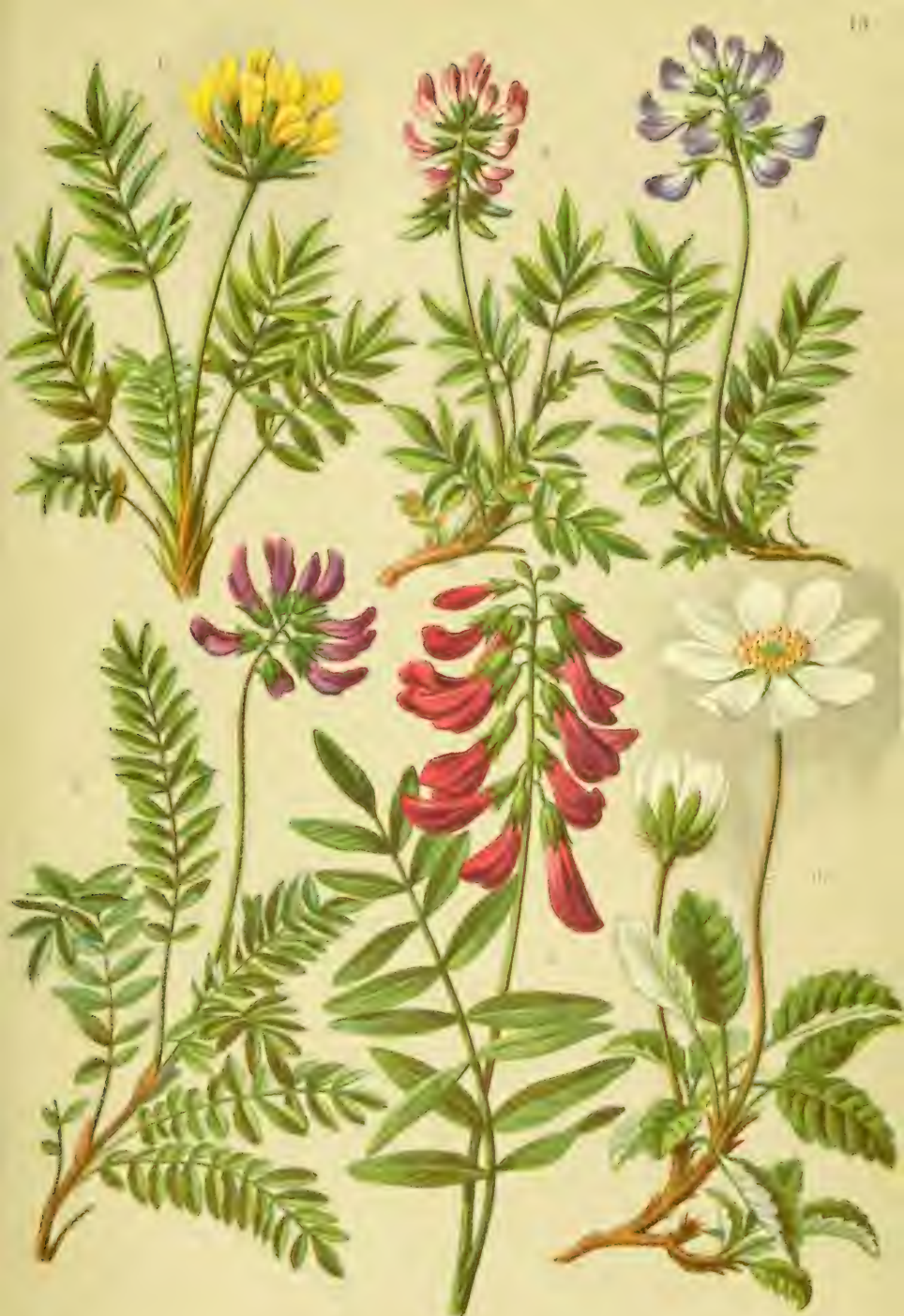
1. Oxytropis campestris . 2. Oxytr. montana . 3. Astragalus australis . 4. Astragalus alpinus . 5. Hedysarum obscurum . 6. Dryas octopetala .