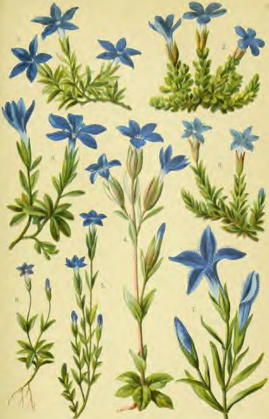
1. Gentiana pumila . 2. Gent. brachyphylla . 3. Gent. verna . 4. Gent. utriculosa . 5. Gent. nivalis . 6. Gent. prostrata . 7. Gent. ciliata . 8. Gent. nana .