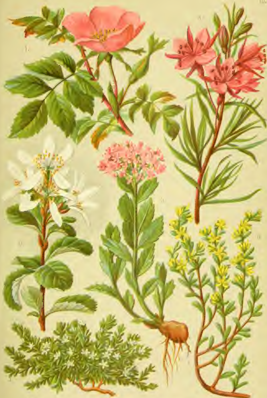
1. Rosa alba. 2. Crataegus oxyacantha. 3. Siphocampylus ciliolobus. 4. Herniaria arvensis. 5. Hieracium. 6. Satureja.