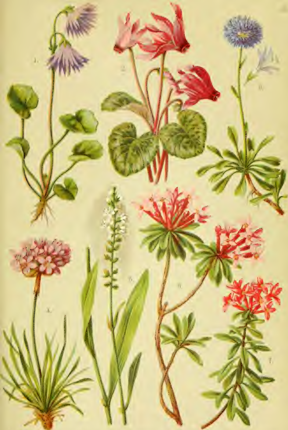
1. Soldanella alpina . 2. Fritularia rotundifolia . 3. Chionodoxa caerulea . 4. Anemone alpina . 5. Polygonum viviparum . 6. Daphne striata . 7. Daphne Cneorum .