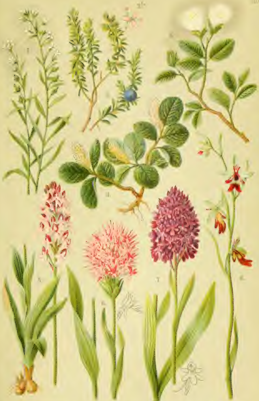
1. Thalictrum flavum . 2. Asperula cynosuroides . 3. Salix octandria . 4. Salix herbacea . 5. Galium saxatile . 6. Ophiopogon planifolius . 7. Anacamptis pyramidalis . 8. Cypripedium pubescens .