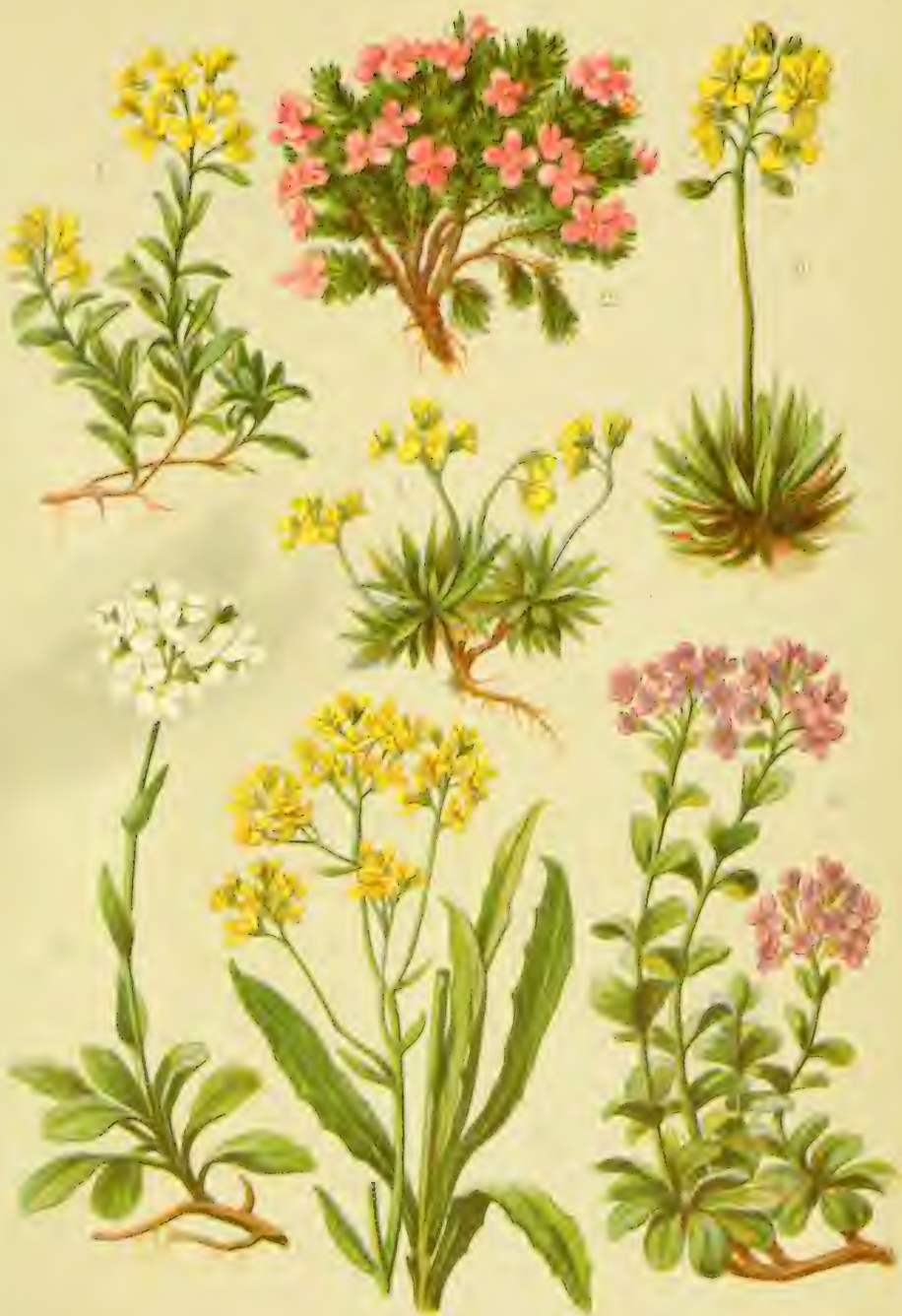
1. Alyssum Wulfenianum . 2. Petrocallis pyrenaica . 3. Draba aizoides . 4. Draba Hoppeana . 5. Thlaspi alpinum . 6. Thl. rotundifolium . 7. Biscutella laevigata .