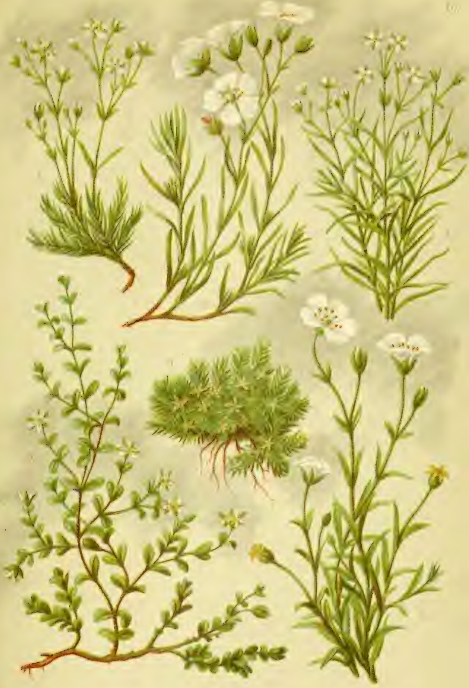
1. Alsine verna . 2. Alsine laricifolia . 3. Cherleria sedoides . 4. Mülhringia muscosa . 5. Arenaria biflora . 6. Arenaria grandiflora .