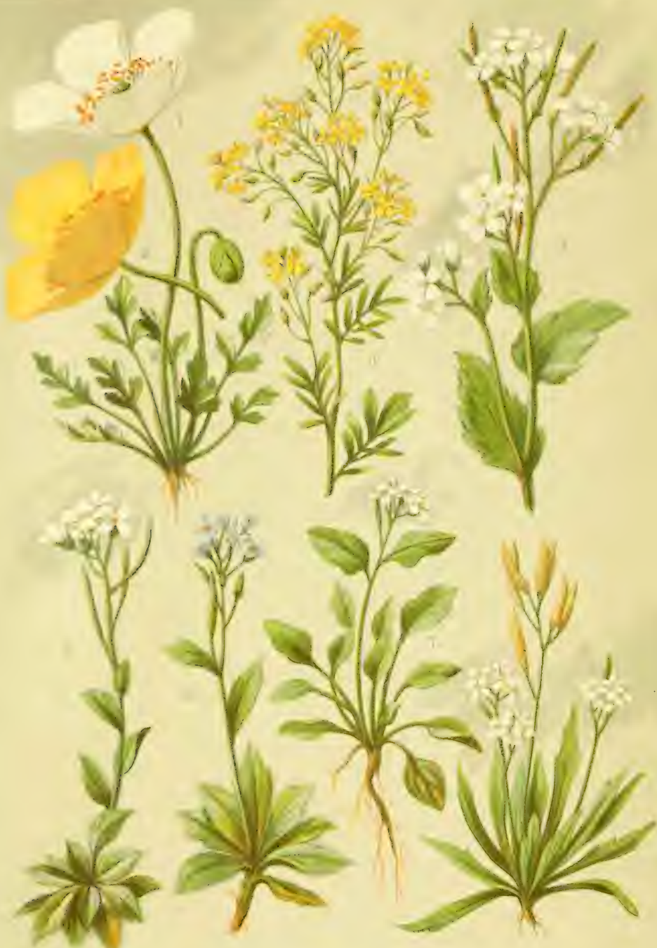
1. 2. Papaver alpinum . 3. Nasturtium pyrenaicum . 4. Arabis alpina . 5. Arabis coerulea . 6. Arabis pumila . 7. Cardamine alpina . 8. Braya alpina .