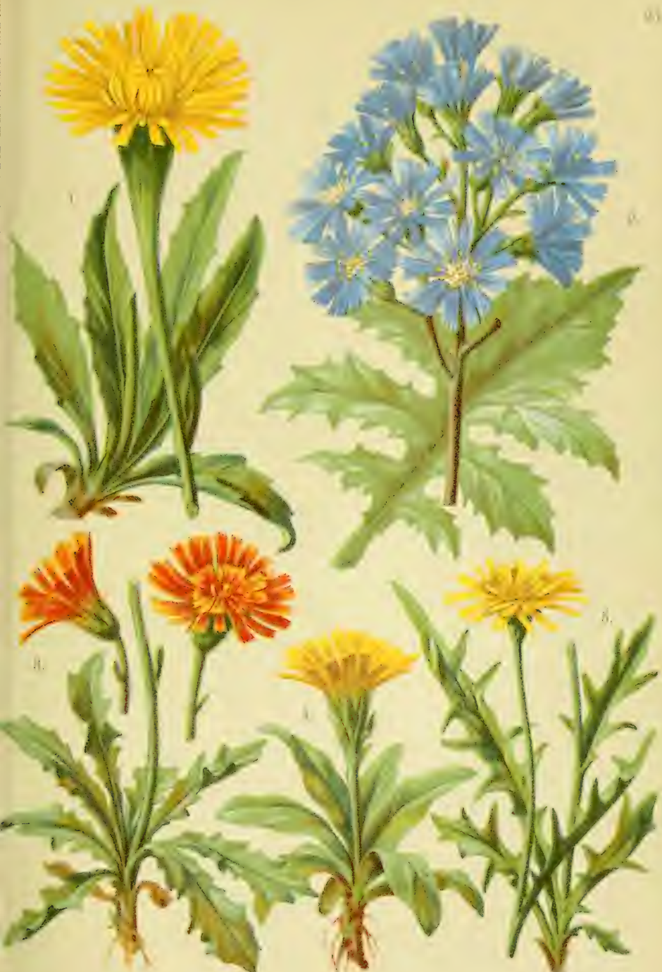
1. Hypochoeris uniflora . 2. Mulgedium alpinum . 3. Crepis aurea . 4. Crepis jubata . 5. Crepis alpestris .