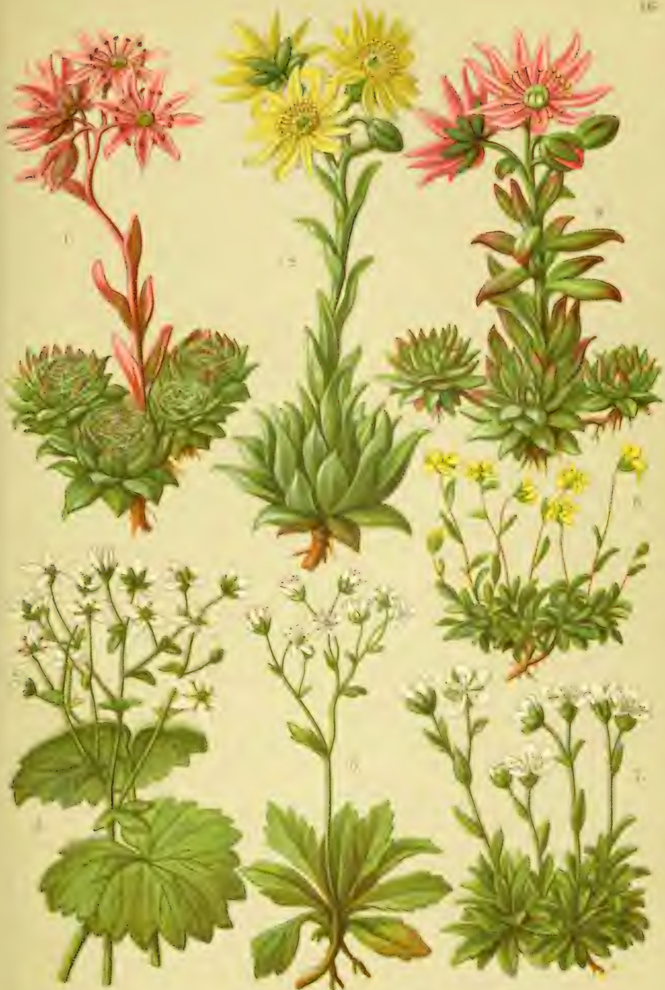
1. Sempervivum arachnoideum . 2. Semperv. Wulfeni . 3. Semperv. montanum . 4. Saxifraga rotundifolia . 5. Sax. stellaris . 6. Sax. Seguieri . 7. Sax. androsacea .