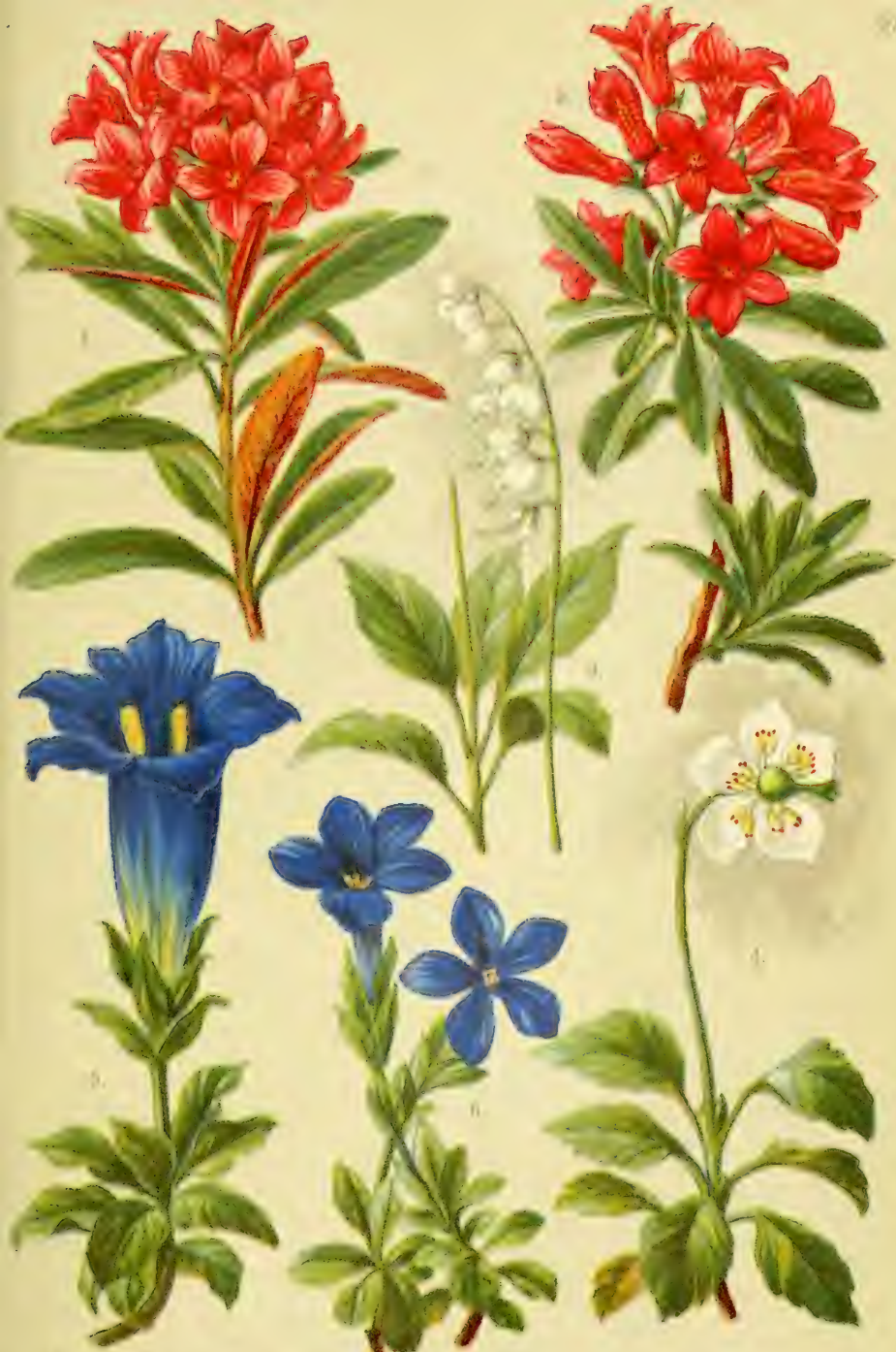
1. Rhododendron Treutlianae . 2. Rhodod. litsumii . 3. Dirca secundata . 4. Dirca pallida . 5. Gentiana aculeata . 6. Meriania javanica .