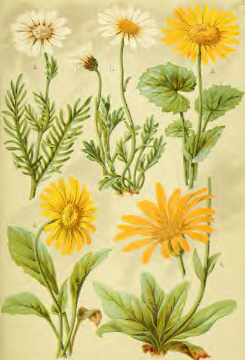
1. Elephantanthus apiculatus . 2. Antibem. pluma . 3. Dorsicum eriofolium . 4. Aronicum glaciale . 5. Arnica montana .