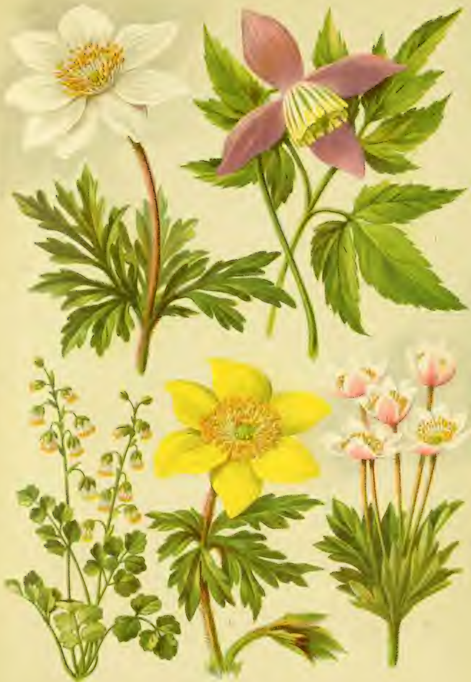
Ranunculus repens Ranunculus acris Ranunculus abortivus Ranunculus abortivus Ranunculus abortivus