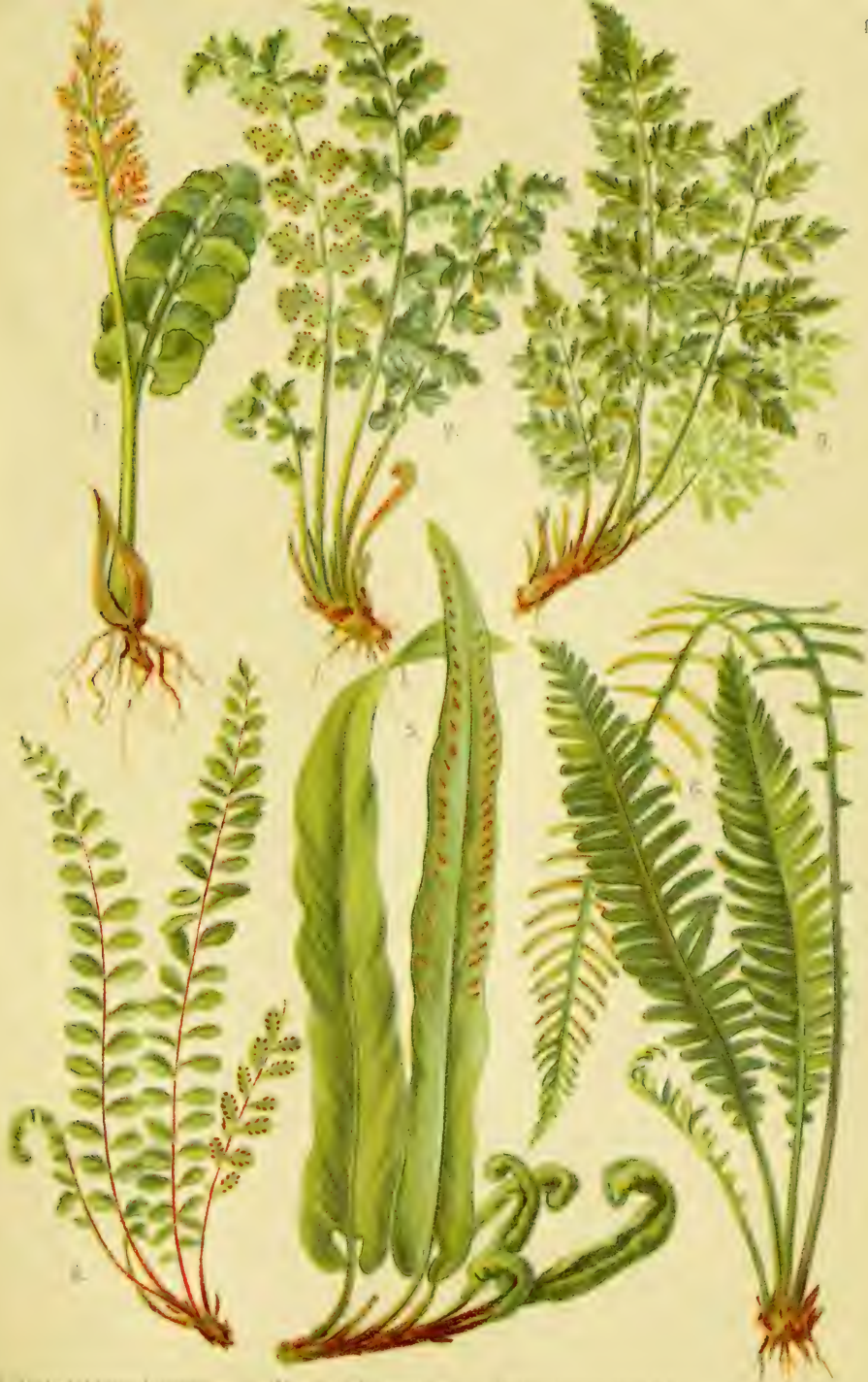
1. Adiantum lunatum . 2. Woodsia hyperborea . 3. Cystopteris alpinus . 4. Adiantum Trichomanes . 5. Scolopendrium vulgare . 6. Blechnum Spicant .