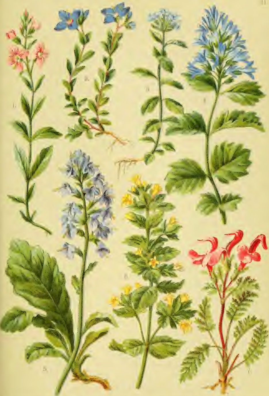
1. Veronica rotundifolia . 2. Veronica saxatilis . 3. Veronica nitens . 4. Puzosia Boissiana . 5. Wulfenia Carinthiaca . 6. Tozzia alpina . 7. Pedicularis rostrata .