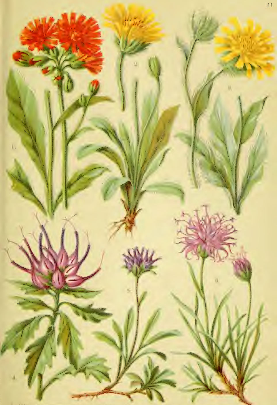
1. Helianthus scaberrimus . 2. Hier. alpinum . 3. Hier. villosum . 4. Phytolacca comosum . 5. Phyt. pauciflorum . 6. Phyt. hemisphaericum .