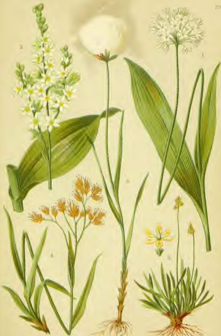
1. Allium victoriale . 2. Veratrum album . 3. Tofieldia borealis . 4. Luzula lutea . 5. Eriophorum Scheuchzeri .