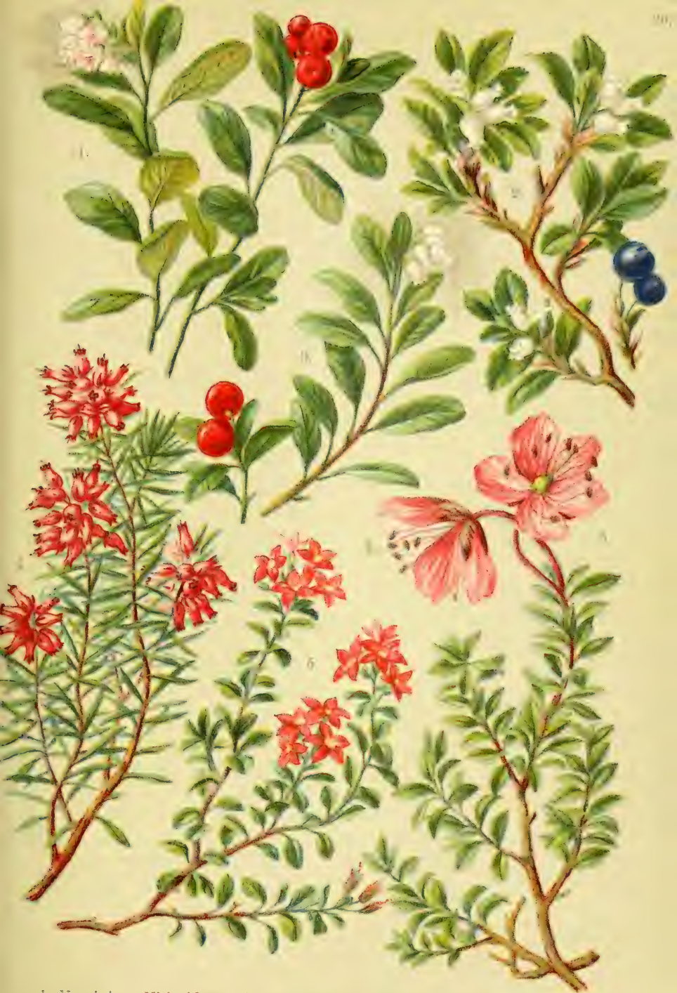
1. Vaccinium Vitis idaea . 2. Arctostaphylos alpina . 3. Arctost. Uva ursi . 4. Erica carnea . 5. Azalea procumbens . 6. Rhododendron Chamacacistus