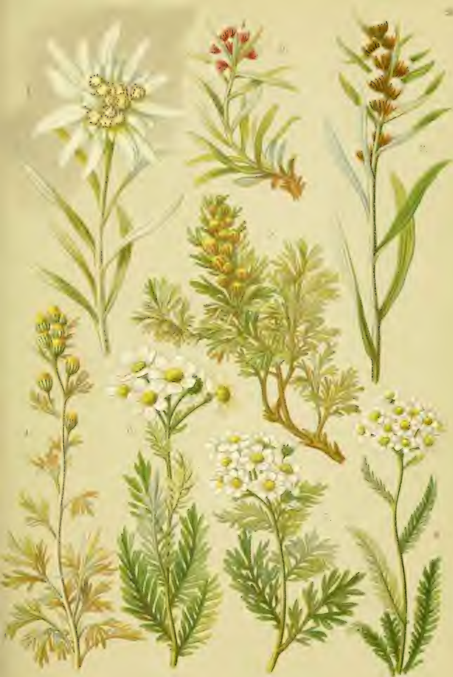
1. Gnaphalium Leontopodium . 2. Gnaph. supinum . 3. Gnaph. norvegicum . 4. Artemisia Mutellina . 5. Art. spicata . 6. Achillea moschata . 7. Ach. atrata . 8. Ach. nana .