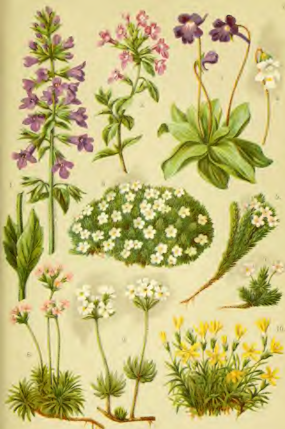
1. Horminum pyrenaicum . 2. Calamintha alpina . 3. Pinguicula vulgaris . 4. Dianthus alpinus . 5. Androsace italica . 6. Andros. bellidifolia . 7. Andros. glacialis . 8. Andros. carnea . 9. Andros. villosa . 10. Aretia Vitaliana .