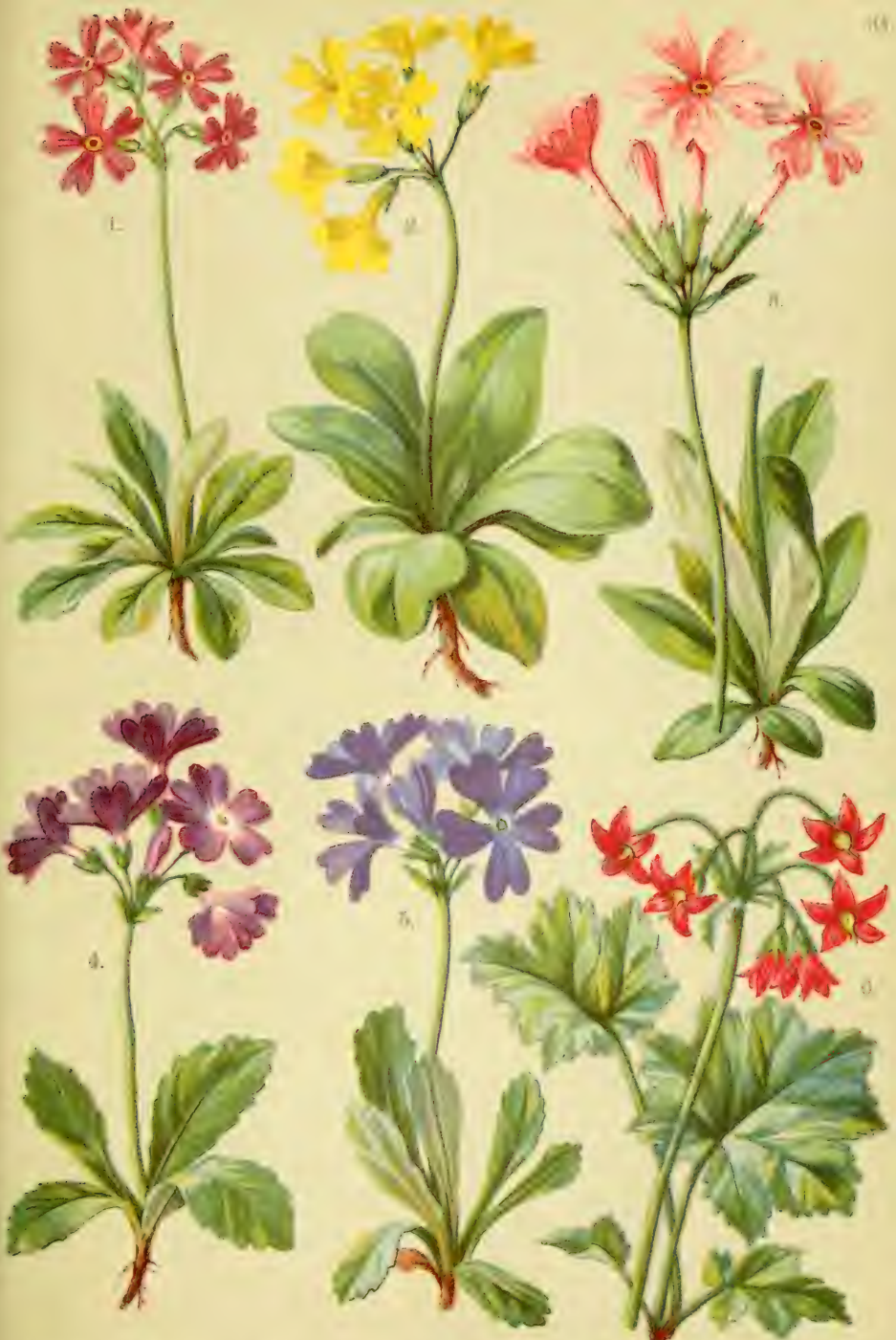
1. Primula farinosa . 2. Primula auricula . 3. Primula angustiflora . 4. Primula villosa . 5. Primula glutinosa . 6. Cortusa Matthioli .