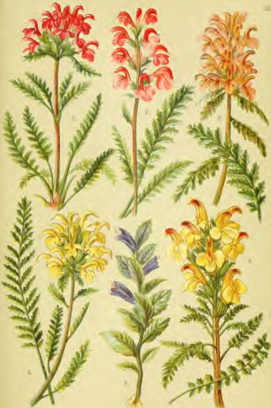
1. Pedicularis verticillata 2. Pedic. incarnata . 3. Pedic. recutita 4. Pedic. tuberosa . 5. Pedic. versicolor . 6. Bartsia alpina .