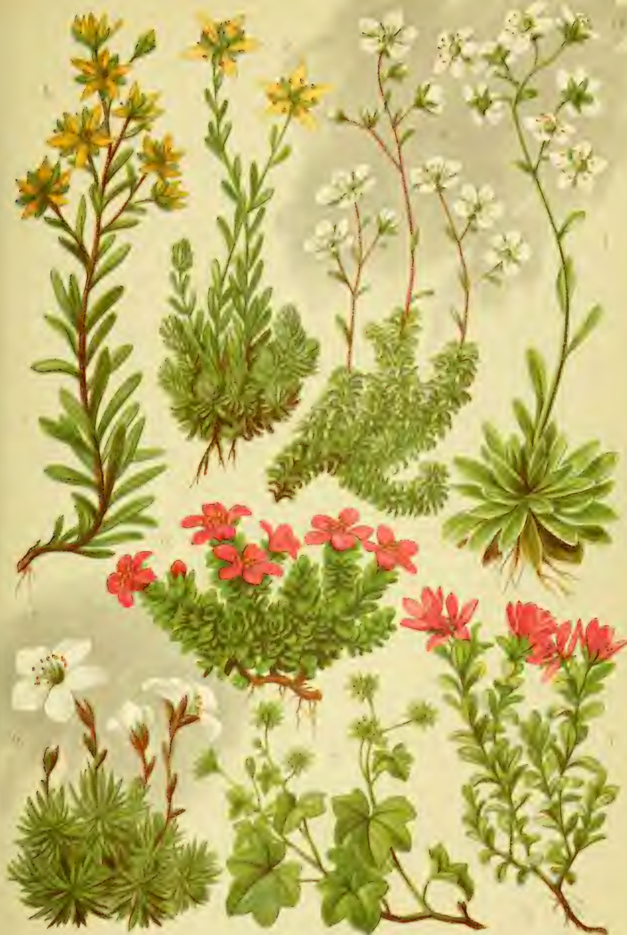
C. subulnifolia 1. C. subulnifolia 2. C. subulnifolia 3. C. subulnifolia 4. C. subulnifolia 5. C. subulnifolia 6. C. subulnifolia 7. C. subulnifolia 8. C. subulnifolia 9. C. subulnifolia 10. C. subulnifolia 11. C. subulnifolia 12. C. subulnifolia 13. C. subulnifolia 14. C. subulnifolia 15. C. subulnifolia 16. C. subulnifolia 17. C. subulnifolia 18. C. subulnifolia 19. C. subulnifolia 20. C. subulnifolia 21. C. subulnifolia 22. C. subulnifolia 23. C. subulnifolia 24. C. subulnifolia 25. C. subulnifolia 26. C. subulnifolia 27. C. subulnifolia 28. C. subulnifolia 29. C. subulnifolia 30. C. subulnifolia 31. C. subulnifolia 32. C. subulnifolia 33. C. subulnifolia 34. C. subulnifolia 35. C. subulnifolia 36. C. subulnifolia 37. C. subulnifolia 38. C. subulnifolia 39. C. subulnifolia 40. C. subulnifolia 41. C. subulnifolia 42. C. subulnifolia 43. C. subulnifolia 44. C. subulnifolia 45. C. subulnifolia 46. C. subulnifolia 47. C. subulnifolia 48. C. subulnifolia 49. C. subulnifolia 50. C. subulnifolia 51. C. subulnifolia 52. C. subulnifolia 53. C. subulnifolia 54. C. subulnifolia 55. C. subulnifolia 56. C. subulnifolia 57. C. subulnifolia 58. C. subulnifolia 59. C. subulnifolia 60. C. subulnifolia 61. C. subulnifolia 62. C. subulnifolia 63. C. subulnifolia 64. C. subulnifolia 65. C. subulnifolia 66. C. subulnifolia 67. C. subulnifolia 68. C. subulnifolia 69. C. subulnifolia 70. C. subulnifolia 71. C. subulnifolia 72. C. subulnifolia 73. C. subulnifolia 74. C. subulnifolia 75. C. subulnifolia 76. C. subulnifolia 77. C. subulnifolia 78. C. subulnifolia 79. C. subulnifolia 80. C. subulnifolia 81. C. subulnifolia 82. C. subulnifolia 83. C. subulnifolia 84. C. subulnifolia 85. C. subulnifolia 86. C. subulnifolia 87. C. subulnifolia 88. C. subulnifolia 89. C. subulnifolia 90. C. subulnifolia 91. C. subulnifolia 92. C. subulnifolia 93. C. subulnifolia 94. C. subulnifolia 95. C. subulnifolia 96. C. subulnifolia 97. C. subulnifolia 98. C. subulnifolia 99. C. subulnifolia 100.