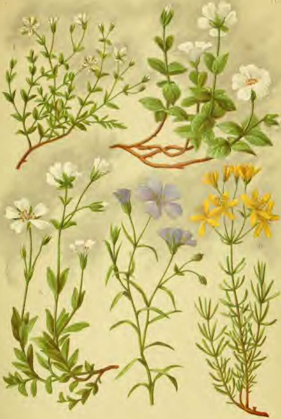
1. Arenaria ciliata . 2. Cerastium latifolium . 3. Cerastium alpinum 4. Linum alpinum . 5. Hypericum Coris .