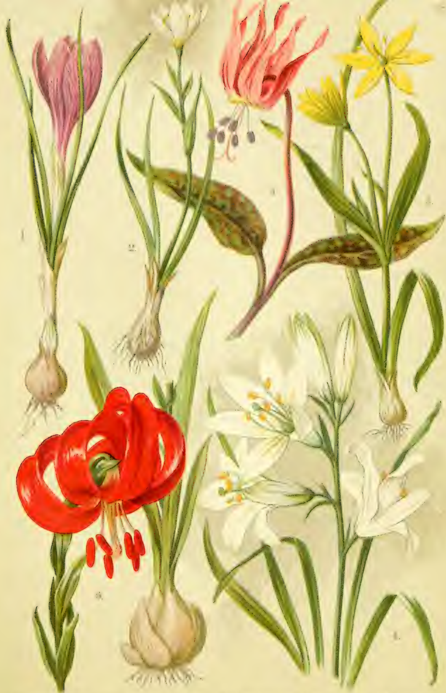
1. Convallaria majolica . 2. Lilium auratum . 3. Pyrolis elatior . 4. Pulsatilla nuttalliana . 5. Gagea Liotardi . 6. Lilium Carniolicum .