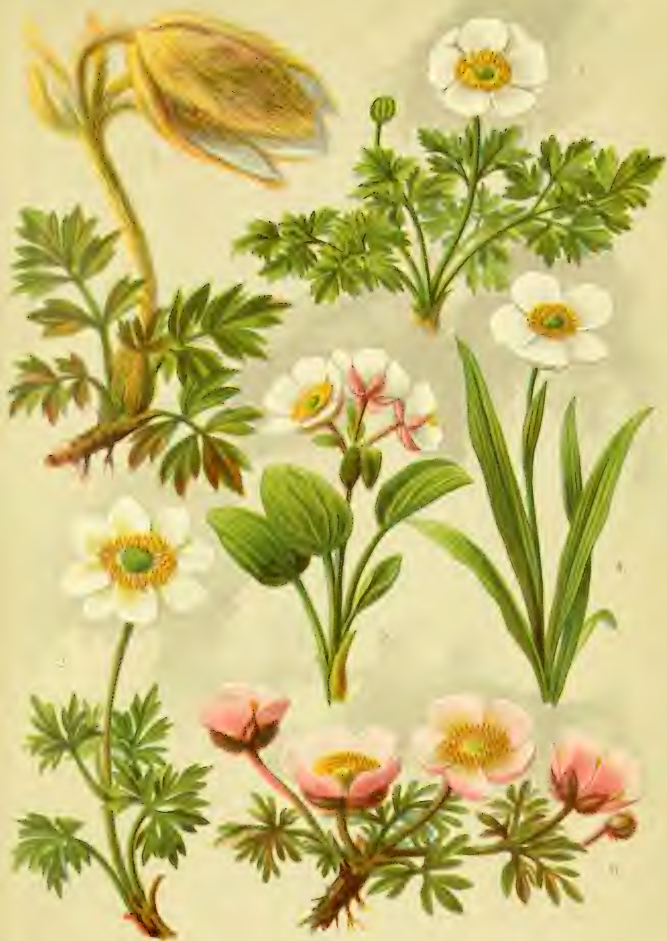
1. Anemone vernalis. 2. Anemone baldensis. 3. Ranunculus rutaefolius. 4. Ranunculus pyrenaicus. 5. Ranunculus parnassifolius. 6. Anemone montana.