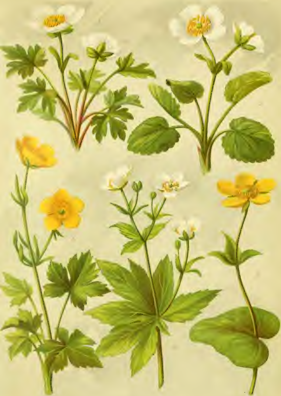
1. Ranunculus alpestris . 2. Ranunculus crenatus . 3. Ranunculus acris .