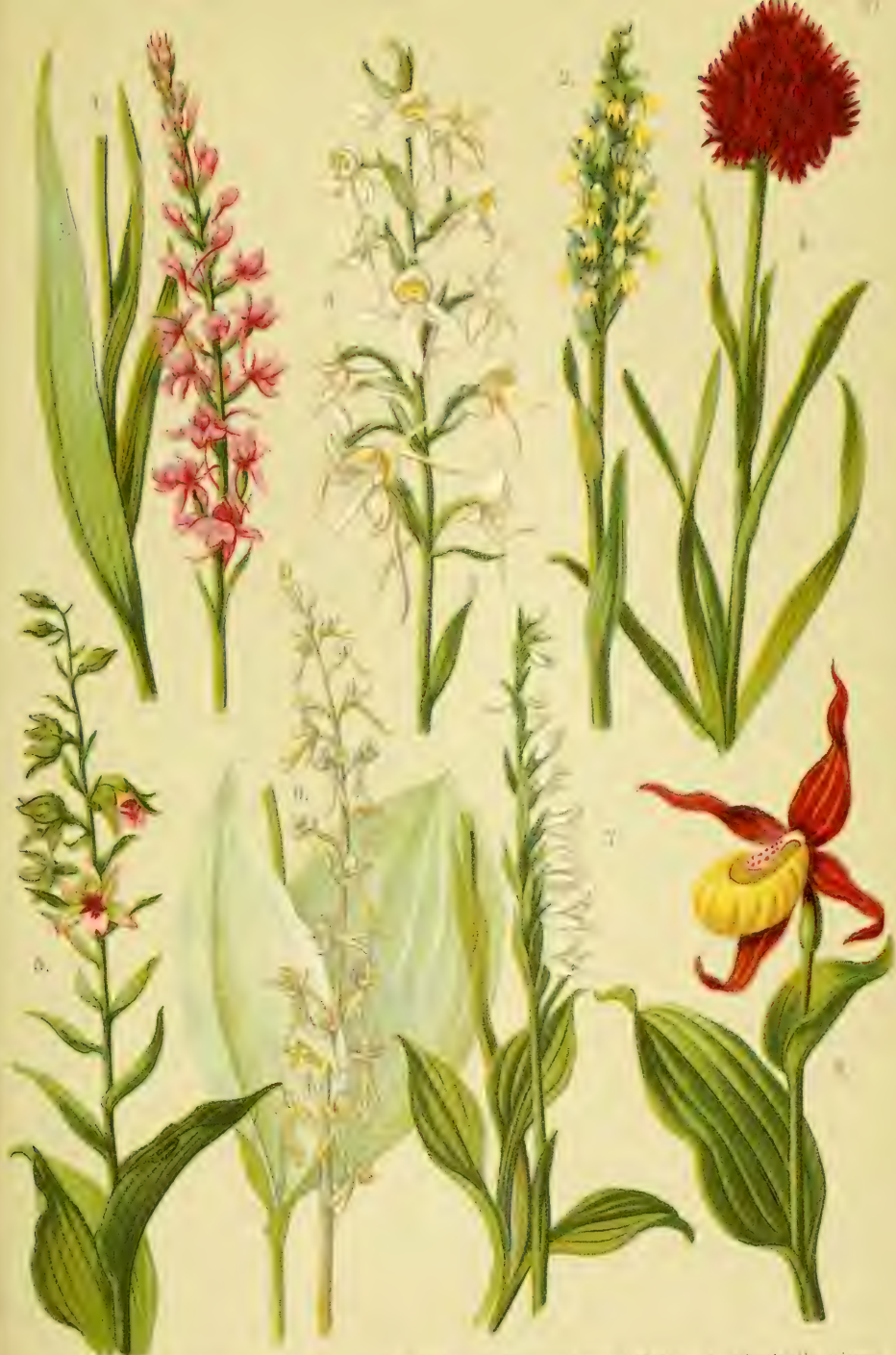
1. Ceratanthes pinnatifida . 2. Stemodia siliqua . 3. Thamnochloa siliqua . 4. Stemodia siliqua . 5. Epipactis atrorubra . 6. Listera ovata . 7. Stemodia siliqua . 8. Cypripedium pubescens .