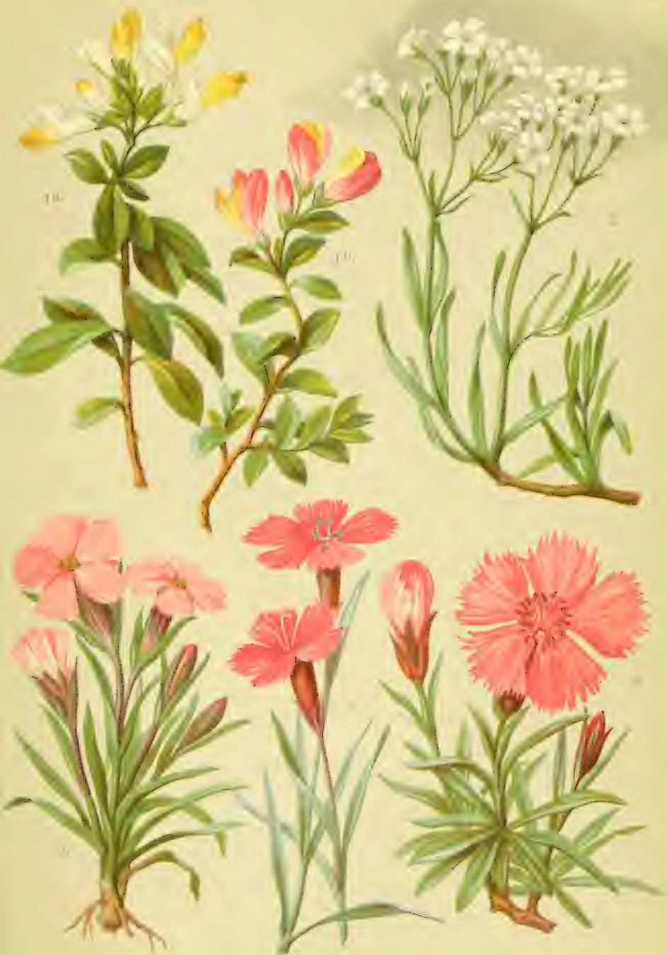
1 a. b. Polygala Chamaebuxus . 2. Gypsophila repens . 3. Dianthus alpinus . 4. Dianthus silvestris . 5. Dianthus glacialis .