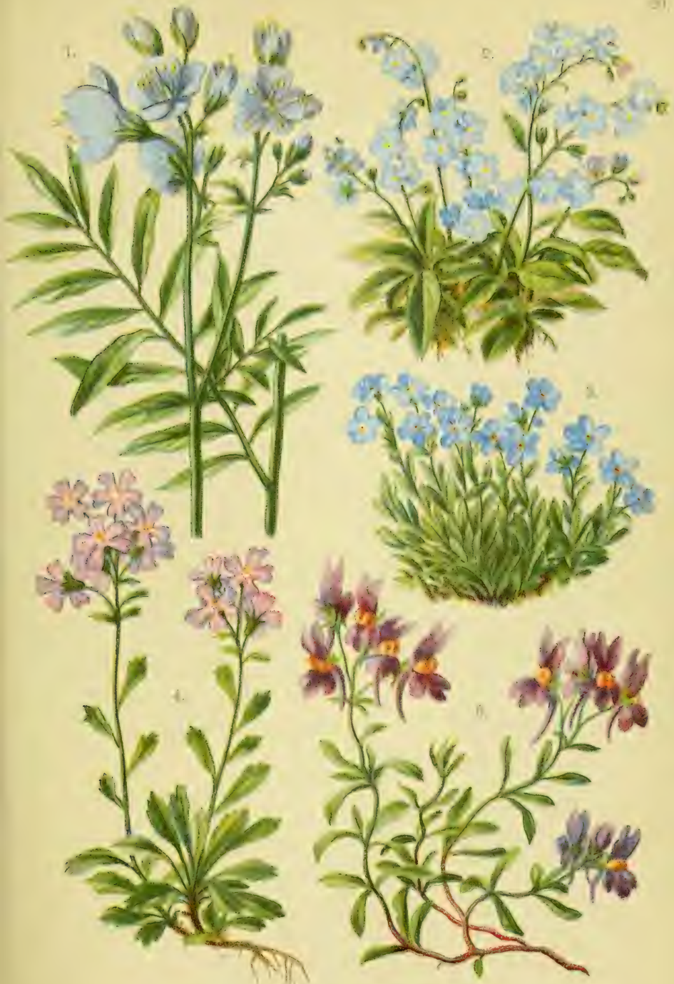
1. Polemonium coeruleum . 2. Myosotis alpestris . 3. Eritrichium nanum . 4. Erinus alpinus . 5. Linaria alpina .