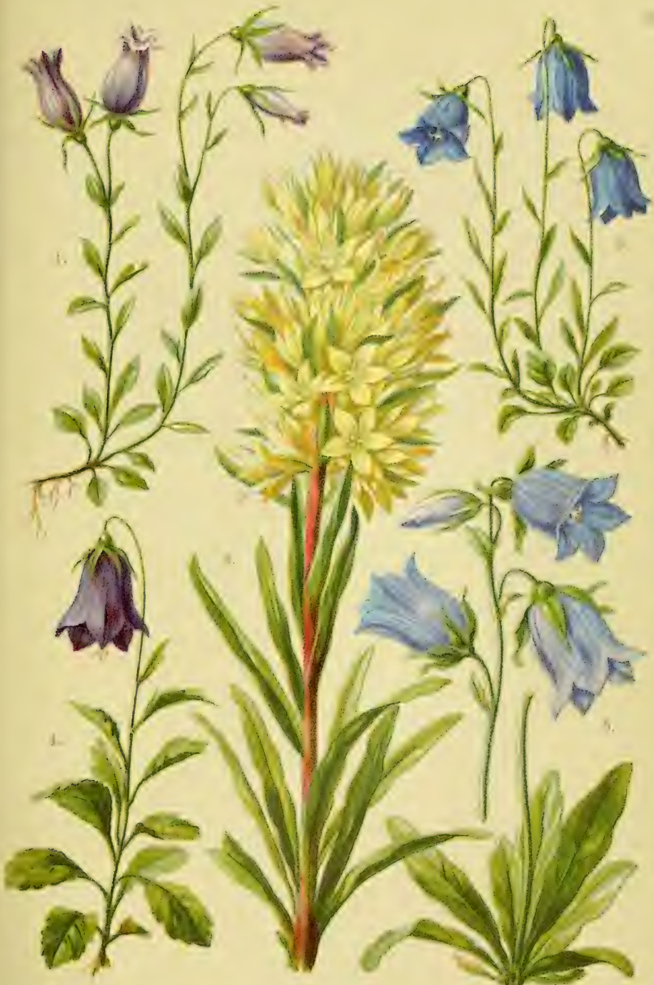
1. Campanula Zoysii . 2. Camp. thyrsoides . 3. Camp. pusilla . 4. Camp. pulla . 5. Camp. barbata .