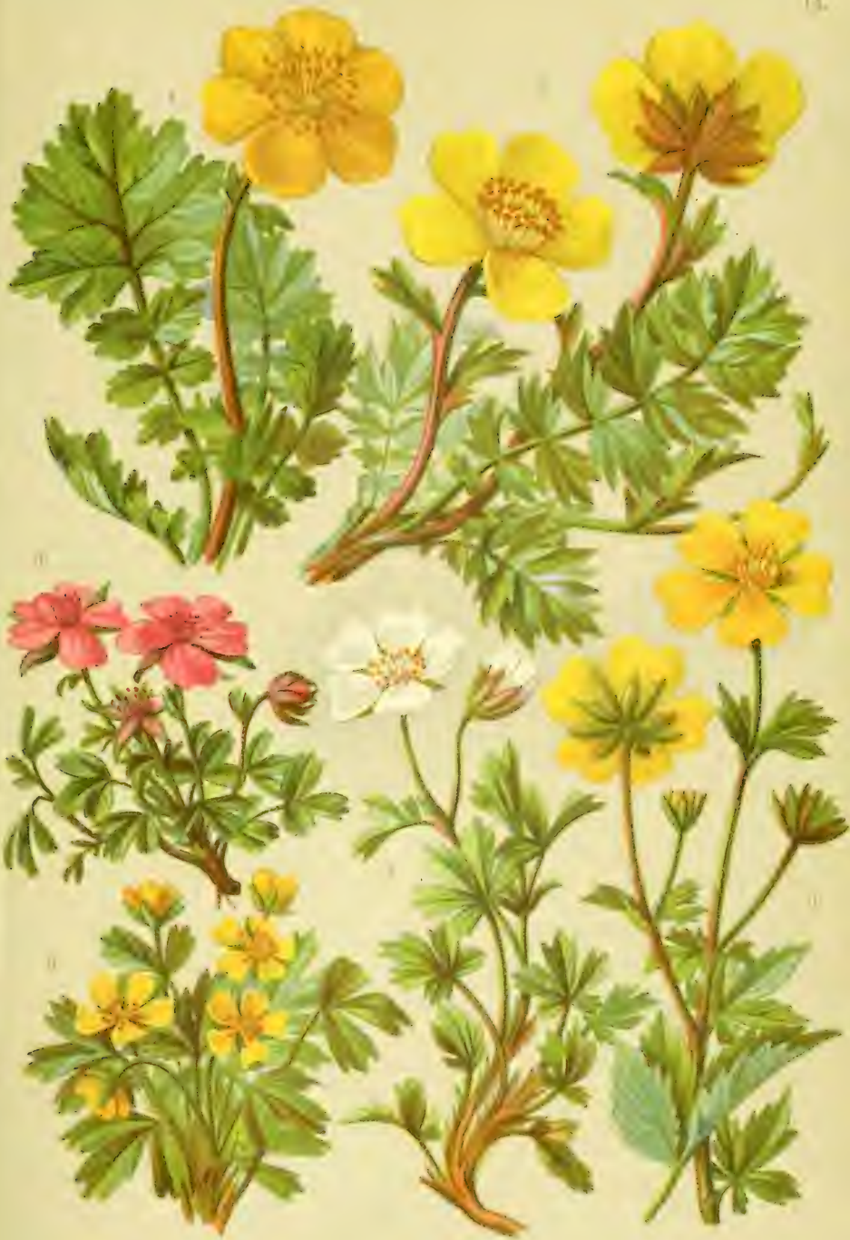
1. Geum montanum. 2. Geum reptans. 3. Potentilla nitida. 4. Potent. Clusiana. 5. Potent. grandiflora. 6. Potent. frigida.