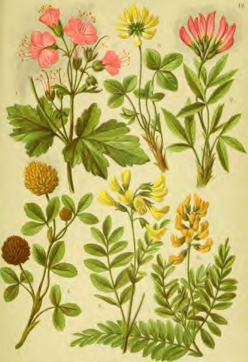
1. Geranium macrorrhizum . 2. Trifolium alpinum . 3. Trifolium pallescens . 4. Trifolium badium . 5. Phaca frigida . 6. Phaca alpina .