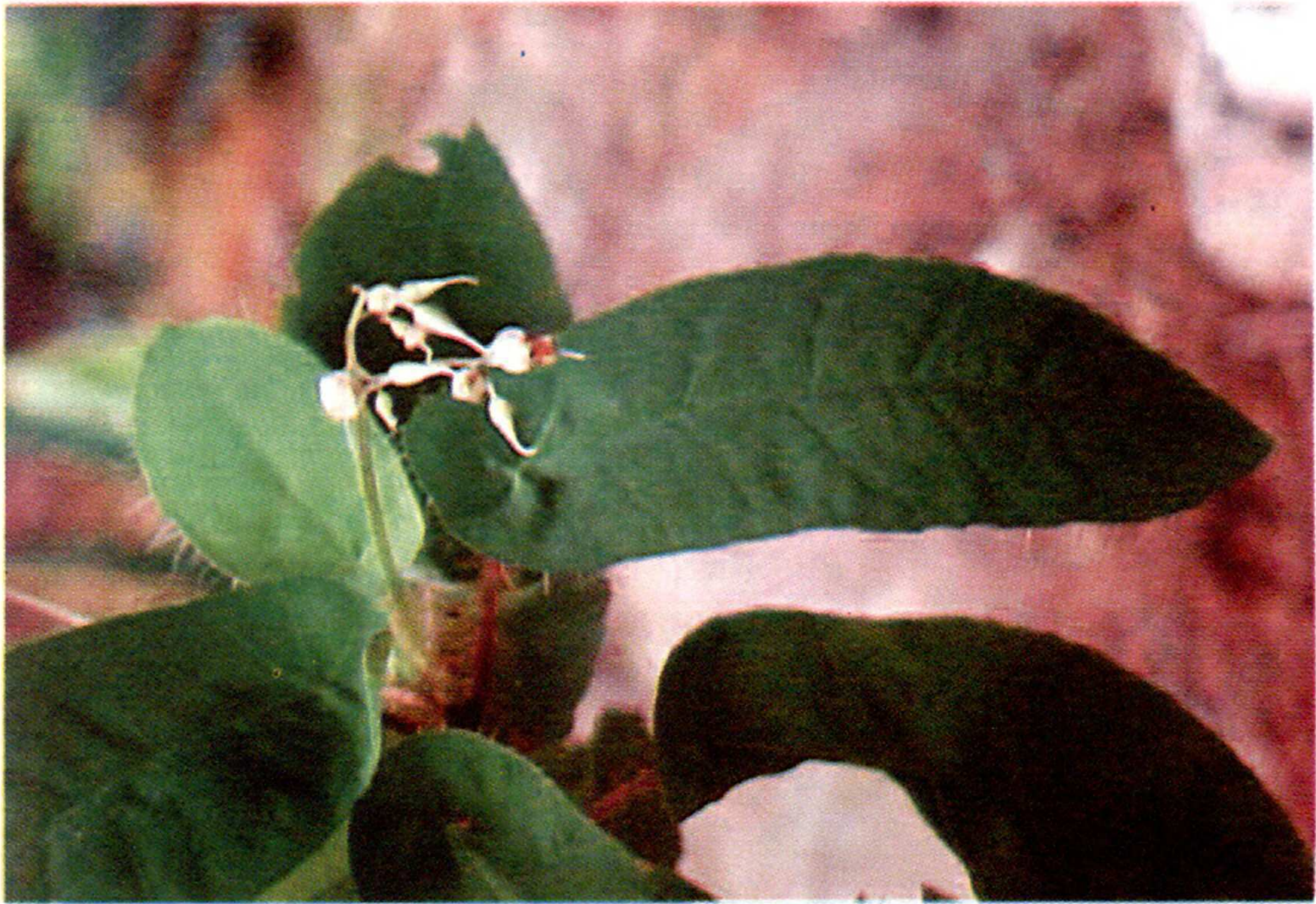
Fig. 3. Alloneuron ronliesneri B. Walln. (Melastomataceae)