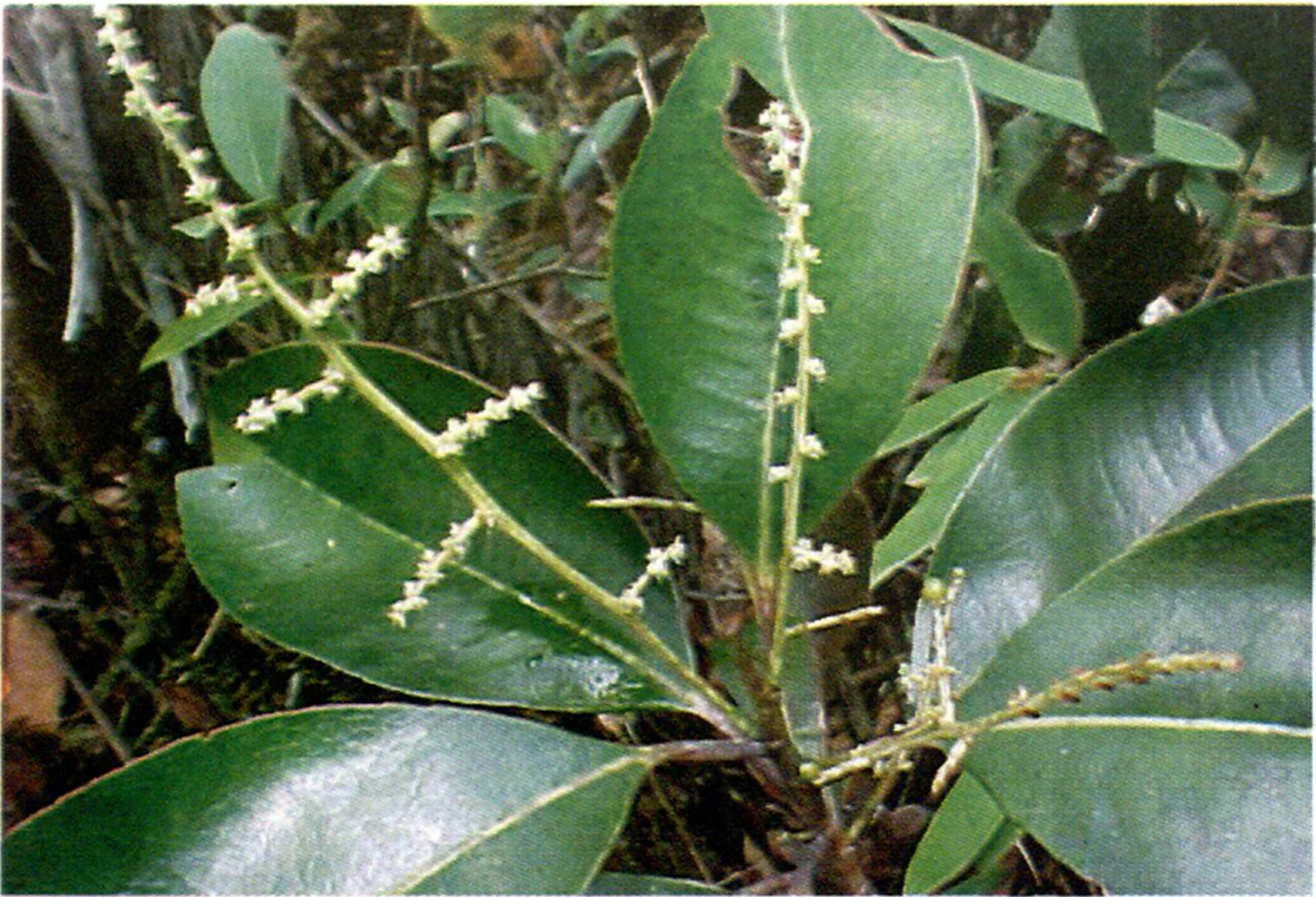
Fig. 1. Euceraea nitida C. Mart. (Flacuortiaceae)