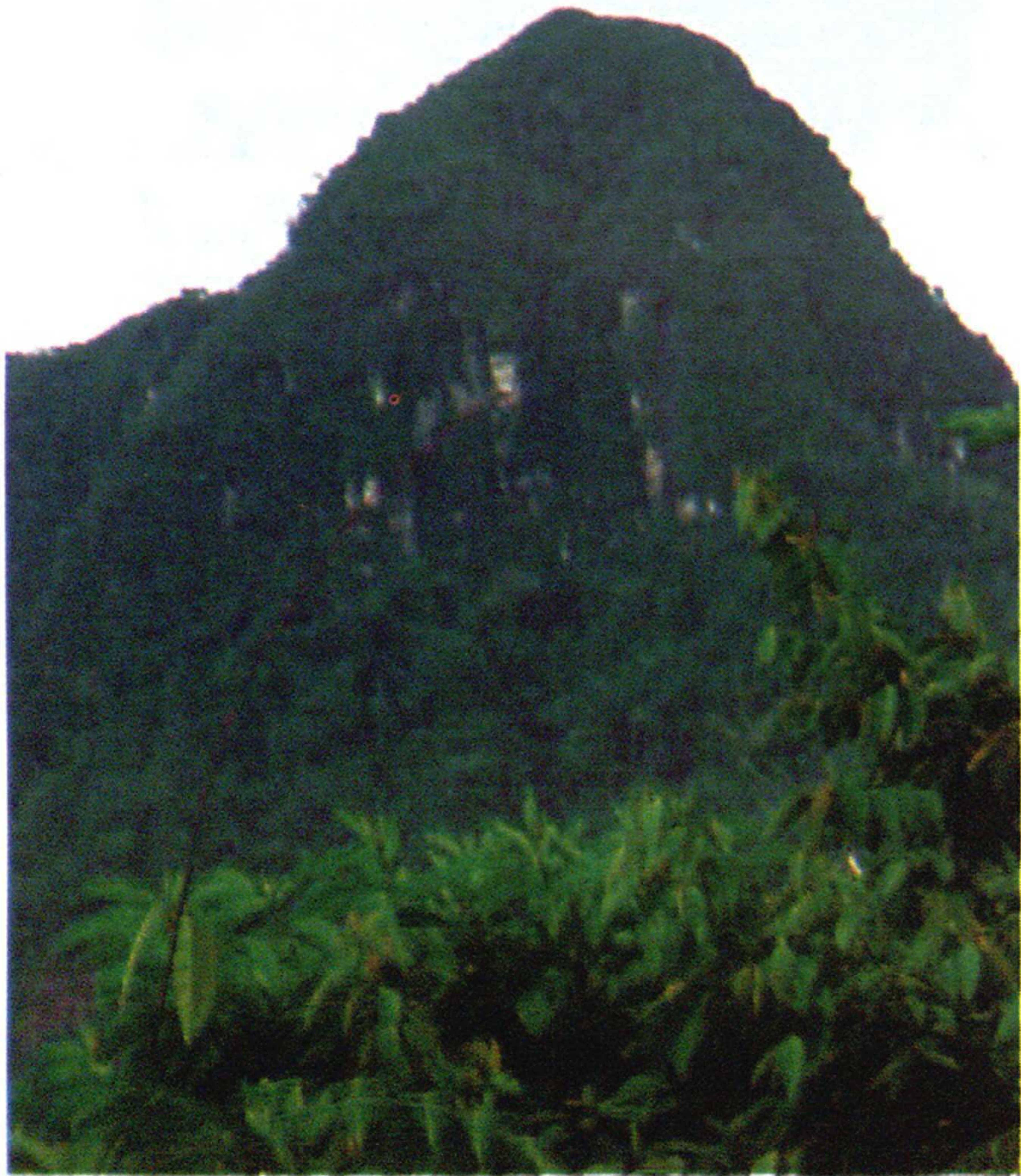
Fig. 5. Tayu-mujaji, considerado como un centro de endemismos y disyunción .