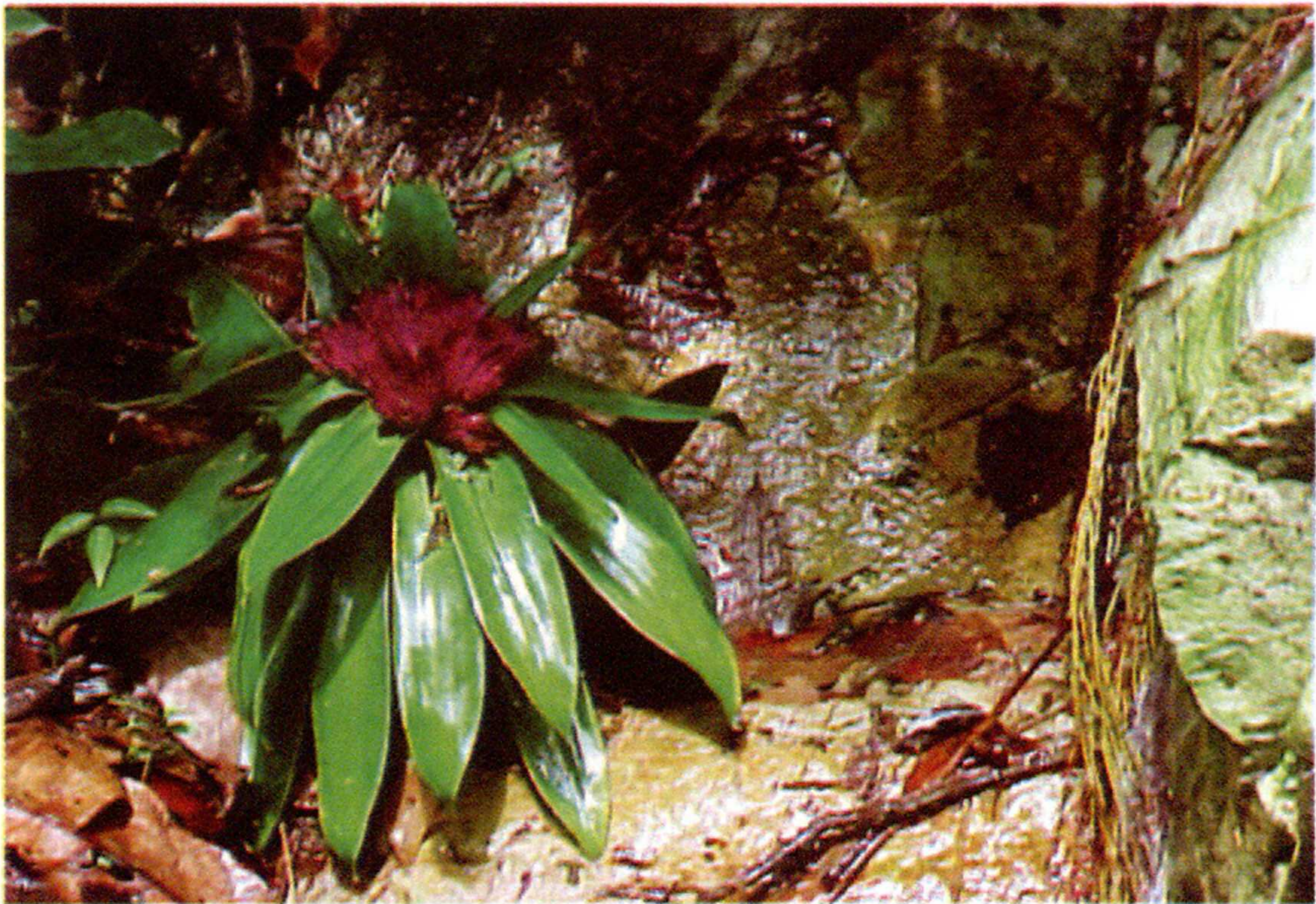
Fig. 4. Aratitiyopea lopezii (L.B. Smith) Steyerl. & P.E. Berry (Xyridaceae)