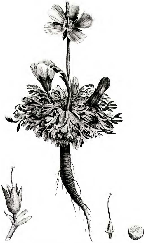
FIG. 3. Nototriche phyllanthos , original publicado como Sida pichinchensis en Plantas aequinoctiales v. 2 (Humboldt y Bonpland, 1813, pl. 116).