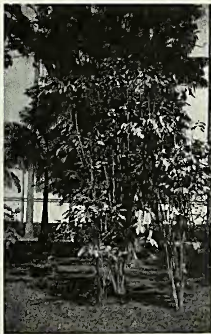
Foto 4 Coffea arabica L.