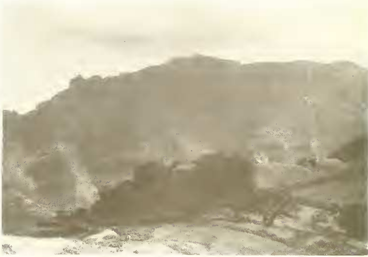
Abb. 18. Kirchenhain von Sabra Mariam (3400 m) aus Hagenia abyssinica ; hinten die Nordwände des Wäynobar (4472 m).