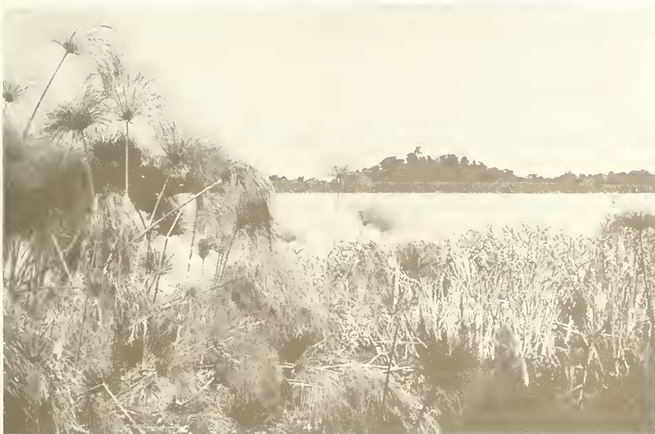
Abb. 4. Blick von der Halbinsel Shimbet Michael zum Kirchenhügel von Sesela Abo; links vorne Cyperus papyrus , ebenso am jenseitigen Ufer der Bucht vor dem Hügel.

Die Ufervegetation des Tana-Sees wird besonders in den Buchten von einem Gürtel von Cyperus papyrus gebildet (Abb. 4). Sein Boden ist gewöhnlich schlammig und auch in der Trockenzeit noch feucht oder überschwemmt. In Lücken des Papyrus -Sumpfes wachsen einige hohe Gräser ( Pennisetum giganteum , Echinochloa stagnina ), Commelina nudiflora , Alternanthera sessilis und andere Cyperus -Arten.