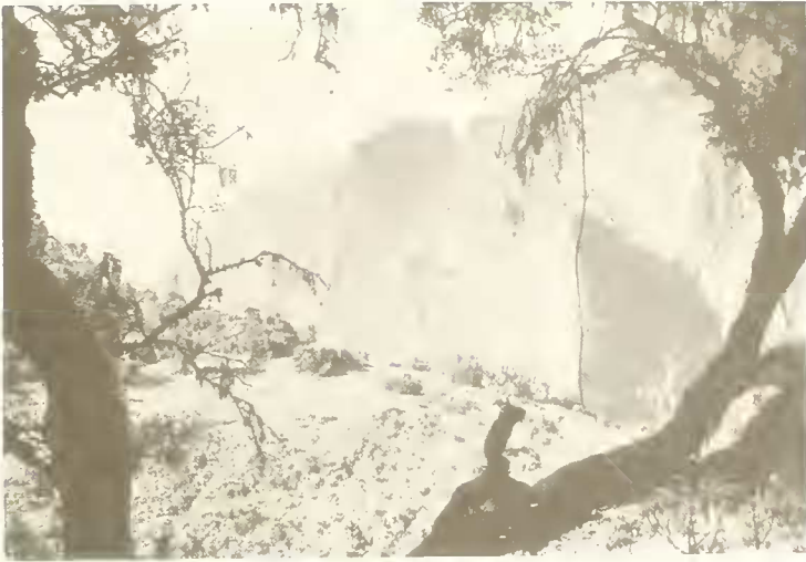
Abb. 11. Die tiefe Felsenschlucht des Marons-Baches bei dem Dorf Geechie; vorne Erica arborea mit Bartflechten ( Usnea ) behangen. Dieses Bild schließt ungefähr an das vorige nach rechts an.