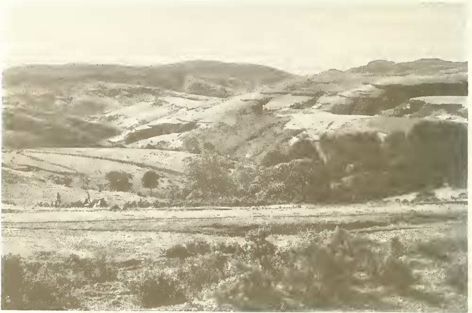
Abb. 9. Blick von Mildekapsa Mariam (3150 m) über die Hochfläche von Woggera nach Süden; vorne Gebirgssavanne mit Hypericum lanceolatum , Mitte Kirchenhain aus Hagenia abyssinica und Juniperus procera ; das Tal im Hintergrund entwässert zum Bälägäs.