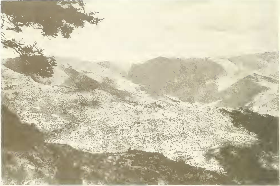
Abb. 22. Hangsavannen im Bälägäs-Tal beim Aufstieg von Schoada (2150 m) nach Baritta (3030 m); links oben Zweige von Acacia abyssinica ; ganz im Hintergrund ist auf der rechten Bildhälfte der Höhenrücken bei dem Dorf Geechie mit dem Emiet Gogo (3933 m) zu sehen, hinter dem die Steilhänge und Felswände zum nördlichen Vorland Semyens abfallen; in der Mitte ist am Horizont die Gegend des Sankaber-Passes zu suchen.

africana , Rumex nervosus , Nepeta ballotifolia u. a.) bestanden. Bei 3150 m Höhe begann ein etwas flacher geneigter Hang, der teilweise von abgeernteten Gerstenfeldern bedeckt war. Bei 3300 m sah ich wieder die ersten Büsche von Hypericum lanceolatum und Erica arborea . Andererseits fand ich noch bei 3500 m die letzten, kümmerlichen Bäume von Juniperus procera . Knapp vor der in 3860 m Höhe liegenden Hochflächenkante begann das Festuca abyssinica -Grasland mit zahlreichen Riesenlobelien. Auf dem flach nach Westen zum Doräna Wåns einfallenden Hang schlossen die Lobelien stellenweise zu richtigen Hainen zusammen. Auch größere Flächen mit Erica arborea -Gebüsch waren vorhanden. Auf dem jenseitigen, westlichen Hang dieses nicht besonders stark eingetieften Tales lagen die Ackerfluren des Dorfes Sakba, wo wir für eine Nacht lagerten.