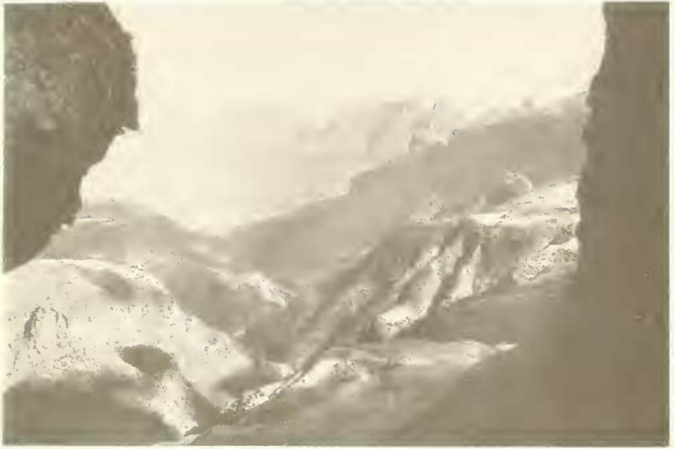
Abb. 14. Blick von Kurbät Mätaya auf das Vorplateau mit den Dörfern Dihwara (3022 m) und mehr rechts Ami Walka (3100 m); in der Mitte das tiefe Anzia-Tal, soweit auf dem Bild sichtbar bis etwa 1600 m eingetieft; im Hintergrund von links nach rechts Amba Toloka (2700 m), Amba Ton (2880 m) und mehrere unbenannte Amben (2900—3100 m).

Aufnahme Nr. 7: Kurbät Mätaya, 3600 m, 9. XI. 66, 100 qm.