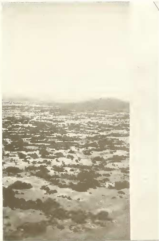
Abb. 3. Landschaft südwestlich Bahar Dar mit kleinflächigem Vegetationsmosaik.

ist auch um Bahar Dar der Wald stark zurückgedrängt worden zugunsten des Ackerbaus und der Weidewirtschaft. Die Besiedlung ist für unsere Begriffe aber keineswegs besonders dicht.