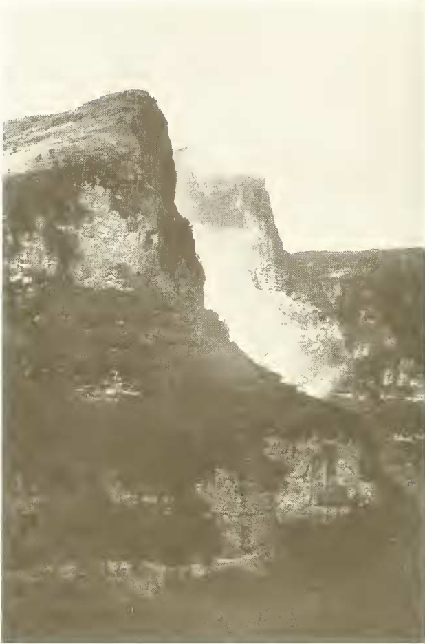
Abb. 13. Blick von Kurbät Mätaya (3600 m) in die Nordwände des Amba Ras (4077 m); die Steilhänge sind dicht mit Erica arborea bewachsen; oben links der flacher geneigte Südhang mit afroalpinen Matten und Fluren von Lobelia rynchopetalum .

Nach einiger Zeit zog sich der Pfad wieder am Hang entlang abwärts in den Oberlauf des Bälägäs-Tales hinein. Selbst steilere Hänge waren hier noch mit Gerste bebaut. Wo es zu steil wurde, sahen wir die Bauern mit der Hacke an der Arbeit. Es scheint in Semyen eine Art von Flurzwang zu herrschen. Ein Teil der Ackerfläche jedes Dorfes war zusammenhängend angebaut, ein anderer Teil war umgebrochen. Oberhalb des Dorfes Argän erreichten wir bei 3600 m den Talgrund und schlugen unser Lager auf. Kurbät Mätaya — so hieß diese Stelle — war wegen seines Reichtums an gutem Wasser und Holz ein sehr günstiger allerdings wegen der hohen Lage auch kalter Lagerplatz.