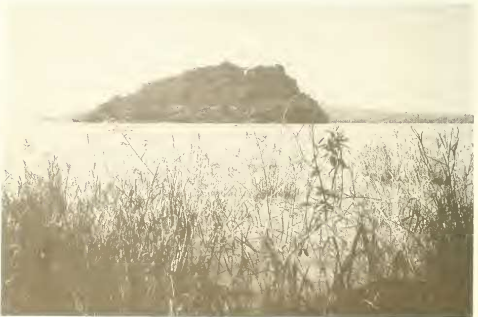
Abb. 6. Blick von der Insel Entons zur Insel Kevran; beide sind mit dichtem Mimusops kummel - Milletia ferruginea - Albizia schimperiana -Wald bedeckt; vorne Ufervegetation aus Pennisetum giganteum , Sesbania sesban , Kanahia laniflora .

Auf der „Carta geobotanica“ von R. PICHI-SERMOLLI (1957) ist die Umrandung des Tana-Sees mit „savanna (vari tipi)“ eingetragen. Die umliegenden, höher gelegenen Plateaus tragen „savanna montana“. Die Gehölze, die für die Savanne am Tana-See in den Erläuterungen zu dieser Karte aufgezählt werden, stimmen mit meinen Listen der Buschwälder gut überein.