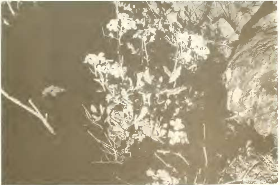
Abb. 12. Arabis cuneata , eine häufige Gebirgspflanze in Semyen.

bis 3700 m aufwärts. Oberhalb 3600 m machten hier die Gerstenfelder mageren, beweideten Grasflächen Platz. Die dominierende Grasart schien Festuca cf. nubigena zu sein. In feuchteren Mulden wuchsen die Bulten von Festuca abyssinica . Entlang der Bäche sah ich öfters die silberweißen Blütenköpfe von Helichrysum formosissimum und die Cyperaceen Cyperus elegantulus und Carex erythrorhiza . In dem mageren Rasen war Trifolium acaulis weit verbreitet.