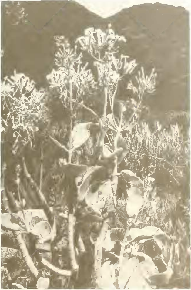
Abb. 21. Kalanchoe quartiniana , eine häufige Pflanze im trockenen May-Schaha-Tal; links dahinter ist noch der verbreitete Rumex nervosus zu sehen.

Die Flanken des May-Schaha-Tales sind in ihren untersten und obersten Partien sehr steil, in den mittleren aber nur mäßig geneigt und vorwiegend von Gerstenfeldern bedeckt. Auf dem Ackerbau ungünstigen Standorten wuchs nur eine lockere, manchmal schon fast an eine Halbwüste erinnernde Vegetation. Von 3400 m an abwärts tauchten die ersten Aloen auf. Auch Mesembryanthemum abyssinicum und Kalanchoe quartiniana , zwei ebenfalls sukkulente Arten, waren ziemlich häufig (Abb. 21).