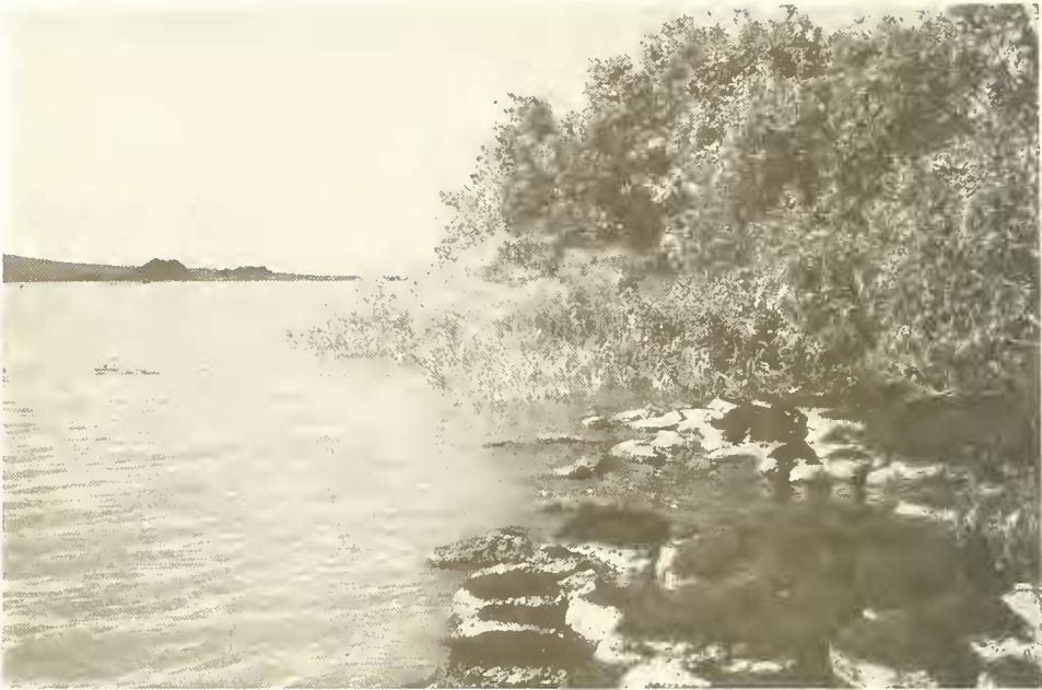
Abb. 5. Ufer auf der Halbinsel von Shimbet Michael mit Basaltblöcken, dahinter Galerie von Dokme-Bäumen ( Syzygium guineense ); links im Hintergrund die Inseln Kevran und Entons, hinter denen sich die Halbinsel Zegie zeigt.

Bahar Dar liegt in der Zone der äußeren Tropen mit einer sommerlichen Regenzeit. In den Tieflagen ist dies die Zone der tropischen, laubabwerfenden Savannenwälder und Savannen. Die kühleren und niederschlagsreicheren Hochländer liegen im Bereich der tropischen, immergrünen Gebirgswälder. Mit der Höhenlage von 1800 m liegt Bahar Dar gerade in einer Zwischenstufe zwischen dem Tiefland, äthiopisch „Kolla“ genannt, und dem eigentlichen Hochland, als „Dega“ bezeichnet. Diesen Übergangsbereich nennen die Äthiopier „Woina Dega“. Die Einordnung der als ursprünglich anzusehenden Wälder um Bahar Dar in Gliederungen für große Vegetationsräume bereitet einige Schwierigkeiten. Bei J. MILDBRAED (1966) findet man die allerdings sehr vage Bezeichnung „Mischwald“ für Übergänge zwischen mehr oder minder trockenen Savannenwäldern und den montanen Regenwäldern.