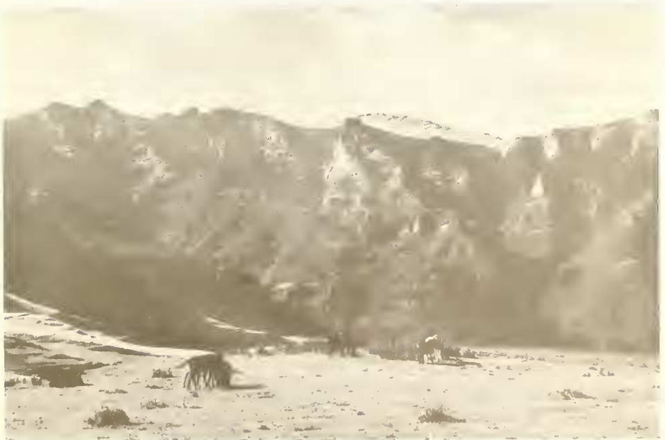
Abb. 16. Blick von der Kirche bei Lori (3400 m) auf die Nordhänge des Buahit (4437 m); oben in der Bildmitte ist das flache Hochtal zu sehen, über das der Karawanenweg führt; in den Nordhängen große Bestände von Erica arborea .

Von Lori aus besuchten wir eine der Schluchten am Nordabfall des Buahit (Abb. 16). Überraschend war für mich in der Schlucht Pflanzen zu finden, die mir aus der Heimat schon bekannt waren. Allerdings waren es nicht dieselben Arten, doch nah verwandte. Unsere Waldgräser Festuca gigantea , Bromus ramosus und Brachy-