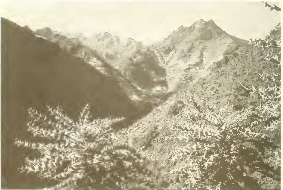
Abb. 19. Blick aus dem Tällak-Tal zum Walya Känd (4256 m) links und zur Amba Dawit (3852 m) rechts; die hellen Partien an den Hängen der Amba Dawit sind Gerstenfelder; vorne eine montane Hangsavanne mit Erica arborea und Echinops (im Vordergrund).

thunbergianum ; letzteres erinnerte sehr an unser einheimisches G. rotundifolium . Die Talhänge waren locker mit Sträuchern bewachsen. An allen einigermaßen geeigneten Stellen waren immer wieder kleine Gerstenfelder eingestreut. Auf einem steilen Südwesthang in 3100 m Höhe nahm ich eine hochmontane Hangsavanne auf (Liste 12):