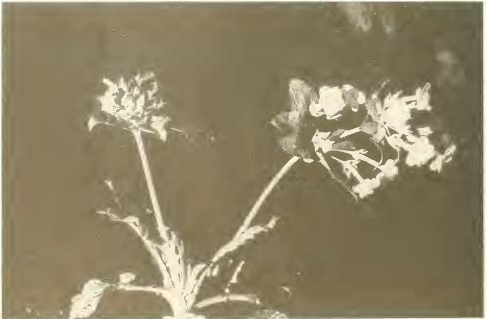
Abb. 20. Primula verticillata ssp. semiensis in der Bachklamm bei dem Dorf Madsche (3500 m).

Am 17. November traten wir wieder den Rückweg von Sabra über den Mätälal-Paß ins May-Schaha-Tal an. Auf der östlichen Talflanke ging es jetzt in südlicher Richtung abwärts. Bei dem Dorf Madsche machten wir für eine Nacht Zwischenstation ( 38^{\circ}20'36''\text{E} , 13^{\circ}15'17''\text{N} , 3500 m NN). Dieses Dorf liegt unmittelbar am