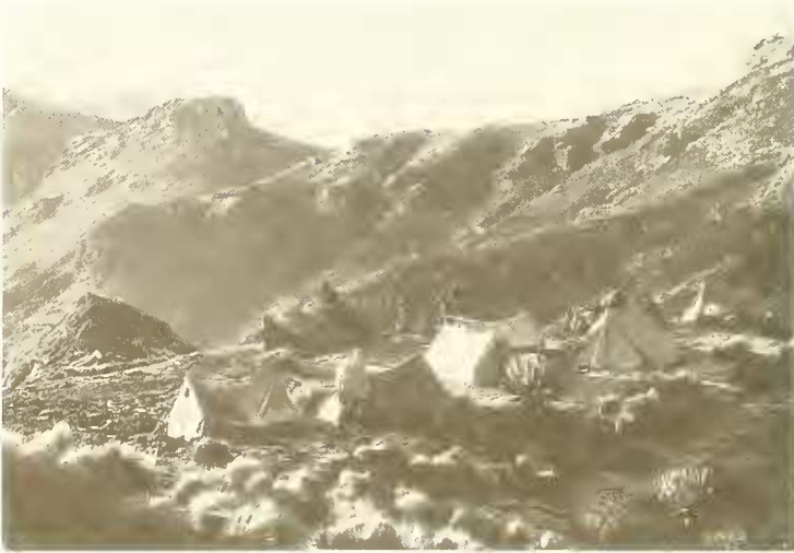
Abb. 17. Blick von Tiguna (3650 m) zum Mätälal-Paß; im Hintergrund links schaut noch der Ras Dedschän hervor; an den Hängen hinter dem Lager frisch umgepflügte Felder, die bis 3700 m hinaufreichen.

Der Madsche Wåns war neben dem Lager klammartig in die Basaltfelsen eingeschnitten. In den Felsspalten wurzelte in großer Zahl gelbblühende hauswurzähnliche Aeonium leucoblepharum . Später fand ich diese Art noch häufig an den Felsen bis in 4000 m Höhe. In ihrer Verbreitung ist sie auf Äthiopien und Südarabien beschränkt. Ihre nächsten Verwandten bewohnen das Mittelmeergebiet und die Kanaren. Im Bett des Baches wuchs die einzige Weidenart Äthiopiens, die Salix subserrata . Sie trug im November reife Fruchtkätzchen.