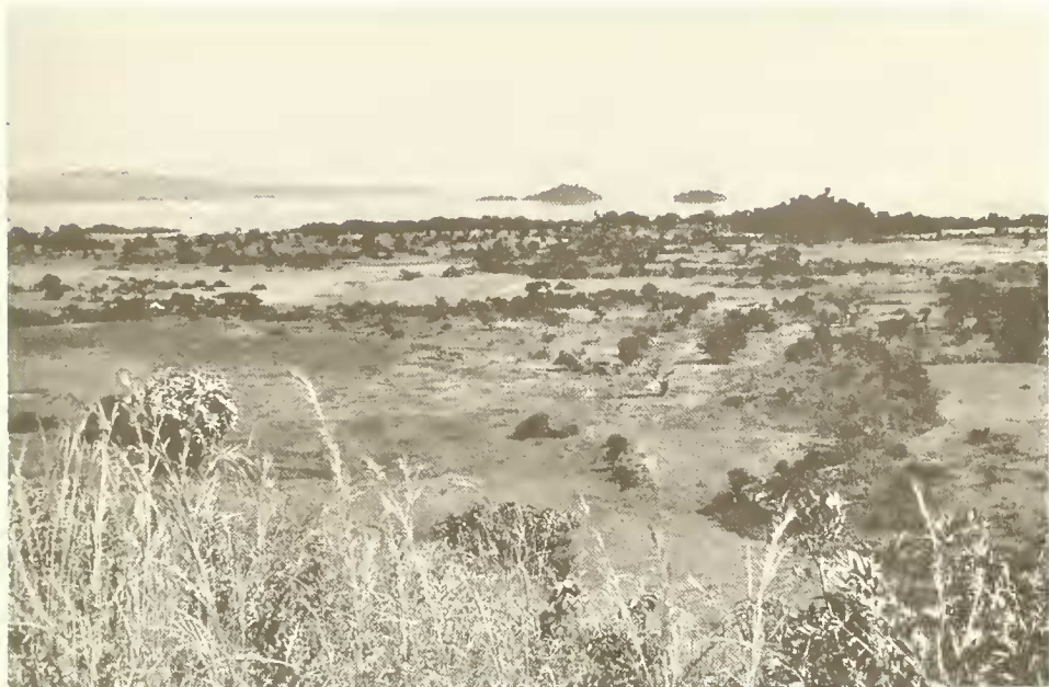
Abb. 1. Landschaft am Südufer des Tana-See westlich Bahar Dar; Blick vom Kotita Hill nach Norden; hinten von links nach rechts Halbinsel Zegie, Insel Kevran, Insel Entons, Kirchenhügel von Sesela Abo; links vorne ein gehölzfreies, sumpfiges Grasland.