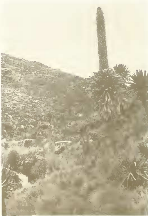
Abb. 15. Lobelia rhynchopetalum bei Kurbät Mätaya.

Eine interessante Gemeinschaft fand ich auf Basaltgrus in flachen Mulden auf Felsen. Dieser Standort wechselt zwischen starker Austrocknung und stauender Nässe. Die dichten Polster von Sagina abyssinica und Senecio nanus , die Blattsukkulente Sedum sediformis und Cerastium octandrum waren die Komponenten.