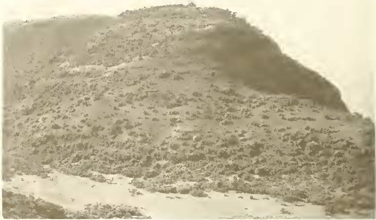
Abb. 10. Geköpfter Oberlauf eines Seitentales des Bälägäs; der Talhang ist mit Gebirgssavanne und Büschen von Erica arborea und Hypericum lanceolatum bedeckt, die Talsohle ist versumpft; rechts hinten der Steilabfall nach Norden.

Wieder auf der Hochfläche angelangt, ging es noch mehrere Stunden lang über fast baumlose Ackerfluren, bis wir bei einbrechender Nacht in einer grasigen Mulde bei dem Dorf A u t a g e v (3450 m; etwa 38^{\circ}7'E , 13^{\circ}13'N ) unsere Zelte aufschlugen. Hier war die Holzknappheit so groß, daß es nur mit einiger Mühe gelang, den Leuten etwas Holz abzukaufen. Am Morgen des 9. XI. stiegen wir oberhalb des benachbarten Dorfes Amba Ras am flach geneigten Südhang des gleichnamigen Berges (4077 m)