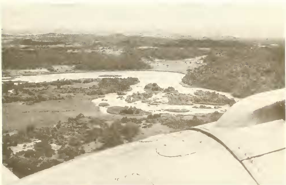
Abb. 2. Niltal wenige Kilometer unterhalb Bahar Dar; die Hänge jenseits des Nils sind mit Savannen-Buschwäldern bewachsen; links vorne ein gehölzfreier Sumpf von Cyperus papyrus ; im Hintergrund die höheren Plateaus von Begemder.