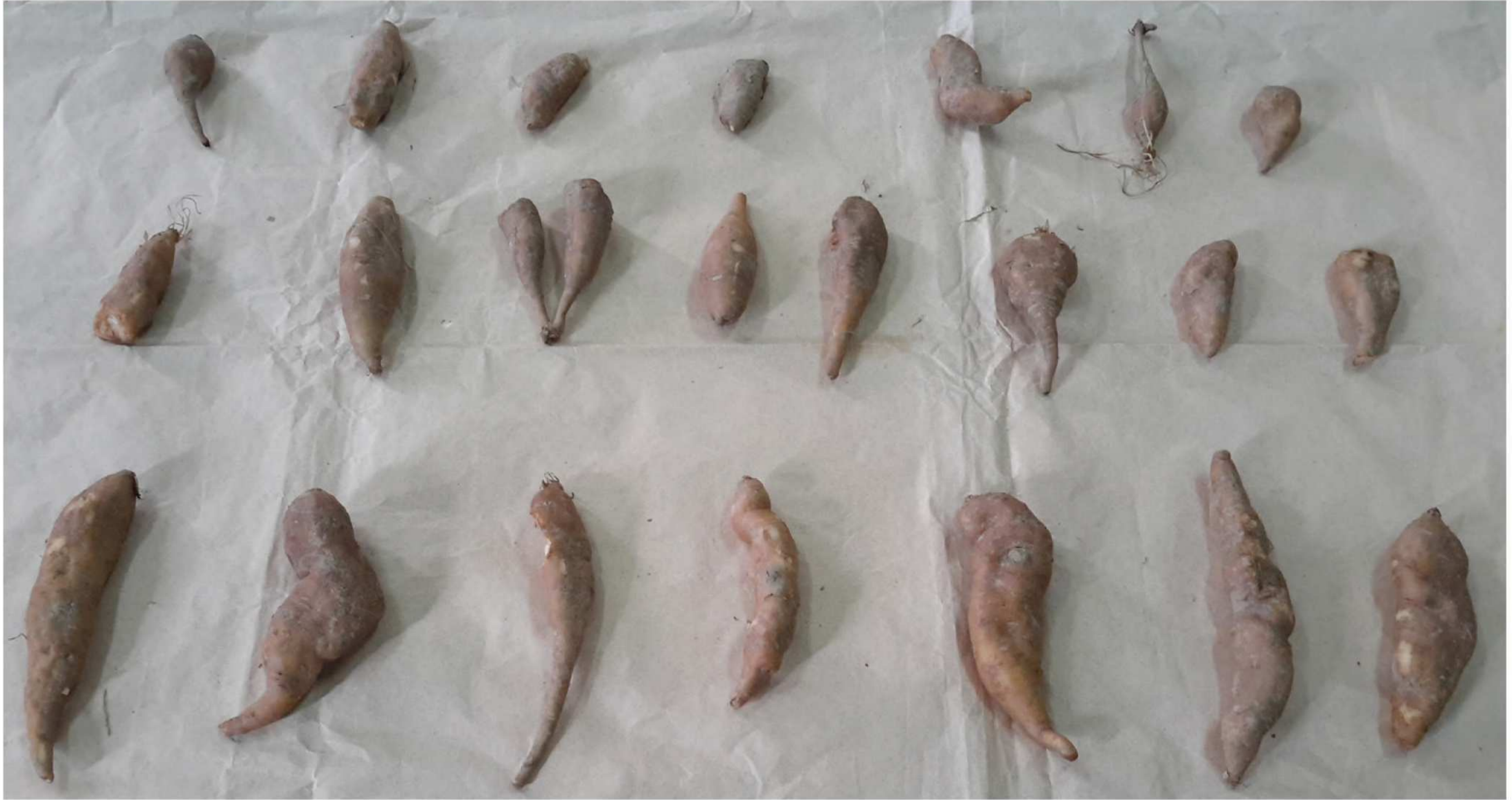
Fig. 4. Caxamarca sanchezii M. O. Dillon & Sagást. A. Diversidad de raíces. (Fotografías de M. Soto).