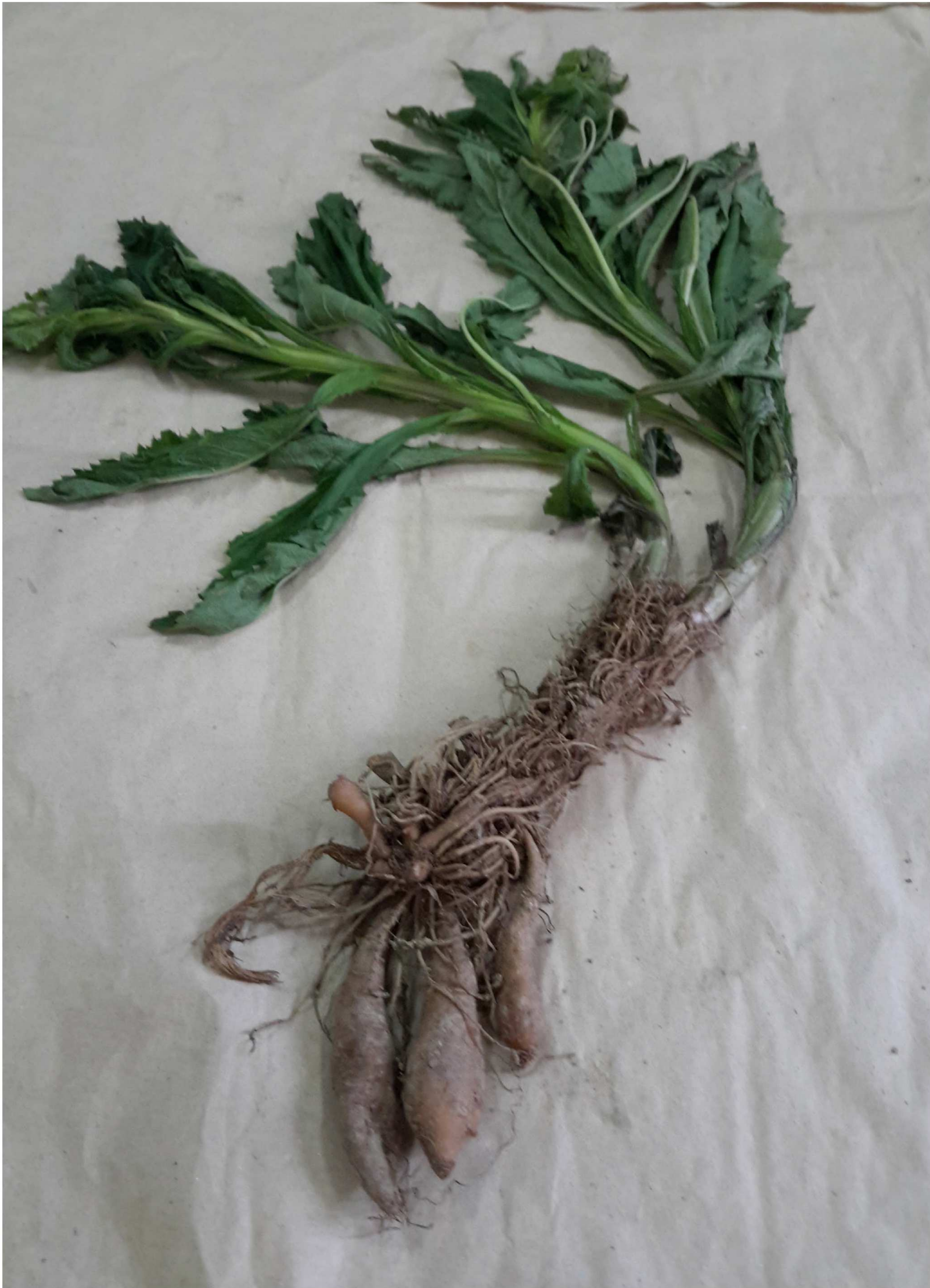
Fig. 3. Caxamarca sanchezii M. O. Dillon & Sagást. A. Planta joven con raíces.