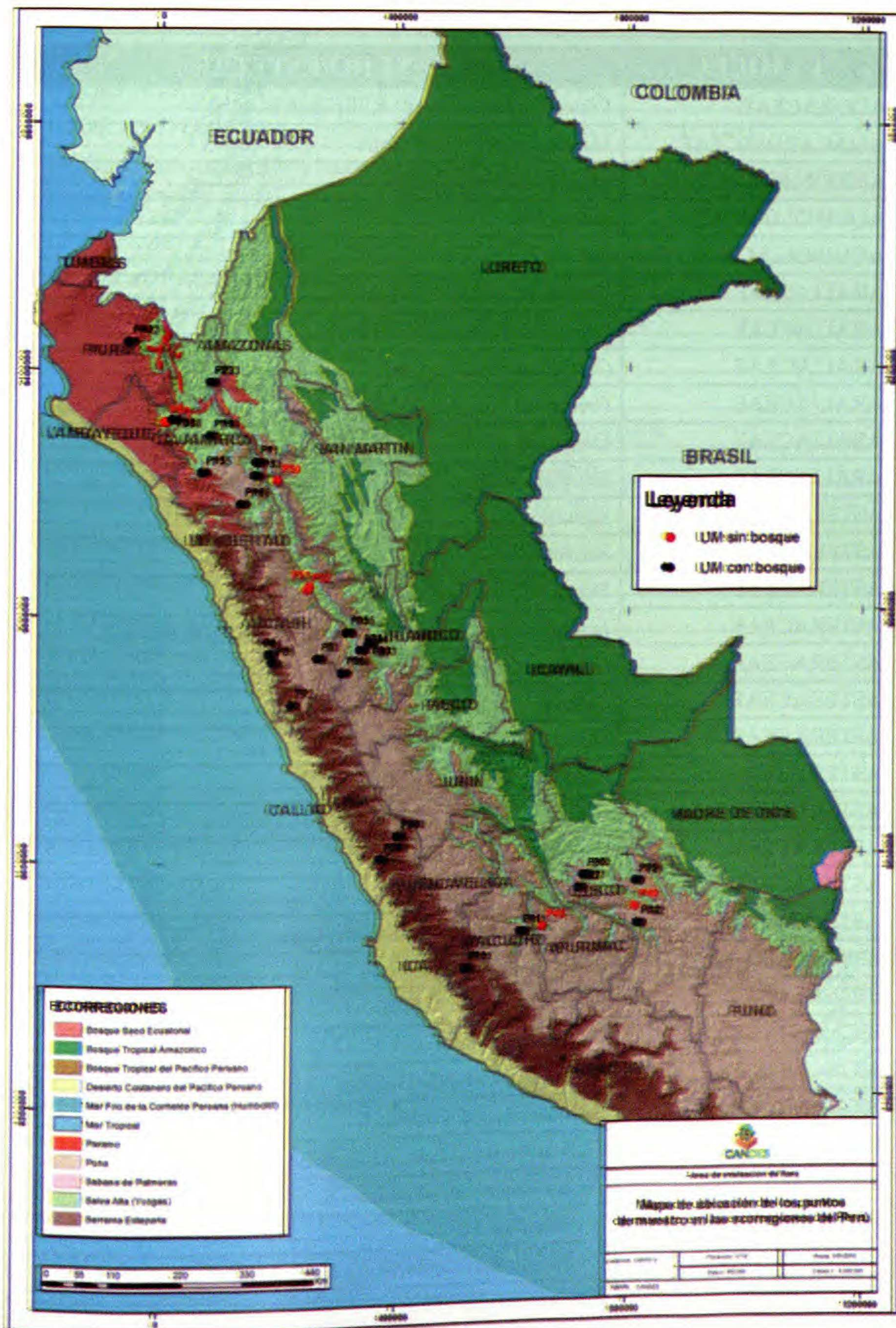
Fig. 1. Ubicación de los puntos de evaluación y Ecorregiones