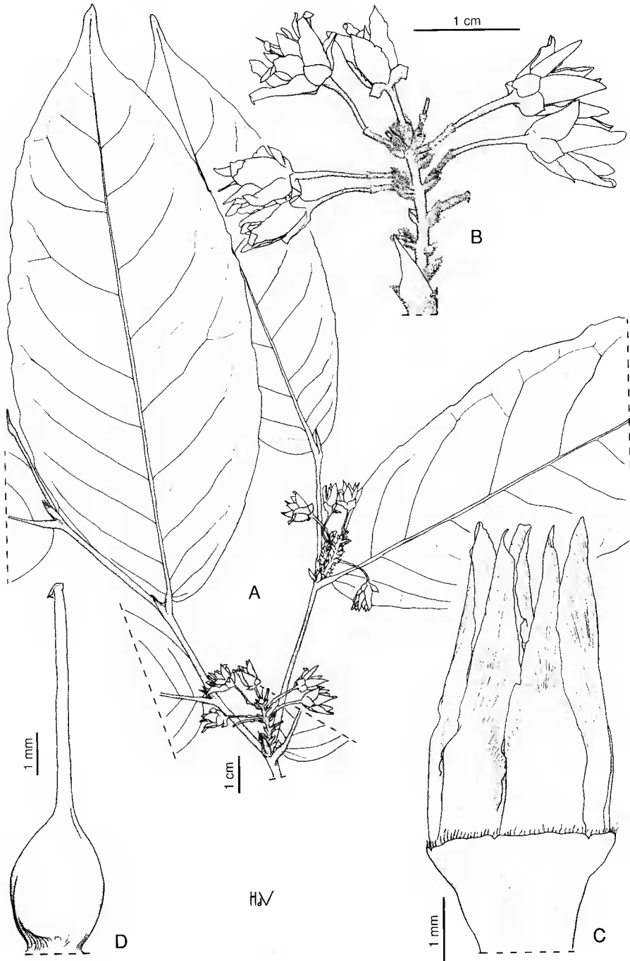
Fig. 1. — Rinorea apertior : A, rameau florifère ; B, portion d'inflorescence ; C, androcée ; D, gynécée. (Van Nek 133).