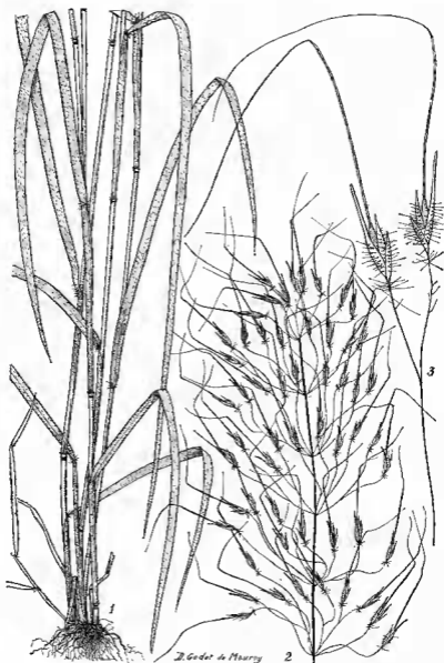
Pl. 1. — Loudetia annua (Stapf) C. E. Hubb. var. dronnei Jac.-Fel. : 1, base de la plante \times 2/3 ; 2, panicule \times 2/3 ; 3, épillet \times 2 (Clair 19).