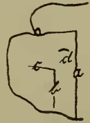
A. canaliculatus , Thorax.