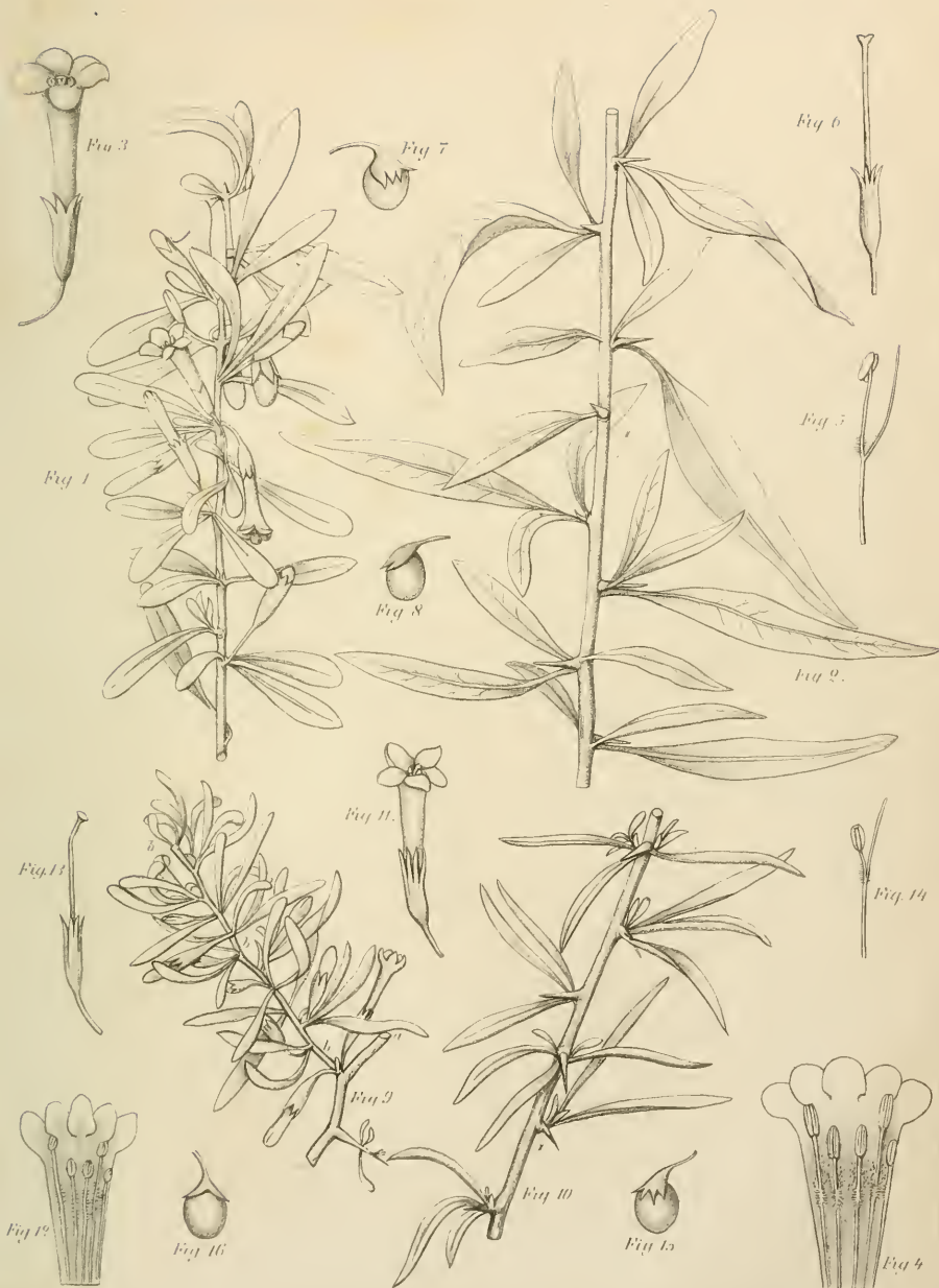
Fig 1 8 Lycium elongato cestroides . Fig. 8 16. Lycium elongatum .