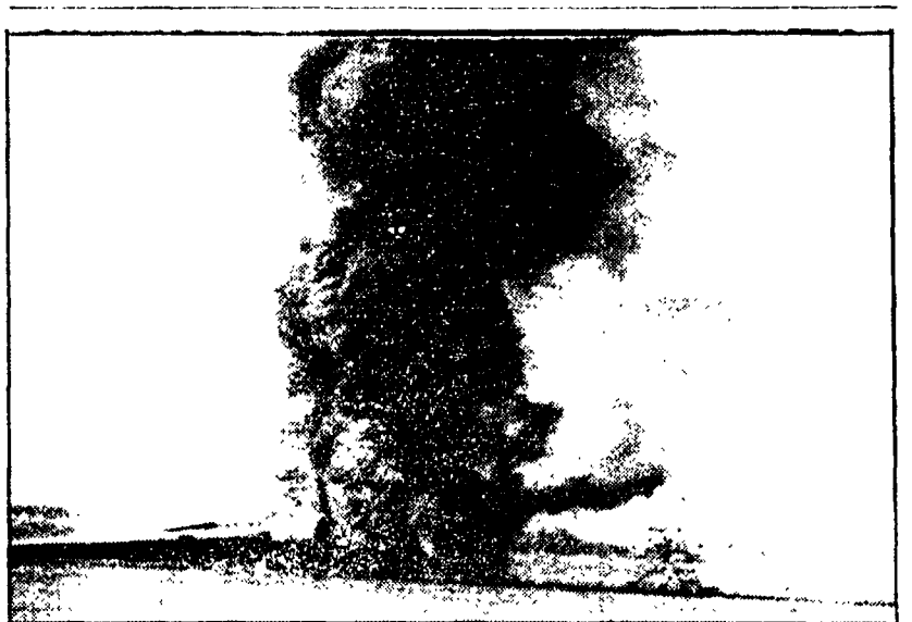
PONTE AEREO USA A PHNOM PENH. La situazione del regime fantoccio

«E da notare che la stampa di destra tende ora a sembrare in sordina il fatto di arresto di colpo di Stato, di arresto di ufficiali, di arresto di ufficiali».