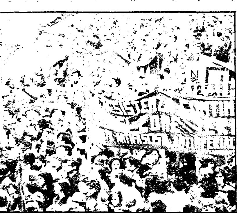
SAVONA — Uno scorcio della grande manifestazione di ieri

La cittadinanza reclama unanime che siano intensificate le indagini e venga colpita l'organizzazione eversiva