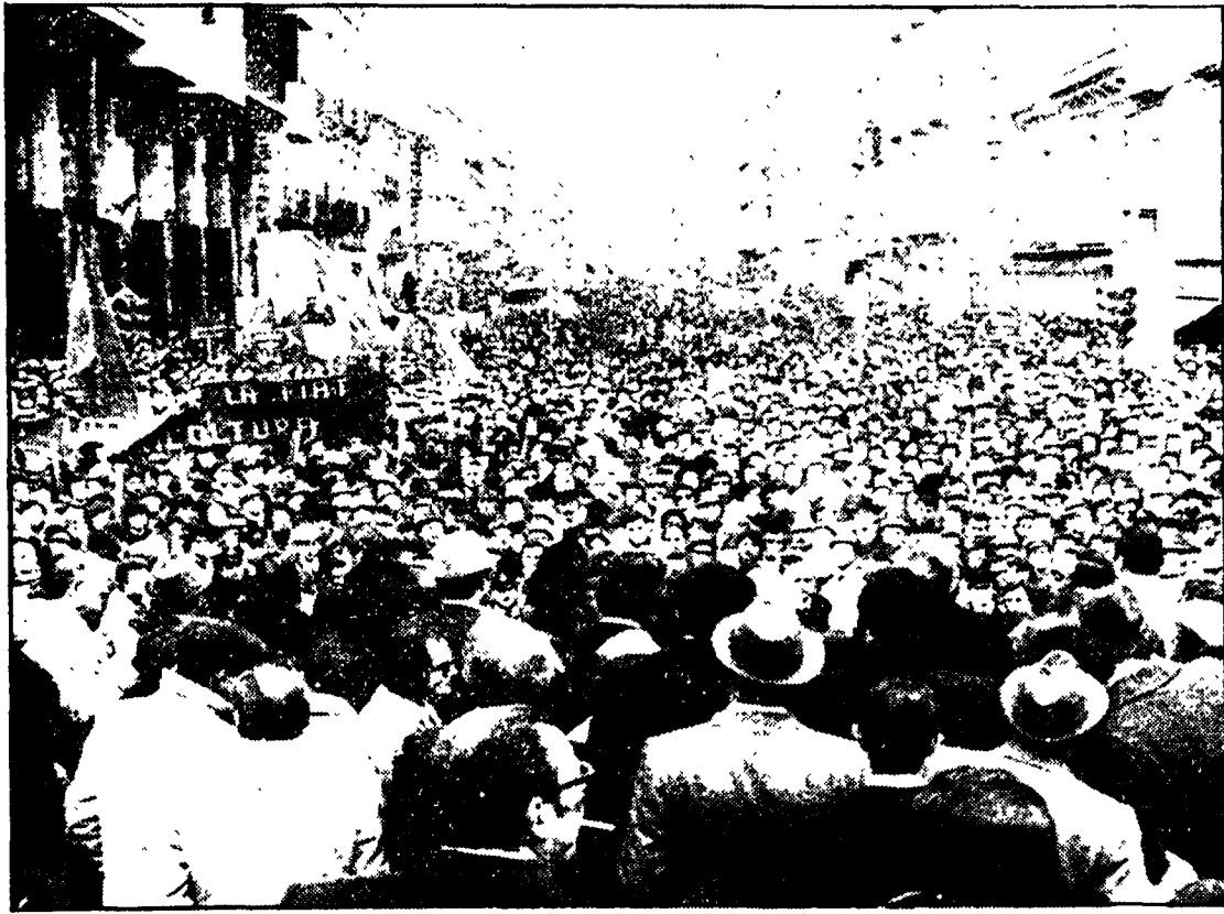
AVELLINO — Un aspetto della manifestazione di 50 mila persone