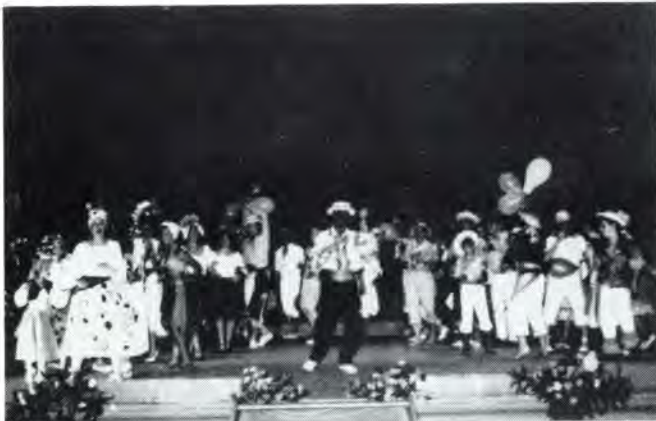
Una de les actuacions del Somni d'Estrelles a la Sala.