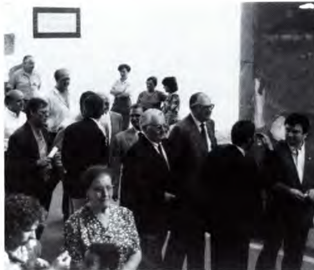
Una de les poques imatges que hi ha de l'equip de govern que va durar del 9 de juliol al 18 de setembre.

Precisament la remodelació de la Plaça Nova va permetre la recuperació d'aquest espai per fer-hi diferents espectacles. El fet que s'hagin tret els arbres del centre de la Plaça va garantir, per exemple,