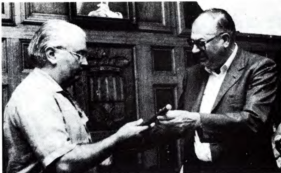
CRÒNICA DE MATARÓ