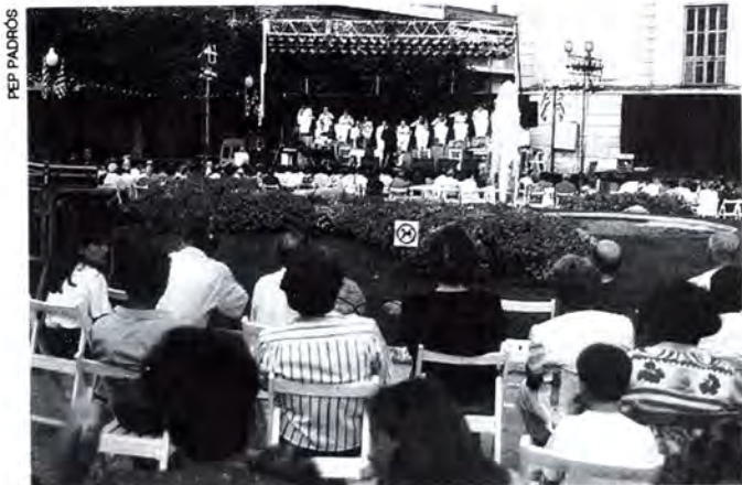
La remodelació de la Plaça Nova va permetre que el concert es veiés des de qualsevol punt.