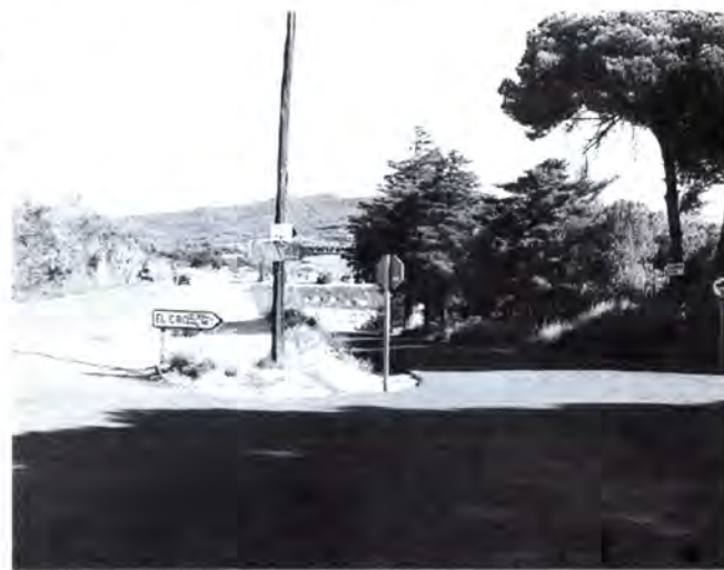
El camí vell del Cros, a la cruïlla de la carretera de Vilassar.

Recordem que aquesta carretera tindrà uns 22 quilòmetres i dos túnels evitaran la collada de Parpers. Segons un estudi de la Generalitat, cada dia hi passaran uns 10.000 vehicles. Tot i que era previst que les