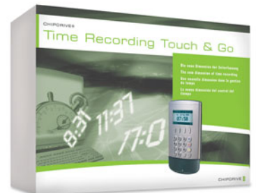
CHIPDRIVE® Time Recording Touch & Go