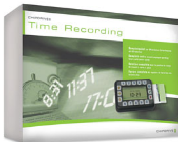
CHIPDRIVE® Time Recording

Das jeweilige Starter Kit enthält alle Komponenten, um sofort mit der Zeiterfassung der Mitarbeiterzeiten beginnen zu können. Alle Bestandteile sind auch einzeln verfügbar. So können Sie jederzeit neue Mitarbeiter mit den entsprechenden Chipkarten/Tags ausstatten oder weitere Zeiterfassungsterminals hinzufügen. Alle Geräte werden von Ihnen mit einer eigenen ID versehen, so dass Sie bei jeder Buchung auch den Buchungsort sehen können.