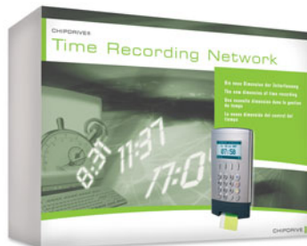
CHIPDRIVE® Time Recording Network