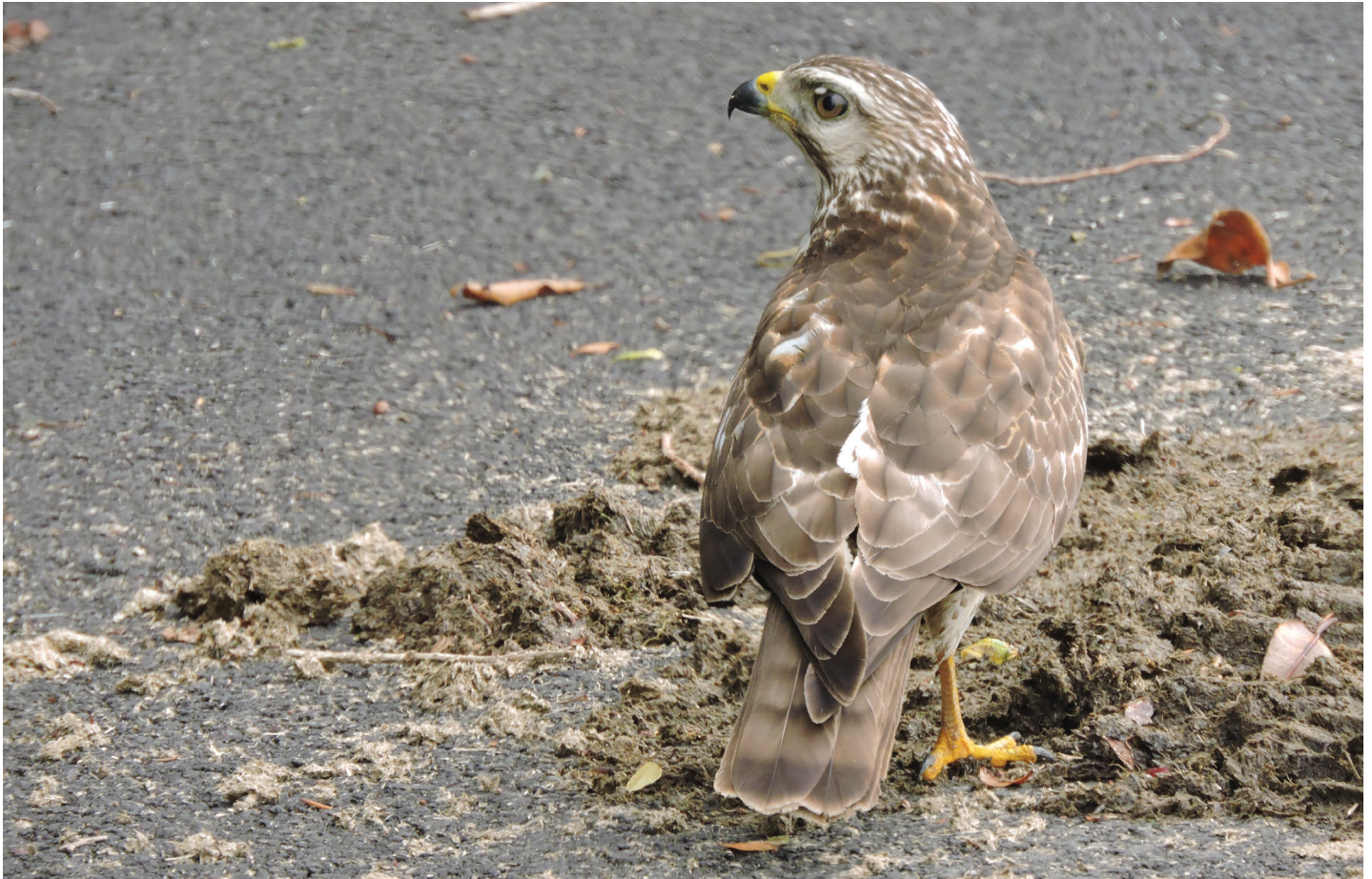
Figura 1. Juvenil de Buteo platypterus forrajeando artrópodos en una boñiga de vaca tras ser aplastada por un vehículo en Vara Blanca, Costa Rica.

nil de Gavilán Aludo en la rama desnuda de un árbol bajo, el cual salió volando a un árbol cercano tras pasar cerca con el vehículo. A las 14:45 h, al regresar por la misma carretera, vimos al gavilán en el suelo sobre una boñiga de vaca recién aplastada. Paramos el vehículo algunos metros antes, para fortuna del animal, y pudimos observarlo alimentándose de algún tipo de artrópodo (potencialmente escarabajos estercoleros) que sacaba con el pico dentro de la boñiga.