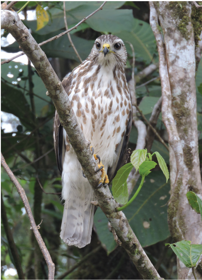
Figura 2. A pesar de haber volado hacia una rama cercana por nuestro acercamiento en automóvil, el juvenil siguió mostrando interés en continuar forrajeando cerca de la boñiga.

especie, aunque es común entre otros Buteos alrededor del mundo usar carreteras para forrajear (Meunier et al. 1999). Se sabe que ciertas especies de rapaces esperan conseguir carroña de presas atropelladas por vehículos (Meunier et al. 1999). Adicionalmente, otras aves, como los Cuervos carroñeros ( Corvus corone ) han sido documentados usando automóviles como cascanueces en diversos países templados (Nihei y Higuchi 2001). Por su parte, forrajear escarabajos estercoleros en boñigas es una común e importante