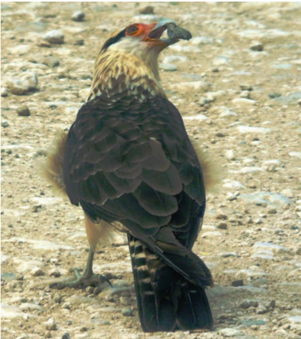
Figura 3. Individuo de Milvago chimachima con la roca número 4 que recogió y se llevó a un árbol cercano en el camino a La Casona del Territorio indígena Ngöbe Bukle käite Jukribta, Coto Brus, Costa Rica.

1) y algunos cultivos, ej. palma africana, en las cercanías. El individuo era un adulto que recogía algo del camino, que inicialmente pensamos se trataba de carroña. Sin embargo, luego notamos que el caracara aparentemente estaba seleccionando alguna roca del camino. El individuo levantó y desechó tres rocas pequeñas (Figura 2). Finalmente recogió una cuarta roca de mayor tamaño que las anteriores (Figura 3) y voló con ella a un árbol cercano. Infortunadamente no pudimos seguir al individuo para ver que hacía con la roca.