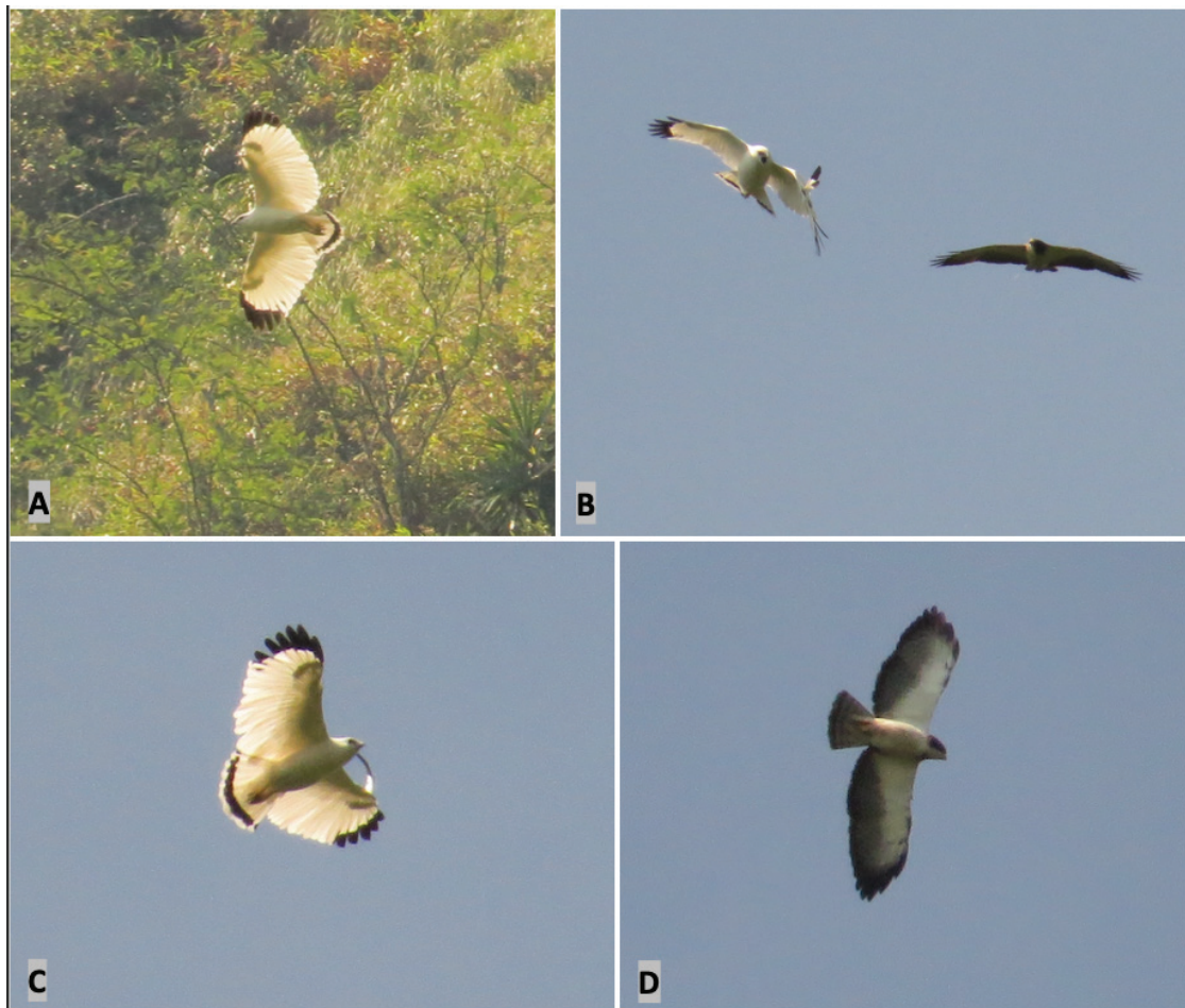
Figura 1. Aguililla Blanca ascendiendo (A) y siendo atacada por una Aguililla Cola Corta (B). Aguililla Blanca (C) y Aguililla Cola Corta (D) después del evento de interacción agonística.

del sitio en otra dirección (Figura 1D). El ataque duró pocos segundos y se debió posiblemente a la competencia por territorio.