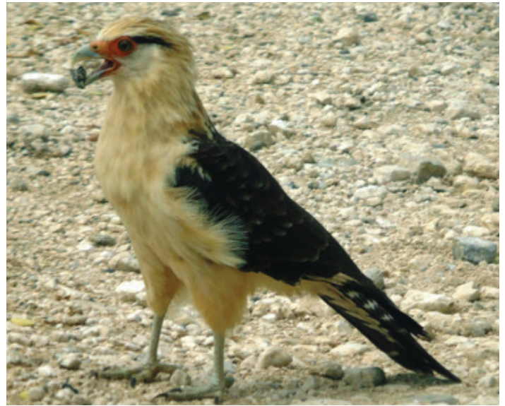
Figura 2. Individuo de Milvago chimachima con rocas pequeñas en el pico que luego desechó (tres eventos), en el camino a La Casona del Territorio indígena Ngöbe Bukle käite Jukribta, Coto Brus, Costa Rica.

de color amarillo, las patas verdosas y los ojos café rojizos. La cabeza, cuello y partes inferiores de los adultos son de color blanco crema con algo de marrón en la coronilla y una línea postocular marrón oscuro. El dorso es de color café oscuro así como las alas que además tienen puntos blan-