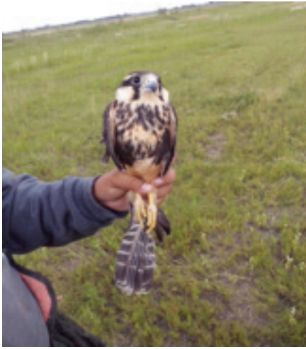
Figura 1. Halcón Aplomado recién capturado.