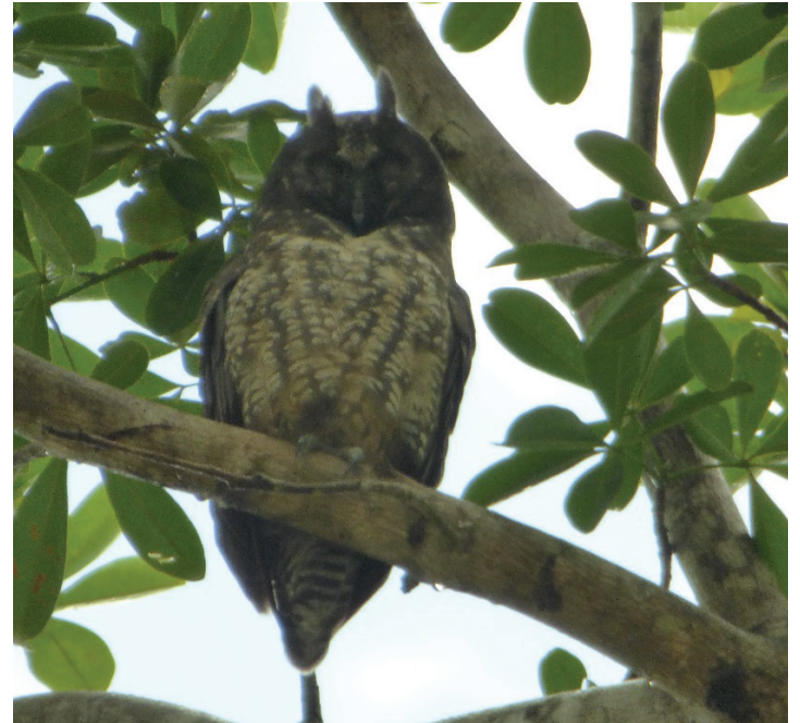
Figura 2 (Izq). Individuo observado en Apia-Risaralda, cordillera Occidental.; Figura 3 (Der). Individuo observado en La Macarena-Meta, este de los Andes.

aproximadamente del suelo en un árbol de Eriotheca globosa (Malvaceae). Durante cinco días consecutivos observamos dos individuos (tiempo en el que se permanecimos en esta localidad). En las tardes se encontraban inmóviles y en las noches fueron observados entrando al campanario de la iglesia, posiblemente para capturar palomas ( Columba livia ), sin embargo no se observó con presas (Figura 3). Este registro extiende su distribución 157 km lineales de la localidad más cercana en la cordillera Oriental ubicada en el municipio de Algeciras, departamento de Huila y convirtiéndose en el primer registro al oriente del país retirado de la cadena montañosa de los Andes orientales.