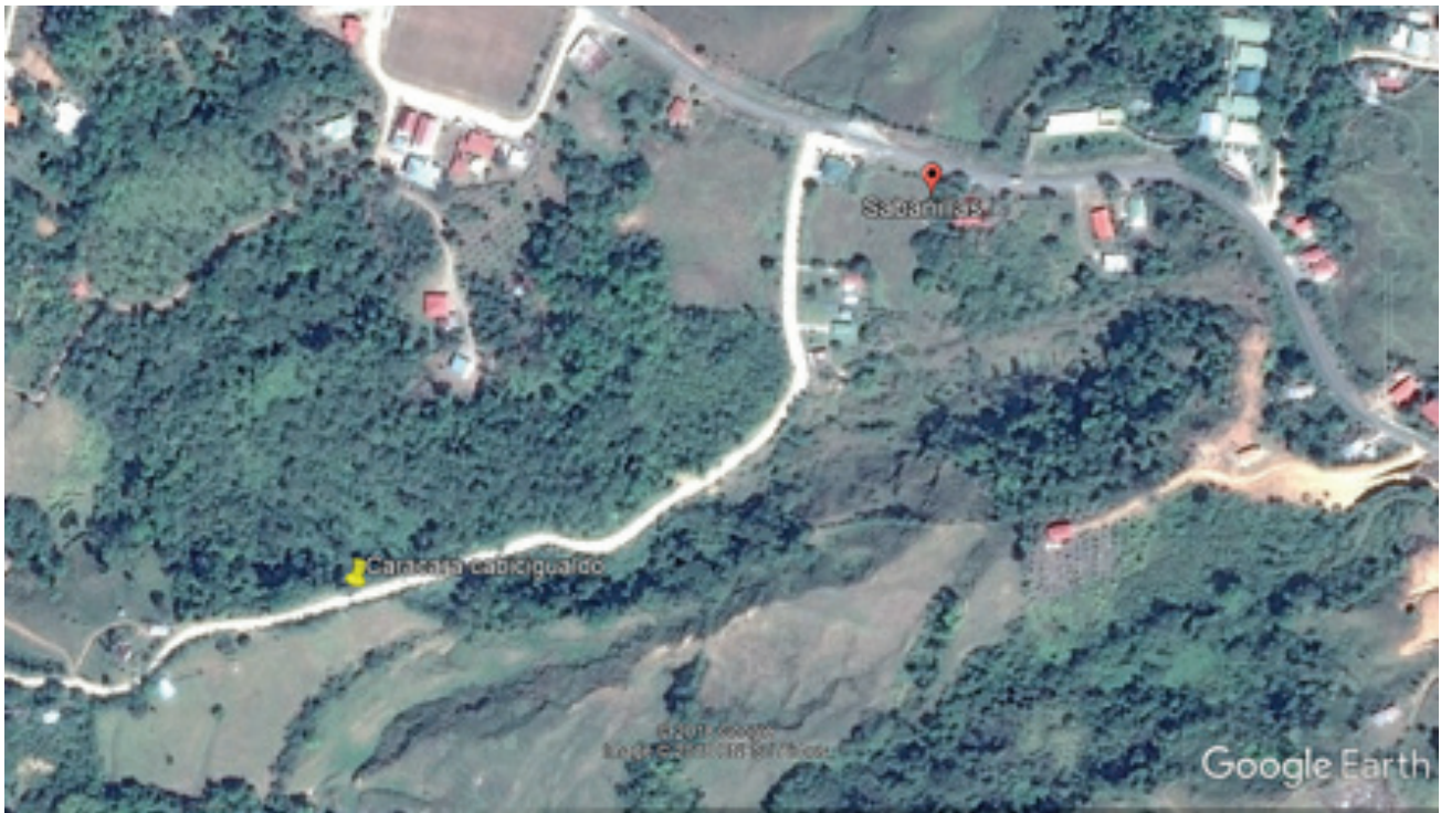
Figura 1. Punto de observación (pin amarillo) de un caracara cabecigualdo ( Milvago chimachima ) camino a La Casona del Territorio indígena Ngöbe Bukle käite Jukribta, Coto Brus, Costa Rica.

y Skutch 1995), aunque puede variar entre 1 y 3 (Hilty y Brown 1986, De La Ossa y De La Ossa-Lacayo 2011).