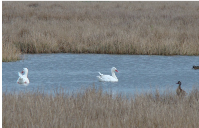
Cisne blanco - Coscoroba coscoroba