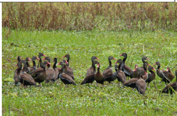
Pato silbón o Ype suiriri pepoti - Dendrocygna autumnalis