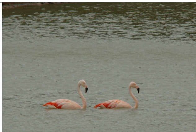
Flamencos - Phoenicopterus chilensis