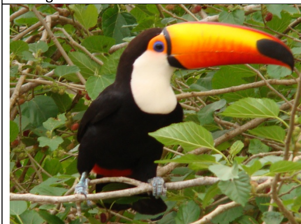
Tucan – Ramphastos toco