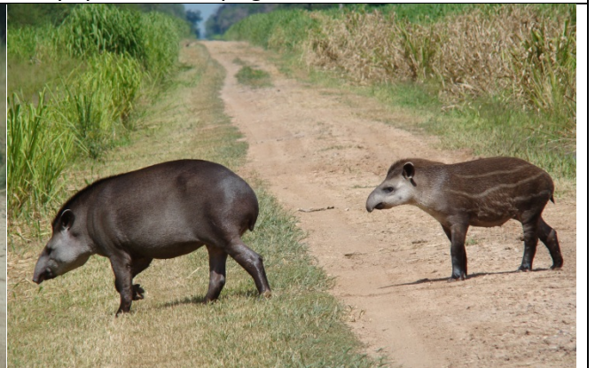
Mborebi - Tapirus terrestris