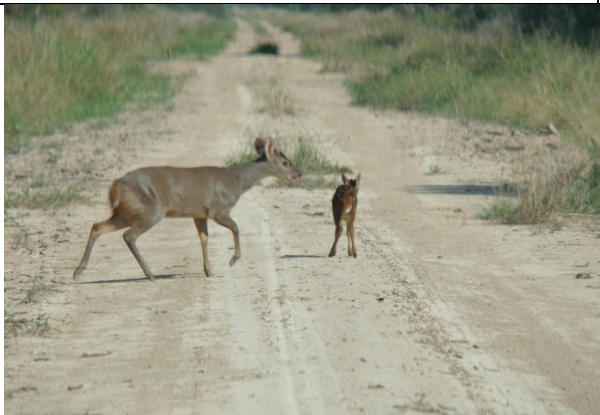
Venado - Mazama gouazoupira