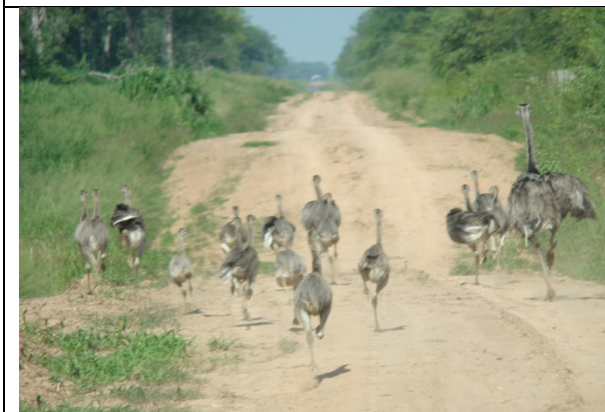
Ñandú – Rhea americana