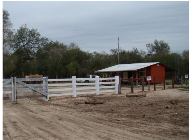
Infraestructura existente en el campo para el personal