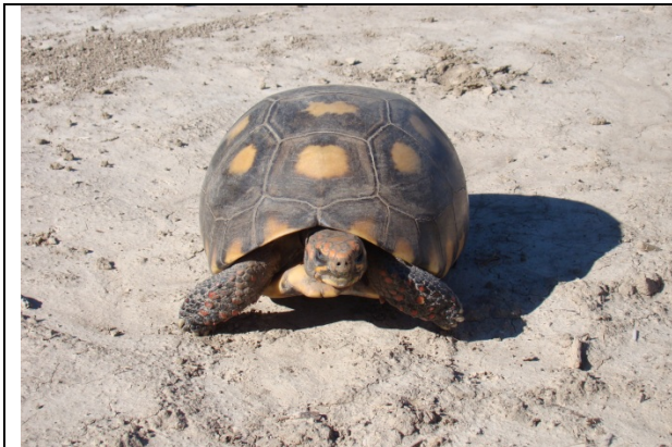
Tortugas - Geochelone chilensis