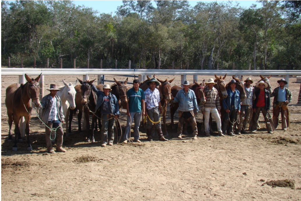
Personal que lleva adelante los trabajos de campo de la Estancia