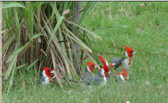
Cardenales - Paroaria coronata