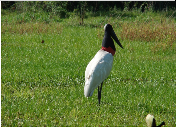
Tuyuyu cuartelero - Jabiru mycteria