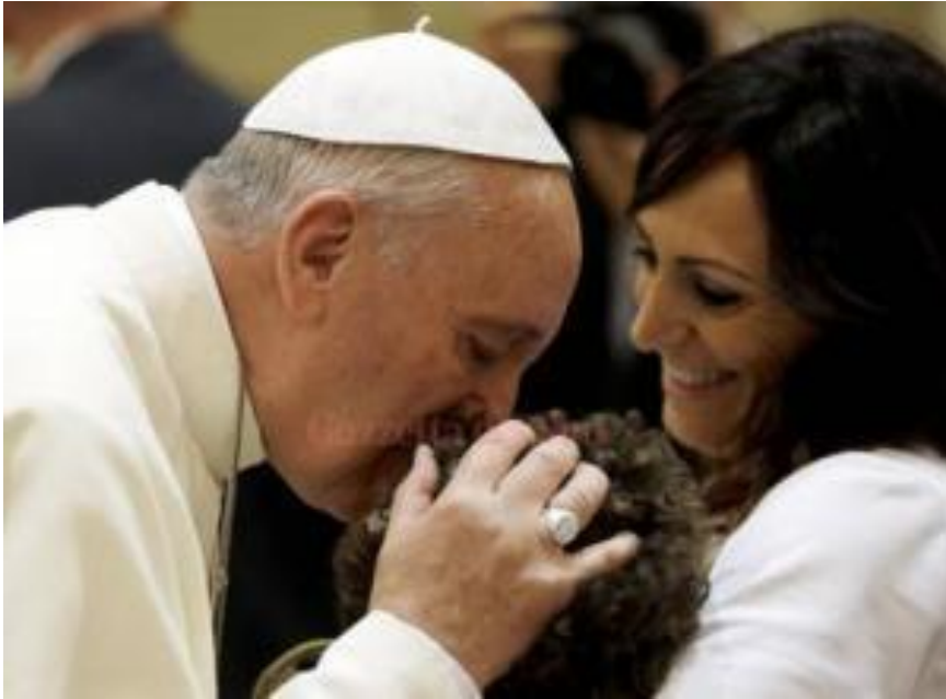
Pave Frans kysser et handicappet barn i l'Istituto Serafico d. 4. oktober 2013

Da han hilste på en voksen handicappet, sagde denne sørgmodigt, at han desværre ikke kunne se paven, fordi han var blind. Paven svarede kærligt: "Du ser med hjertet" .