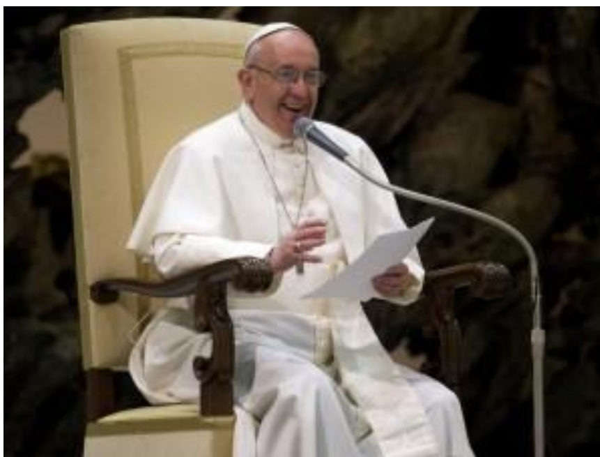
Pave Frans overraskede også, da han få dage efter valget afholdt en pressekonference, hvor han begejstrede journalisterne med sin åbenhed, humor og varme

Pave Frans valgte den overdådige, meget smukke Laterankirke fra og drog i stedet for til et ungdomsfængsel i Rom, hvor han kyskede og vaskede fødder på 12 af de unge indsatte. Ikke nok med, at det var de mindste mænd i samfundet. Der var også for første gang 2 kvinder med blandt de 12 repræsentanter for disciplene, og den ene af dem var muslim! Med dette sendte Pave Frans et positivt signal til den muslimske verden om, at et af hans ønsker for sit og Den Katolske Kirkes kommende virke er en intensivering af dialogen med verdensreligionerne.