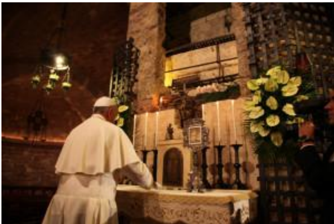
I forbindelse med Pavens private bønner ved Frans grav gik han op på podiet og lagde en buket blomster til Frans