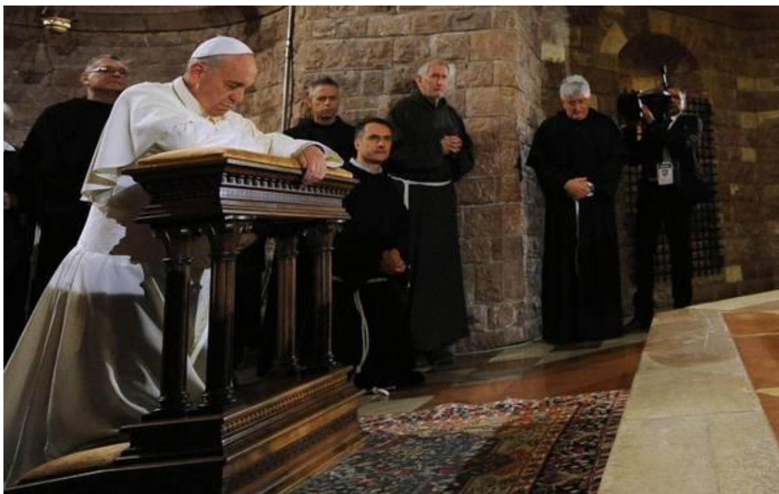
Pave Frans beder ved Frans' grav i Assisi d. 4. oktober 2013