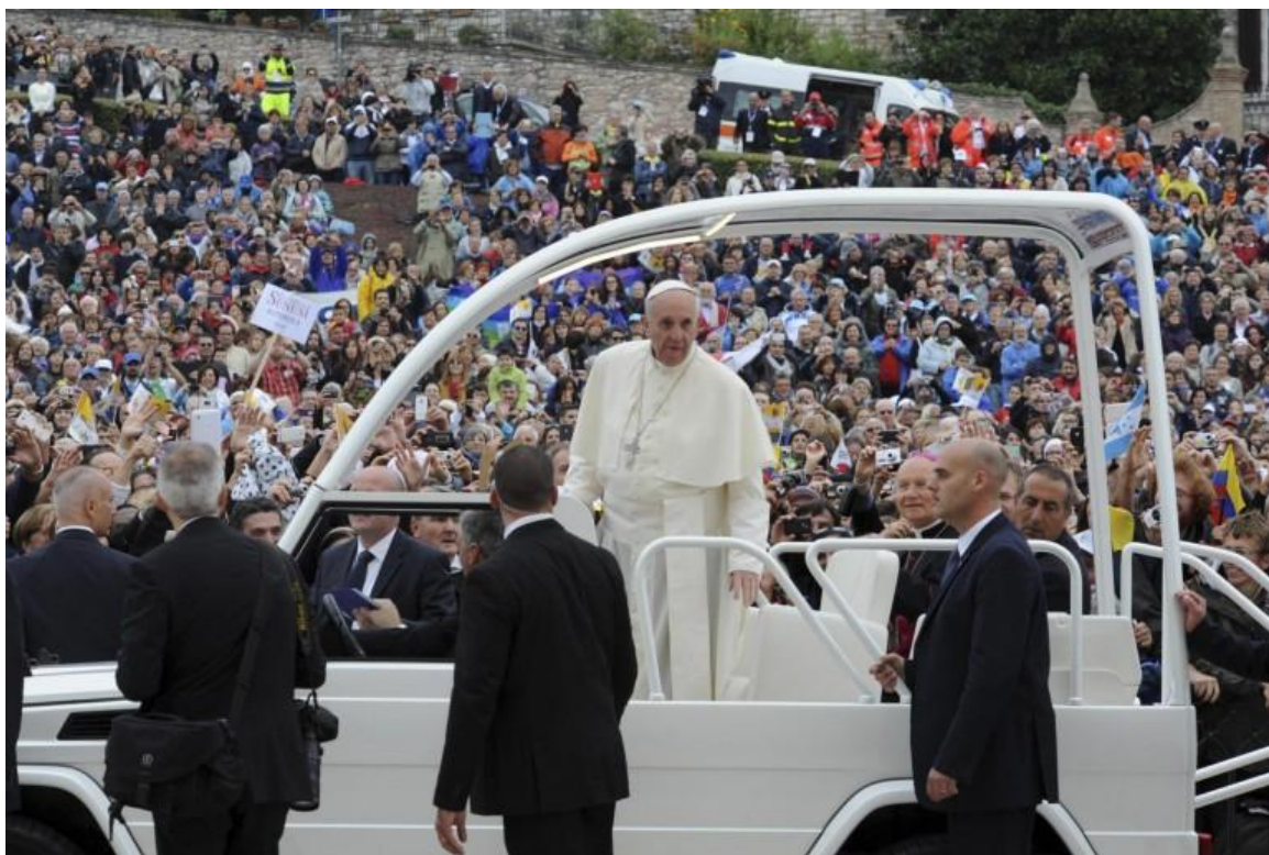
Pave Frans ankommer til Piazza Inferiore d. 4. oktober 2013

Se også fotos fra Pave Frans' besøg i Assisi på de næste sider