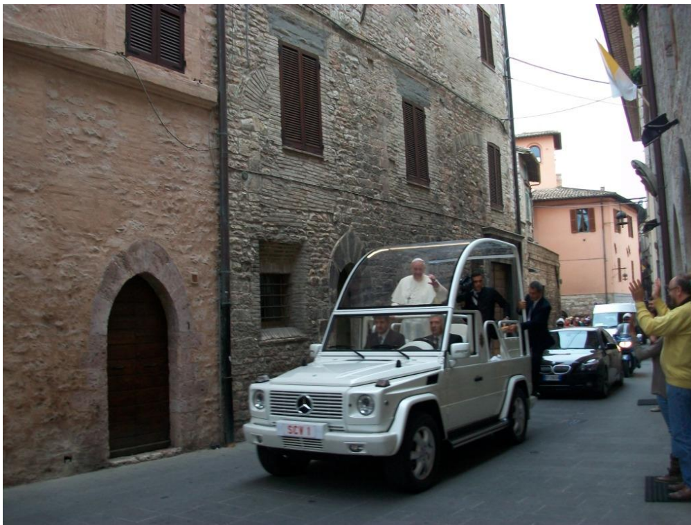
Pave Frans passerer min lejlighed d. 4. oktober 2013

I et uforglemmeligt øjeblik kørte paven vinkende forbi, som det ses på fotoet nedenfor, medens mine tårer fortsatte med at rende.