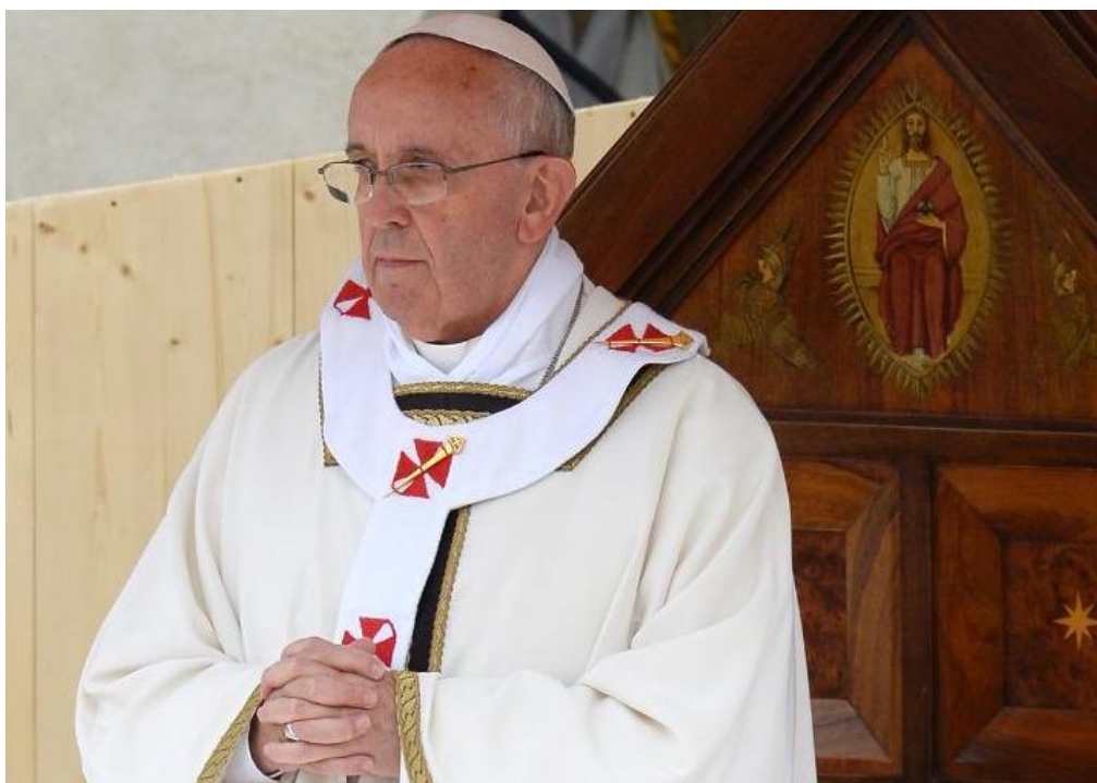
Pave Frans under højmesse på Piazza Inferiore i Assisi d. 4. oktober 2013 Det var en meget enkel men smuk scene, der var opbygget til højmesseren

Min erfaring med Pavens stærke udstrømning af Kristi medfølende hjerte er blevet bekræftet igen og igen på selve dagen for hans besøg i Assisi og i dagene derefter. Jeg har talt med flere venner i Assisi. Nogle, som normalt ikke har let ved at græde, oplevede overraskende deres tårer strømme, lige så snart de var i nærheden af Pave Frans eller fulgte hans besøg på tv. De talte om, at det rørte dem dybt at se paven, måske trykke hånd med ham, evt. have en kort øjenkontakt – ja bare det at være i nærheden af ham/se ham på tv.