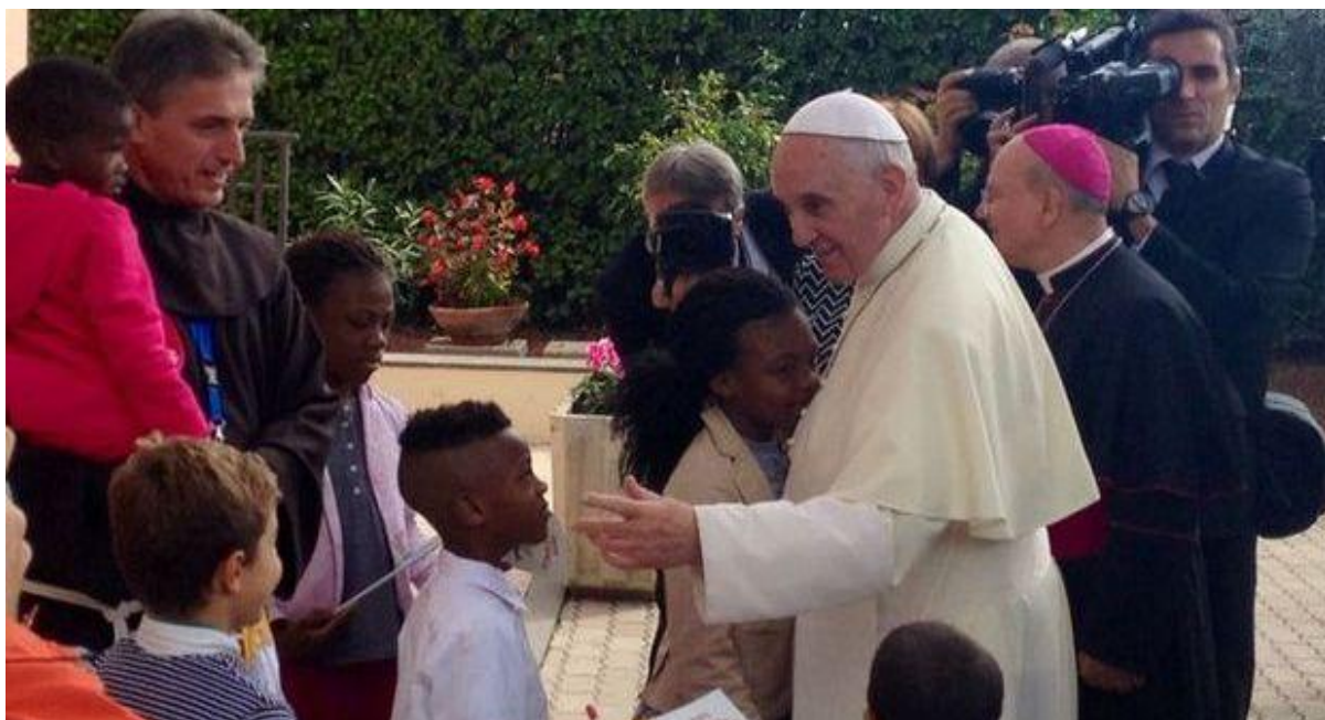
Paven modtages af franciskanerbrødre OFM med børn. Børnene spillede en stor rolle dagen igennem