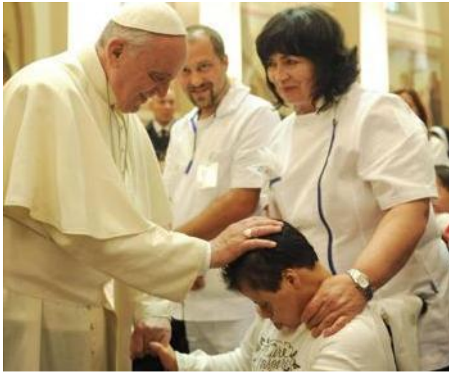
Pave Frans velsigner et handicappet barn i l'Istituto Serafico