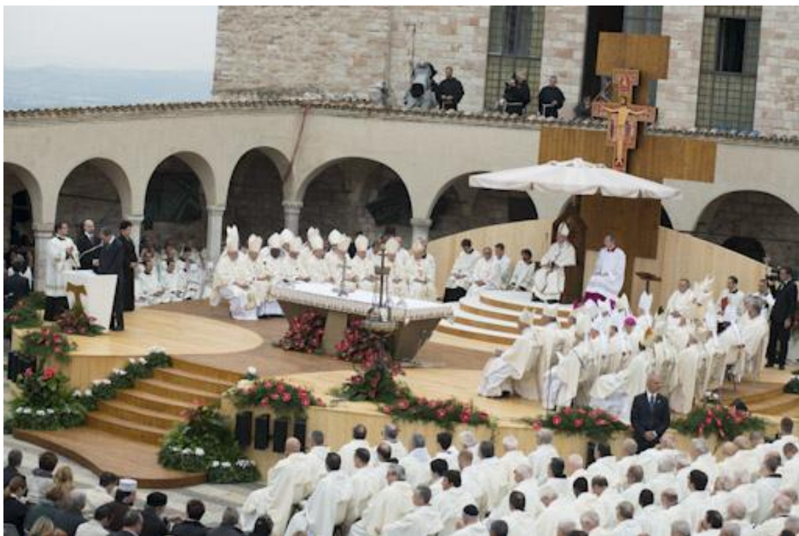
Højmessen på Piazza Inferiore d. 4. oktober 2013 Også ledere fra andre religioner deltog på første deltager-række. Der var kun plads til få af Franciskanerbrødrene som medcelebranter, men nogle brødre var idérige og fulgte messen fra Sacro Convento's balkon som det ses