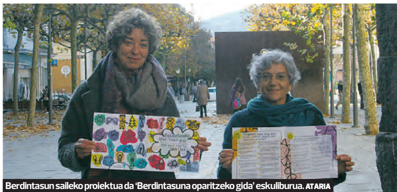
Berdintasun sailako proiektua da 'Berdintasuna oparitzeko gida' eskuliburuua. ATARIA