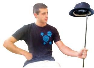
OIER URKOLA AROTZENA GAZTEA