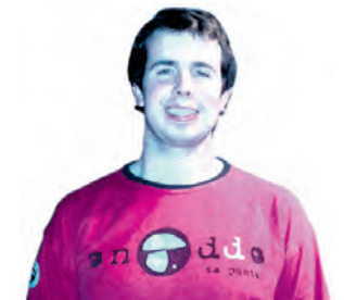
ION BELOKI HARITUZ-EKO KIDEA

Mihian egiten digu euskarak kilika eta gure odolean hor dabil korrika baina euskararen eguna aitzaki jarrita batzuk gustura daude behin erabilita egin euskararekin egunero zita