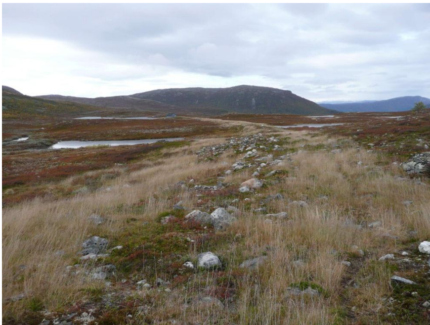
Pumpeleidningstraseen med svak sti. Pumpehuset i bakgrunnen, Foto: Tom Dybwad

Ved Fv 53 følgjer grensa for naturreservatet oversida av denne. Statens vegvesen eig noko av grunnen ovafor vegen innanfor naturreservatet. Vegen er eit anlegg som var bygd då Kvitingmorki naturreservatet blei oppretta i 1999, og naudsynt vedlikehald i tilknytning til Fv53 (t.d. steinreinsking, rydding av vegetasjon og vedlikehald av steinmurar) er tillate (jf verneforskrifta pkt V, 6). Nye tiltak/inngrep og større utbetringsarbeid i tilknytning til Fv53 må søkjast om etter verneforskrifta.