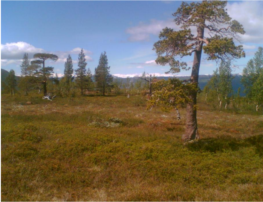
Skog i dei øvste delane av naturreservatet.