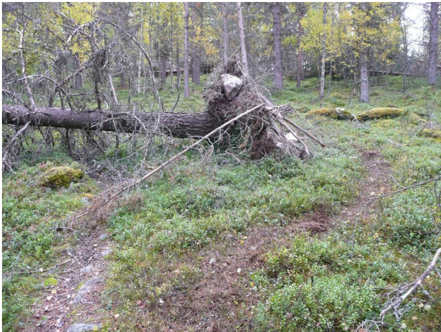
Her er det betre å leggje stien om enn å sage seg gjennom eit stormvelta tre.

Dei tre hovudstiane (sjå stiar markert med gult i vedlegg 3) vil ha høgare prioritert m.o.t. rydding, vedlikehald og tiltak enn dei andre stiane i naturreservatet.