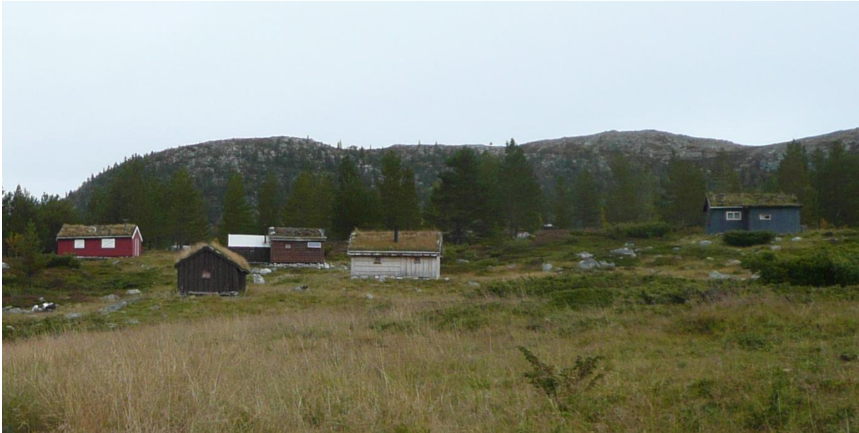
Bygningsmiljøet på Morki framstår som tradisjonelt.