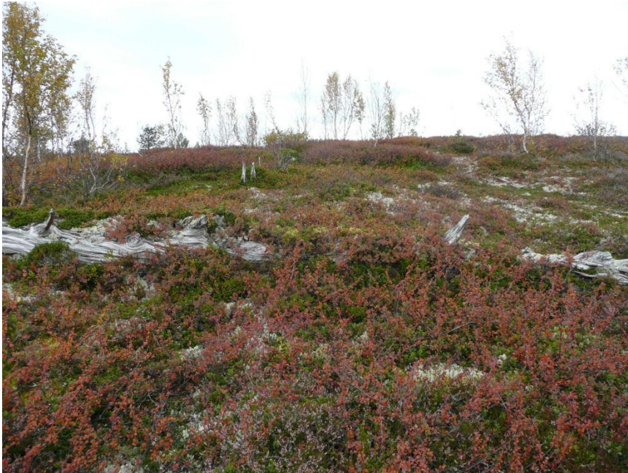
Restar av ei gamal furu, i ferd med å bli overgrodd, ca. 900 moh.

aldersmålingar som tydde på kraftig hogst fram til midten av 1800-talet. Den dominerande hovudgenerasjonen opp til 600 m o.h. var på rundt 130 år (Moe 1992). Frå 800 til 1000 moh. har det vore mindre hogst, og skogen her er eldre enn lenger nede. Det eldste treet som vart målt, var 455 år gammalt. Øvst i skogen der det i dag veks småskog, kan ein finne restar (stammer) av gamle, store furutre i bakken, noko som syner at furuskogen må ha gått høgare før. Desse trea bør C14-daterast.