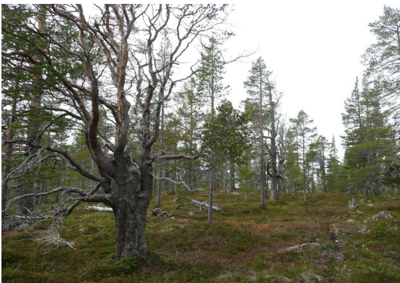
Å ta vare på gamal barskog er kanskje det viktigaste bevaringsmålet i Kvitingsmorki.

Sidan kulturminne ikkje er formulert som ein del av verneformålet, vert det ikkje utarbeidd eigne bevaringsmål for dette. Det særeigne ved kulturminne i naturvernområde er at det her ligg særleg godt til rette for å ta vare på kulturminna i deira opphavlege miljø, utan forstyrrende inngrep frå nyare tid. Det vil såleis vere eit mål å ta vare på viktige kulturminne som kulturminnestyresmaktene peikar på innafor rammene av verneforskrifta.