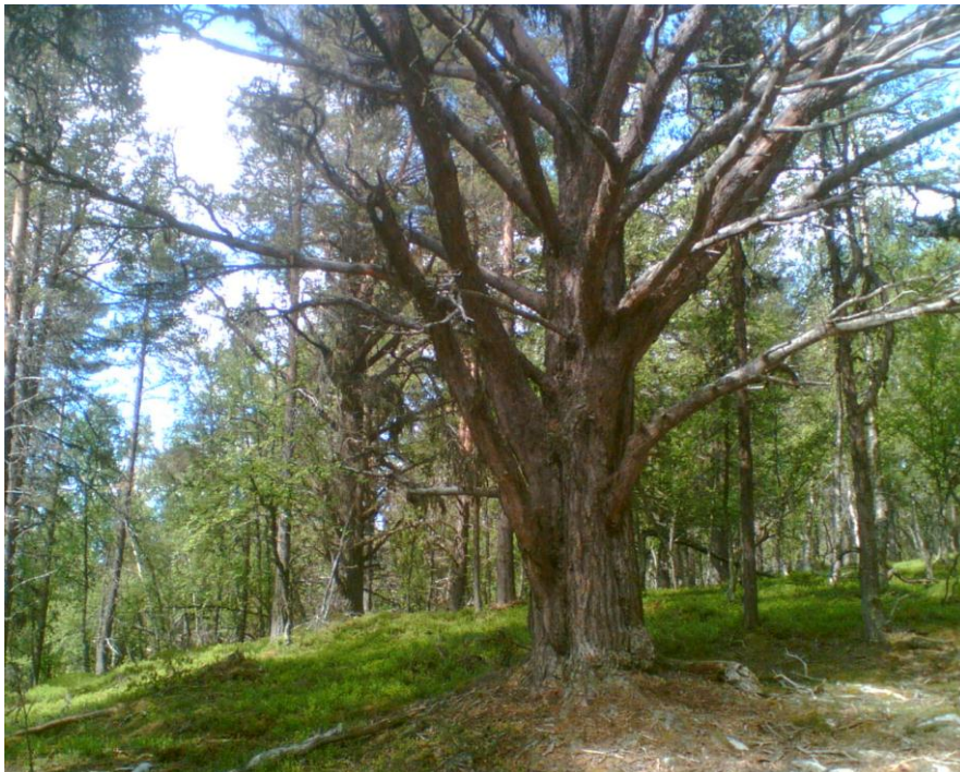
Figur 3. Parti frå furuskogen i høgareliggjande del av Kvitingmorki naturreservat.