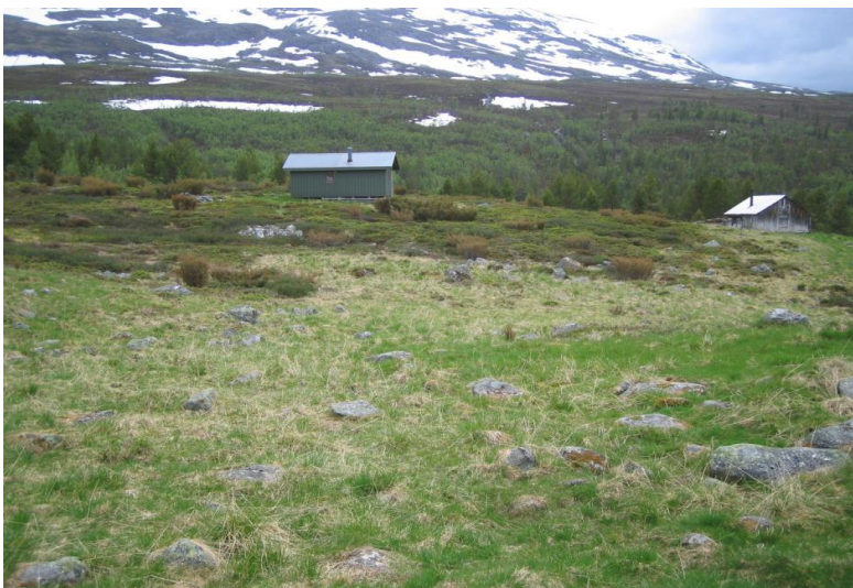
Figur 4. Delar av stølsvollen på Kvitingsmorki. Lyng dominerer i utkantane, medan det framleis er grasdominans i eit område sentralt på stølsvollen.

Stølsvollen på Kvitingsmorki og husmannsplassen ved Sagi er prega av landbruksdrift langt tilbake i tid. Det er ikkje gjort undersøkingar av eventuelle biologiske verdiar på desse lokalitetane, men det er vurdert at det er eit potensiale for artsrike samfunn av beitemarksopp på Kvitingsmorki, og slåttemarksflora og -fauna i slåttemarka på husmannsplassen ved Sagi.