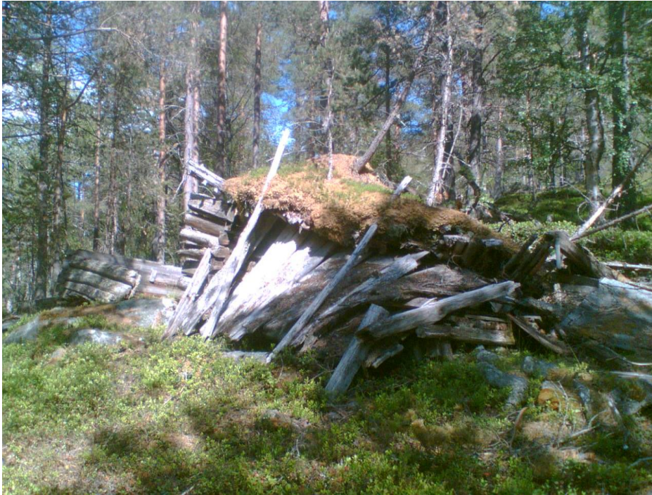
Stova ved Tågi fotografert juni 2012.

Taubana frå Ospeholene bygd i 1956 hadde sitt øvste punkt ca. 500 moh nett innafor verneområdet, medan ned til fjorden er utanfor. I dag står berre restane att etter taubana.