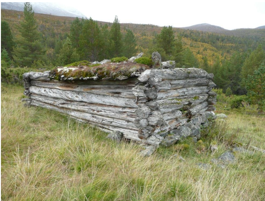
Fylkesmannen har gjeve løyve til å setje i stand dette uthuset på Morki.

Det er fleire restar av bygningar og andre gjenstandar i verneområdet som vitnar om stølsdrift og skogbruk langt tilbake i tid. Dei mest aktuelle er tømmerkoia om lag halvvegs mellom Sagi og Kvitingsmorki (kalla stova på Tågi), det siste uthuset/fjøset på Kvitingsmorki og restane etter saga ved Sagi,. Grunneigar er særleg interessert i å restaurere desse kulturminna.