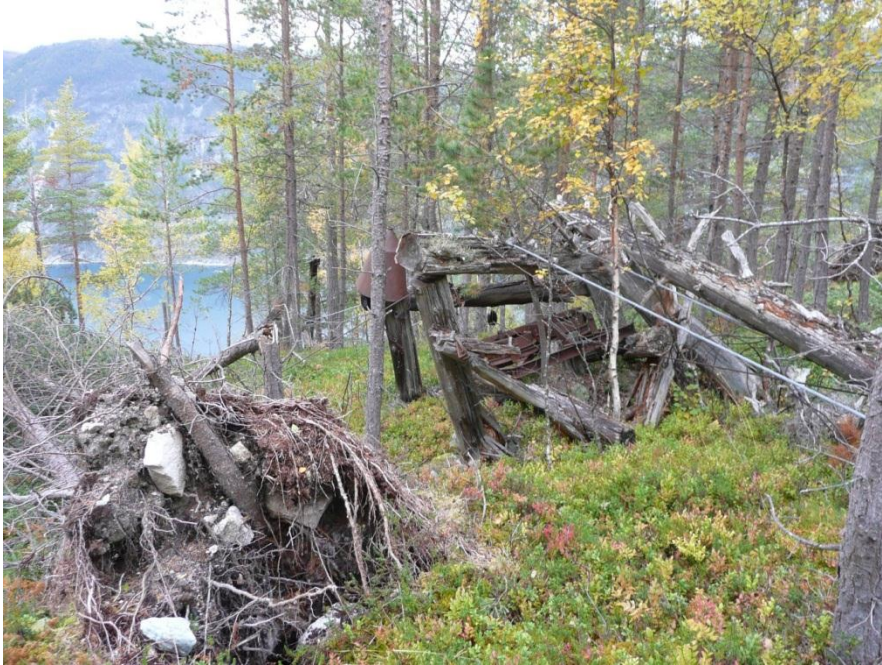
Restar etter taubana for tømmer ved Ospeholene.

Nokre restar etter tidlegare aktivitet, t.d. taubana ved Ospeholene, bør etter vårt syn berre bli ståande til nedfalls, som eit minne, medan andre restar etter tidlegare aktivitet bør ryddast opp i.