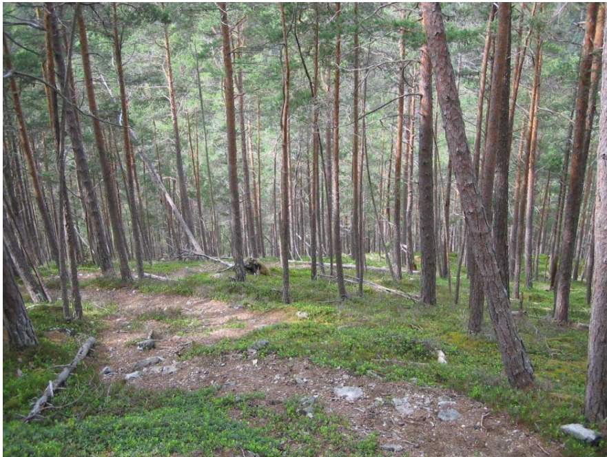
Figur 2. Parti frå furuskogen i nedre delar av Kvitingmorki naturreservat.

Tidlegare stølsdrift på Kvitingmorki har pressa skoggrensa ned til ca. 700 moh. Særleg i dei nordvende liene frå Langedøla og aust til Sagelva mellom 600 og 800 moh. er furuskogen sterkt oppblanda med bjørk. Dette kjem truleg av at bjørka har regenerert betre enn furu etter at hogsten vart avslutta og det vart mindre beitedyr i området (Moe 1994). Stormen «Dagmar» jula 2011 bles over ende ei stor mengde furutre særleg i dei midtre høgdelaga av naturreservatet.