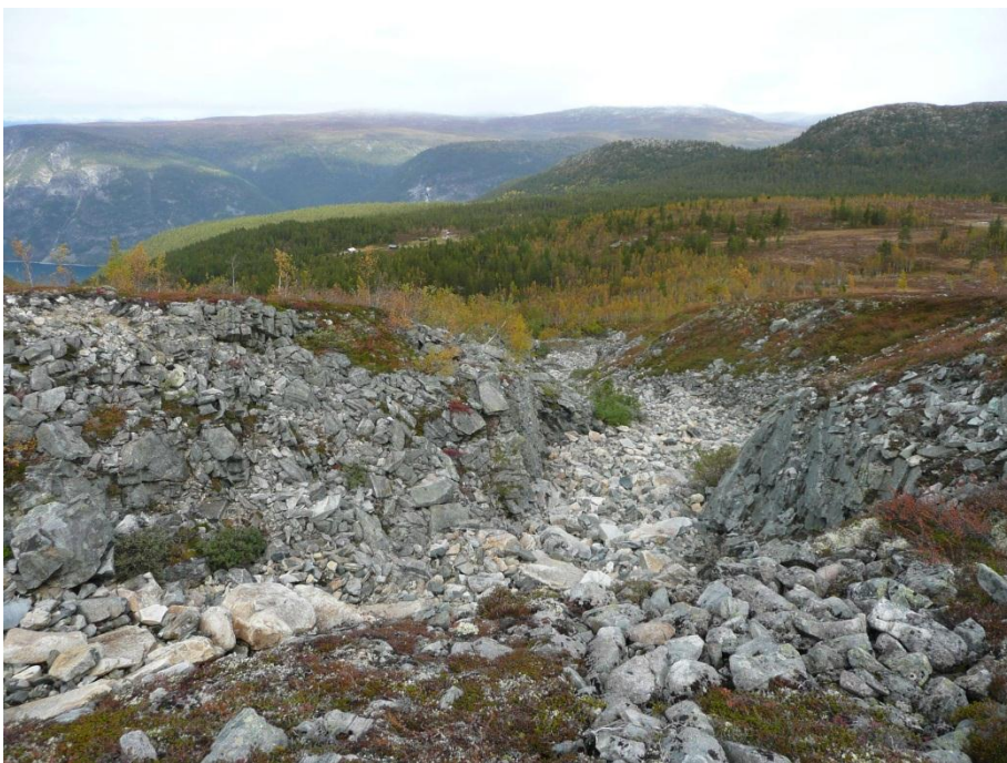
Elvejuvet under Viervatnet, utan vatn.

Ved Viervatnet, som er eit vatn som vert nytta til vasskraftproduksjon, har Østfold Energi eit pumpehus der det også er innretta for overnatting. Her står også ein om lag 6 m høg mast. Traseen for pumpeleidninga (ser ut som ein grusveg som er tilbakeført til naturen) kjem frå Storevatnet, går frå grensa i aust fram til pumpehuset. Denne har ei lengde på om lag 800 meter inne i naturreservatet. Bruken av Viervatnet til vasskraftproduksjon gjer at det ikkje er naturleg avrenning i elvefaret frå Viervatnet (øvste del av Sagaelvi).