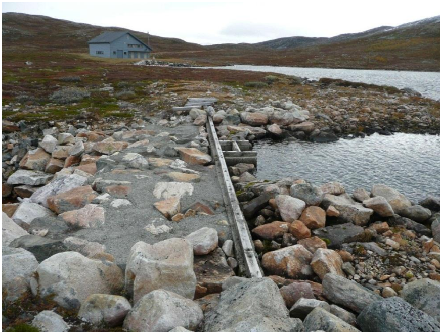
Demninga i Viervatnet med pumpestasjon og mast i bakgrunnen.