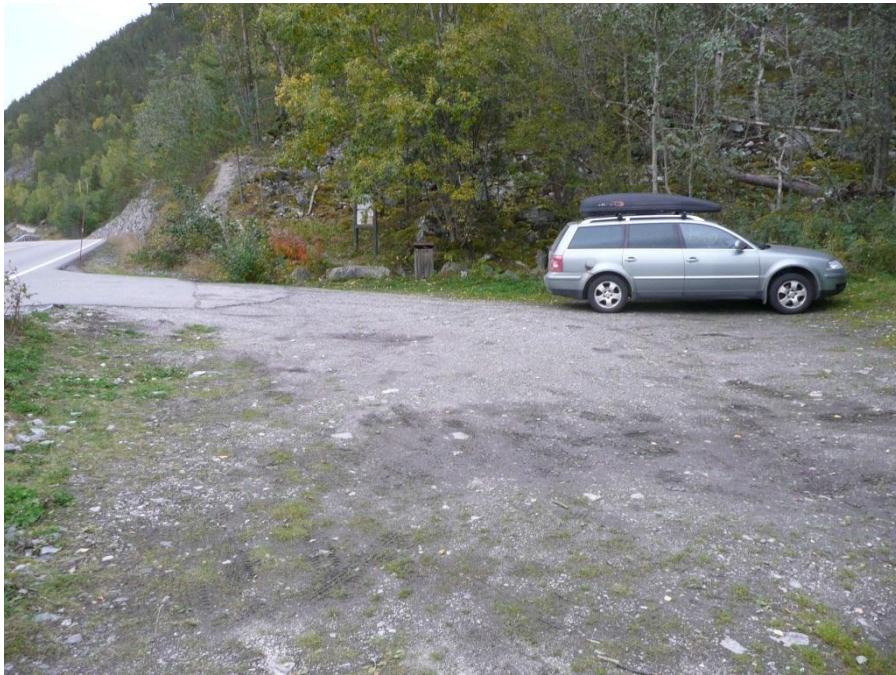
P-plass med infotavle og bosspann.

Parkeringsplassen ved Fv 53 ved Sagi har ei naturleg avgrensing slik han ligg i dag, med plass til 6-7 bilar. Mesteparten av P-plassen ligg innanfor naturreservatet, og det er ingen andre stader som peikar seg ut for parkering. Sjølv om motorferdsel er forbode etter verneforskrifta, ser Fylkesmannen det som det einaste tenlege at parkering på denne etablerte P-plassen er å rekne som lovleg. Det er ein informasjonsplakat om Kvittingsmorki naturreservat her, og det står også eit bosspann her.