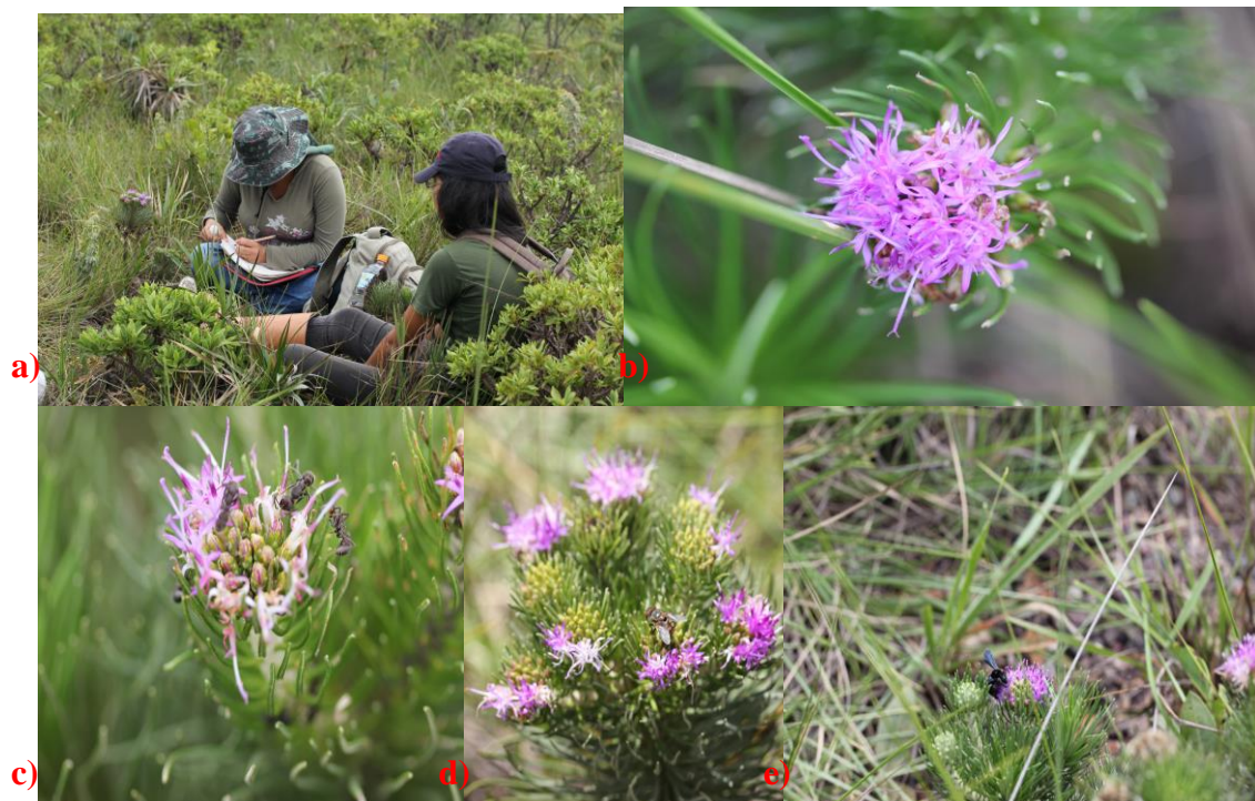
Figura 2-estudo de campo de polinizadores de L. ericoides Mart. na EEJBB. a) Observações diretas dos visitantes florais (b) Inflorescência de L.ericoides com várias flores abertas, c) Formigas; d) Díptero e e) Vespa

Uma aranha também foi observada somente nas proximidades dos botões florais.