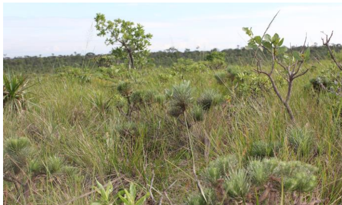
Figura 1-Área de estudo de uma população de L.ericoides na Estação Ecológica do Jardim Botânico de Brasília.

O presente estudo está sendo realizado na área da Estação Ecológica do Jardim Botânico de Brasília- EEJBB. Uma pequena população com 728 indivíduos de L. ericoides encontra-se localizada na EEJBB mais especificamente no Morro do Cristo Redentor (15° 54' 52'' S e 47° 53' 28,3'' W) (Figura1), a uma altitude de 1.120 metros. É uma área de campo sujo, onde o solo é bastante arenoso.