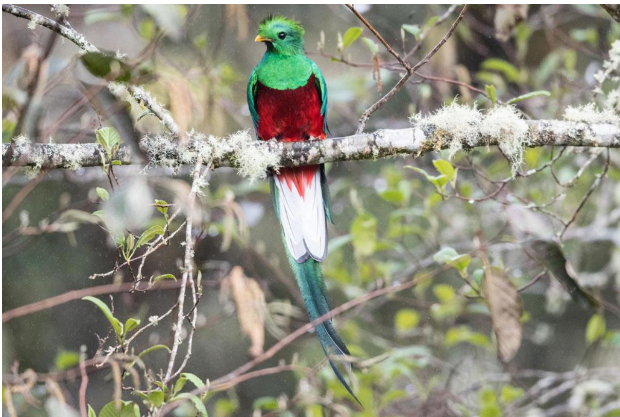
Den otroligt vackra Resplendent Quetzal.

maten eller sörlade sockervatten. En plantering med låga äppelträd kompletterade det hela.