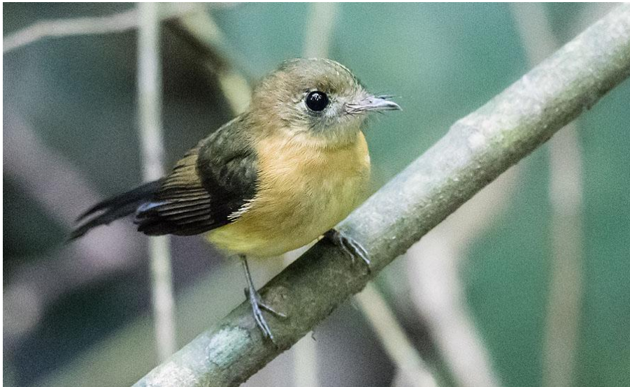
Black-tailed Myiobius.