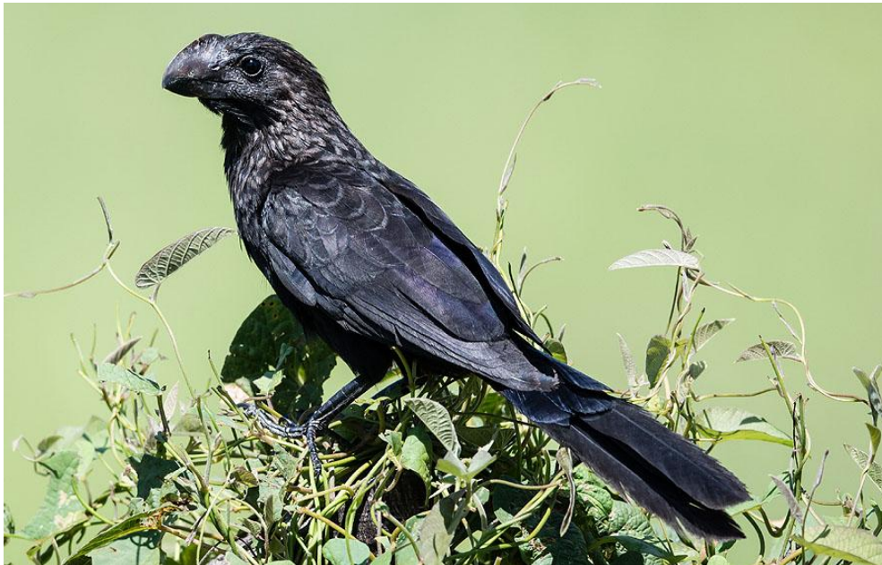
Smooth-billed Ani.