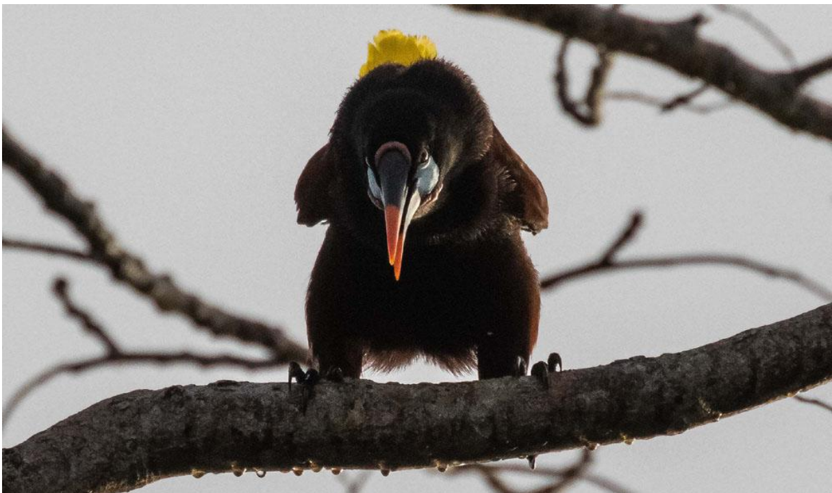
Montezuma Oropendula i lektagen.