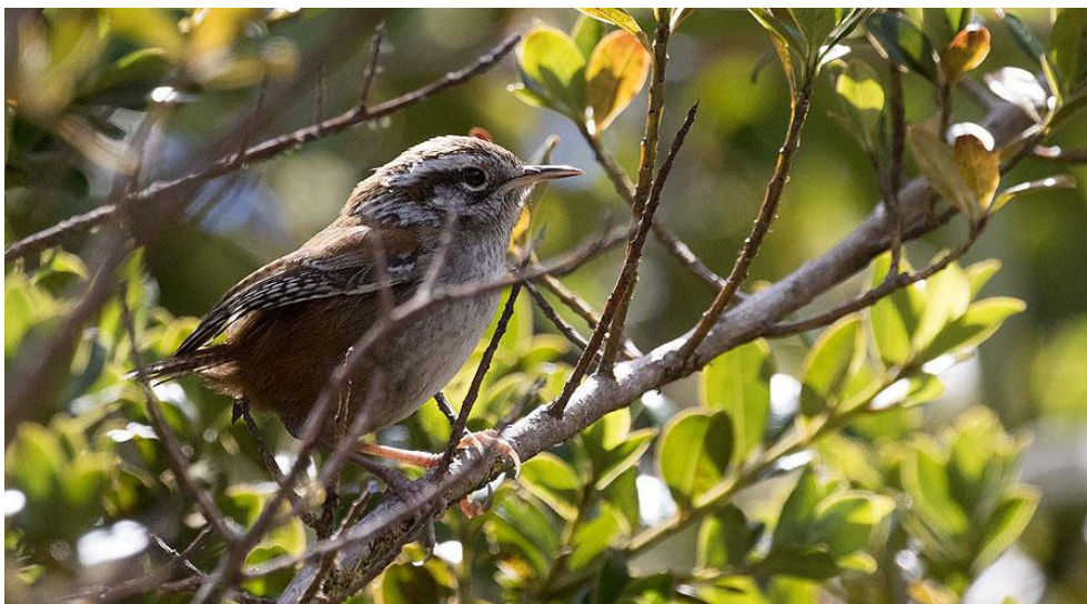
Timberline Wren.