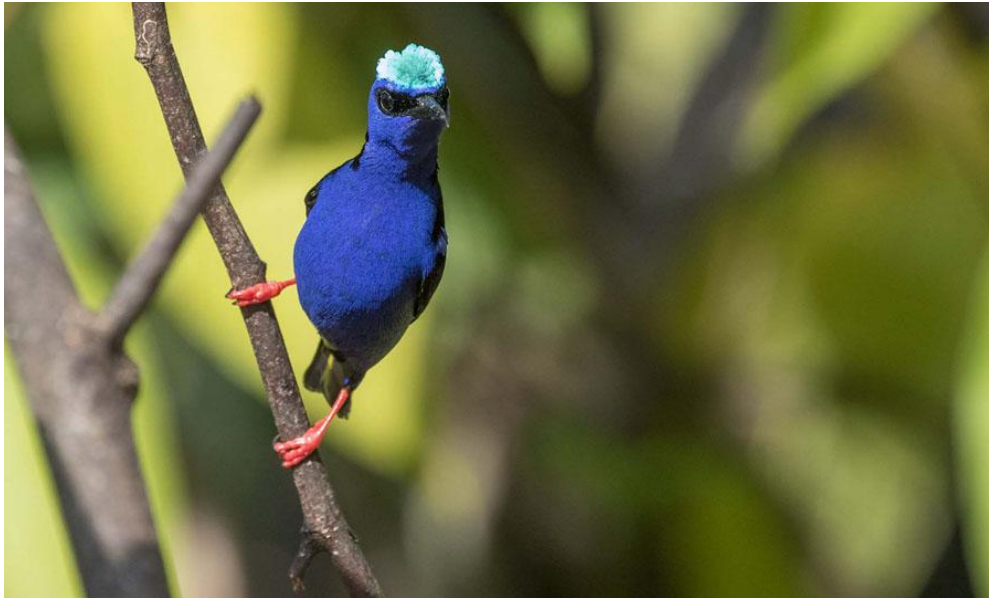
Red-legged Honeycreeper.