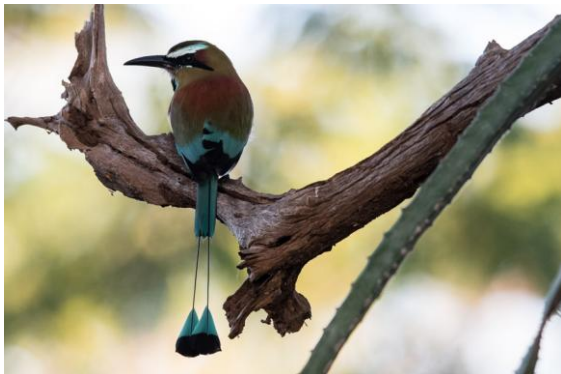
Turquoise-browed Motmot i La Ensenada.

När lunchen var avklarad flyttade vi några kilometer till lodgen Linda Vista del Norte, som erbjuder en magnifik utsikt över vulkanen och sjön. Efter en siesta med bad i poolen för några deltagare, gjorde vi senare på eftermiddagen en ny vandring längs en gammal väg. Detta inbringade lokalens specialiteter Keel-billed Motmot och Bare-crowned Antbird förutom Thicket Antpitta och Nightingale Wren. I skymningen såg vi både Short-tailed Nighthawk och Common Pauraque.