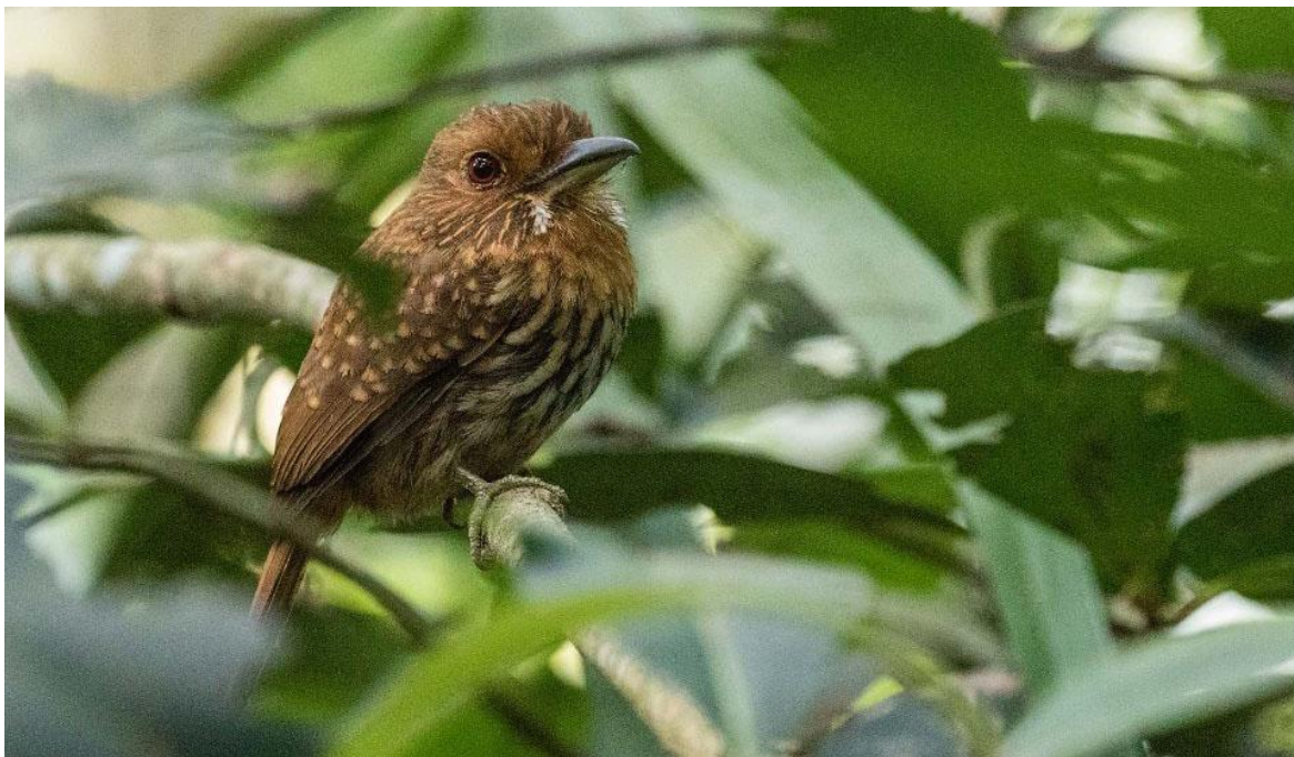
White-whiskered Puffbird i Carara.

efter några speciella mangrovearter. Först gick vi längs en väg vid sidan av mangrovesnår och fortsatte sedan längs en nerlagd smalspårig järnväg. Vi hittade några Prothonotary Warblers och Mangrove Warblers vackert lysande i gult. Dessutom fick vi helt oväntat en kalasobs av den sällsynta Lesser Ground-Cuckoo. Det firade vi med läsk och kaffe på en restaurang nere vid den stora hamnen, där det blåste rejält. På grund av det låga tidvattnet var en stor del av stranden torrlagd. Det var gott om Laughing Gulls (sotvingad mås) och Royal Terns. Trots avståndet hittade vi även några Elegant Terns i flocken.