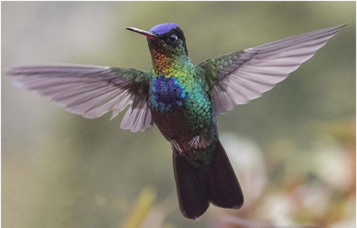
Fiery-throated Hummingbird.