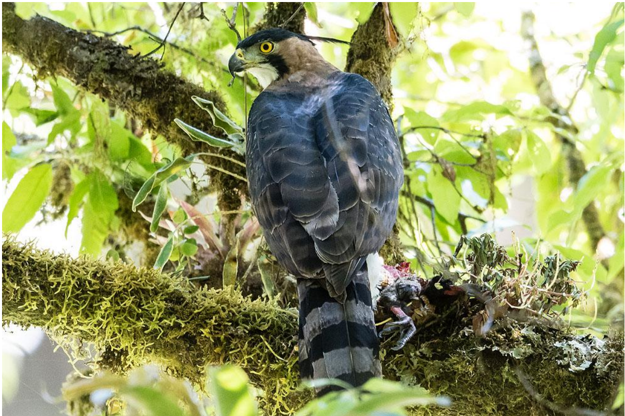
Ornate Hawk-Eagle.