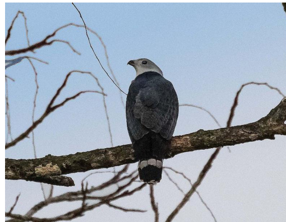
Gray-headed Kite i La Selva.

Dagens slutmål var det privata reservatet La Selva som ligger på låglandet på den karibiska sidan av Costa Ricas bergskedja. Dit kom vi när det ännu var skådarljus, och sedan vi försetts med plastarmband, kände vi oss som en del av forskarkollektivet. Efter att i eftermiddagsljuset ha fotograferat en liten flock halvtama Crested Guan som fanns vid besökscentret, installerade vi oss i några av parkens vackert belägna stugor. I skymningen på vägen till matsalen vid besökscentret såg vi Pied Puffbird och den spektakulära Rufous-tailed Jacamar, två arter som är typiska för låglandet på den karibiska sidan. Från Great Tinamou hördes kraftfulla vibrerande visslingar.