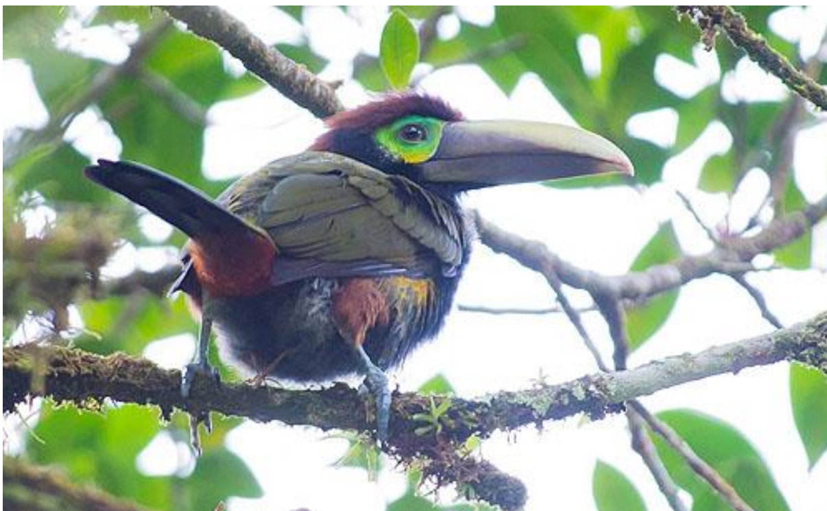
Yellow-eared Toucanet i Arenal.

en bräcklig färja för mindre bilar. I ett litet hus bodde där en familj med några kor och en flock blandade myskankor och höns. Vi var nu så nära Nicaragua att vi kunde se in i grannlandet. Med viss svårighet upptäckte vi en Lesser Yellow-headed Vulture på långt håll. Flera olika hägrar fanns i området och vi såg också en Snail Kite. Både White-throated och Gray-breasted Crake hördes.