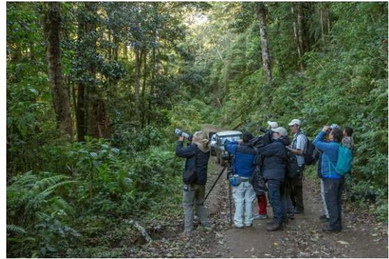
Vi ser våra första Quetzaler i regnskogen ovanför lodgen La Amistad.

Efter lunch och en kort siesta begav vi oss ut på en promenad i lodgens närområde. Thick-billed Euphonia och Flame-coloured Tanager hälsade på vid den utlagda frukten utanför receptionen. På vandringen fick vi bland annat se Purple-crowned Fairy och Snowy-bellied Hummingbird. Den gnisslande Black-faced Solitaire visade sig. Dessutom såg vi Olivaceous Woodcreeper och Pale-billed Woodpecker. Pygmy Squirrel och Red-tailed Squirrel kunde vi också notera innan vi återvände till middagen klockan sex. Nattvandrarerna såg, förutom de två arterna opossum, en Northern Olingo med sin långa svans!