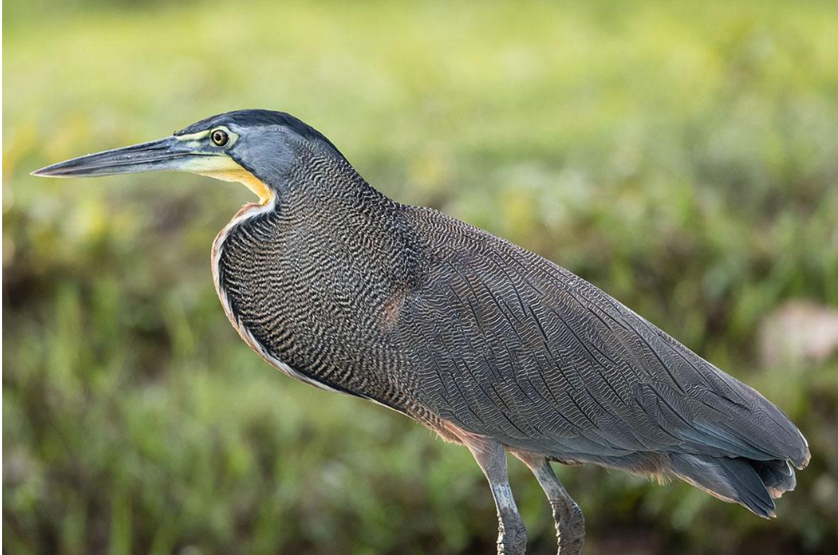
Bare-throated Tiger Heron.