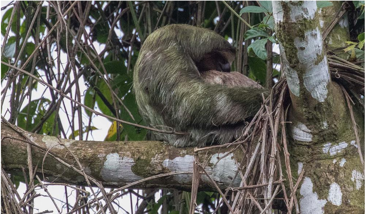
Brown-throated Sloth med en unge i famnen.