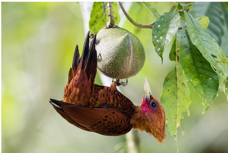
Chestnut-colored Woodpecker.