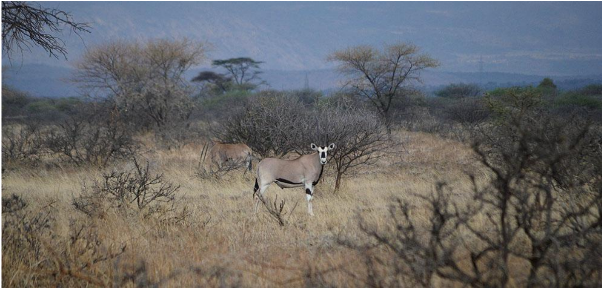
Beisa Oryx.