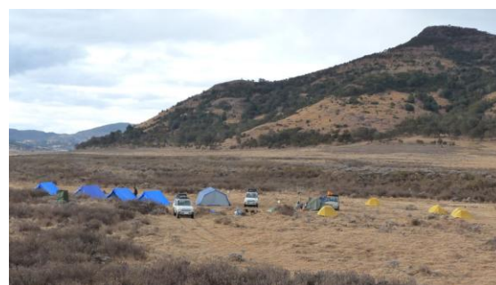
Lägret i Dinshodalen där vi vaknade med flera frostgrader på morgonen.

Campan uppsatt mitt i Dinshodalen så vi var omgivna av Mountain Nyala, Reedbucks och stora vårtsvin.