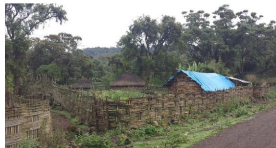
By i Bale Mountain.

Framme vid lägret på 2 600 meters höjd hade temperaturen sjunkit till 17 grader, vi tog en kort promenad och hörde Abyssinian Catbird och såg Ethiopian Siskin och många lövsångare.