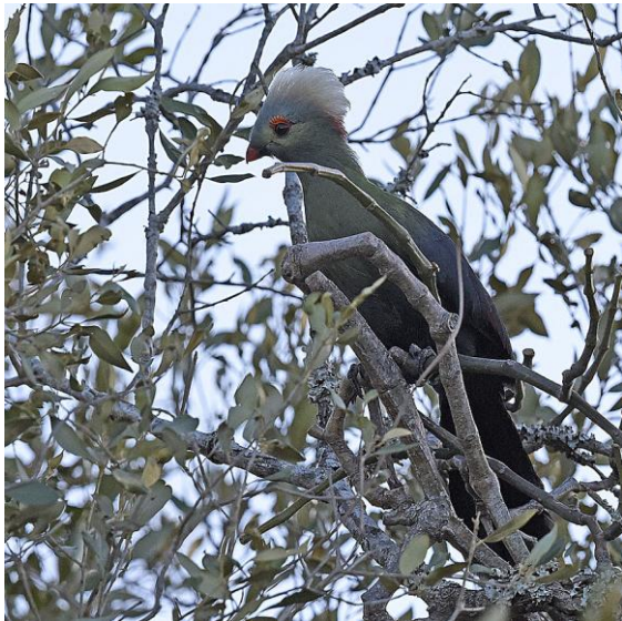
Ruspoli's Turaco.

Sedan följde en ganska händelselösresa med en trevlig lunch från vilken vi såg ett par Lesser Kudu. Gjorde några stopp och plockade upp Black-cheeked Waxbill och Acacia Tit.