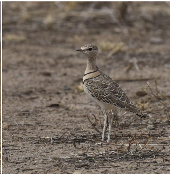
Wattled Crane och Double-banded Courser.