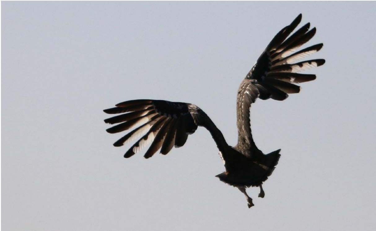
Heuglin's Bustard. aviFaunas andra fynd någonsin.

stora lavablock och på andra ställen stoft eller black soil. På avstånd finns det berg och Kopjies och vår väg söderut gick mot en av dessa. Första endemen att ramla in var Donaldson-Smith's Sparrow Weaver. I busktopparna satt omväxlande Taita och Somali Fiscals.