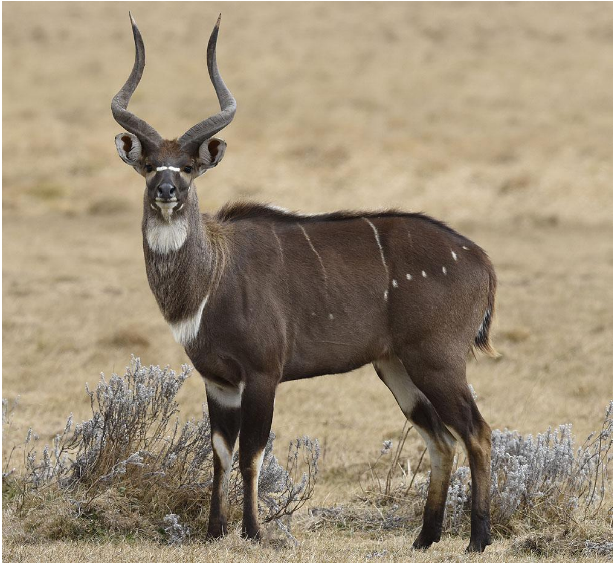
Mountain Nyala. Endemisk för Etiopien.