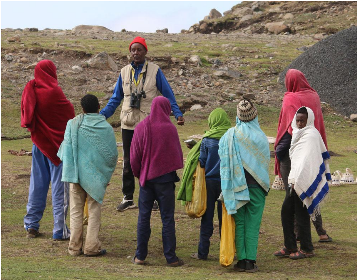
Brook undervisar.