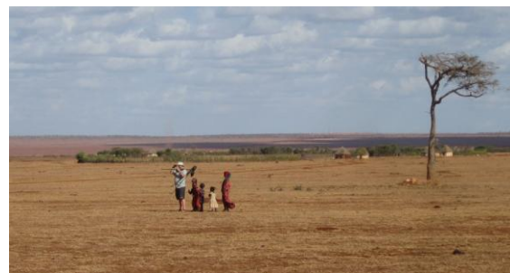
Var är lärkan?

ensam länge här om man går ute med kikare ur en bil, lokalbefolkningen vet vad det rör sig om. Med hjälp av några smågrabbar, då vår riktiga guide inte dykt upp, började vi leta lite planlöst över ett ganska stort område, det var oerhört torrt och i princip inget gräs och bara Isabellastenskvättor. Men nu dök guiden upp och då visste han var lärkan fanns för 3 dagar sedan... på väg dit börjar några, typ, herdar vinka femhundra meter i rätt riktning... Fågeln är hittad och med tänjda steg marscherade vi ditt... och där var den! Archer's Lark, Lieben populationen är under 100 par, en ganska snygg lärka, faktiskt, vi fick bra obsar och fotograferna fina bilder. Sedan in till Negele där vi tog in på Turaco Hotel.