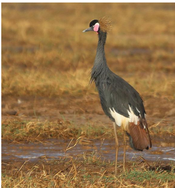
Svart krontrana.

hel del gamar seglade runt i luften ovanför oss upptäckte vi tre flodhästar, förväntade, i en av vattensamlingarna. Där stod också en goliathäger. Det var stora avstånd ut över slätten, varmt och soldallrigt, men vi såg några ullhalsstorkar, hörde rödstupig piplärka och såg några bruna kärrhökar patrullera. I berget bakom oss häckade ett stort antal gamar av de två vanligaste arterna här, White-backed och Rüppell's.