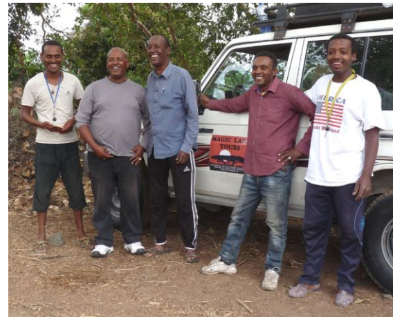
Vår personal under resan.

Innan vi körde till campen skådade vi lite vid Jemma floden och vid en liten bäckravin lite längre bort, här kunde vi addera Foxy Cisticola, Red-billed Pytilia och Vinaceous Dove till Listan. Campen trevligt belägen i en lite dunge i utkanten av en by.