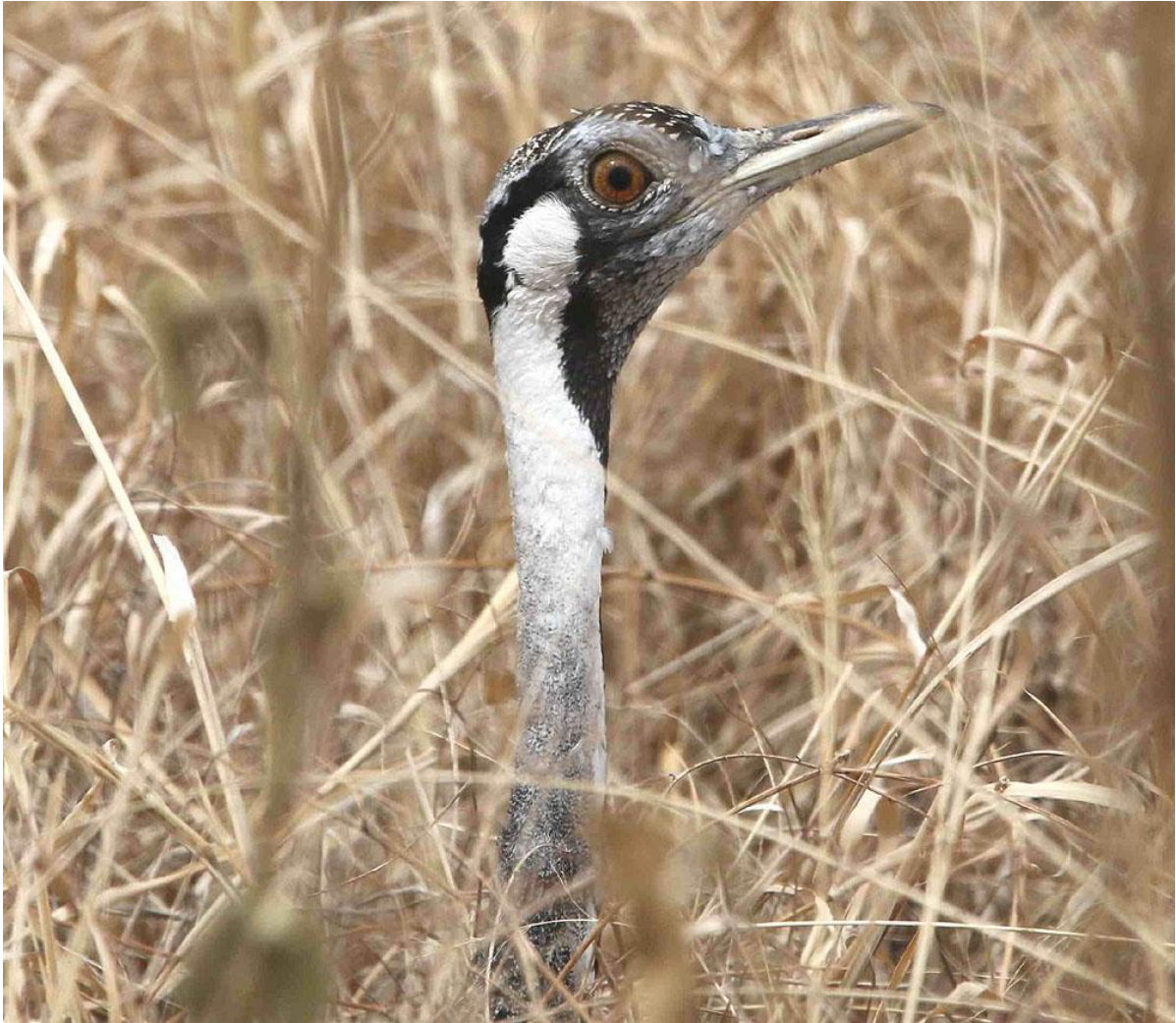
Hartlaub's Bustard.