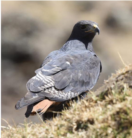
Augur Buzzard.

funkade bra, tvagning i floden som nu mest var en lite rännil.