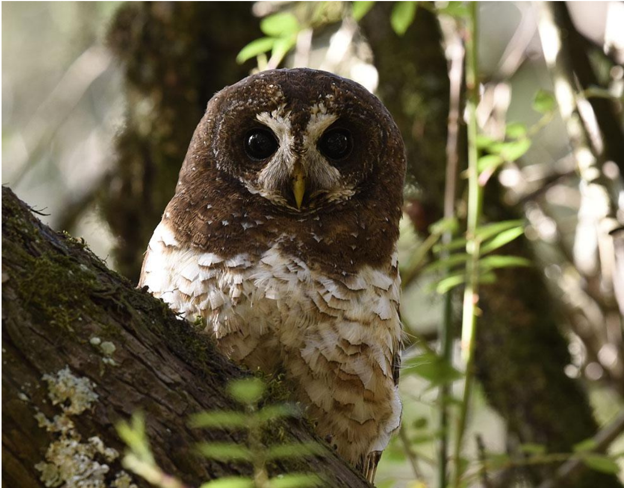
African Wood Owl.