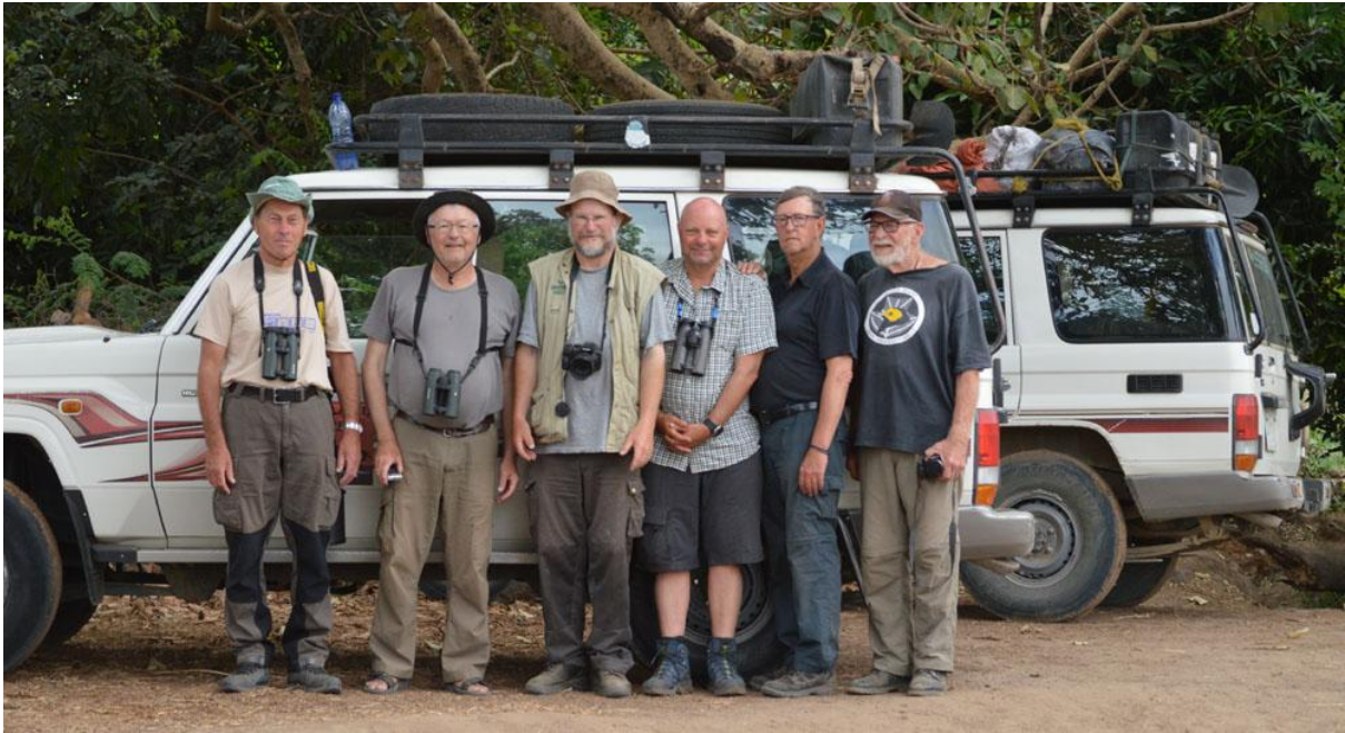
Hela gänget.