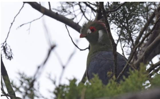
Donaldson's Turaco.

Vilken morgon! Först moskéns böneutropare tidigt ett par gånger som vanligt... sedan körde den koptiske prästen ut sitt budskap i högtalare från ca 05... båda väldigt nära hotellet.