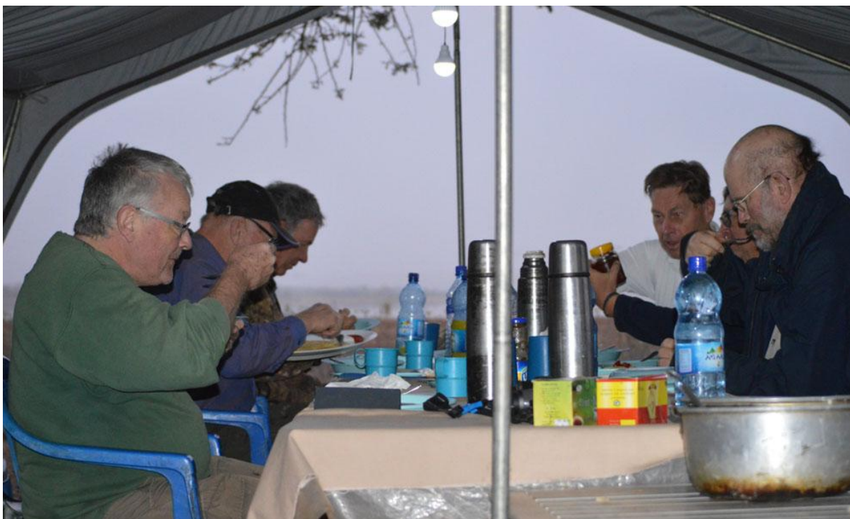
Middag vid Lake Bojo alltid välkommet och utsökt!

hel del gamar seglade runt i luften ovanför oss upptäckte vi tre flodhästar, förväntade, i en av vattensamlingarna. Där stod också en goliathäger. Det var stora avstånd ut över slätten, varmt och soldallrigt, men vi såg några ullhalsstorkar, hörde rödstupig piplärka och såg några bruna kärrhökar patrullera. I berget bakom oss häckade ett stort antal gamar av de två vanligaste arterna här, White-backed och Rüppell's.