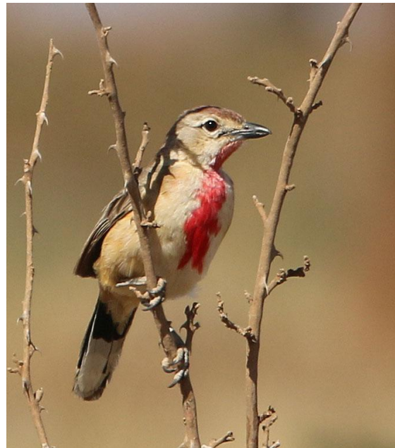
Rosy-patched Bushrike.

i byn i närheten gav ytterligare nya arter och lite välbehövlig motion.