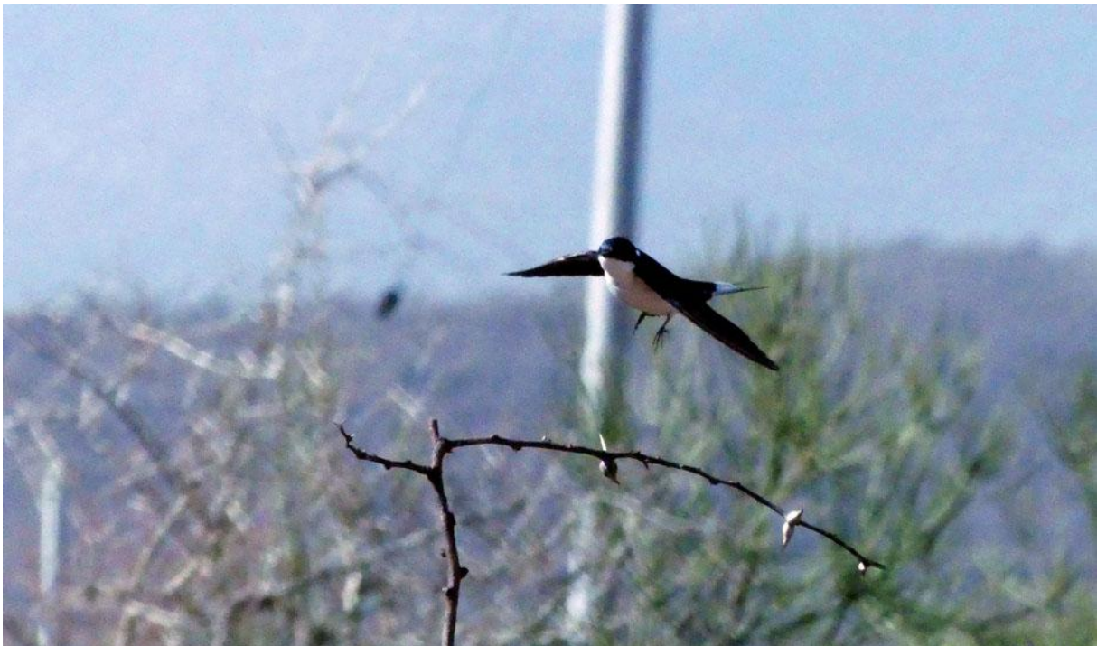
White-tailed Swallow. Exklusiv för Etiopien.