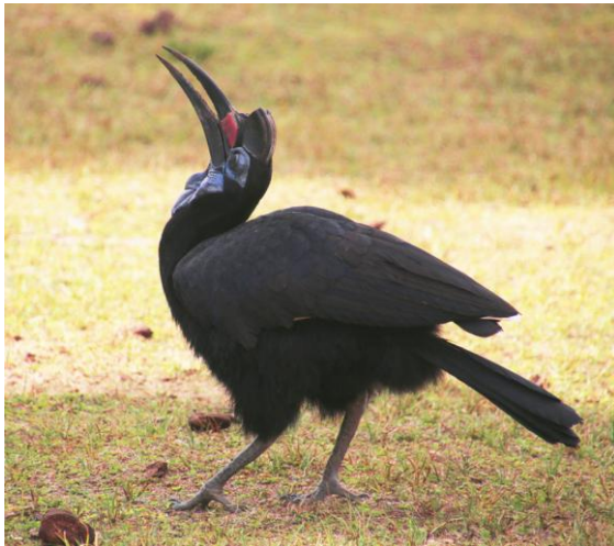
Abyssinian Ground Hornbill.

vände vi tillbaka mot campen för avresa söderut. Ute vid huvudvägen väntade en bil med Henriks väska, och vi tackade och tog avsked av Håkan.