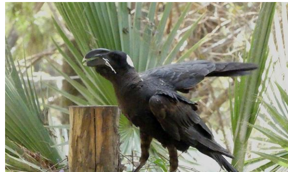
Thick-billed Raven.

På en eftermiddagstur i skogen ovanför University of Forestry kämpade vi först fram en Narina's Trogon och Gree-backed Twinspot, såg här även Abyssinian Ground Thrush, en mörk Great Sparrowhawk och ännu en forsärsla.