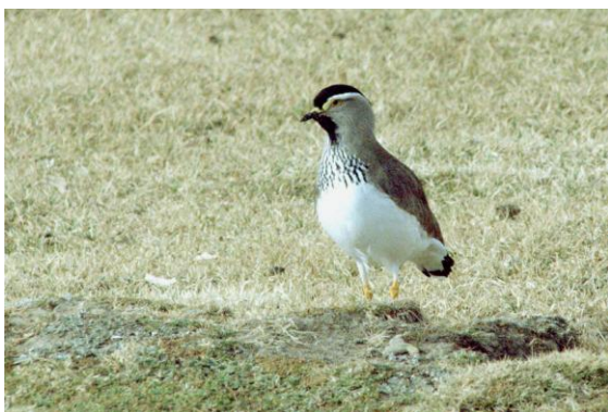
Spot-breasted Lapwing.

Vi vände sedan upp mot berget igen, men innan vi kom upp stannade vi till vid den pittoreska och pastorala byn Rida, runda små hyddor omgärdade av bambustaket påminnande om småländska gårdar.