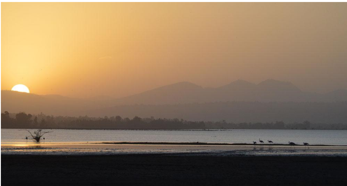
Solnedgång med vårtranor.

Under resan besökte vi många biotoper som berg, skogar och slätter. Resan lägsta punkt var ca 700 meter över havet och den högsta ca 4 200 meter över havet, så föga förvånande varierade också temperaturen från 36 grader som varmast till minus 5 som kallast. Denna variation ger Etiopien en mycket hög biodiversitet och med ett superbt landarrangemang kunde AviFaunas gäster njuta till 100 %.