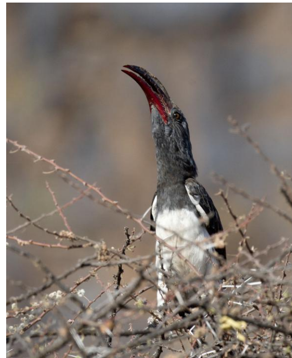
Hemprich's Hornbill gav hals vid Lake Baringo.

Lugn skådning från balkongen. Ormhalsfågel , storskarv , långstjärtad skarv , mangrovehäger , purpurhäger , ägrett-häger , rallhäger , silkeshäger . Hamerkopf , Woodland Kingfisher . Två krokodiler simmade lugnt i vattnet utanför... Barnen badade ändå vid stranden!