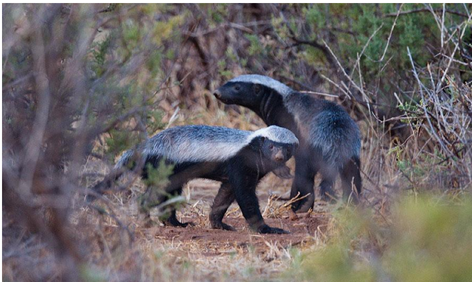
Att se honungsgrävlingar i dagsljus hör inte till vanligheterna. Samburu.