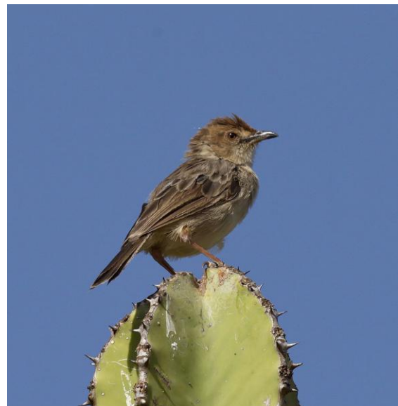
Boran Cisticola . Oansenlig, t o m för en cisticola .

Ivägkorsningen mellan väg A2 och B6 svänger vi ner mot Kirua. Vi kör bara en liten bit och stannar i en grusgrop. Här görs ett nytt försök på Boran Cisticola i en brant sluttning ovanför grustaget. De verkliga entusiasterna klättrade upp en bit i den branta slänten med kandelaber-euforbior och kunde kryssa Boran Cisticola ! Vår vittbereste reseledare Teet fick ett världskryss!