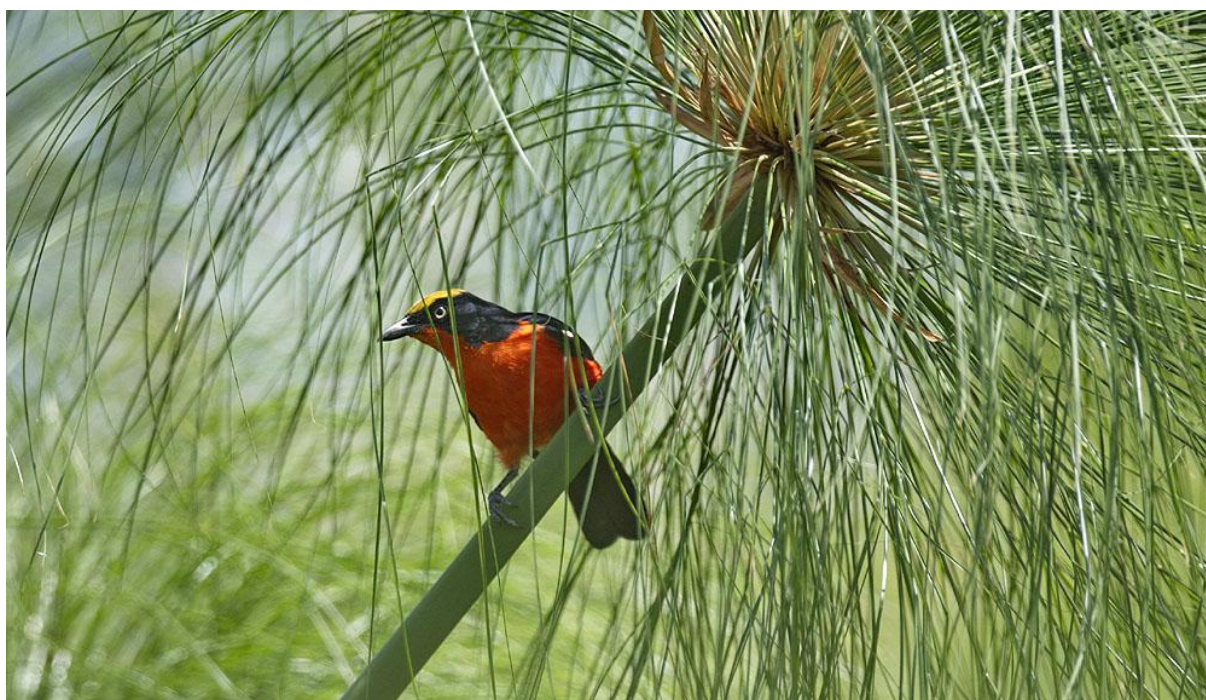
Papyrus Gonolek i sitt rätta element.