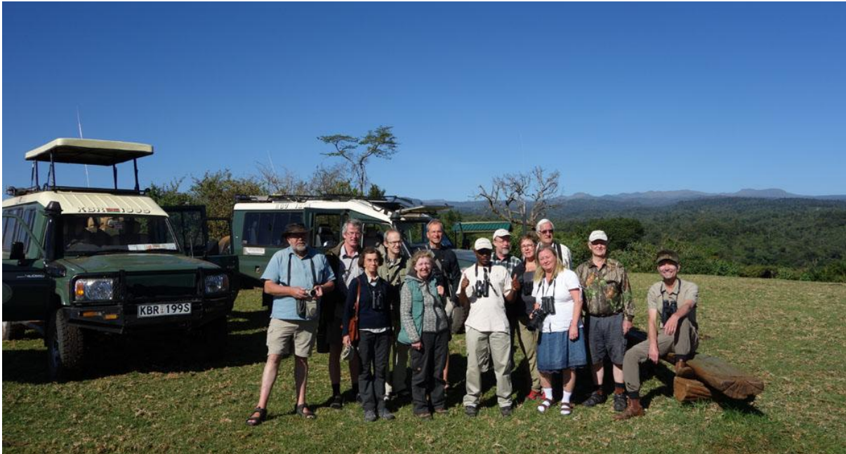
Gruppen uppe i the Aberdares.