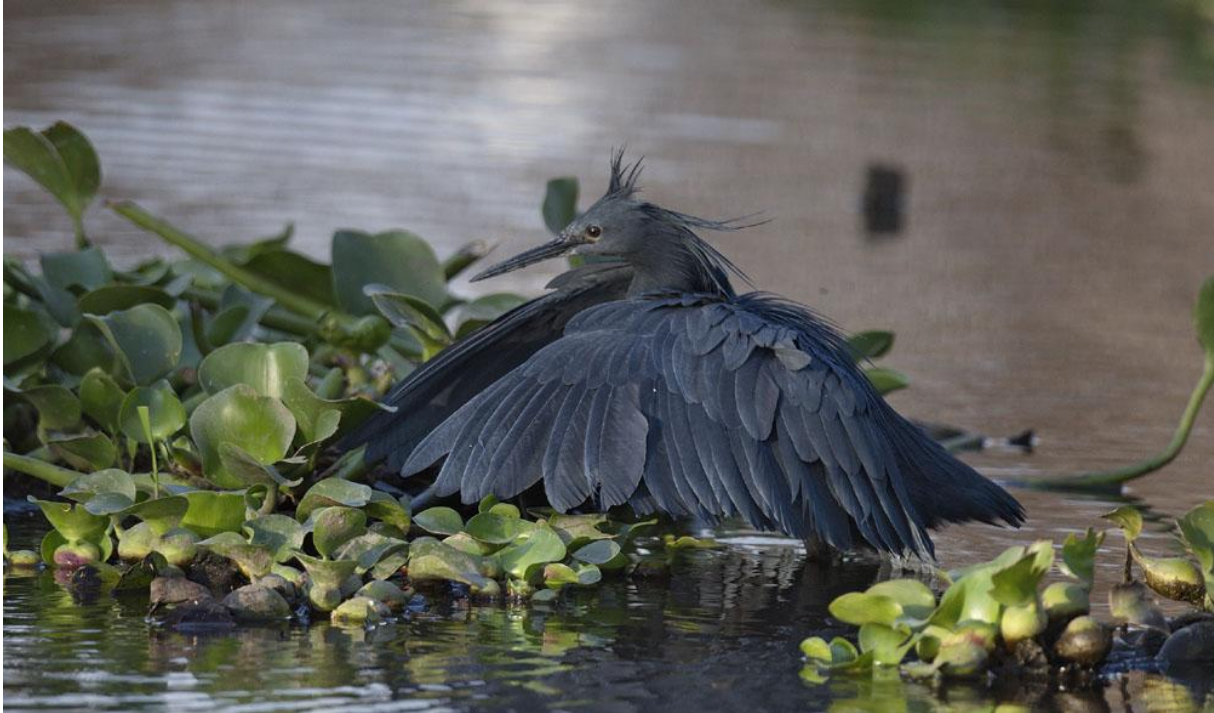
Svarthäger gör sin grej vid Lake Naivasha.