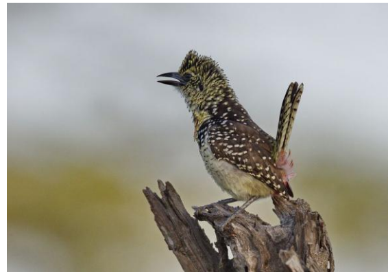
Usambiro Barbet . I stort sett endemisk för Mara/Serengeti.

Upp tidigt. Första frukost med kaffe/te och macka för att senare få äggen... Samling för morgonskådning runt campen. Betat gräs, akacior c:a 3-4 m höga. Dusky Turtle Dove , nunnestenskvätta (hane) och Spot-flanked Barbet är de första arterna vi ser. Usambiro Barbet hörs, spelas och ett par kommer fram och tjattrar något otroligt – låter som en trasig speldosa!