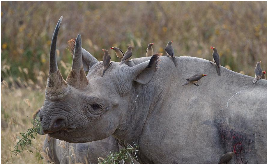
Red-billed Oxpeckers på en spetsnoshörning vid Lake Nakuru.