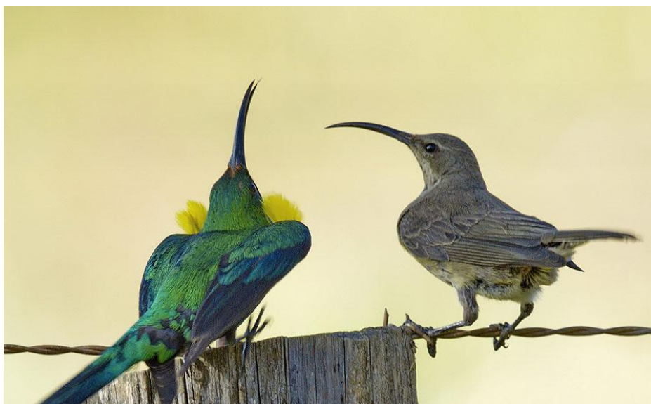
Malachite Sunbird i speltagen.