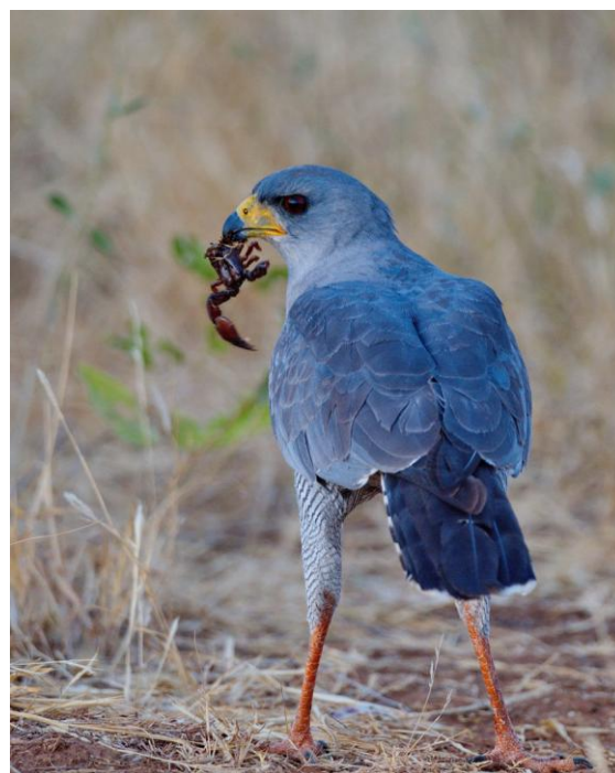
Eastern Chanting Goshawk med snacks.

Väl tillbaka på lodgen får vi se en Black Sparrowhawk dra över. Vi får också reda på att några elefanter ses nere i dalen nedanför verandan. Detta innebar att när vi senare skulle gå till restauranten för att äta middag fick vi inte gå utan vakt. I mörkret hörde vi hur det knakade och brakade i buskagen där elefanterna gick iväg. God middag avåts utomhus och artrope klarades av inne. Promenaden i mörkret och i ficklampsskenet fick vi se en bergnattskärre trycka på stigen, den flög upp, men syntes fint i det svaga lampskenet. ”Hemma” packade vi det mesta för att få mer tid imorgon bitti. Därefter direkt i säng med trädhyraxarnas ”nattsång” i öronen igen. Somnar snabbt efter en härlig dag i bergsregnskogen.