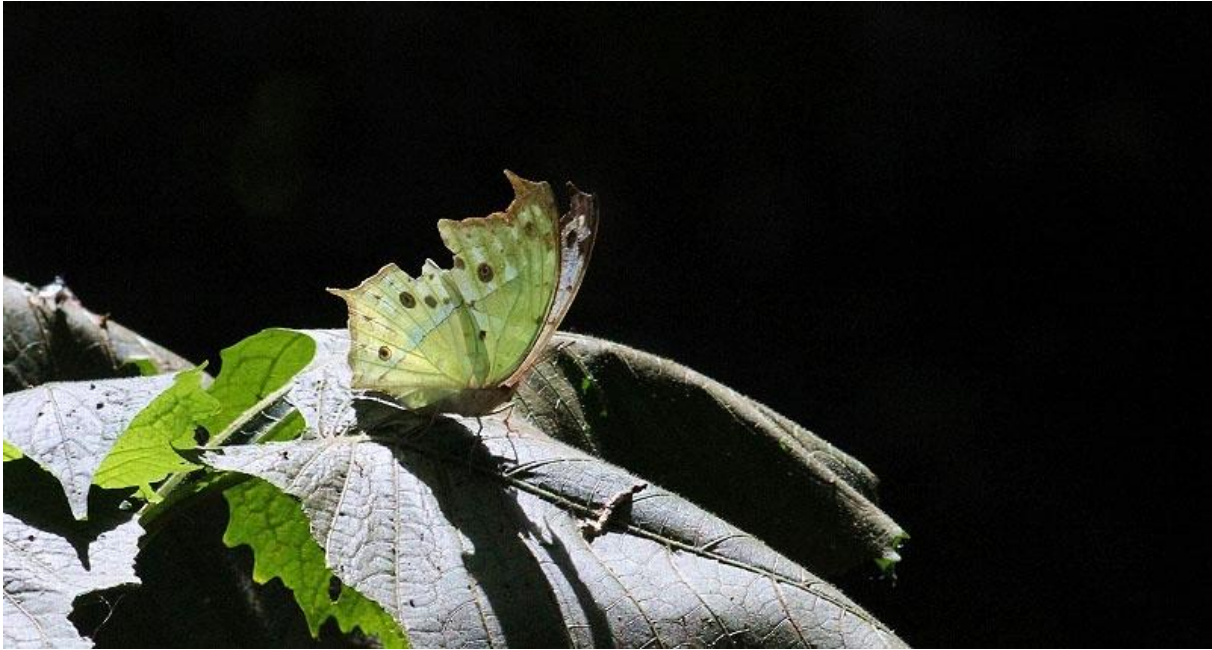
Mother of Pearl.