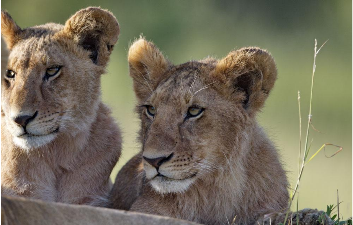
Kissekatter i Maasai Mara.