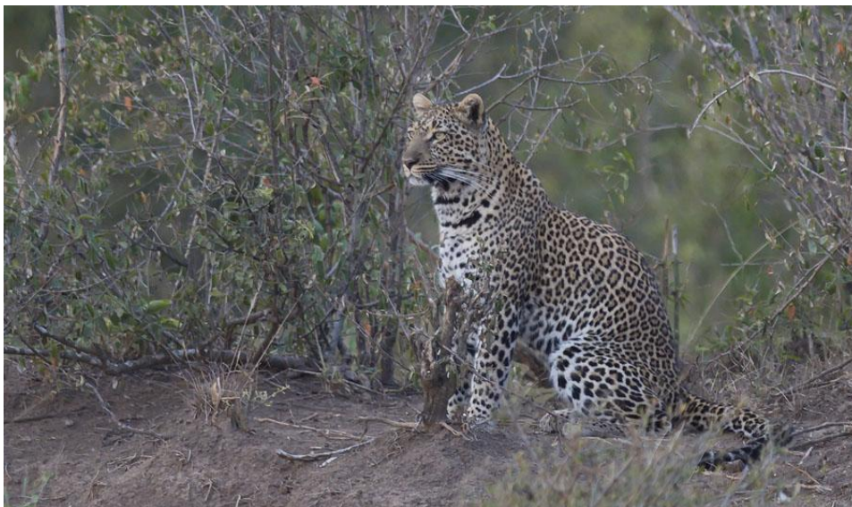
Leopard såg vi flera gånger.