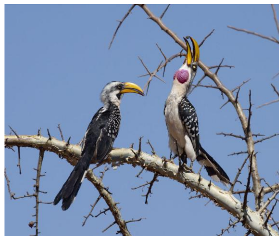
Eastern Yellow-billed Hornbills.

Färdigskådade för dagen uppskattades duschen särskilt mycket efter dagens dammiga vägar! Middag och artrop. Hittills har vi tillsammans sett 567 fågelarter totalt! Över förväntan.