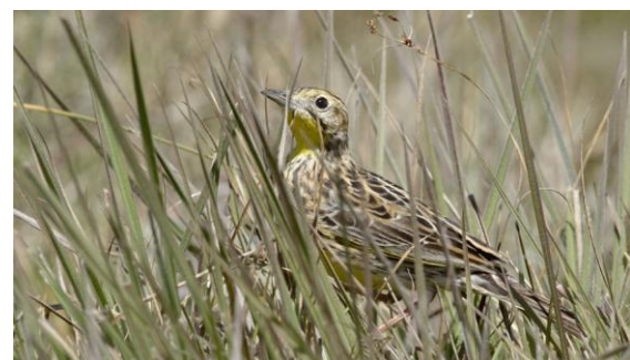
Sharpe's Longclaw har en mycket begränsad utbredning.