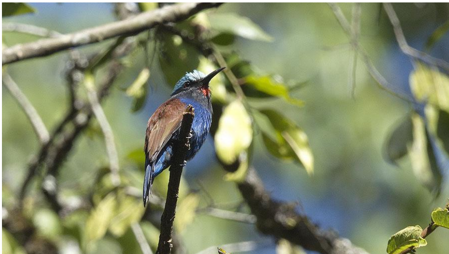
Blue-headed Bee-eater – en Kakamega-specialare.