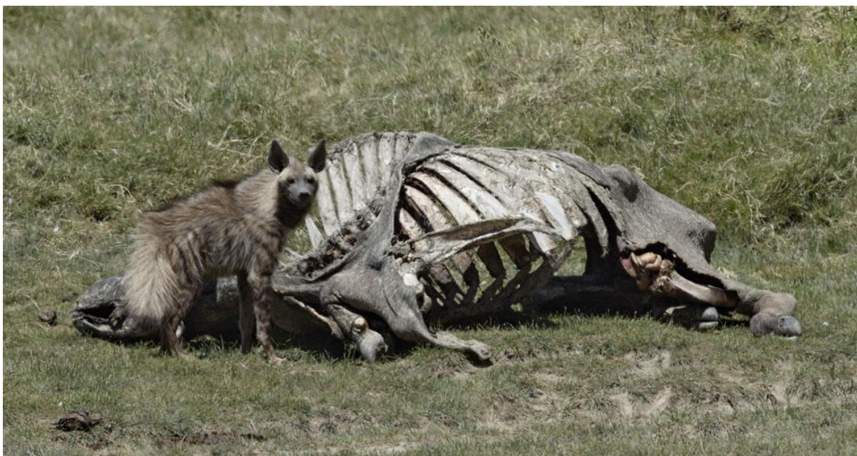
Den ovanliga och strikt nattaktiva strimmiga hyenan var en oväntad obs vi Lake Nakuru.