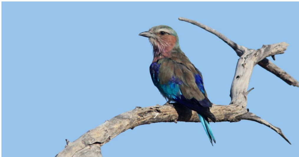
Lilac-breasted Roller.