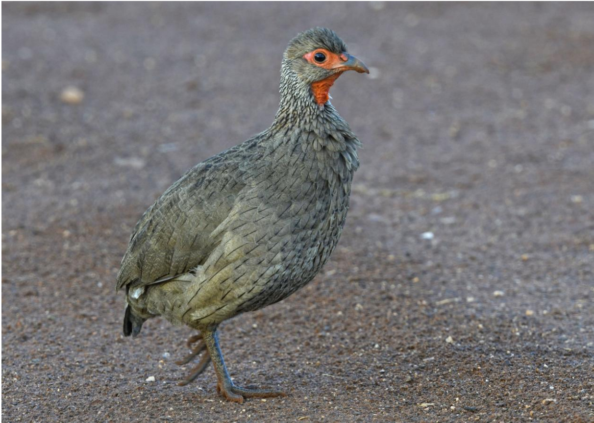
Swainson's Spurfowl.