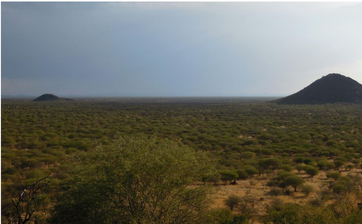
Erindi Game Reserve.