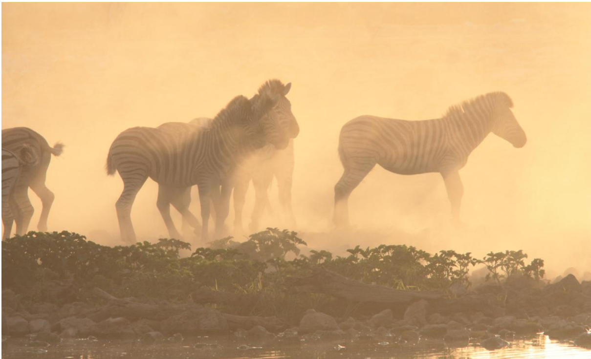
Plains Zebra vid vattenhållet vid Okaukuejo i skymningen.