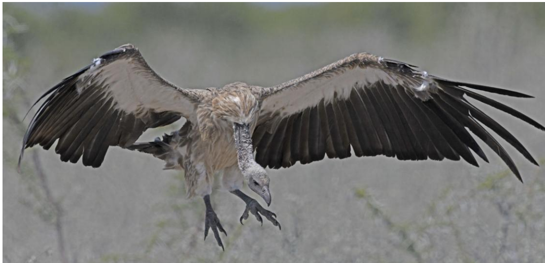
White-backed Vulture. Etosha NP.