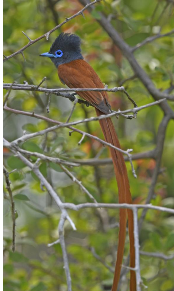
African Paradise Flycatcher. Mokuti Lodge.

falkar och mängder med seglare, bl a vår egen tornsegelare i hundratal. På eftermiddagen körde vi en game drive i reservatet. Vi såg lite Violet-eared Waxbills, en läcker art och lite antiloper som strövade omkring. Erindi Game Reserve har som uppgift att bl a fånga in lejon som "ställer till det" för farmarna i trakten, men vi såg inga nu på eftermiddagen. Däremot såg vi en rejäl kobra, Anchieta's Cobra. Vi tog en smakfull sundowner på en hög kulle med fin utsikt över hela området. Det var rätt så blåsigt vilket också hade påverkat aktiviteten hos djur och fåglar. På kvällen god middag på vårt logi.