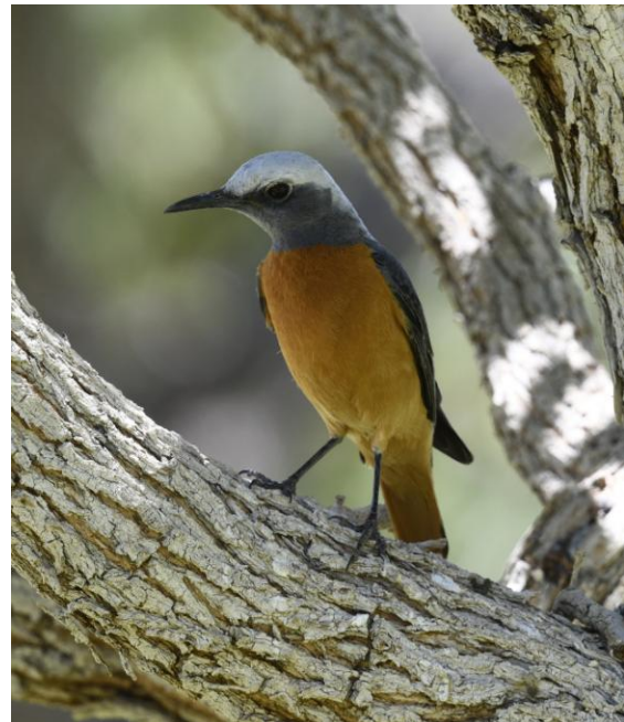
Vi såg flera Short-toed Rock Thrush längs vägen till Swakopmund.

på håll i värmedallret. Nu tog det slut på träden (olika arter av akacior) och enbart grusiga marker tog över. När vi närmade oss kusten (7-8 mil dit) dök det upp små låga buskar. De får sin vätska från de fuktiga vindarna från Atlanten som når ungefär hit. Fascinerande!