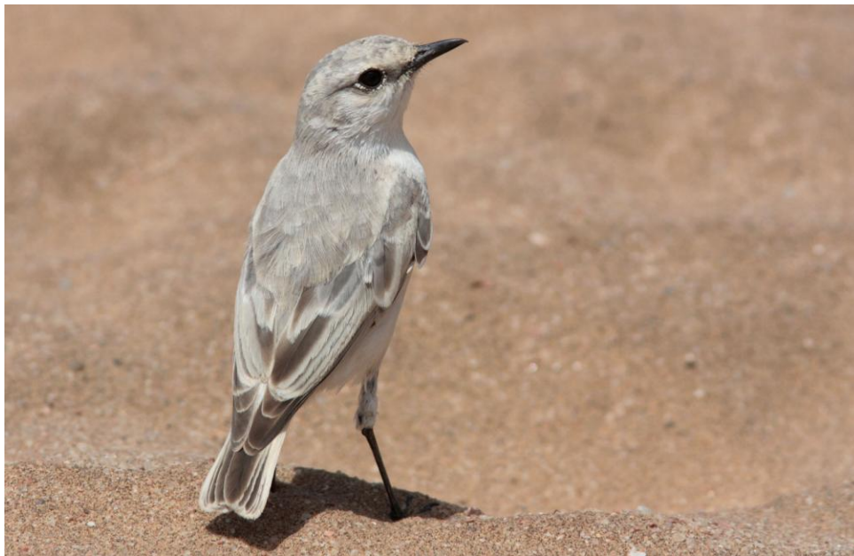
Tractrac Chat, albicans . Swakopmund.