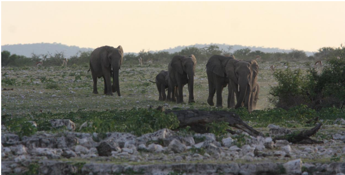
På väg till vattenhållet Okaukuejo Camp. Etosha NP.

OMSLAG. Gepard . Etosha NP.