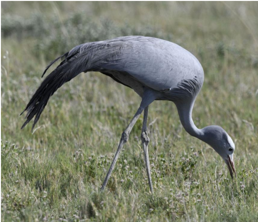
Blue Crane. Etosha NP.