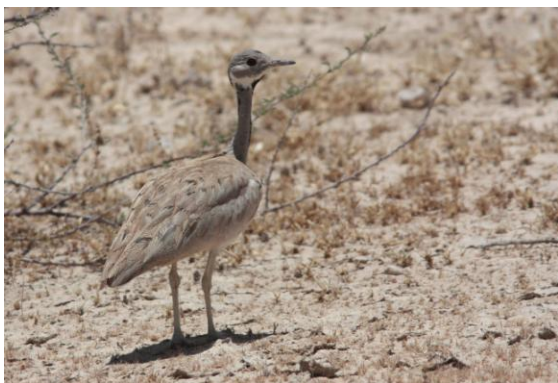
Rüppell's Korhaan.

Vi fortsatte kusten norrut och passerade enorma lavfält, det lär vara ett av de största områdena man känner till, någonstans. Ett skeppsvrak blott åtta år gammalt låg ända framme vid strandkanten. Skelton Coast försätter att skörda sina offer. Vid Hentis Bay gjorde vi ett kort restroom stop sedan fortsatte vi inåt landet. Vi såg nu Brandenburg 2 i norr och Spitzkoppe i öster. Vägen var onekligen spikrak och det dröjde kanske en timma innan första lilla böjen dök upp. Annat som dök upp längs vägen var bl a ett par Rüppell's Korhaan och flera Gray's Lark. En art som gladdes oss extra var en Benguela Long-billed Lark som stod nära vägen.