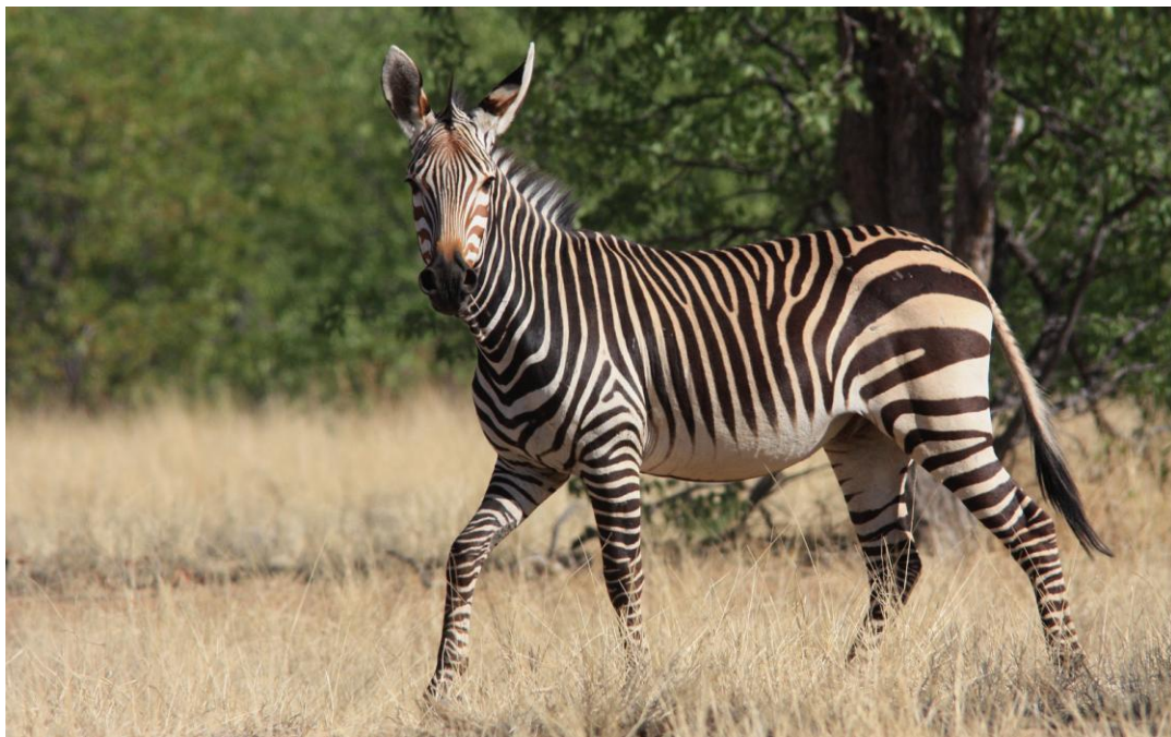
Mountain Zebra. Hobatere.