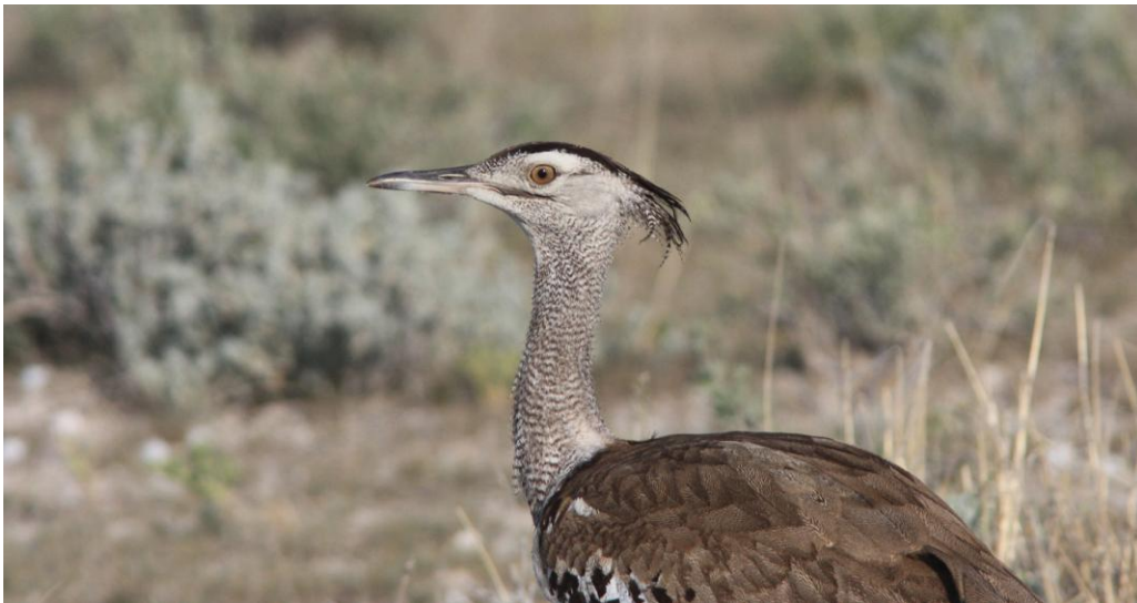
Kori Bustard. Etosha NP.