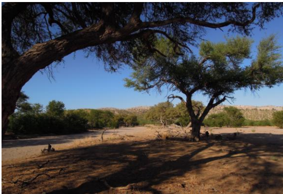
Hobatere Game Reserve.

Vi fokuserade på fåglar men såg även Mountain Zebras, Rock Hyrax och Greater Kudus bland andra däggdjur. Det var en fin morgon med perfekt temperatur. De glesa mopaneskogarna var skira och längs några uttorkade flodbäddar växer sk "riverine forest". Det var gott om Hornbills av fyra arter, flera Purple och Lilac-breasted Rollers, en svart form av Gabar Goshawk och till sist en sjungande Rockrunner. Den sistnämnda hördes bra men var dold av vegetationen.