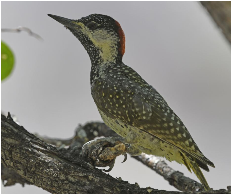
Golden-tailed Woodpecker.