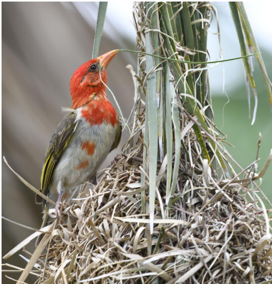
Red-headed Weaver i bygsvängen. Mokuti Lodge.