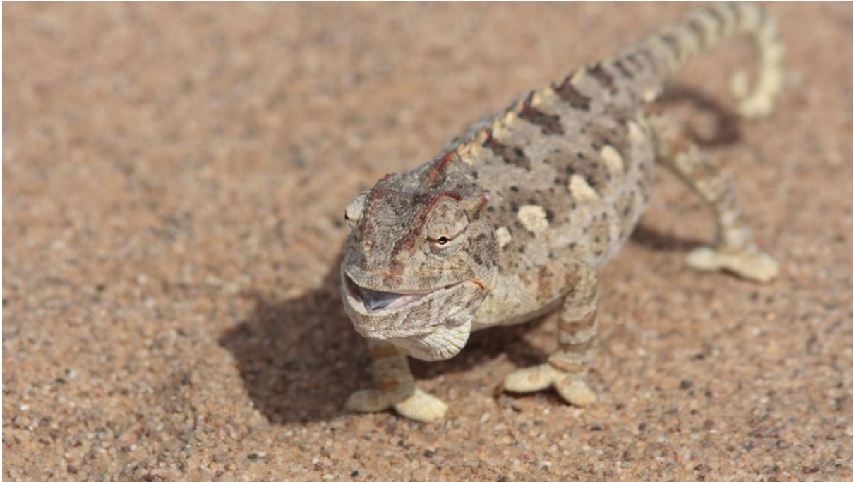
Namaqua Chamaeleon. Swakopmund.