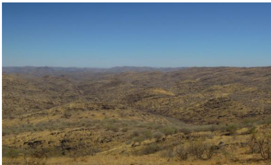
Vägen till Swakopmund karaktäriseras av enorma torra områden.

Vi gjorde många kortare, och ibland lite längre, stopp för att kolla in fåglar, däggdjur och vyerna. Vi förundrades över att en så torr miljö kan hysa ett så pass rikt liv som vi ändå såg. Det var en hel del fågel längs vägen vi körde och de vanligaste arterna var Cape Glossy Starling och Lark-like Bunting. Även Bradfield's Swift var talrik med minst hundra fåglar under första halvan av körsträckan. Lite rovfåglar dök upp då och då vi artbestämde bl a Martial Eagle, Augur Buzzard och Black-chested Snake Eagle. En sjungande Herero Chat ville inte visa sig medan Neil dock såg en annan individ under vårt lunchstopp vid Boshua Pass.