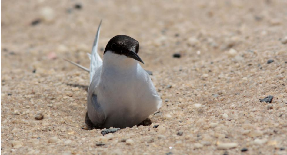
Damara Tern. Swakopmund.