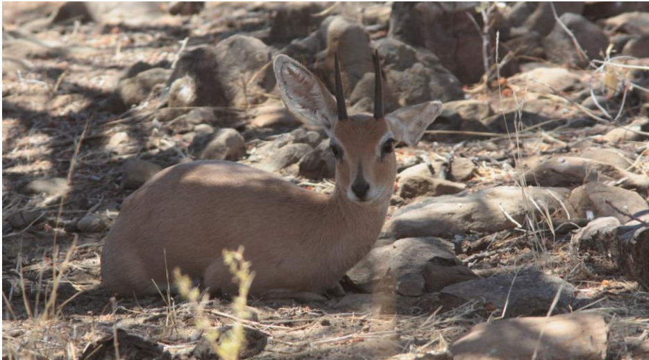
Steenbok. Längs vägen till Swakopmund.