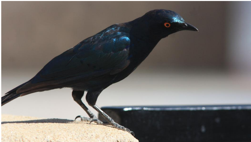
Cape Glossy Starling. Sedd under nästan hela resan.