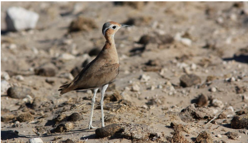
Burchell's Courser. Etosha NP.