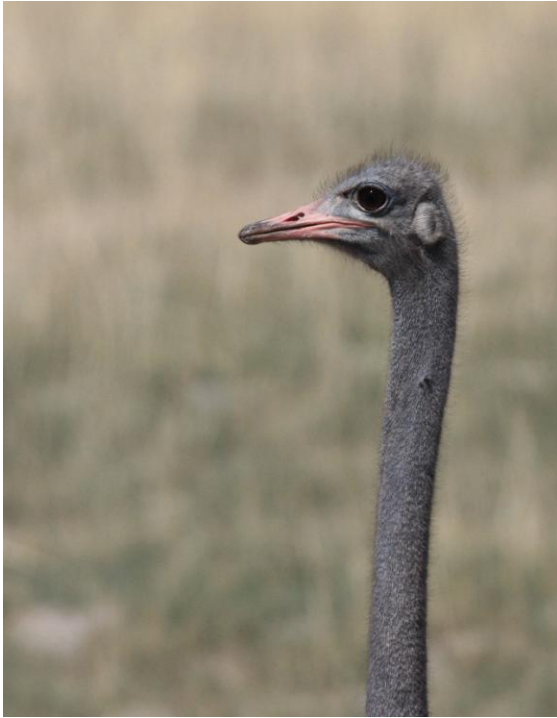
Strutsar sågs under åtta av resans dagar.

drar fram. Under morgonen och förmiddagen skådade vi under långsam körning strax söder om Namutoni i fin mopaneskog. Vid ett vattenhål fanns en del Impalas, Springboks, Greater Kudus och några giraffer. När vi kom in i mopaneskogen hittade vi bl a Green-winged Pytilia och African Golden Oriole.