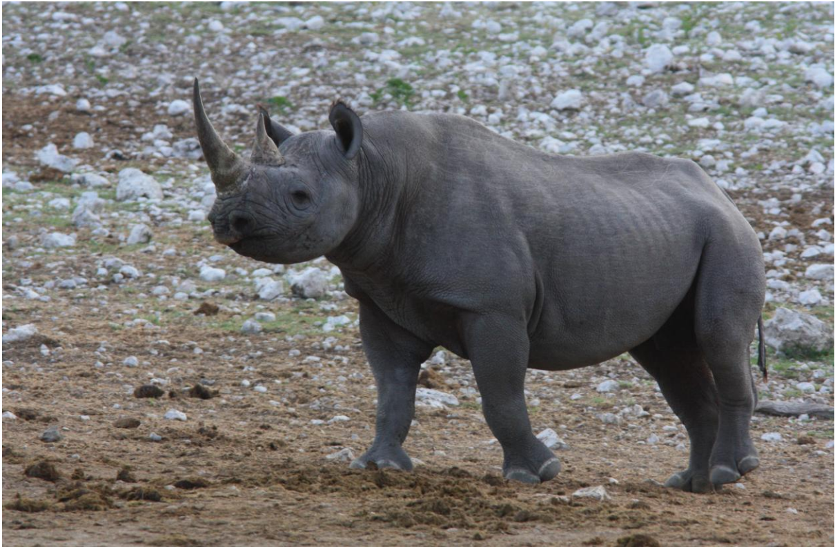
Black Rhinoceros (Spetsnoshörning). Etosha NP.