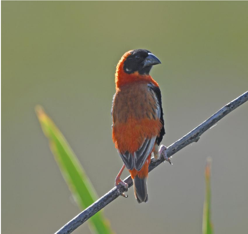
Southern Red Bishop. Windhoeks reningsverksdammar.