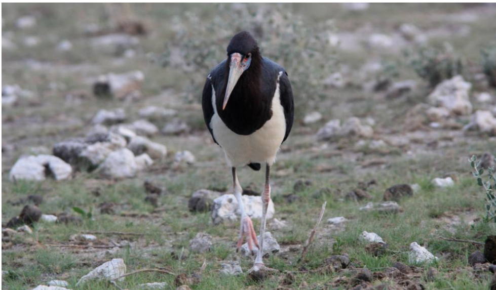
Abdim's Stork. Etosha NP.