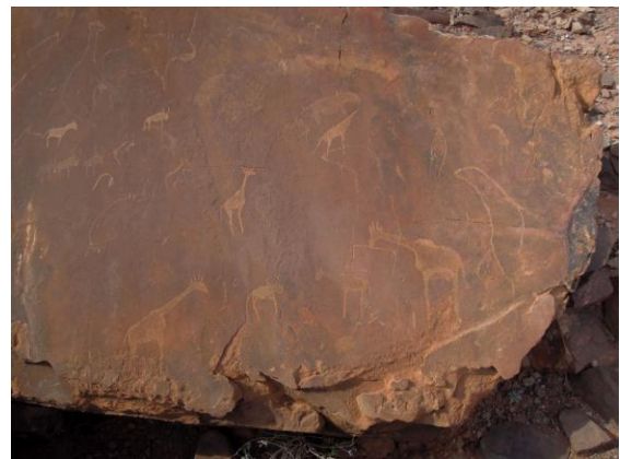
Hållristningar vid Twyfelfountain.

Vi ägnade morgonen åt ett av Afrikas rikaste områden med hållristningar. Här finns tusentals med "carvings" som är två- till sextusen år gamla. Just i detta område återvände jägare och samlarfolket med jämna mellanrum då det var regelbunden tillgång till vatten och bytesdjur här. Vi gick en slinga med guiden Silvia och hon berättade initierat om vad vi såg.