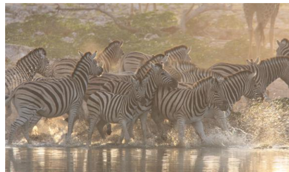
Oro vid vattenhålet. Plains Zebra, Etosha NP.

Vi samlades utanför rum 4 för att lyssna efter Hartlaub's Spurfowl. En art som trivs i dessa steniga åsar i torra marker. Några hade hört en fågel ropa tidigt på morgonen, från rummen. Även ett lejon hade rutit några gånger. Gruppen fick dock inte höra någon Spurfowl utan vi tog frukost och gjorde oss redo för avresa. Innan vi åntrade vår viss hann vi dock se Pirit Batis och några såg även Brown-crowned Tchagra.