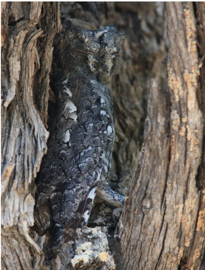
African Scops Owl. Hobatere Game Reserve.