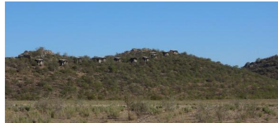
Vårt boende i västra delarna av Etosha NP – Dolomite Camp.

Vi nådde vår lodge, Dolomite Camp som ligger läckert utslängd längs en bergsås, med hela det öppna landskapet nedanför. Vi lunchade här innan vi gjorde vår första tur runt till olika vattenhål i närområdet.