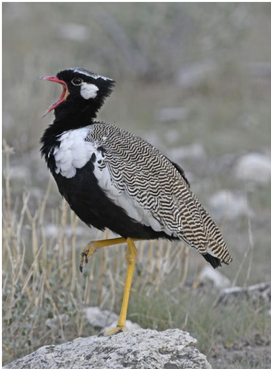
Vi såg många Northern Black Korhaan i Etosha NP.

Vi gjorde en exkursion österut innan vi åt frukost. Vi besökte några vattenhål som bl a gav en spetsnoshörning som inte ville gå ända fram till vattenhållet p g a vår närvaro. En del individer är mycket försiktiga. En African Wild Cat sprang snabbt över vägen och bara några få hann se den. Synd! På tillbakavägen kunde vi följa tre lejon som gick spikrakt genom djurflockar, vilka snabbt skingrades.