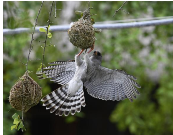
Ovambo Sparrowhawk rensar i vävarbona.

Vi nådde så småningom vårt logi inte långt från Namutoni, men ett kort stycke utanför parken. Här åt vi god lunch och softade ett tag. En Ovambo Sparrowhawk klängde i vävarbona och rensade dessa på ungar. Kalabalik!