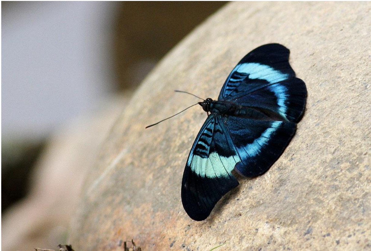
Red Flasher Panacea prola amazonica .