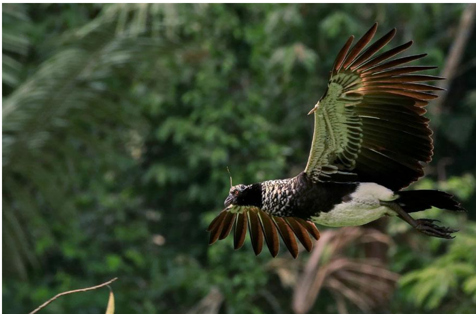
Horned Screamer.