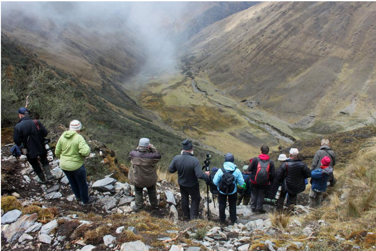
Det var brant ner till skogen vid Abra Malaga.

Givna höjdpunkter var givetvis också Andean Condor, Diademed Sandpiper-Plover, Inca Tern, Hoatzin, Lyre-tailed Nightjar, Golden-headed Quetzal, Crested Quetzal, Grey-breasted Mountain Toucan, Blue-and-yellow Macaw, White-bellied Cinclodes, Stripe-headed Antpitta, Ringed Antpipit, Many-colored Rush Tyrant, Andean Cock-of-the-rock, Plum-throated Cotinga, Amazonian Umbrellabird och Round-tailed Manakin.