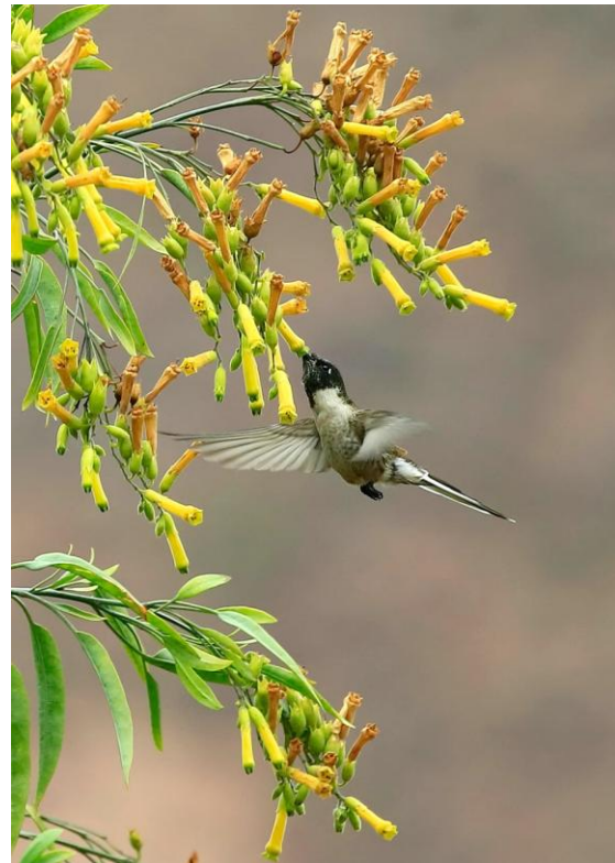
Bearded Mountaineer.

Nästa anhalt blir Huambutio, där vi främst spanar efter gula blommor av släktet Nicotiana . Dessa favoriseras nämligen av den eftersökta kolibrin Bearded Mountaineer. Familjesläktningarna Giant Hummingbird, Shining Sunbeam och Sparkling Violetear visar sig fint, liksom Golden-billed Saltator. Det dröjer dock tills vi mer eller mindre gett upp och kört en bit upp längs bergssidan innan en Bearded Mountaineer vid vägkanten kan avnjutas av samtliga i bussen. I det läget håller vi mer än gärna till godo med en hona.