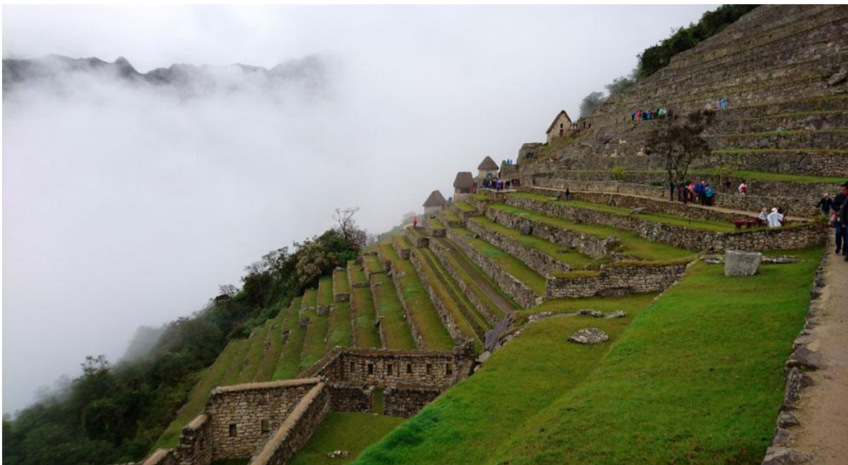
Machu Picchu.