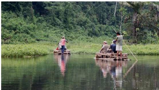
Flottskådning vid Amazonia Lodge.

Innan det ljusnar hörs Cinereous Tinamou, Black-capped Tinamou, Great Potoo, Pauraque samt Tawny-bellied Screech Owl. På morgonen besöker vi en plats dit papegojor kommer för att få mineraltillskott. Inte så många gojor som går ner på leran, men vi ser i alla fall Blue-headed Parrot, Yellow-crowned Amazon, Chestnut-fronted Macaw, Dusky-headed Parakeet, White-eyed Parakeet samt Spix's Guan och Blue-throated Piping Guan. På flodön finner vi också Ladder-tailed Nightjar, Collared Plover och Chestnut-bellied Seedeater. Från båten noteras Violaceous och Purplish Jay, Chestnut-eared Aracari samt Black Caracara.