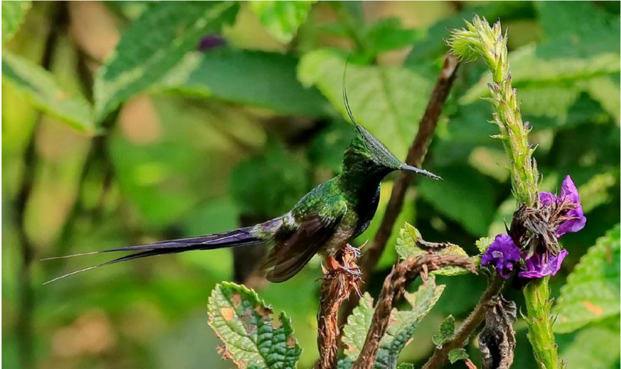
Wire-crested Thorntail.