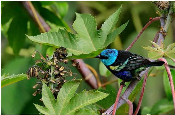
Blue-necked Tanager.

Vi skådar sedan en liten bit längs vägen ner mot Urubambafloden. Bergsregnskogen är mycket artrik, med bl.a. hundratals arter orkidéer, så nya fåglar såsom Andean Guan, Azara's Spinetail, Rusty Flowerpiercer, Spectacled Whitestart, Tooth-billed Tanager, Blue-capped Tanager, Dusky-green Oropendola, Inca Wren och Ocellated Piculet noteras i relativt snabb takt. Nere längs floden tillkommer bl.a. Variable Antshrike, Common Tody-Flycatcher, Mottle-cheeked Tyrannulet, Chestnut-capped Brushfinch, Fasciated Tiger Heron, Slate-throated Whitestart, Lesser Violetear, Green-and-white Hummingbird, Blue-necked Tanager och Silver-backed Tanager.