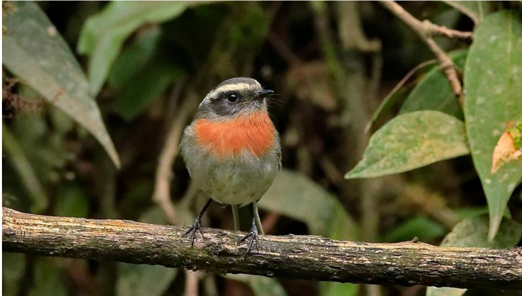
Rufous-breasted Chat-Tyrant.