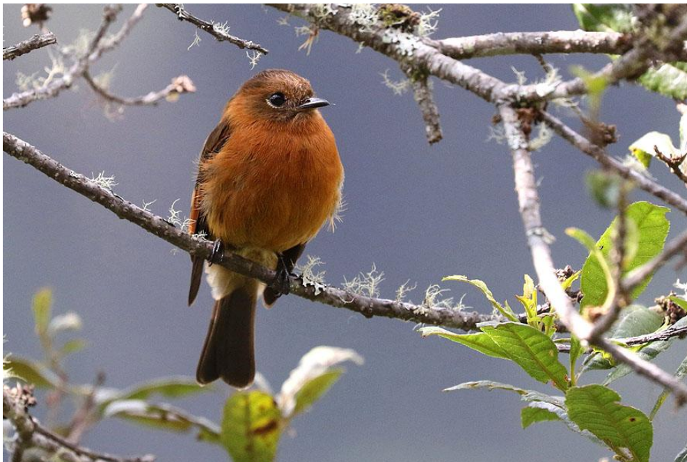
Cinnamon Flycatcher.