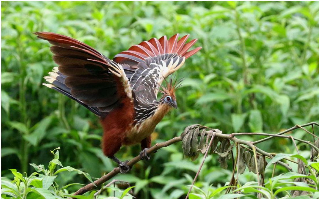
Hoatzin.