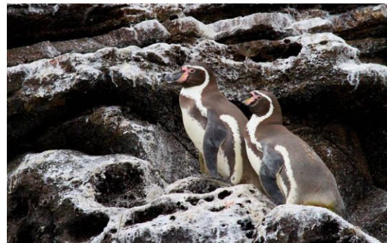
Humboldt Penguin.

Avfärd kl 05, men idag har vi inte lika flyt på vägen upp mot Ticlio Pass. Tåget har rammat en lastbil (bara minuter innan vi kom) och det är tvärstopp som knappast löser sig på mindre än några timmar. Vi får därför köra ner igen (lämnar San Mateo kl 07.20) och runt till Santa Eulalia från andra hållet. Därmed blir det först långt frampå förmiddagen som skådningen börjar och egentligen på för låg höjd (2 600 m.ö.h.) för några av målarterna. Hur som helst får vi i alla fall se endemerna Rusty-crowned Tit-Spinetail och Rusty-bellied Brushfinch samt andra godbitar som Mountain Parakeet, Andean Swift, Purple-collared Woodstar, White-capped Dipper, Pied-crested Tit-Tyrant, Yellow-billed Tit-Tyrant samt en liten skynt av Great Inca Finch. Greenish Yellow Finch och Mourning Sierra Finch är däremot svåra att missa. Black-chested Buzzard-Eagle verkar trivas i det mycket dramatiska (och torra) landskapet. Den sena timmen gör att lunchen får kombineras med middag, innan det är dags att påbörja den fyra timmar långa färden (och köandet) tillbaka till hotellet.