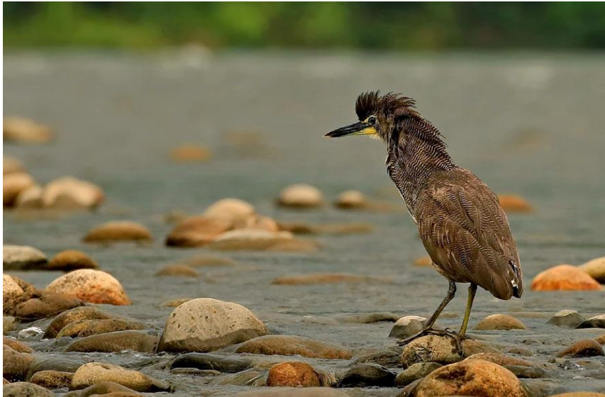
Fasciated Tiger Heron.