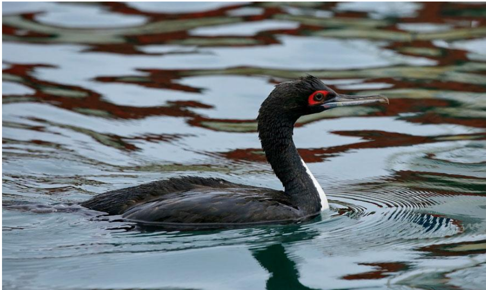
Guanay Cormorant.