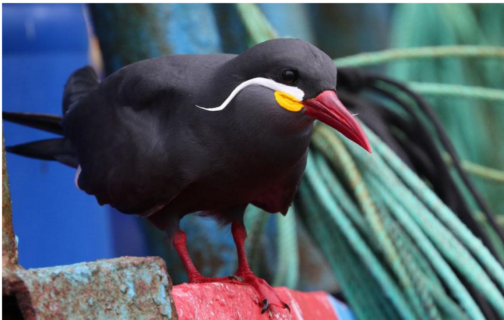
Inca Tern.