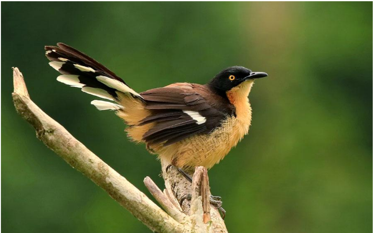
Black-capped Donacobius.