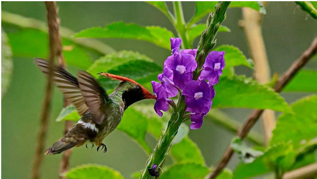
Rufous-crested Coquette.