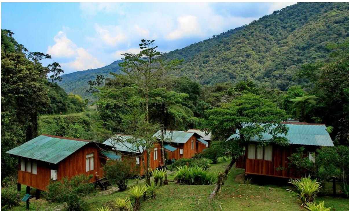
Cock-of-the-rock Lodge.

noteras bl.a. Andean Parakeet, Cinnamon Flycatcher, White-throated Tyrannulet, Pearled Treerunner, Citrine Warbler, Marcapata Spinetail, White-browed Hemispingus, Superciliaried Hemispingus, Capped Conebill, Grey-eared Brushfinch och White-collared Jay.