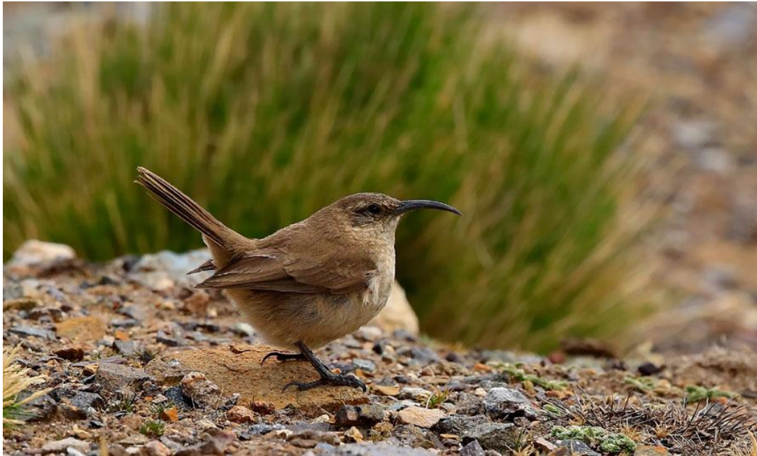
Buff-breasted Earthcreeper.