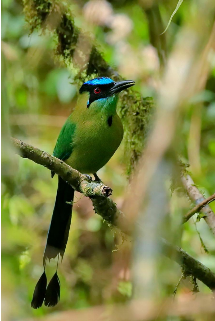
Andean (Highland) Motmot.