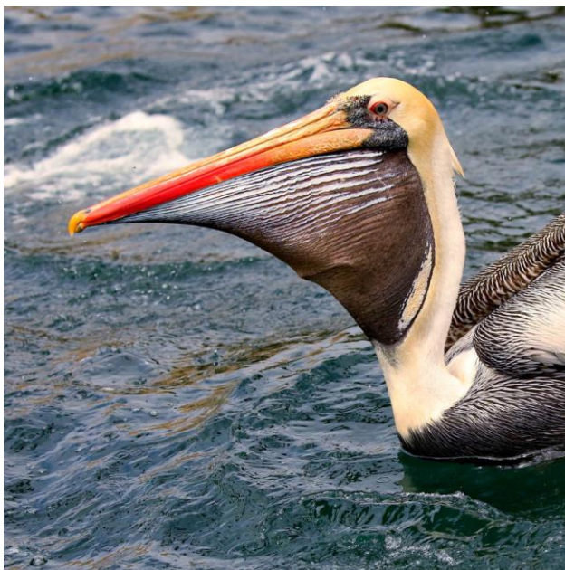
Peruvian Pelican.