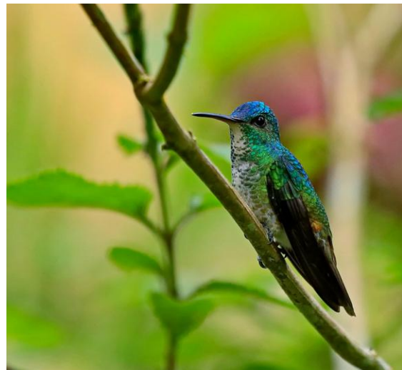
Golden-tailed Sapphire.

Frampå sena eftermiddagen samlas mängder av seglare i luften ovanför oss och vi noterar hela sex arter; Grey-rumped, Short-tailed, Chestnut-collared, White-collared, Lesser Swallow-tailed och Neotropical Palm Swift. Att trogoner kan vara mycket responsibla manifesteras tydligt när vi har åtminstone fem individer av två arter (Black-tailed och Blue-crowned) runtomkring oss. Under promenad på stig genom den täta skogen inom lodgens ägor hörs bl.a. Black-capped Tinamou, Black-faced Antthrush och Rusty-belted Tapaculo.