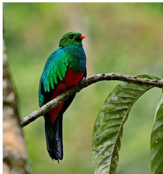
Golden-headed Quetzal.

Cinnamon-faced Tyrannulet, Rufous-tailed Tyrant, Slaty-capped Flycatcher, Pale-edged Flycatcher samt Magpie, Paradise och Swallow Tanager till listan. Skådningen avslutas med spelande Lyre-tailed Nightjar.