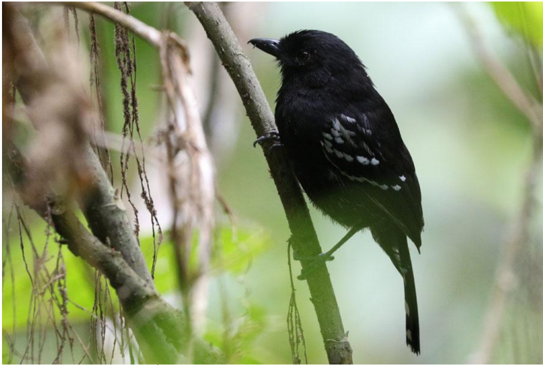
Variable Antshrike.