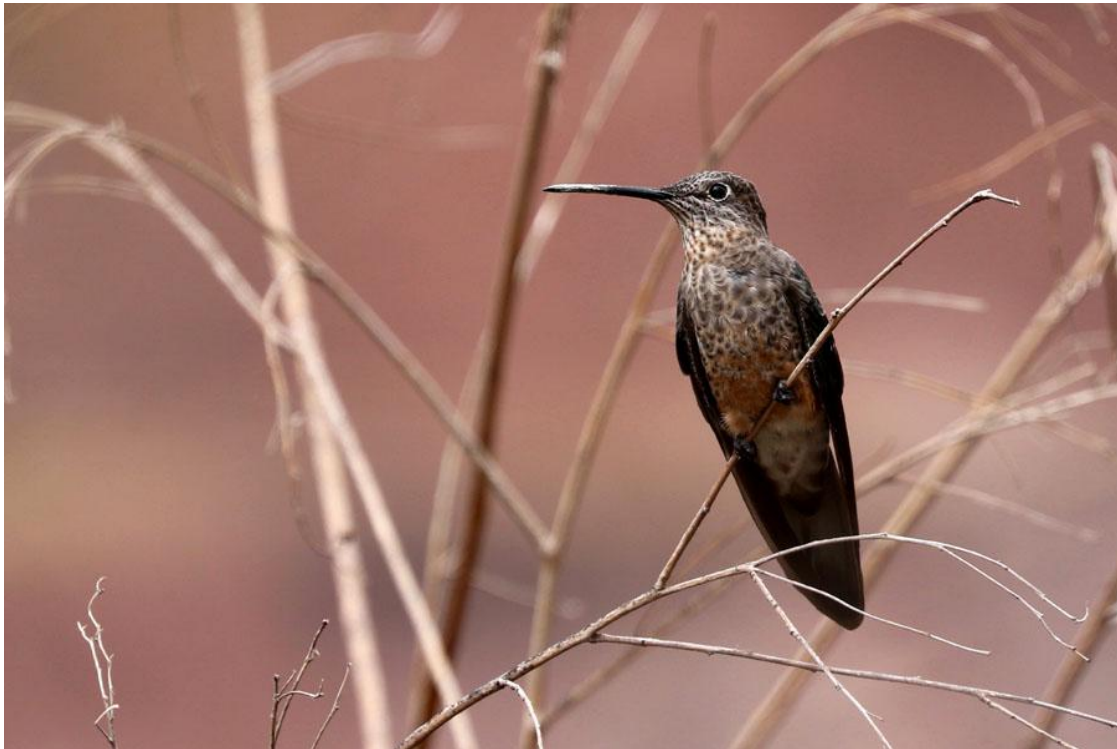
Giant Hummingbird.