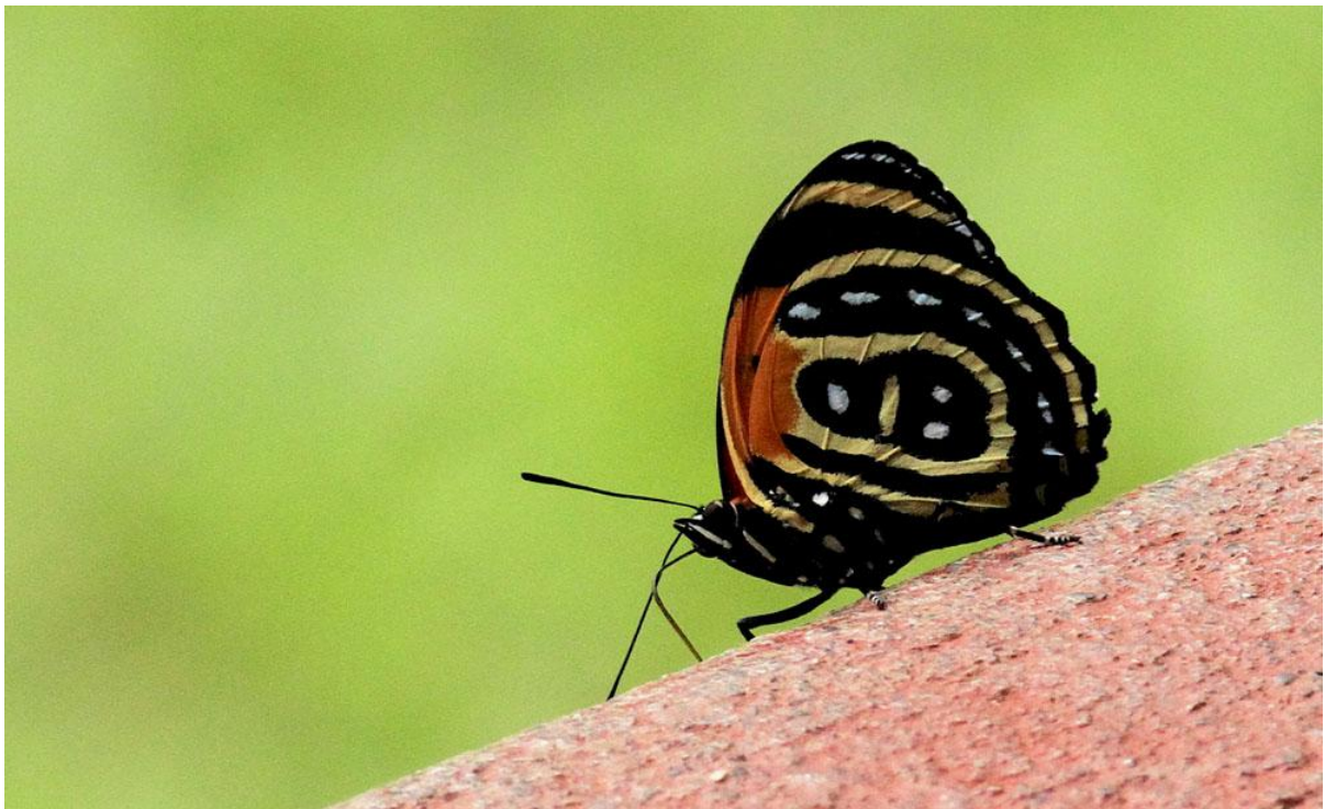
Cynosura Eighty-eight Callicore cynosure .