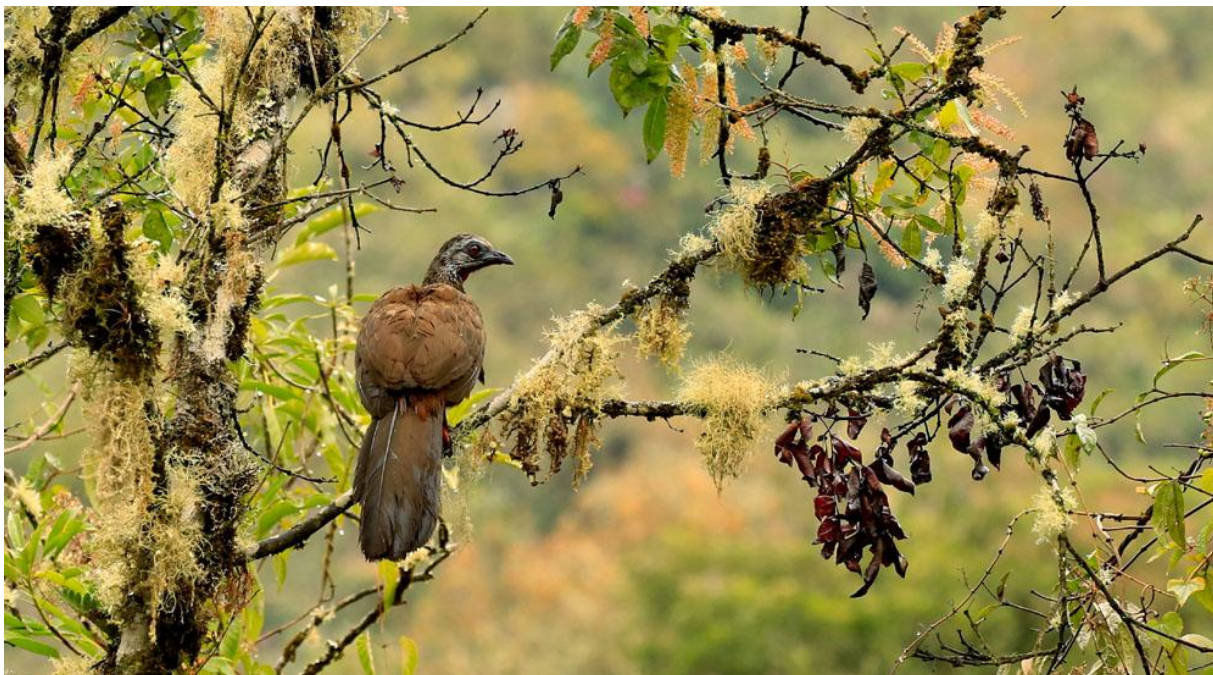
Andean Guan.