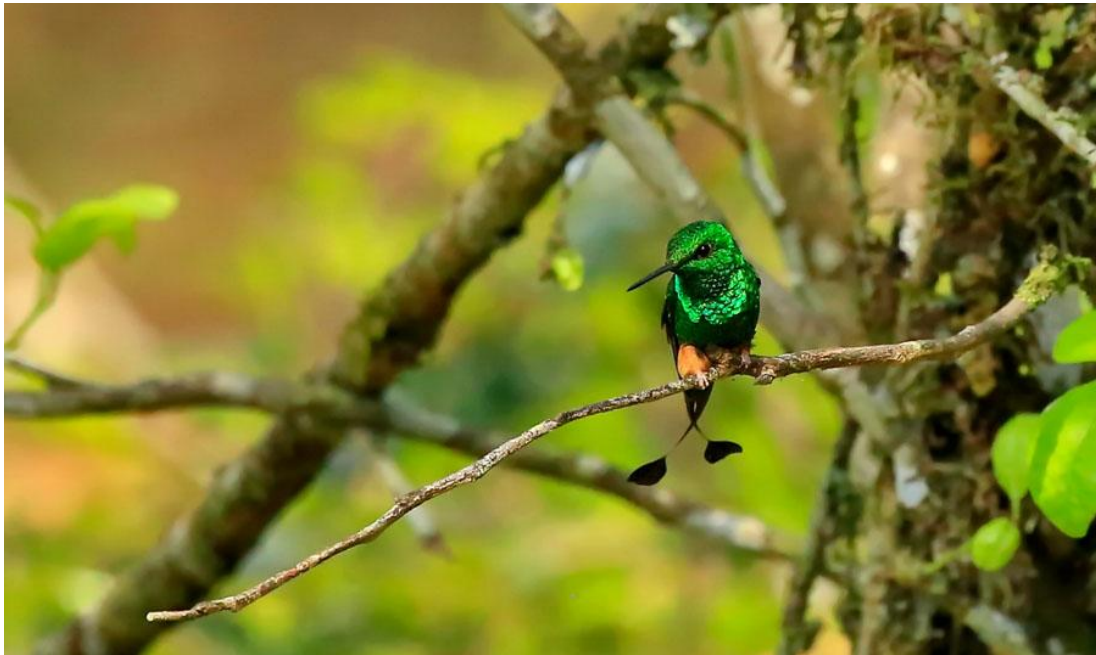
Booted Racket-tail.