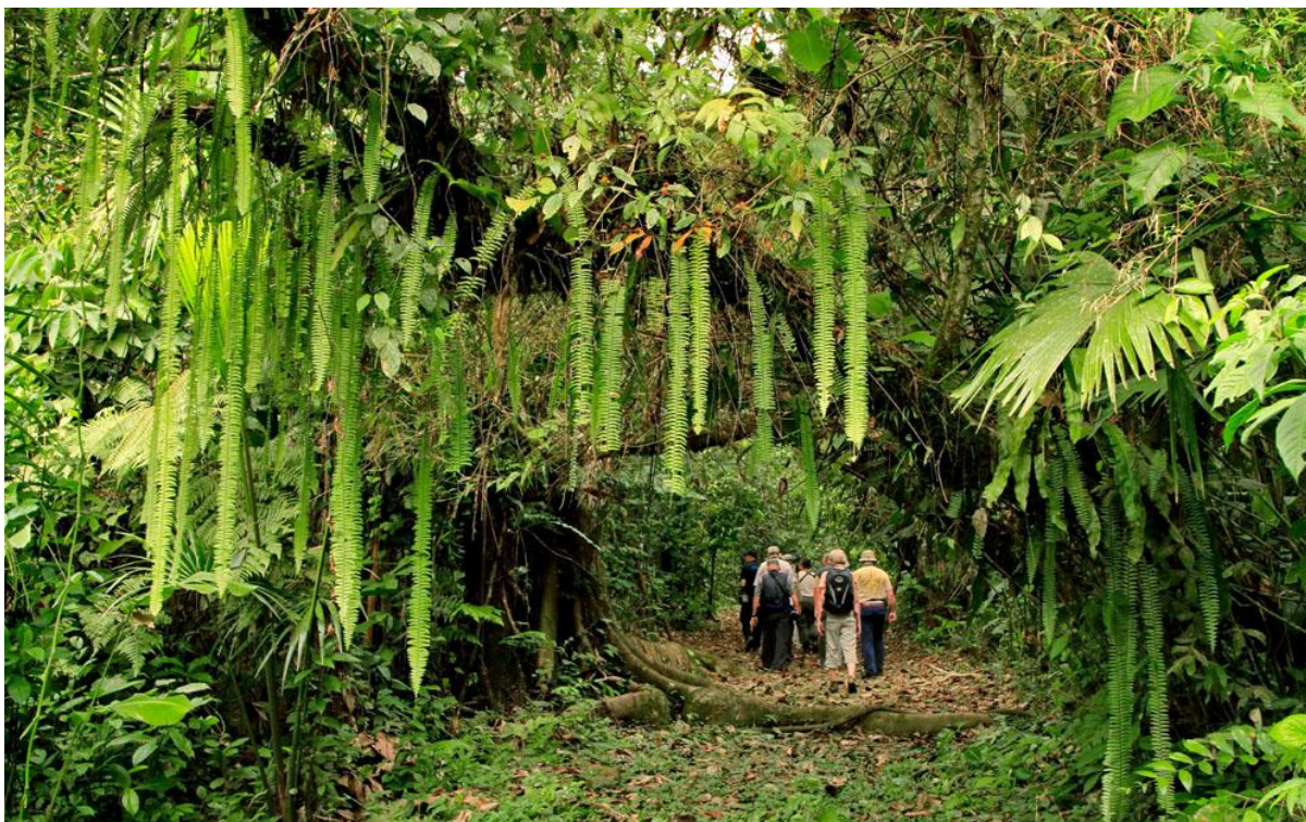
Amazonia Lodge.