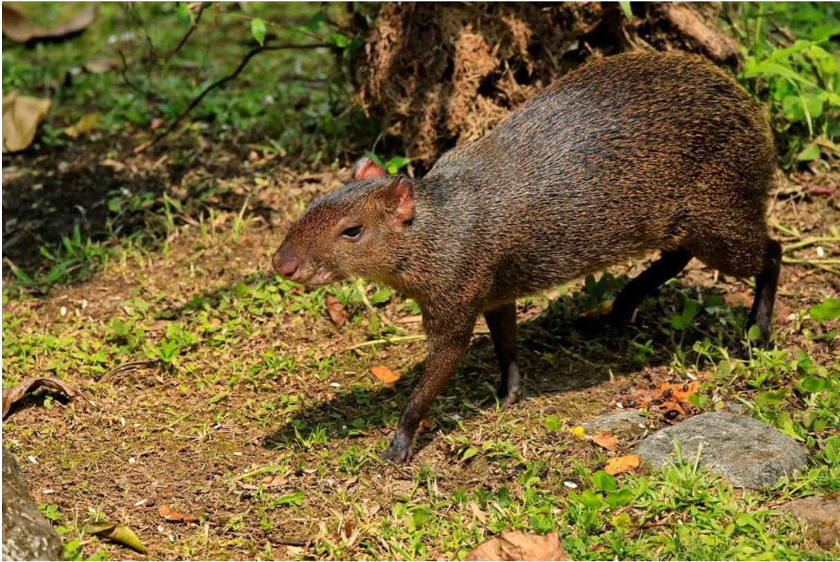
Brown Agouti.