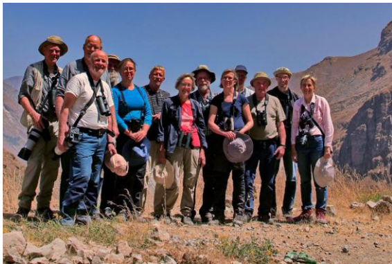
Grppbild Santa Eulalia valley.

Sovmorgon och sedan besök till Inkamuseet i Cusco samt de välbevarade ruinerna av befästningen Sacsayhuamán från Inkarikets storhetstid, då Cusco var dess huvudstad och riket sträckte sig från södra Colombia till centrala Chile. Vi får lära oss en hel del intressanta detaljer kring Inkafolkets historia och kultur, däribland hur de frös och soltorkade potatis för långtidsförvaring (varefter den blötlades innan förtäring) samt deras mångsidiga användning av alpaca (domesticerad från vikunja) och lama (domesticerad från guanaco). På eftermiddagen flyg till Lima.