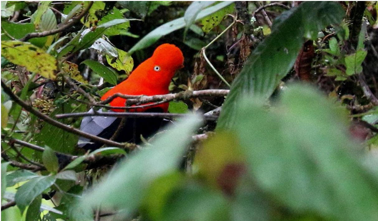
Andean Cock-of-the-rock.