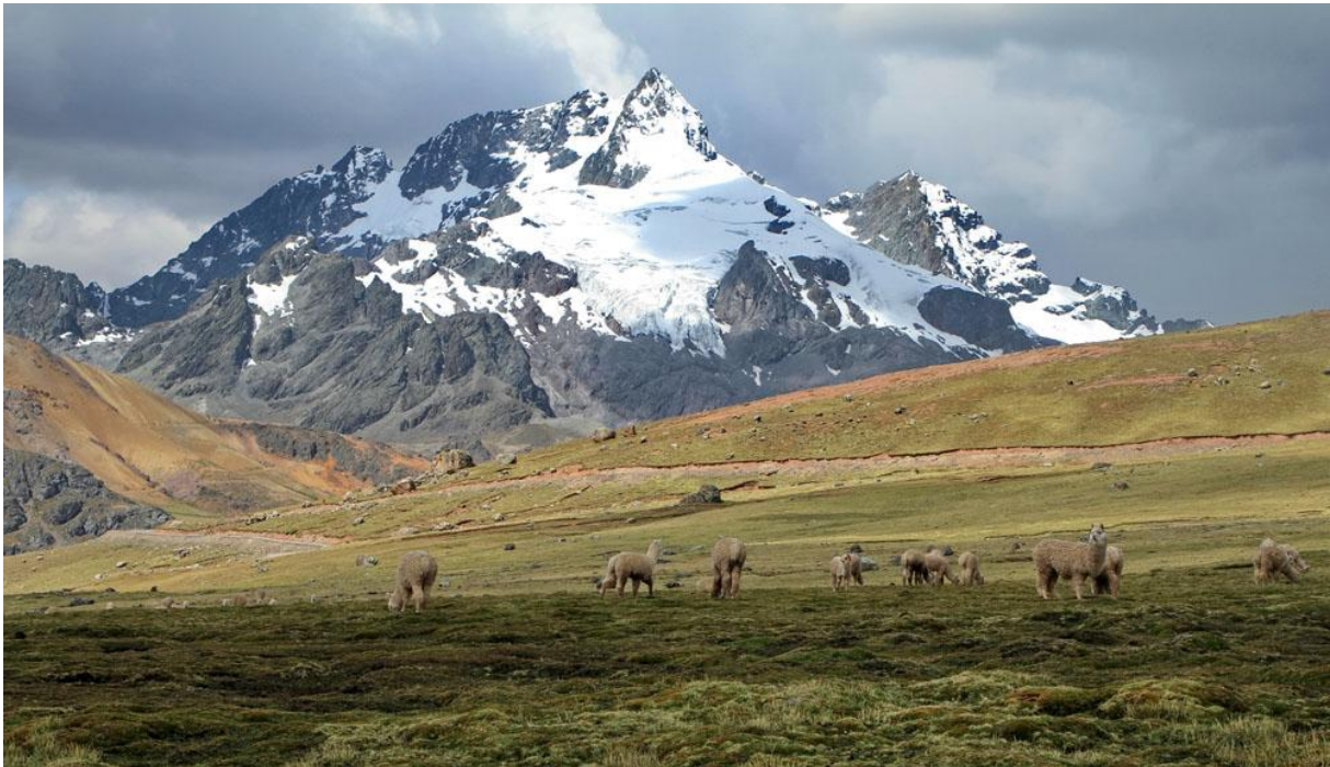
Alpackor framför berget Rajuntay.