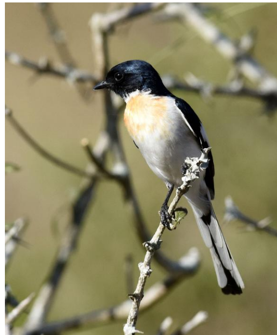
White-bellied Minivet .

Bäst vi strosade i de fina markerna fick vår lokala guide besked från en av hans spejare att det fanns White-bellied Minivet ca en halv timmes halvfrask promenad på andra sidan vägen. Sagt och gjort så stegade vi iväg. Vi gick genom mycket fina busk- och trädmarker. Flera träd var nyligen utslagna så det var allt lite grönska i markerna. Så småningom nådde vi platsen för White-bellied Minivet och vi fick mycket fina obsar på fyra individer. På vägen tillbaka skruvade några rovfåglar nära oss, 1 adult Indian Spotted Eagle och 1 dvärgörn . För att nå bussen fick vi gå igenom en pytteliten by där dagens verksamhet drogs igång. Det var fint att se detta.