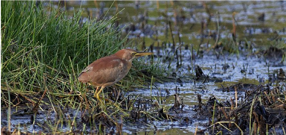
Cinnamon Bittern, Sippighat. För en gång skull helt öppet!