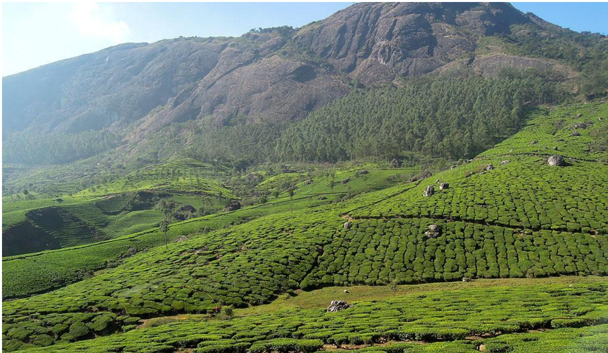
Vackra teodlingar längs vägen till Top Slip, men en förödande monokultur.