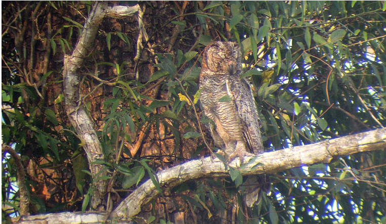
Mottled Wood Owl , Thattekad.