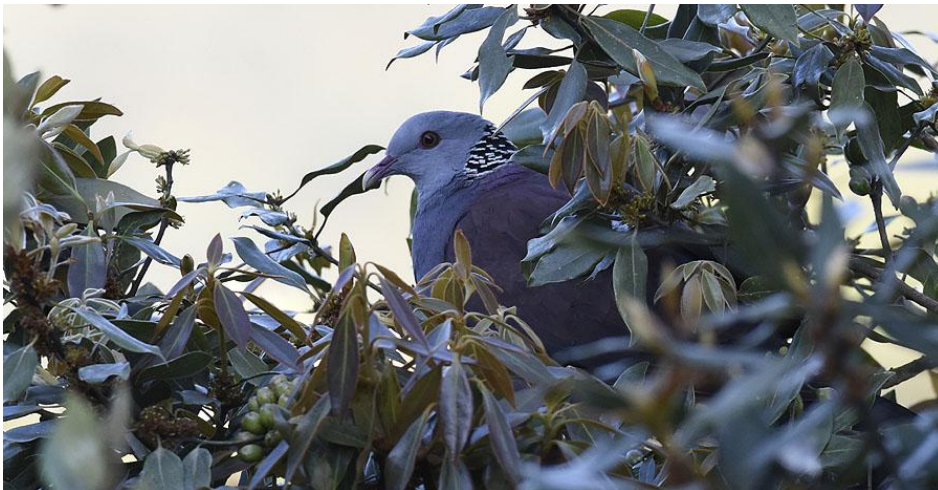
Nilgiri Wood Pigeon, Ooty.