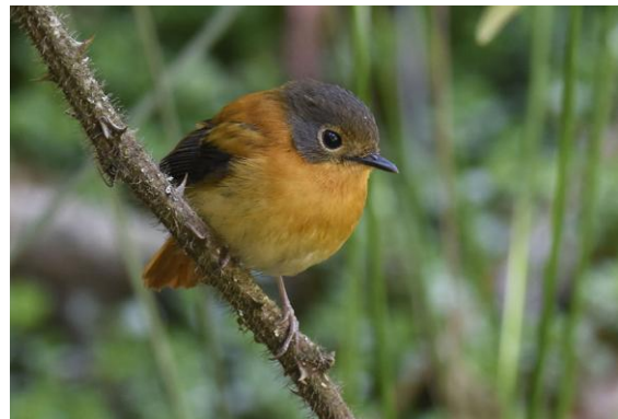
Black-and-orange Flycatcher.

intelligande teodlingarna. Vi letade flitigt efter White-bellied Blue Robin och snart fann vi en fågel som visade sig riktigt bra till sist. Här fick vi också se 1 Black-and-orange Flycatcher . Tjusig sak! Vi följde en liten körväg ett stycke fram och hittade här också 2 Kerala Laughing-thrush . Morgonen var i hamn.