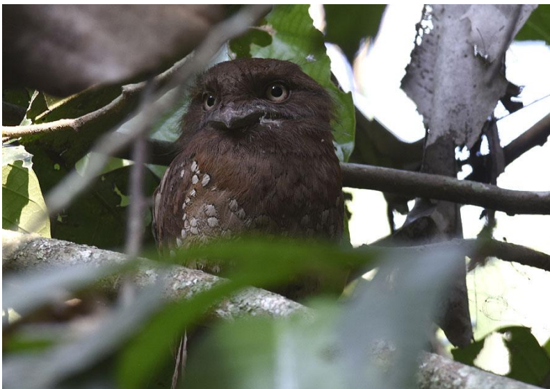
Sri Lanka Frogmouth , Thattekad.