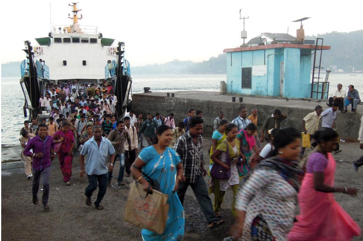
Det rådde full fart i färjeläget i Port Blair.