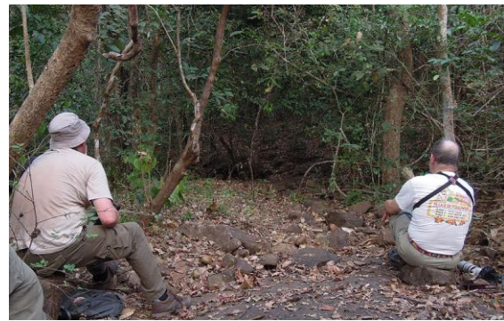
Väntan vid vattenhållet.

Vi åkte ut till några nakna hållmarker inte alls långt från vår lodge. Här skulle vi invänta skymningen och mörkret för att försöka höra och se lite ugglor och nattskärror. Vi började dock med att bevaka ett minimalt vattendrag som brukade dra till sig lite drickande fåglar på sena eftermiddagen. Och visst blev det så. Malabar Whistling Thrush höll sig i närheten med flera individer och några fick även se Blue-throated Flycatcher som kom fram till småpölarerna. Det bästa av allt var dock den Oriental Dwarf Kingfisher som satt så fantastiskt fint och länge på nära håll. Flera gånger gjorde den snabba dyk ner mot marken och vattnet och fångade bl a en spindel och en skalbagge.