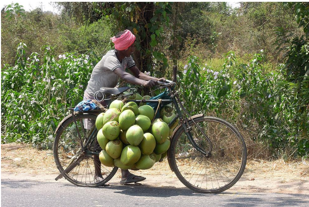
På väg till marknaden.