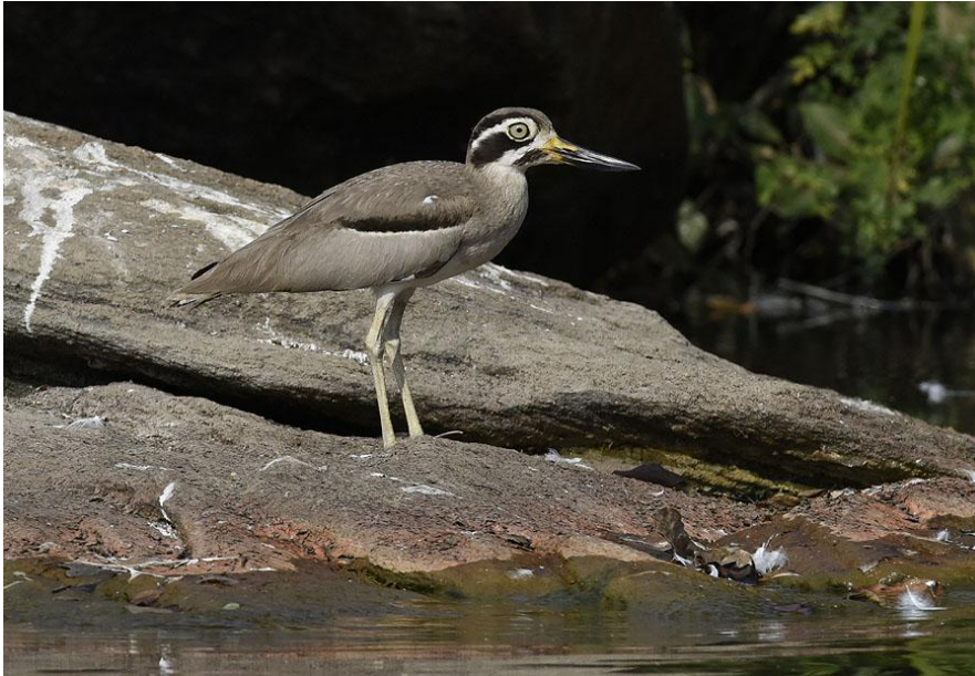
Great Stone-curlew , Ranganthittu Bird Sanctuary.