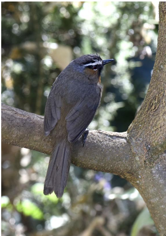
Kerala Laughingthrush.

Vi hann med en eftermiddagspromenad på de skogklädda sluttningarna ovanför hotellet. Här fann vi flera nya researter, bl a den svårседda Nilgiri Wood Pigeon som Per Ole vaskade fram i lövrik vegetation. Andra spännande arter var t ex Nilgiri Flycatcher och de nyligen splittade Square-tailed Bulbul och Kerala Laughing-thrush .