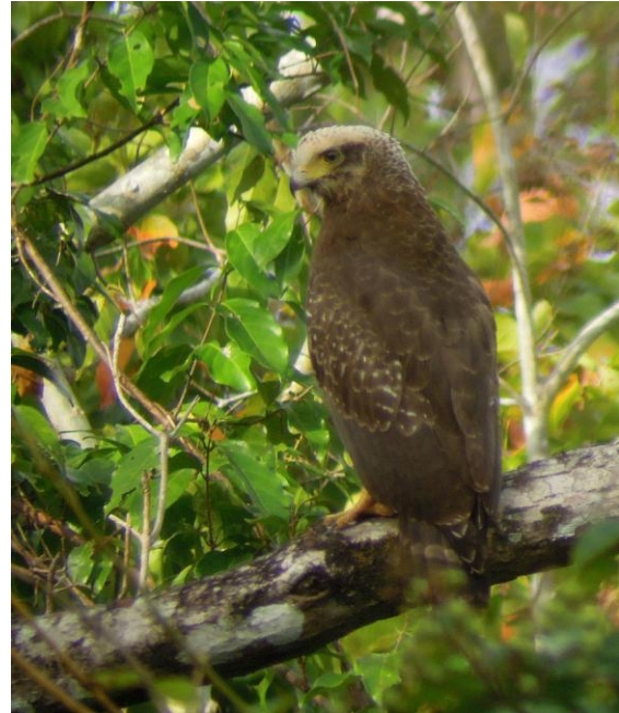
Andaman Serpent Eagle.