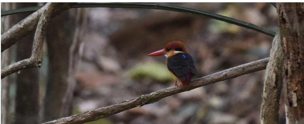
Oriental Dwarf Kingfisher, Thattekad.