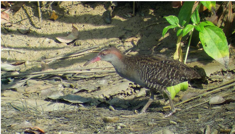
Slaty-breasted Rail, Sippighat.