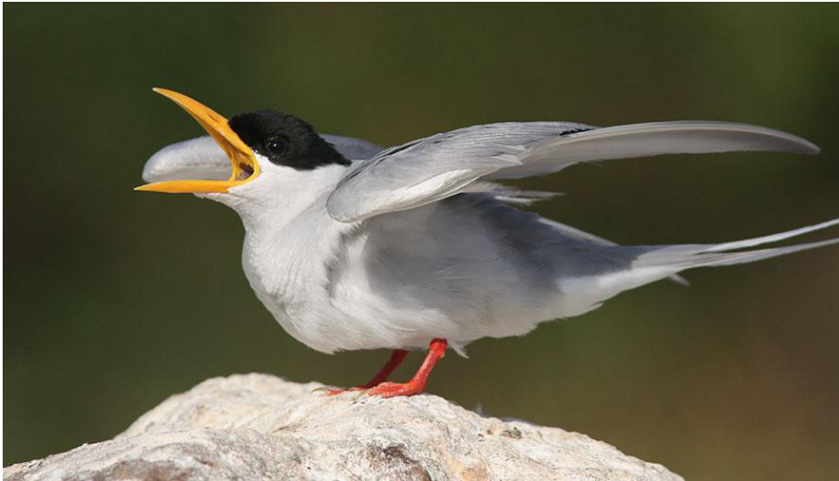
River Tern, Ranganthittu Bird Sanctuary.