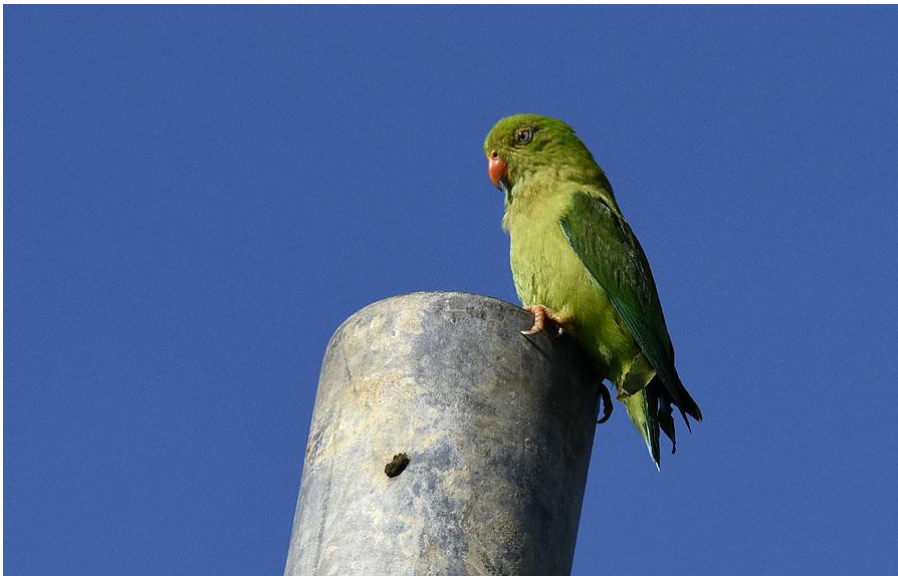
Vernal Hanging Parrot på häckplats, rätt ner i röret. Mt Harriet.