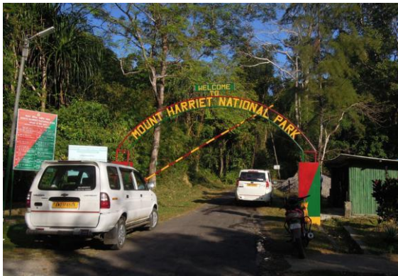
Entrén till nationalparken Mt Harriet.

Vi hade ett område kvar att besöka på Andamanerna och det var den högsta toppen på Södra Andamanerna, Mt Harriet. Det växer fin regnskog här med inslag av lite trädplanteringar, både inom som utanför det skyddade området. Vi promenerade vägen uppför mot gaten och fann bl a Changeable Hawk Eagle , Japanese Sparrowhawk (2 ex), några Brown Coucals , Common Emerald Doves , Andaman Treepie och flera Black-naped Orioles . Det blev snabbt varmt och fågeltillgången avtog. Då kom det istället fram mängder med fjärilar, bl a flera arter Birdwings . Redan kvart över tio återvände vi till färjeläget och lunchen i Port Blair.