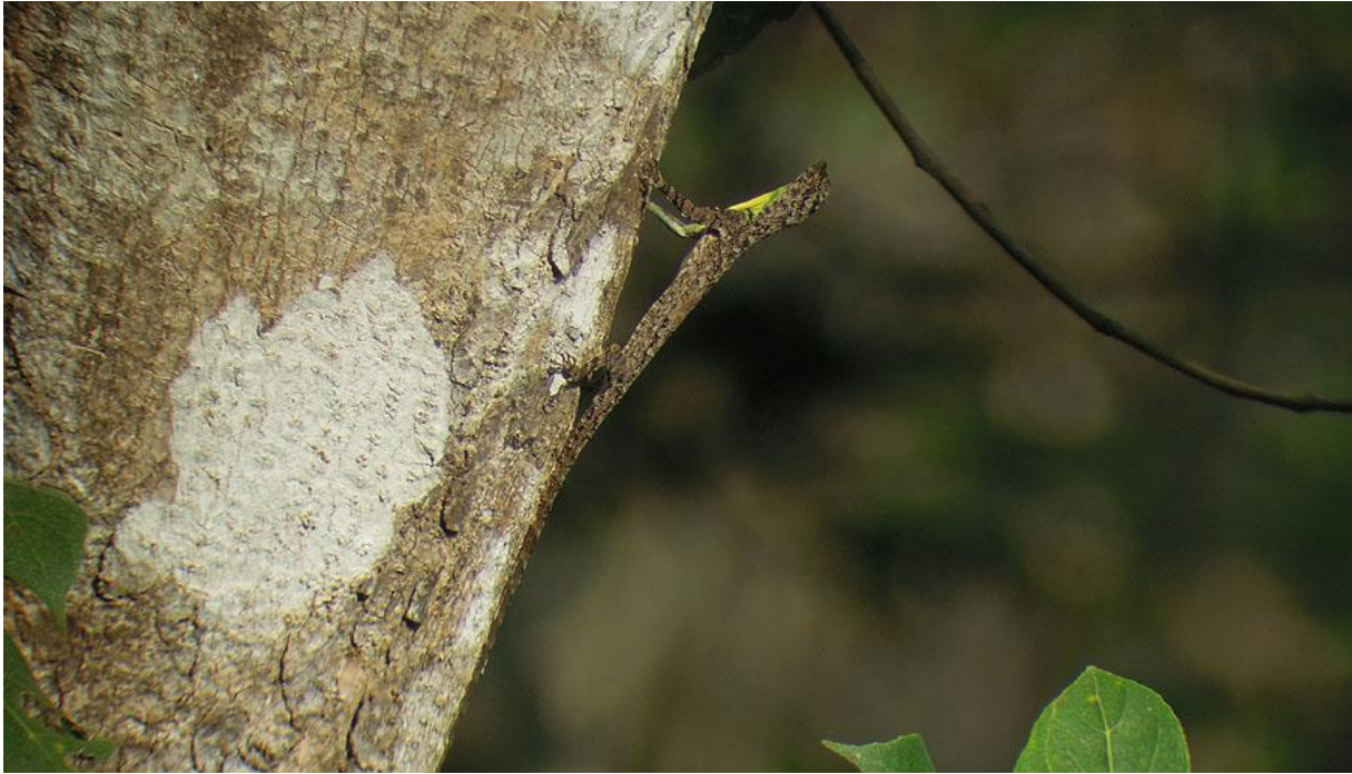
Western Ghats Flying Lizard, Thattekad.