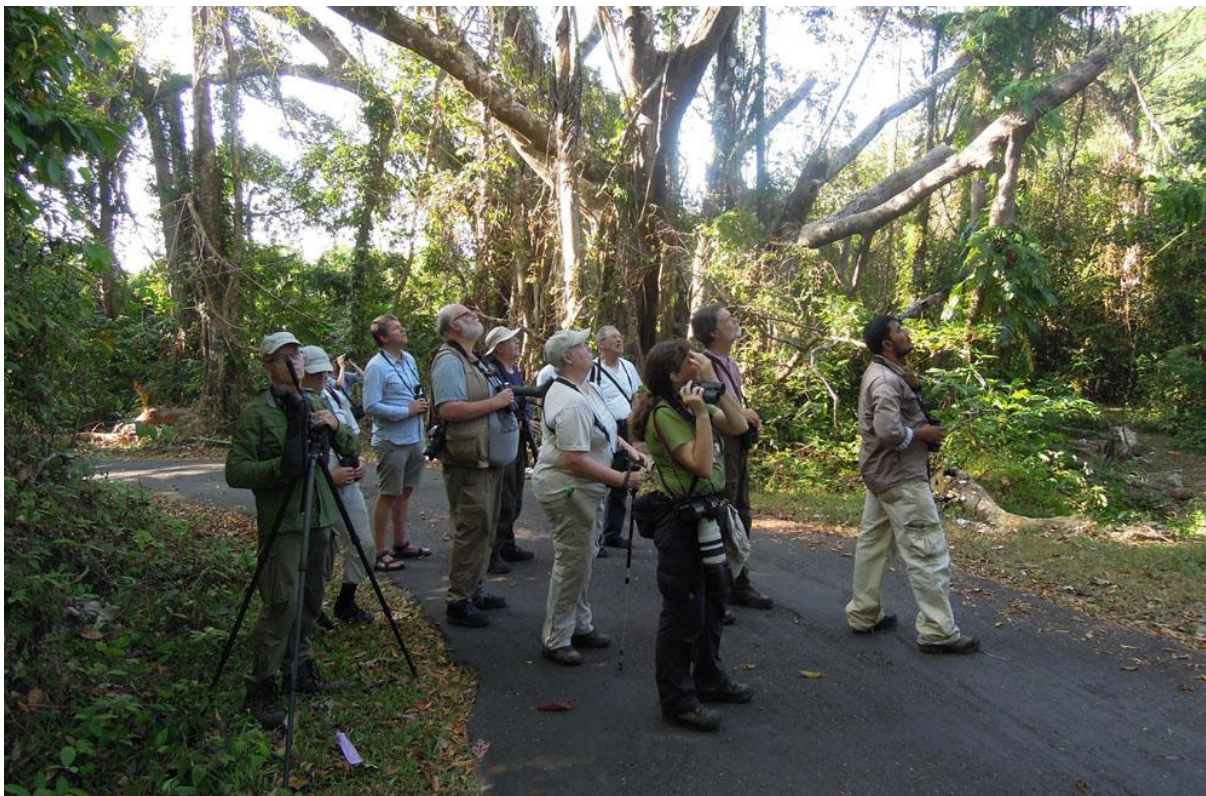
Gruppen väntar ut något på Mt Harriet, Andaman Islands.