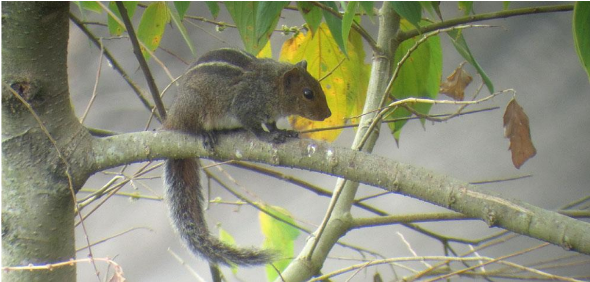
Western Ghats Striped Squirrel, Lockart Gap.