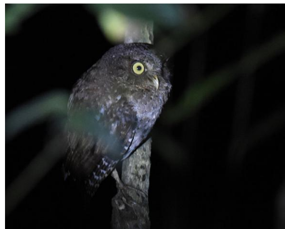
Andaman Hawk-Owl .

Scops Owl . Tre fåglar svarade snabbt på ljudet. En fågel sågs också mycket bra. Här fick vi också se 1 Andaman Hawk-Owl , en uggle vi bara hörde igår kväll under våra uggleövningar.