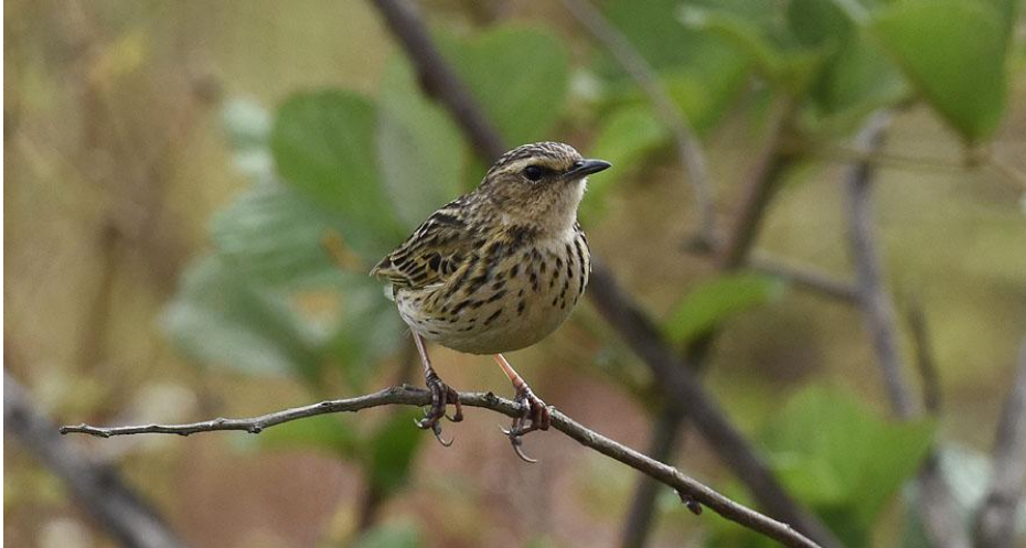
Nilgiri Pipit , Lockhart Gap.