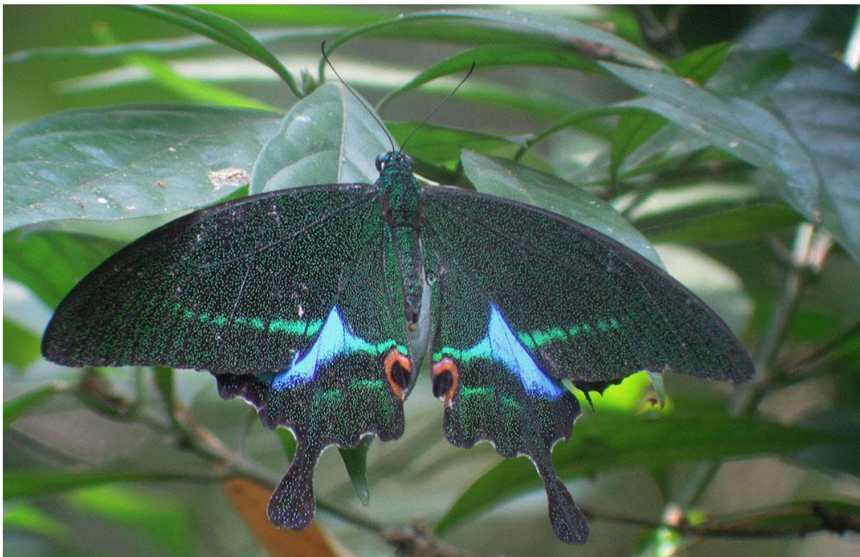
Common Banded Peacock , en fin fjärilsart man finner i Syd- och Sydostasien.