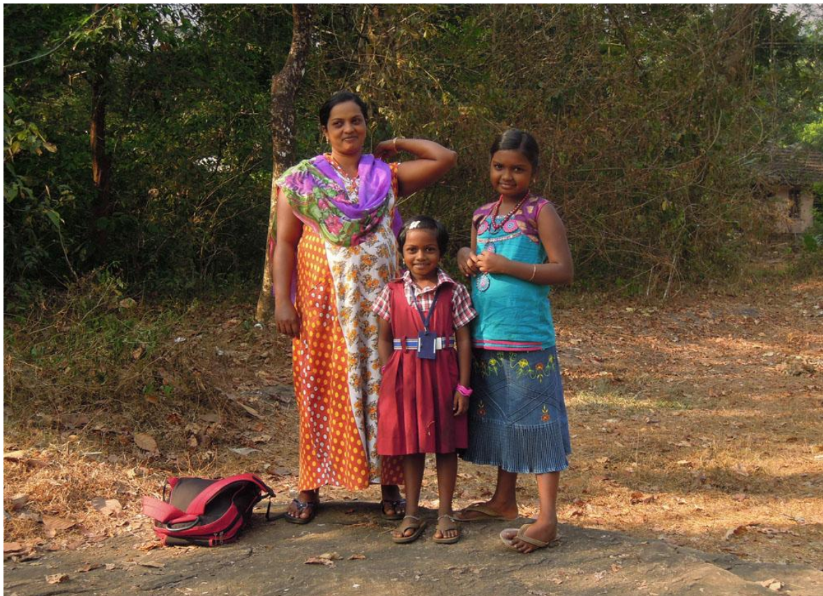
Lillasyster väntar på skolskjutsen.