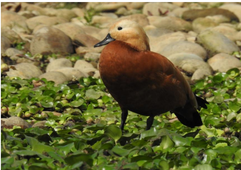
Rostand. Chitwan NP.