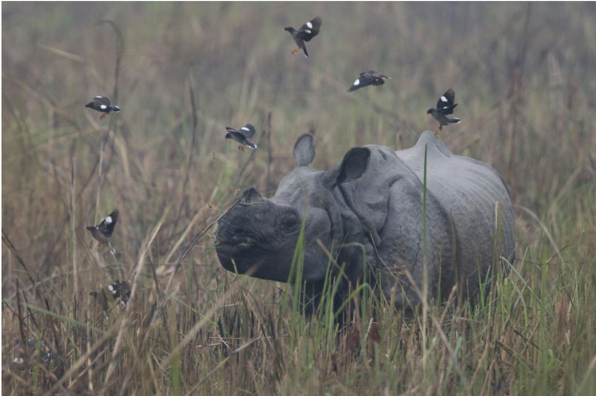
Pansarnoshörning och Jungle Mynas. Chitwan NP.