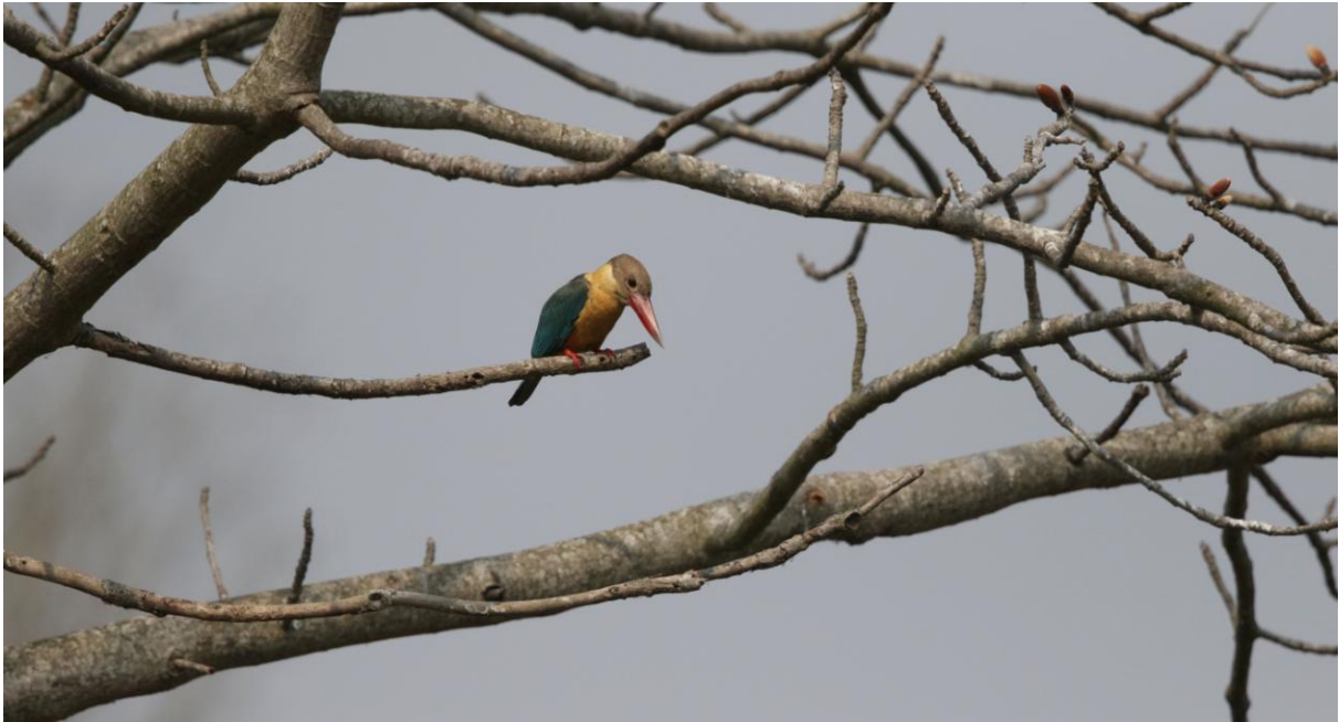
Stork-billed Kingfisher. Kosi Barrage.