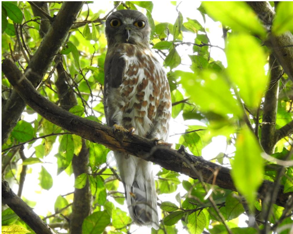
Brown Hawk-Owl. Koshi Camp.