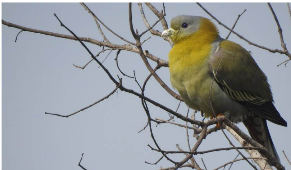
Yellow-footed Green Pigeon. Kosi Barrage.