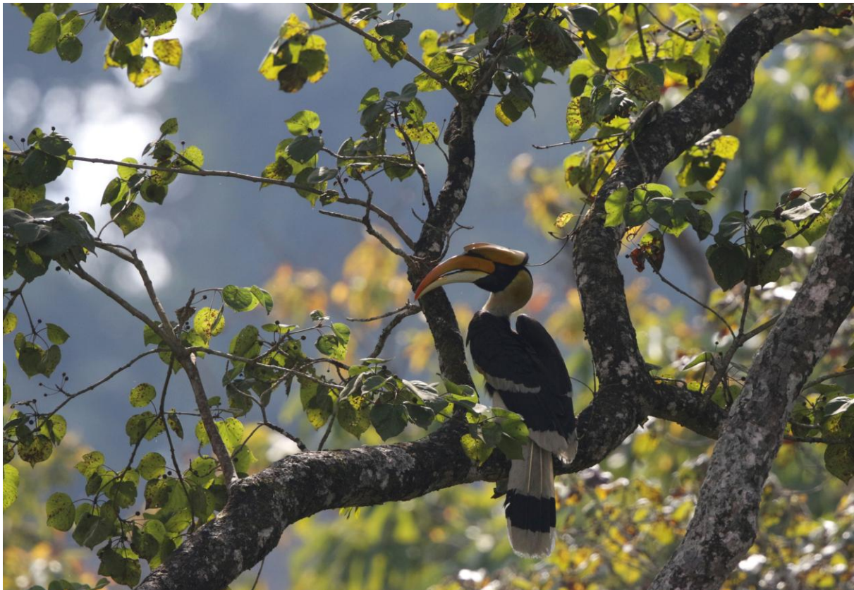
Great Hornbill. Chitwan NP.