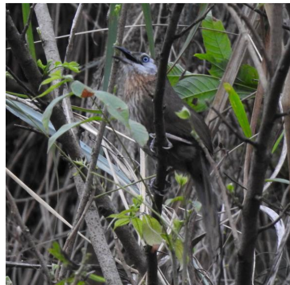
Spiny Babbler.

Vårt andra försök efter Spiny Babbler var mera lyckosamt med tre sjungande fåglar, varav en fågel sågs mycket bra. Miljön vi hittade fåglarna i var en risig sluttning. Ingen märkvärdig miljö alls. Arten är faktiskt endemisk för Nepal 2 .