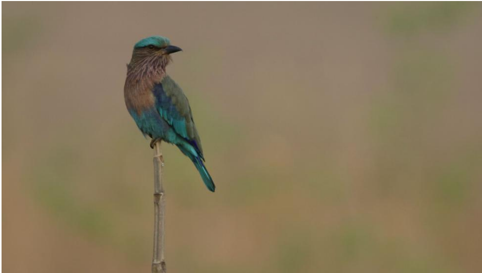
Indian Roller. Kosi Barrage.