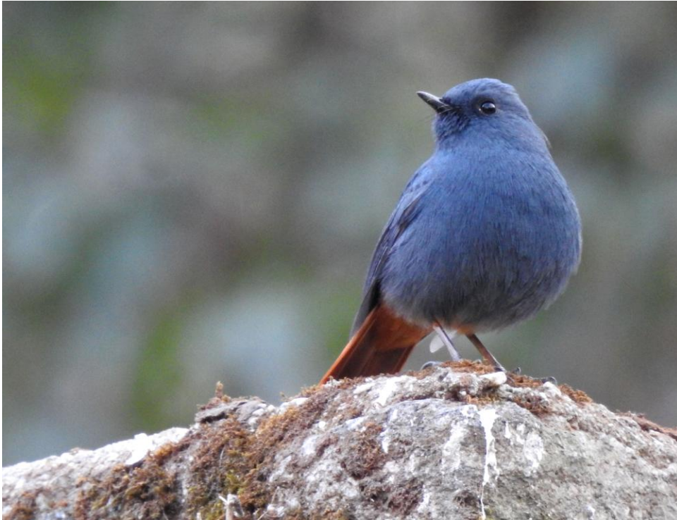
Plumbeous Water Redstart. Shivapuri NP.