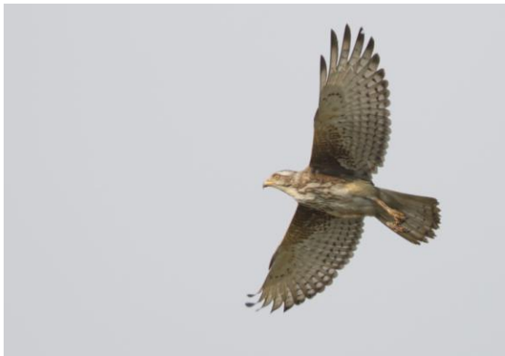
White-eyed Buzzard, efterlängtat för många. Kosi barrage.

På kvällen artgenomgång och god middag på vår lodge.