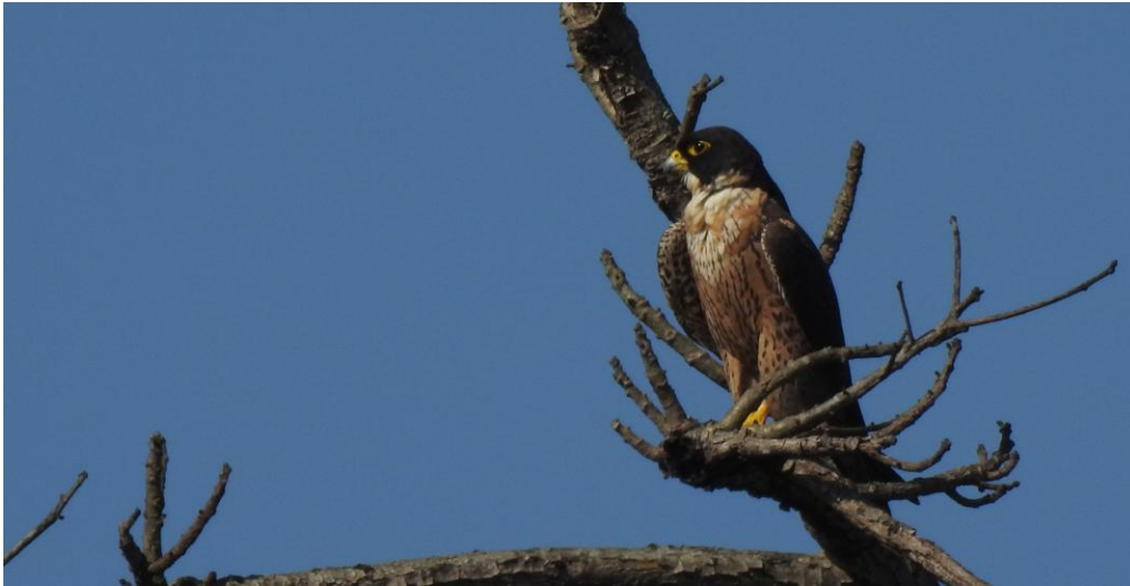
Pilgrimsfalk/ peregrinator . Chitwan NP.