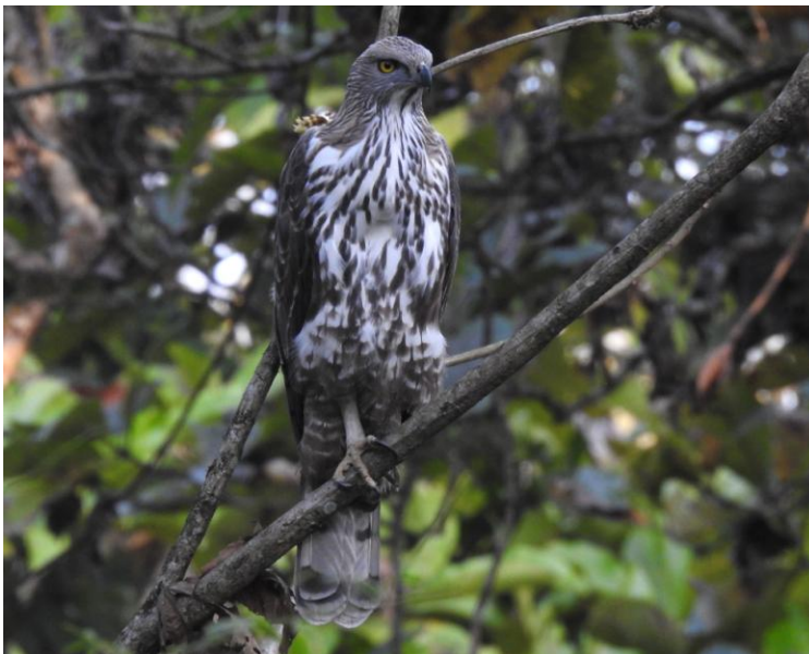
Changeable Hawk-Eagle. Chitwan NP.