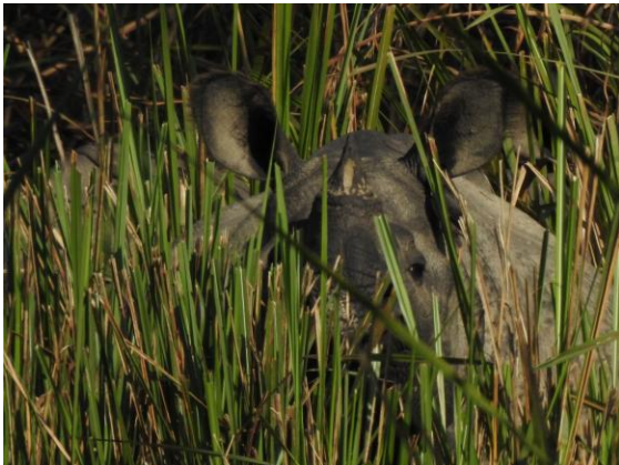
En pansarnoshörning lurar i gräset.

Ny heldag i Chitwan NP. Vi körde på nytt västerut, men inte lika långt iväg som igår. Vi drog oss mera mot bergskedjan i söder och hoppades på nya fågelarter till listan. Den täta sal -skogen var imponerande med sina höga träd, träd med plankrötter och tät undervegetation. En fröjd att få vara här! Redan tidigt så stoppades vi av en fint sjungande Puff-throated Babbler. Då och då såg vi skymten av en noshörning när vi nådde öppna gräsmarker. När vi vek av på en ny grusväg hände det mycket i fågelfaunan. Här var det gott om hackspettar och vi kunde bokföra Greater Yellownape, Rufous Woodpecker och White-browed Piculet som nya för resan. Här fanns också Lesser Yellownape och Grey-capped Pygmy Woodpecker. Vilka hackspettsmarker! Två Yellow-bellied Warbler visade sig också fint i ett bambubestånd, bambuspecialist som arten är.