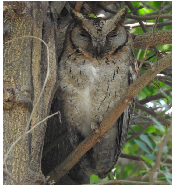
Indian Scops Owl. Koshi camp.

På kvällen artgenomgång och god middag på lodgen.