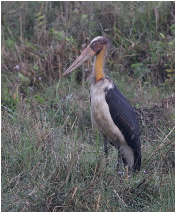
Lesser adjutant i Chitwan NP.

Ett regn förvisade oss till fåtöljerna under verandataket och här serverades vi te, lokal snaps och popcorn. Artgenomgång, som gav 76 nya researter, och god middag i lodgerestaurangen.