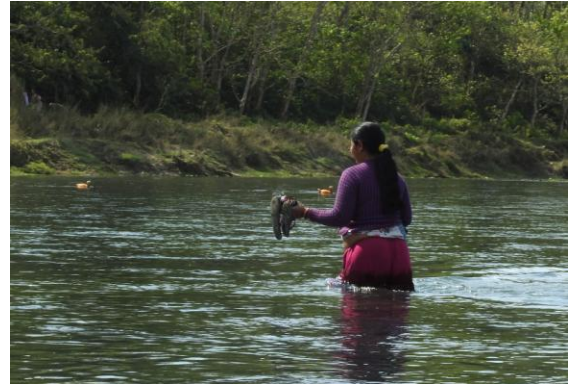
Varför ta båten när man kan vada. Rapti River, Chitwan NP.