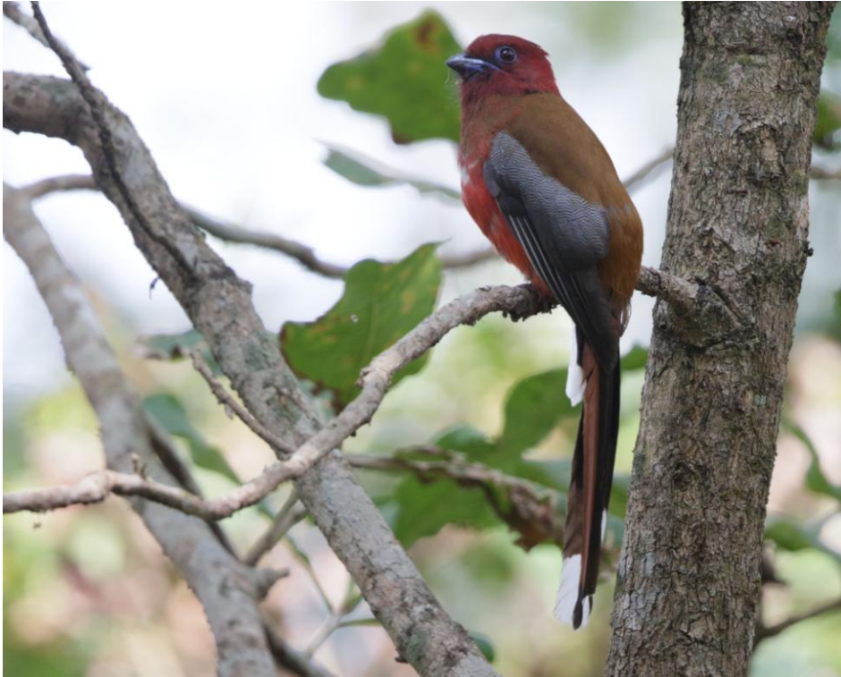
Red-headed Trogon. Chitwan NP.