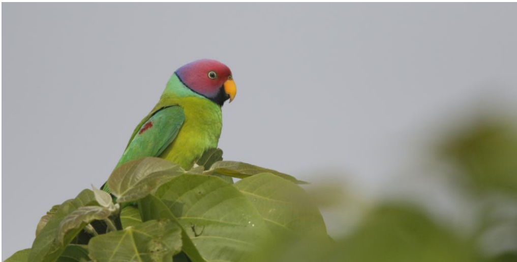
Plum-headed Parakeet. Chitwan NP.