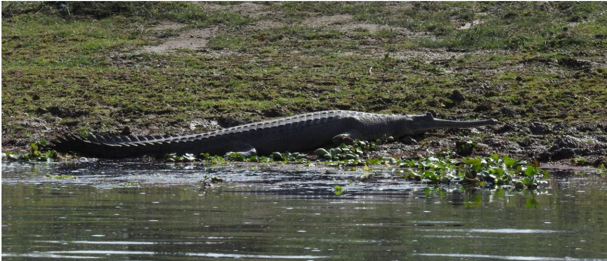
Indian Gharial. Chitwan NP.