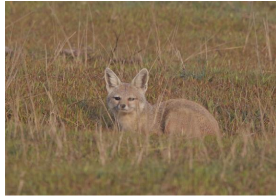
Bengal Fox. Kosi Barrage.

Själva bron, Kosi Barrage, var vårt första stopp och här hittade vi fler guldkorn för Nepal. Två gangesdelfiner visade sina ryggar vid flera tillfällen och bland snatteränderna fanns en vitögdd dykand och rariteten bergand. Längre uppströms i de rika jordbruksmarkerna, många små vattendrag, gick fem Grey-headed Lapwings. Vilken härlig eftermiddag vi fick. Inte nog med det. På vägen