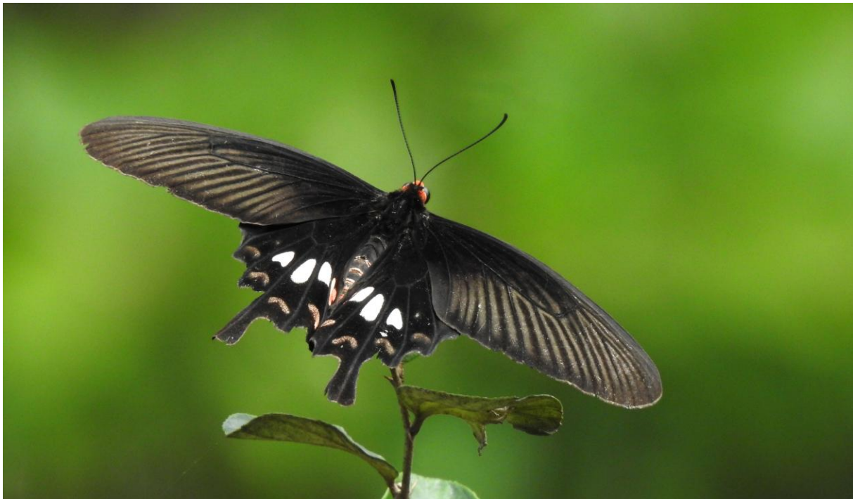
Red Helen, Papilio helenus . Koshi Tappu Wildlife Reserve.