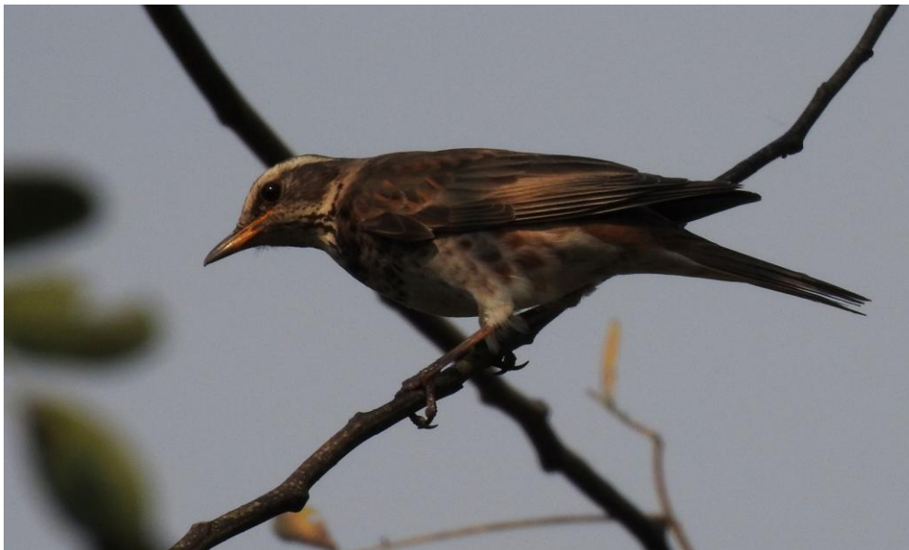
Dusky Thrush. Deban, Namdapha NP.