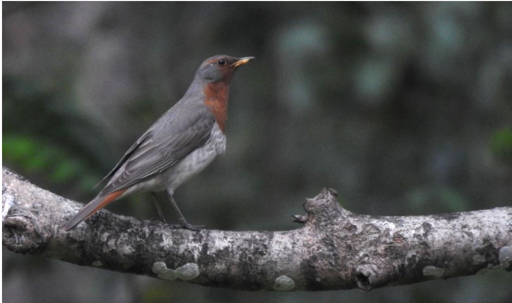
Rödhaltsad trast. Deban, Namdapha NP.