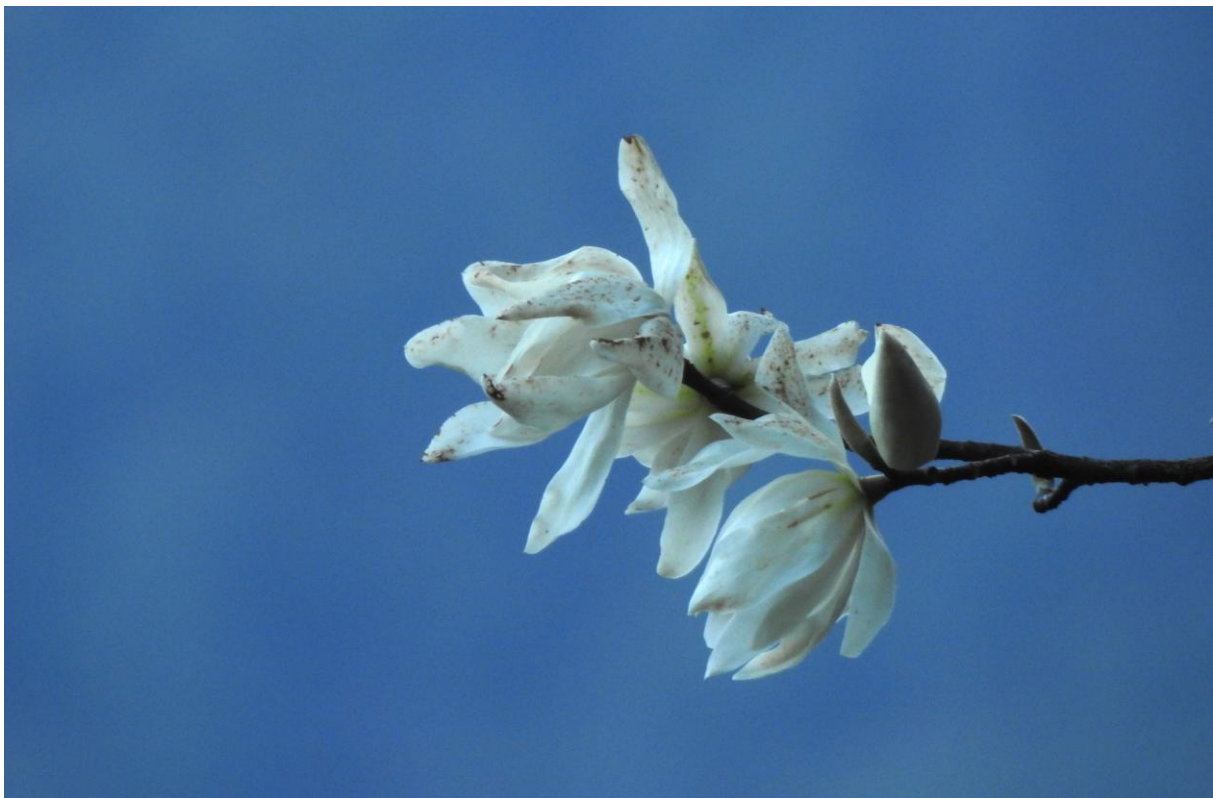
Magnoliorna blommade fint i Mishmi Hills.