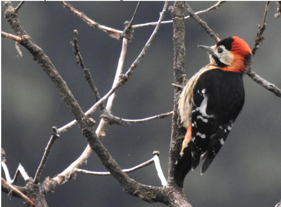
Crimson-breasted Woodpecker. Mishmi Hills.