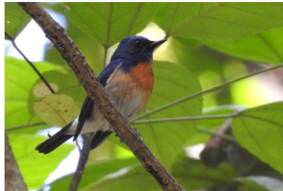
Blue-throated Blue Flycatcher sjöng flitigt under vår vandring i Namdapha NP.

Efter frukosten selade vi på oss för dagens vandring, 12 km till Hornbill camp. Två båtsmän tog oss över Noading River och sedan bar det av i sakta mak. Vi vandrade genom en regnskogslik skog med högresta träd och tät undervegetation. Det blev massor av stopp under promenaden för att lyssna in fågelljud iv hörde och spana igenom de små meståg som då och då for förbi. Vi såg närmare 50 nya researter under promenaden och bland de mest åtråvärda må nämnas Austen's Brown Hornbill, Blue-naped Pitta, Sapphire Flycatcher och ett gäng på fyra Great Slaty Woodpecker, världens största hackspett. Tidigt på morgonen fick vi också en mycket fin obs på ett par Western Hoolock Gibbon, en starkt hotad art.