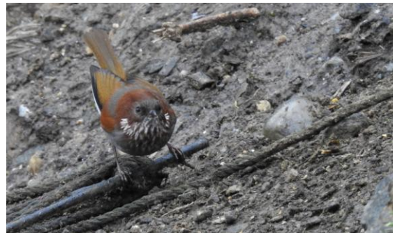
Brown-throated Fulvetta, Mayodiya Pass.

för att det skulle upphöra. Flera nya fina fåglar väntade på oss här och vi noterade bl a Brown-throated Fulvetta, Dark-rumped Rosefinch och Streak-throated Barwing. Längre fram längs vägen sjöng också en Bar-winged Wren Babbler. Vilken eftermiddag vi fick vara med om. Vi hann njuta av Himalayan Cutia innan skymningen tog över och vi återvände till vårt logi för artgenomgång och middag