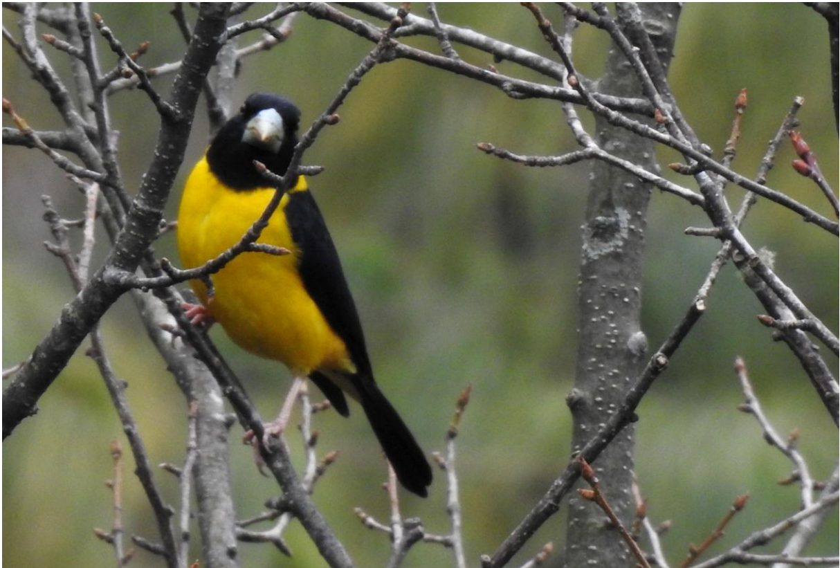
Collared Grosbeak. Mishmi Hills.