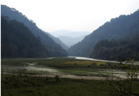
Tillbaka till Noading Rvier. Deban, Namdapha NP.