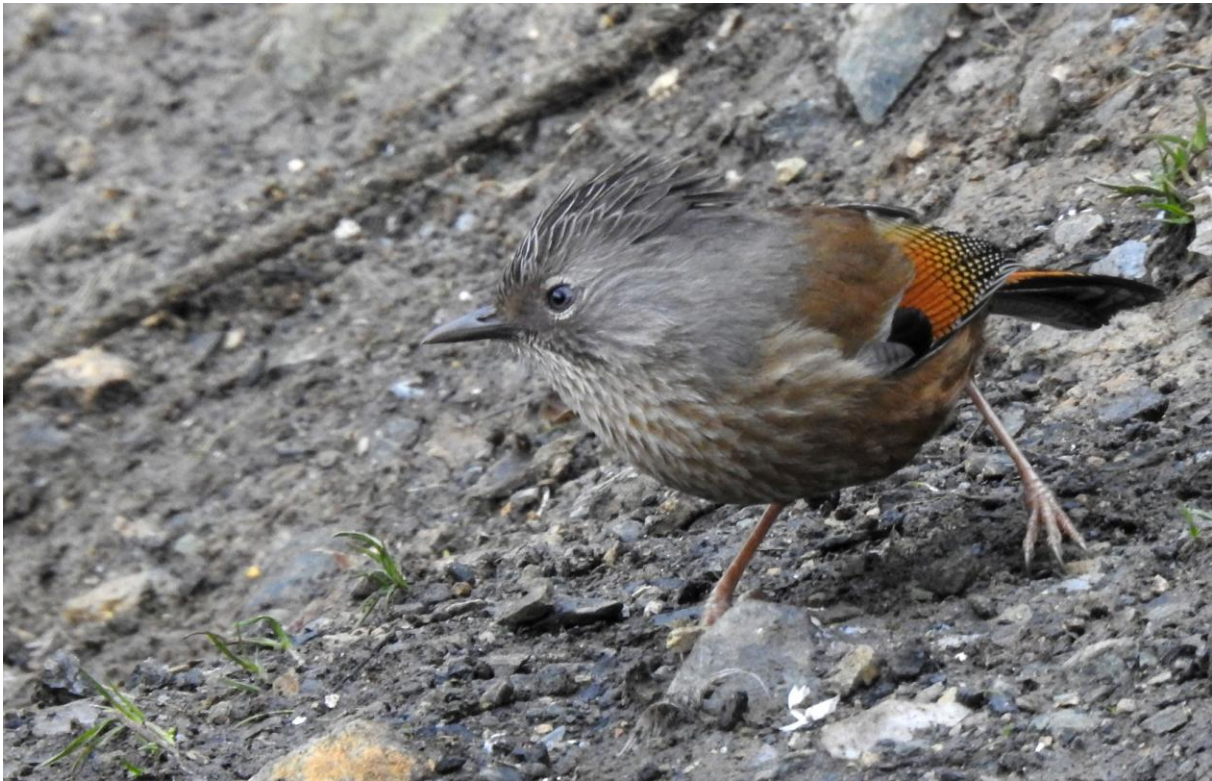
Streak-throated Barwing. Mishmi Hills.