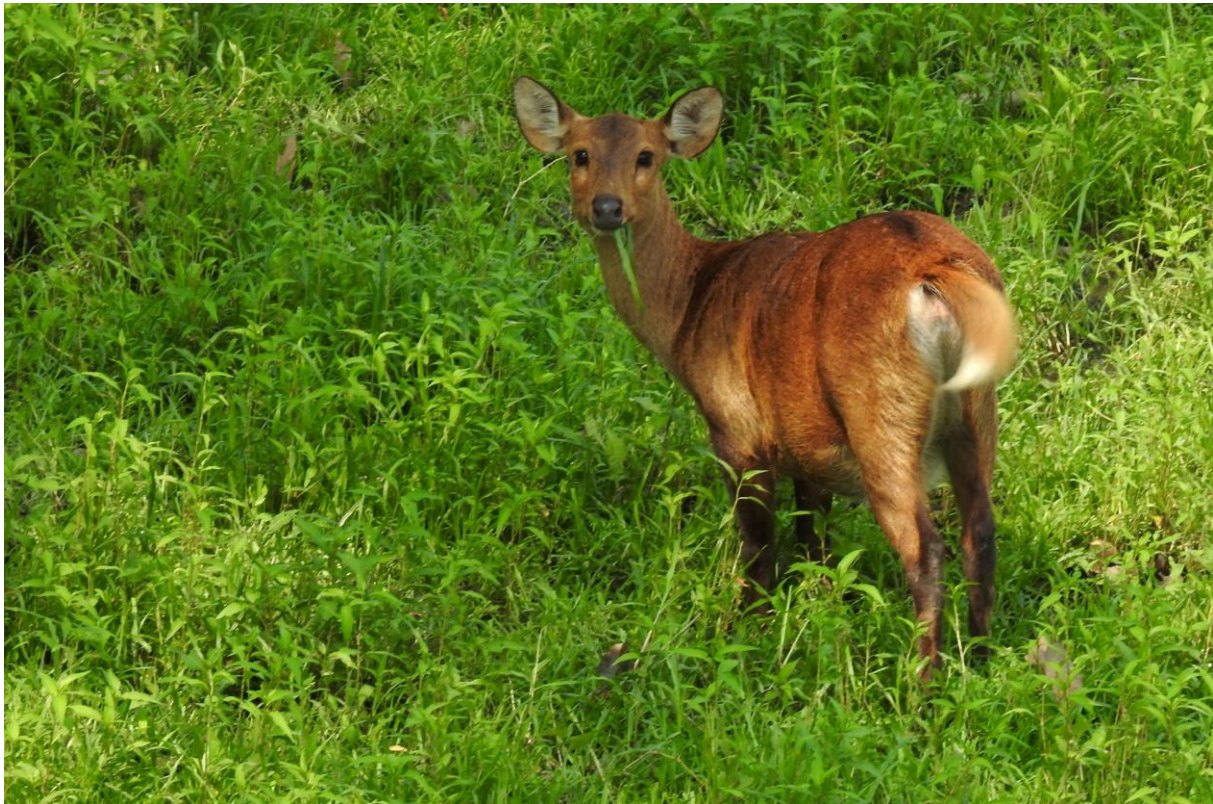
Hog Deer, Kaziranga NP.