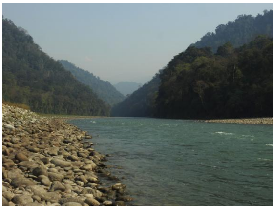
Noading River. Deban, Namdapha NP.

Sista sträckan in till Deban Forest Rest House var under upprustning. Ett arbete som strävar till att få vägen körbar även efter monsunen. Framme vid Deban bjöds vi på te och pakoras 3 . Därefter följde en dryg timmes skådning över flodbädden av Noading River. Vi bjöds på lite av varje, bl a två utfärgade rödhalsade trastar. Det hade tydligen varit en riktig trastvinter i år! Vi hade fina vyer över klapperstensstränderna som följde floden. Svartryggade sädesärlor av rasen leucopsis födosökte bland stenarna och River Lapwing stod och poserade fint. Ola hann se en bortflygande Crested Kingfisher, så vi andra håller tummarna för morgondagen.