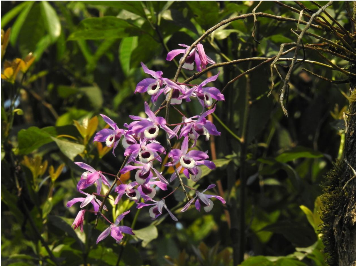
Trädväxande orkidéer i Namdapha NP.