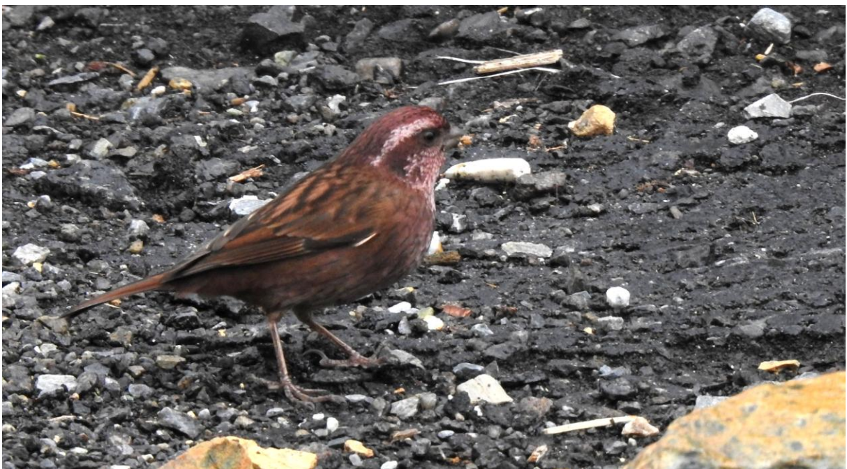
Dark-rumped Rosefinch. Mishmi Hills.