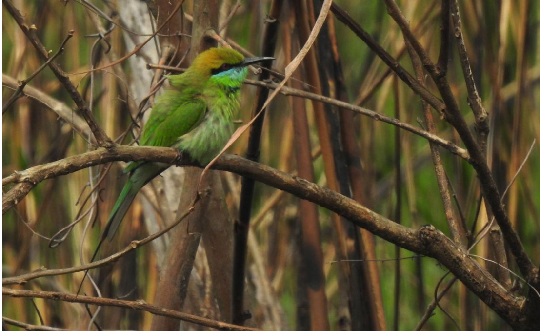
Green Bee-eater. Vanlig i Kaziranga NP.