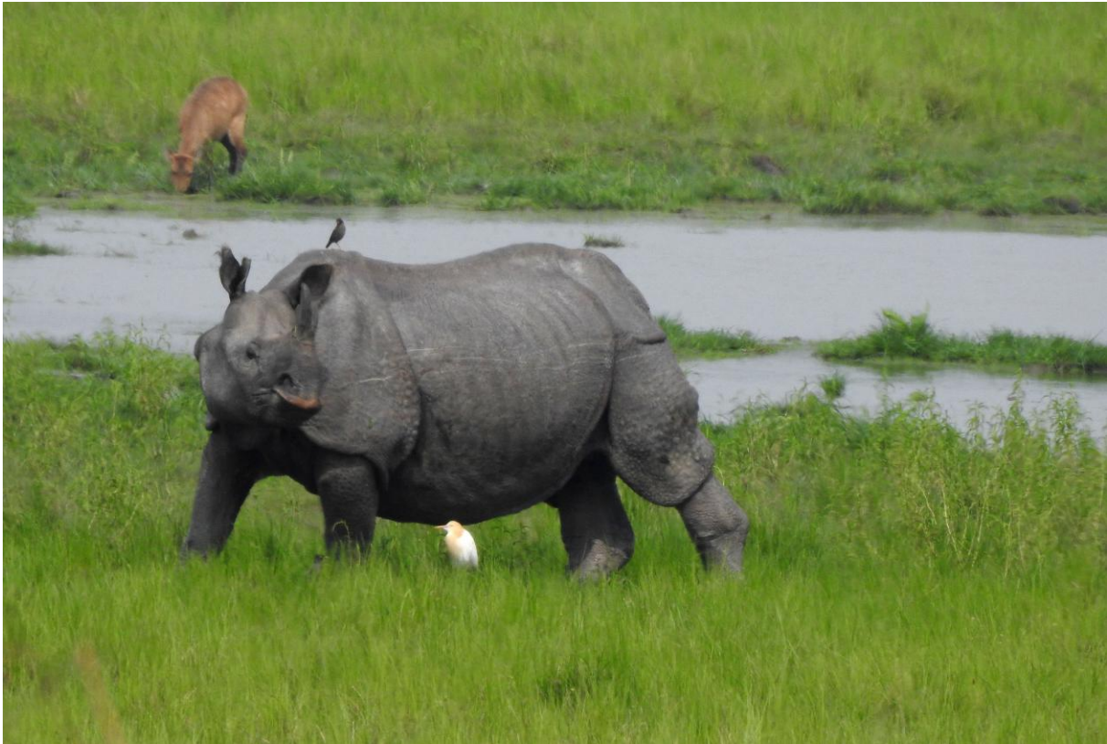
Pansarnoshörning. I bakgrunden en Hog Deer. Kaziranga NP.