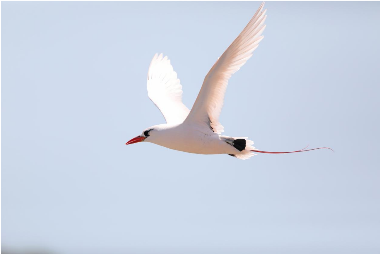
Red-tailed Tropicbird hade fin flyguppvisning på Nosy Ve.