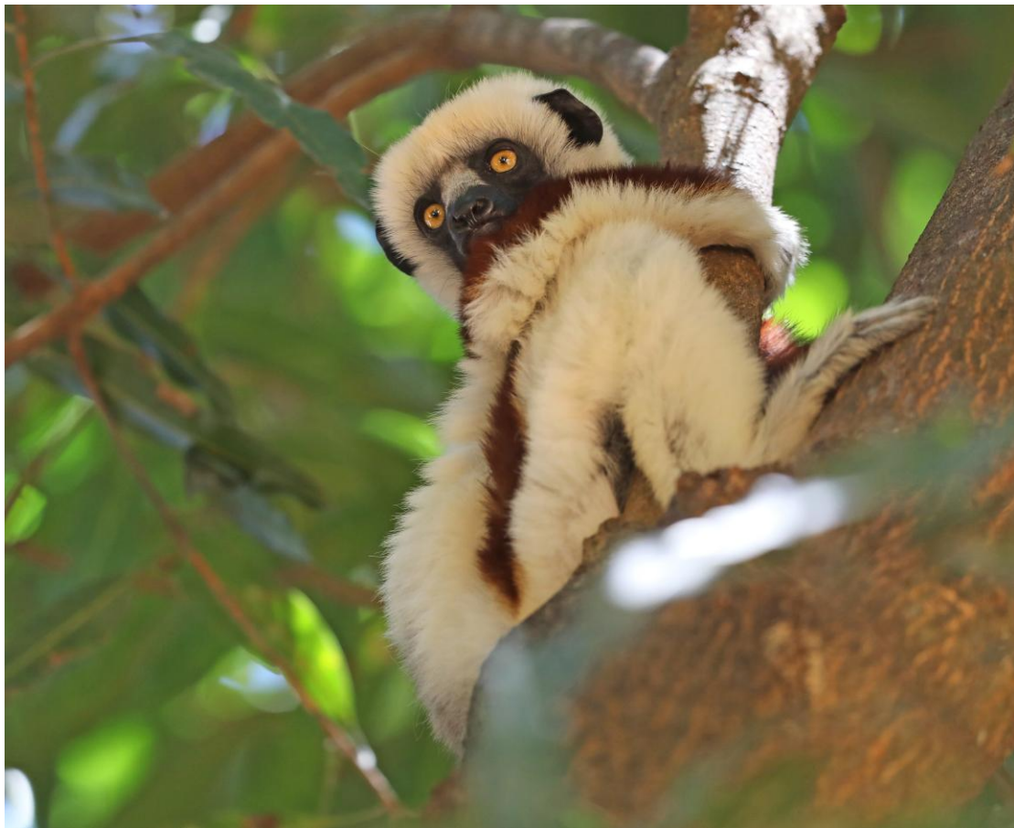
Coquerel's Sifaka - en av många vackra lemurer.