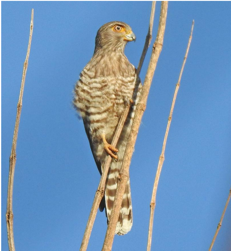
Banded Kestrel i Ankarafantsika nationalpark.