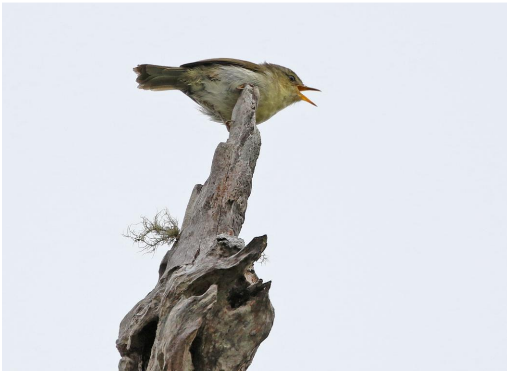
Cryptic Warbler, beskriven så nyligen som 1996!