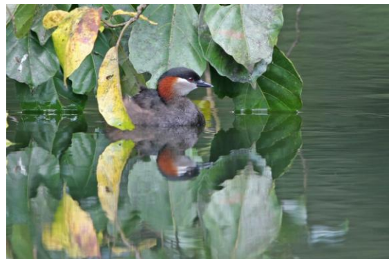
Madagascan Grebe.