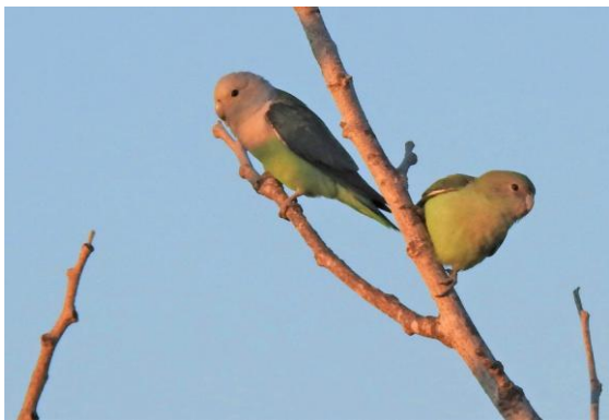
Grey-headed Lovebirds.