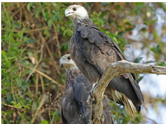
Ett par Madagascan Fish Eagle visade sig fint vid Lake Ravelobe!

Morgonbesök vi det lilla reservatet Alarobia Lake i Tanas utkant. Reservatet domineras av ett par dammar, som var prickiga av änder. Red-billed Teal dominerade, men vi såg också flera vackra hannar av Hottentot Teal. Efter lite spaning hittade vi den endemiska Meller's Duck - egentligen ganska intetsägande, drygt gräsandsstor och lik en gräsandshona, men med grått näbb. Men en endem är iallafall en endem! White-faced Whistling Ducks var vanliga och vi hittade också ett par Knob-billed Ducks. Vassar, buskage och träd höll kolonier av ett antal hägrar, bl a rallhäger, den vackra Malagasy Pond Heron, både svart och vit fas av Dimorphic Egret, samt Black Heron. Efter lunch på Tanas flygplats flög vi till Mahajanga i nordväst, där vi möttes av mycket varmt och torrt väder. Vi fortsatte med buss till Ampijoroa, där vi i skymningen fick se den märkliga Sickle-billed Vanga vid parkentrén. En kort bussresa tog oss sen till trivsamma Asity Lodge, som skulle bli vårt hem i två nätter.