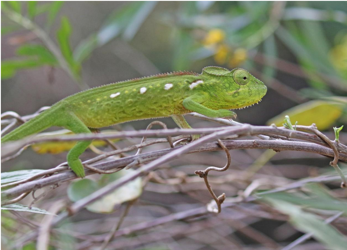
Oustalet's kameleont, Anja-reservatet.