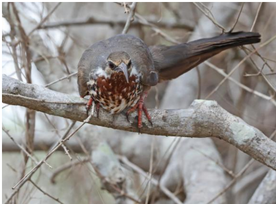
Subdesert Mesite i "spiny forest".

hanar av Sakalava Weaver sjöng från trädtopparna. Under den fortsatta vandringen sågs flera arter Vanga - bl a Red-tailed, Hook-billed och Sickle-billed. En sjungande hane av Archbold's Newtonia, numera medlem av den utvidgade vanga-familjen, kunde även beskådas. Förmiddagens fågel blev dock en hona av den spektakulära Long-tailed Ground Roller, som visade upp sig mycket fint. Skådningen fortsatte sen vid de närbelägna salinerna, med den endemiska Madagascan Plover som mållart. Flera ex av den snarlika Kittlitz's Plover, hittades, men ingen Madagascan, trots omfattande spaning. Vi bröt skådandet när middagshettan började bli besvärande och drog oss tillbaka till hotellet för lunch och siesta eller bad. Eftermiddagsskådningen började vid salinerna – vi skulle hitta Madagascan Plover! Och efter ganska långa och omfattande spaning hittade vi verkligen denna lilla pipare och fick se den på nära håll! Dags att åka tillbaka till Spiny Forest för att leta efter ännu en lokal endem – Lafresney's Vanga. Det blev en rätt lång vandring i taggskogen innan vi äntligen hittade vangan, som bara finns i sydvästhörnet av Madagaskar. Nöjda kunde vi i skymningen återvända till vårt hotell!