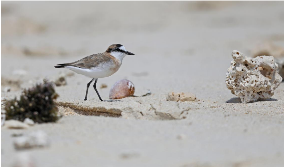
White-fronted Plover, Nosy Ve.