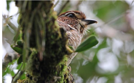
Short-legged Ground Roller i Ranomafana nationalpark.

Velvet Asity, Common Sunbird-Asity, samt en röd hane av resans enda Forest Fody. Eftermiddagens utsikter lovade regn och så blev det också, men det blev ändå en eftermiddagstur för de tappreste, som hoppades på att hitta några av de eftertraktade arterna i de planare delarna. Regnet tilltog dock allt mer och efter ett tag beslöt vi avbryta eftermiddagens vandring.