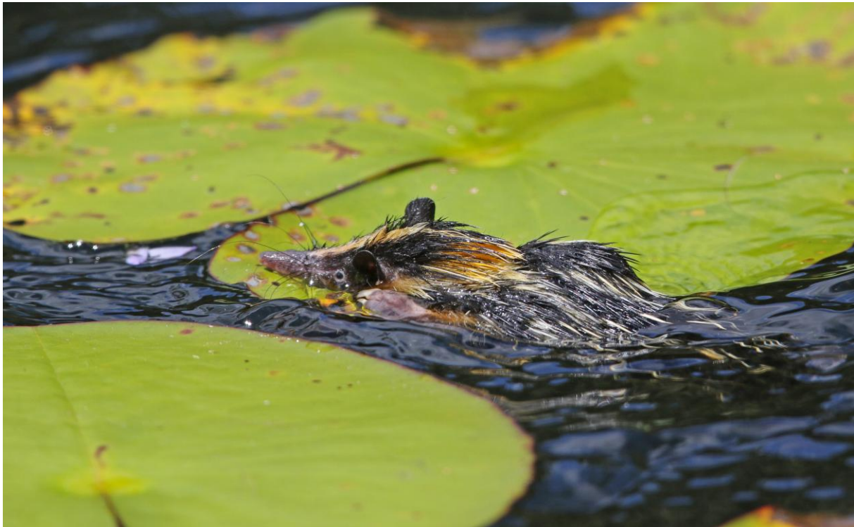
Lowland Streaked Tenrec är en överraskande god simmare!