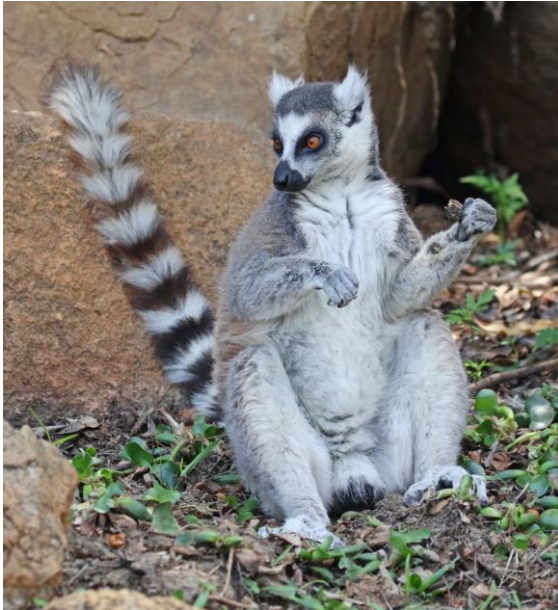
Ring-tailed Lemur i Anja-reservatet.

park och vårt hotell där, Centrest, som vi nådde sent på eftermiddagen.