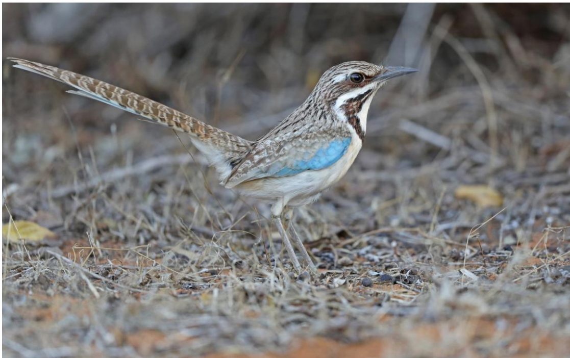
Long-tailed Ground Roller, hona. En av resans mest spektakulära arter!