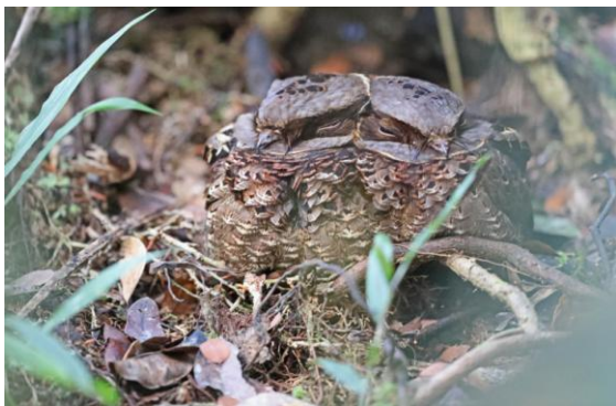
Ett par Collared Nightjar i Perinet NP.

2 oktober. Lite morgonskådning i hotellträdgården gav bl a Malagasy White-eye, Madagascan Magpie-Robin, Souimanga Sunbird, Red Fody och Madagascan Wagtail. Efter en god frukost checkade vi ut och åntrade bussen för dagens resa till nationalparken Perinet, några timmars körning i stort sett rakt öster ut. Vi åkte genom ett landskap dominerat av risfält, med vita och svarta Dimorphic-hägrar, samt ägrett-, ko- och rallhägrar och några Hamerkop. Så småningom blev det lite mer kuperat och skogigt och vi anlände till vårt hotell, Lemur Lodge, i Perinet vid lunchtid. Lunchen på hotellet var franskinspirerad och överraskande elegant. Eftermiddagens skådning i de lägre och mindre kuperade delarna av parken blev en fin start med bl a 2 ex av den svårsedda och mycket speciella Collared Nightjar, tätt tryckta intill varandra, ett flertal arter vangor: Chaberts, Blue, Tylas, Red-tailed Vanga och Ward's Flycatcher (ja, numera en vanga, den också!), samt Madagascan Starling.