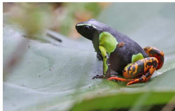
Madagascan Painted Frog eller Baron's Mantella är en fantastiskt färgad liten groda!

Frukost, utcheckning och avfärd med bussen, med besök i våtmarker och risfält strax utanför Ranomafana. Vår lokale guide mobiliserade en imponerande skara arbetare i risfälten, som gjorde sitt bästa för att skrämman upp eventuella rallbeckasiner och Madagascan Snipes. Men där kammade vi noll - risfälten var helt fågelfria! I en närbelägen våtmark fick vi iallafall se Madagascan Swamp Warbler och två Blue Couas. Dagens mest spektakulära art blev dock en liten, mycket färggrann groda - Madagascan Painted Frog eller Baron's Mantella! Sen vidtog en lång bussresa på höglandet, med avbrott för lunch i Ambositra där det också var dansuppvigning. Därefter fortsatt bussfärd till Hotel Royal Palace i Antsirabe.