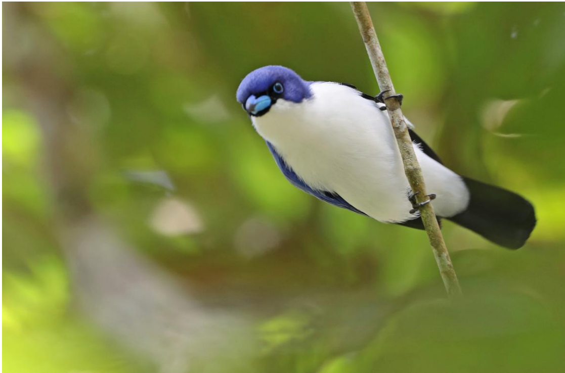
Blue Vanga.