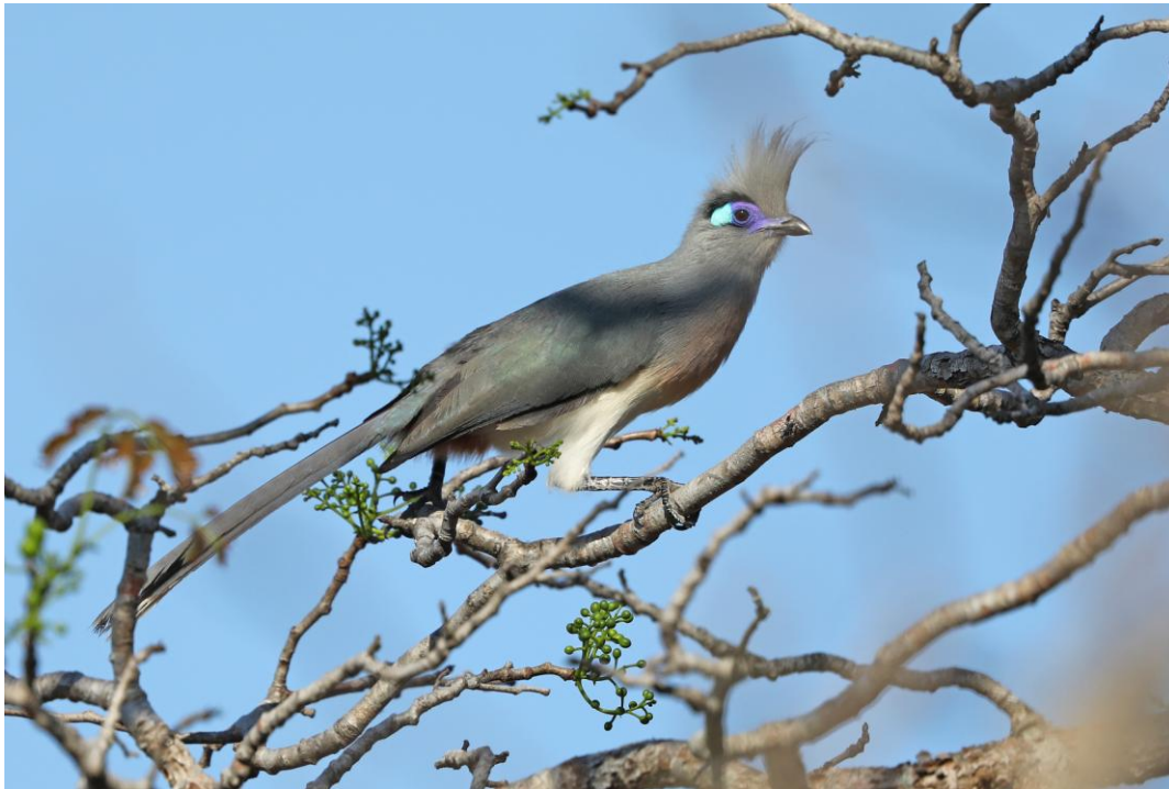
Crested Coua i spiny forest.