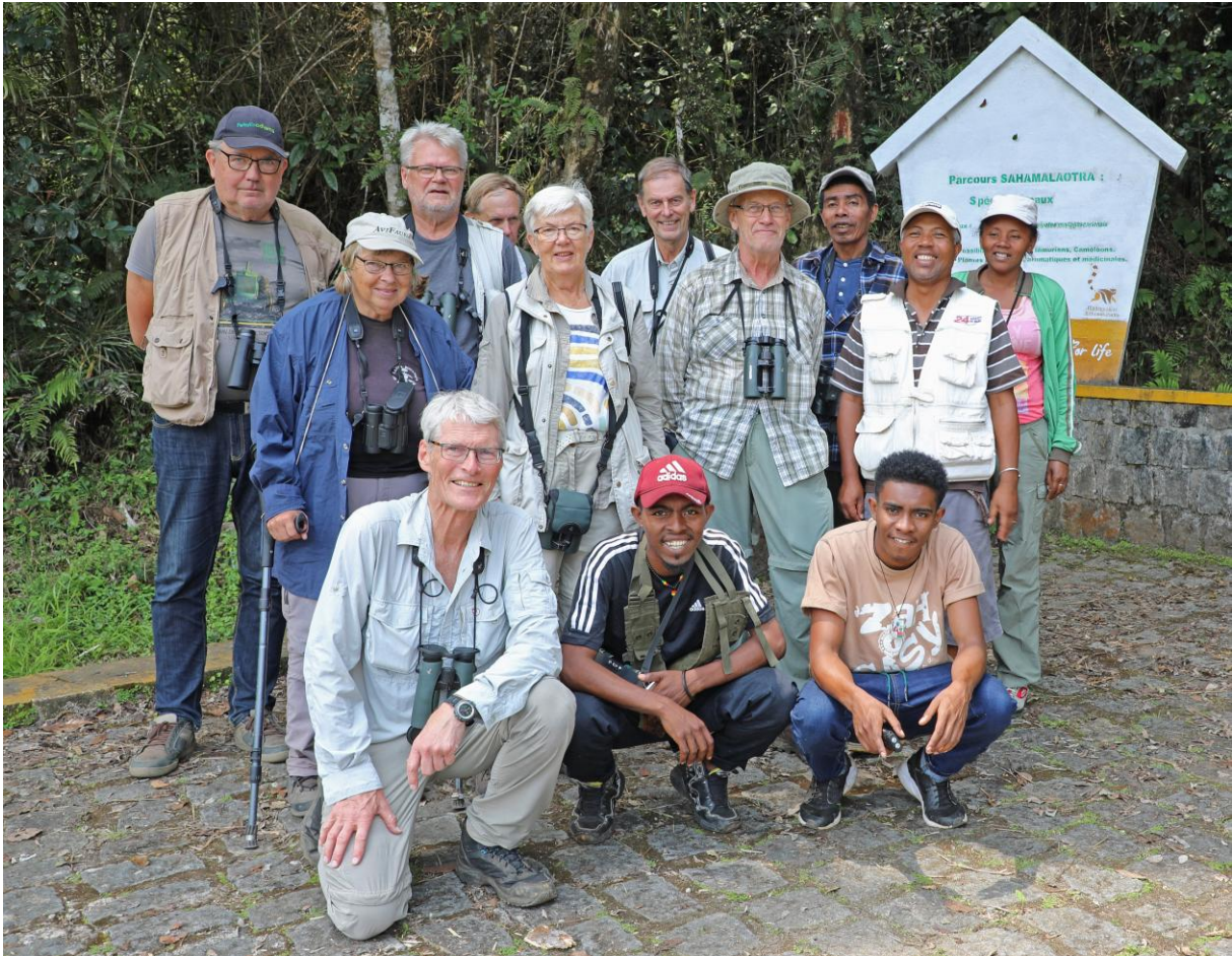
AviFauna-gruppen i Ranomafana.