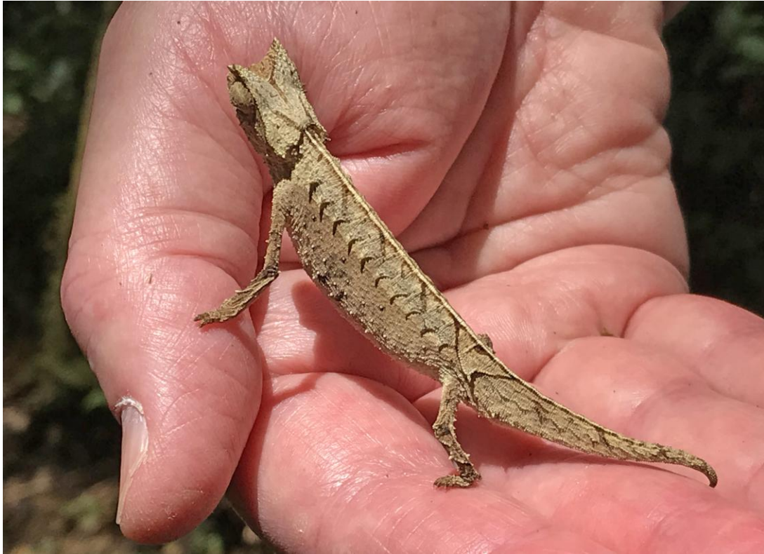
Brown Leaf Chameleon.