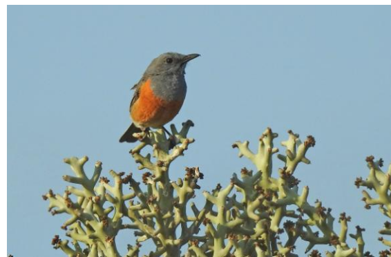
Littoral Rock Thrush, hane, endem för kustregionen i sydväst.

Ve, vilket bl a innebar ett par "wet landings". Det blev ungefär en timmes båtutture i rätt hög fart. På långt håll gjordes hastiga obsar av en sannolik knölval, samt en obestämd albatross, innan vi anlände till Nosy Ve. Spaning mot en sandrevell gav en stor flock Greater Crested Tern, flera fisktärnor, samt en Black-naped Tern. Bäst av allt var dock de tre Crab Plovers som sällskapade med tärnorna! Vi vadade iland i det knädjupa, ljummiga vattnet för att utforska denna obebodda lilla sandö. På ett blottlagt rev kilade flera roskarlar, i buskagen häckade Dimorphic Egret och under några buskar ruvade Red-tailed Tropicbird. Det blev sen fina flyguppvisningar av den mycket eleganta tropikfågeln, varefter vi drog oss mot båten. På vägen dit blev det några obsar av resans enda Humblot's Heron, samt en White-fronted Plover. Båtresan till vårt strandhotell, Safari Vezo i Anakao, tog bara 10 minuter och landstigningen gick bra. Lunch, siesta och sen skådning i hotellparken, vilket gav bl a Subdesert Brush Warbler och den lokala Littoral Rock Thrush.