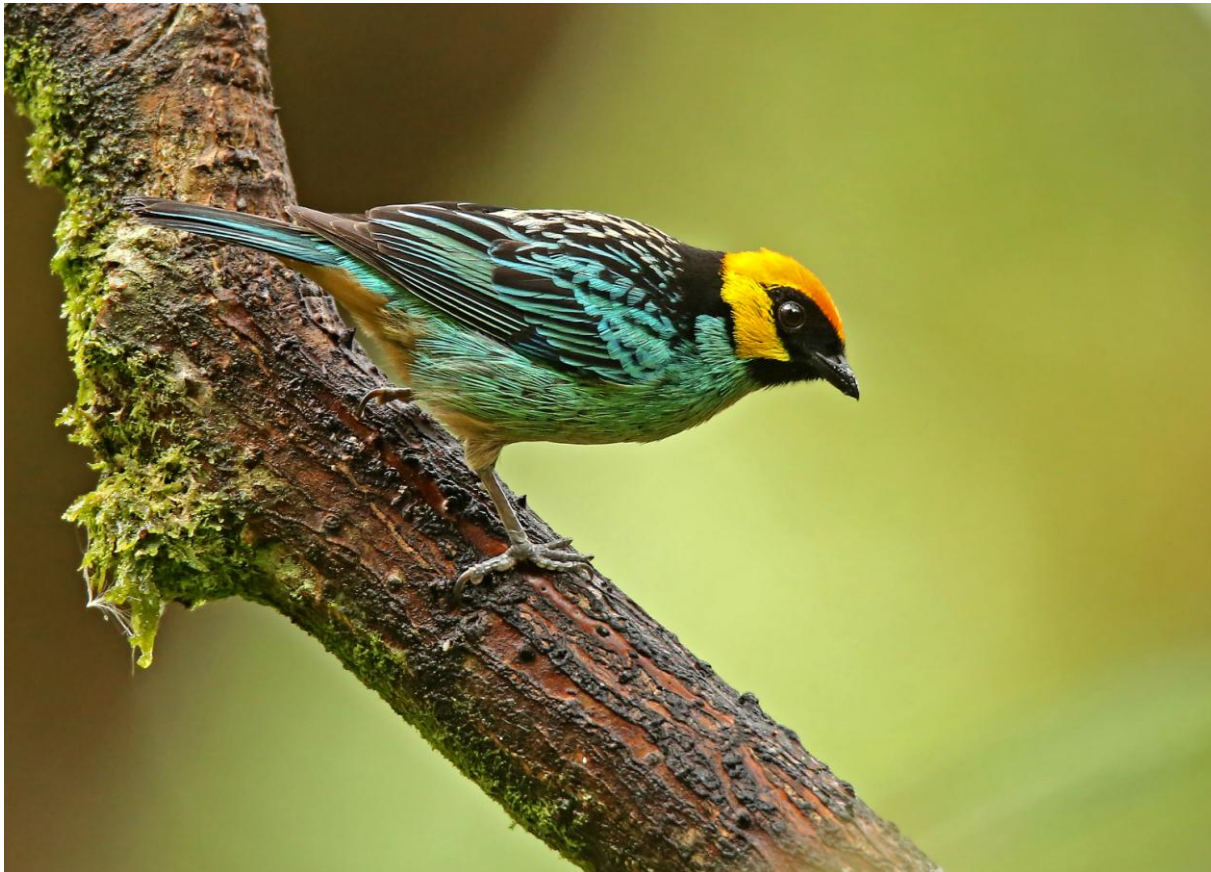
Saffron-crowned Tanager.