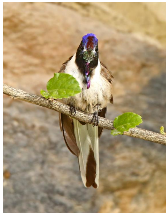
Bearded Mountaineer.

Efter det var det stadsrundtur under ledning av Paul med början i Sydamerikas största katedral tvärs över torget. Sedan till Quirikancha templet ett par kvarter bort. Efter lite vila på hotellet bar det av till en utmärkt buffemiddag med musikunderhållning innan vi tog ner skylten för dagen.