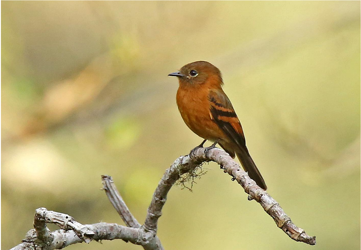
Cinnamon Flycatcher.