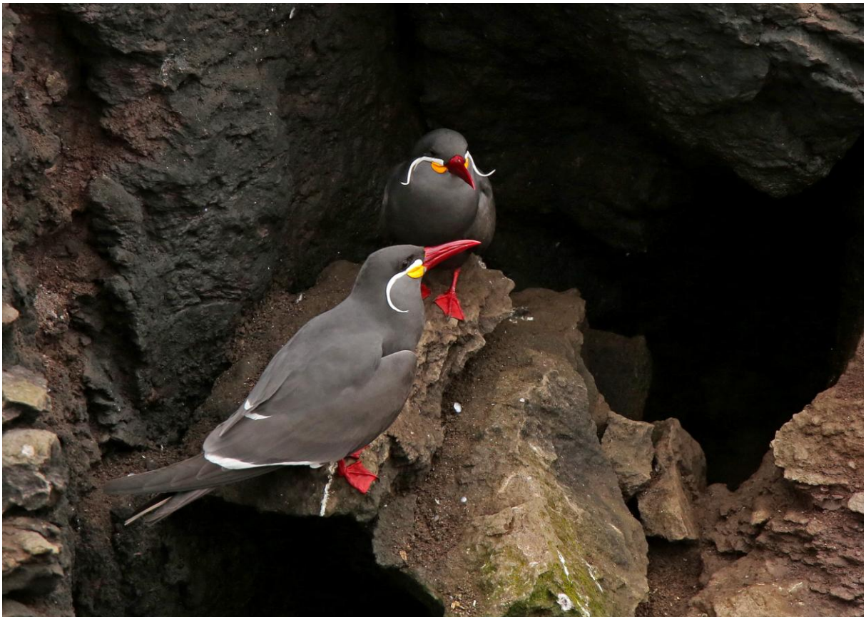
Inca Tern.