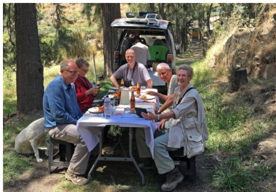
Lunch i Santa Eulaliadalen.

Nöjda med morgonen åkte vi till Puntilla vid Callao där vi på närhåll kunde titta på Inkatärnor som flög i bränningarna. Sedan blev det en stabil tre-rätters lunch med havets läckerheter, alldeles utsökt. Efter lunchen hade vi två timmars transport till Santa Eulalia och hotellet för två nätter. Lite eftermiddagsskådning i omgivningarna av bland annat Pied-crested Tit-Tyrant, Vermilion Flycatcher och Collared Warbling-Finch. Middagen bestod av pumpasoppa, aji de gallina och brownie.