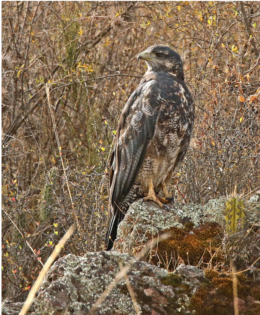
Black-chested Buzzard- Eagle