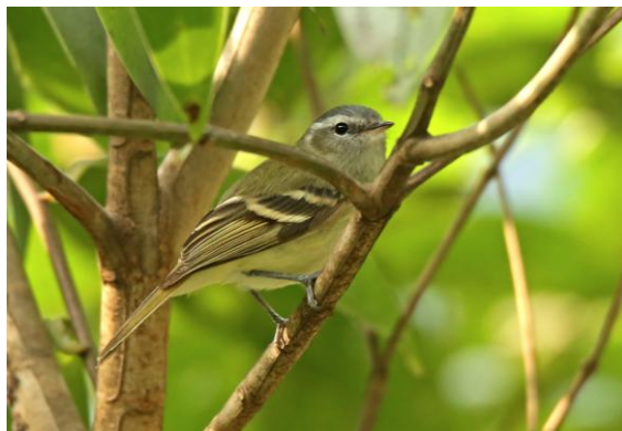
Buff-banded Tyrannulet.