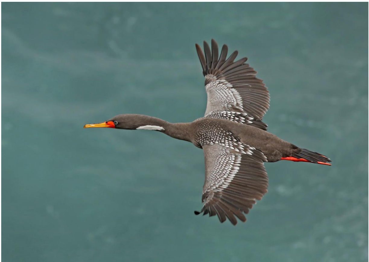
Red-legged Cormorant.