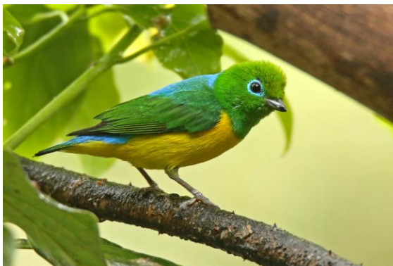
Blue-naped Chlorophonia.

Behaglig skådning i hotellträdgården där många tangaror kom till utlagda bananer. Bland dessa som fanns snyggingar som Saffron-crowned Tanager och Blue-naped Chlorophonias.