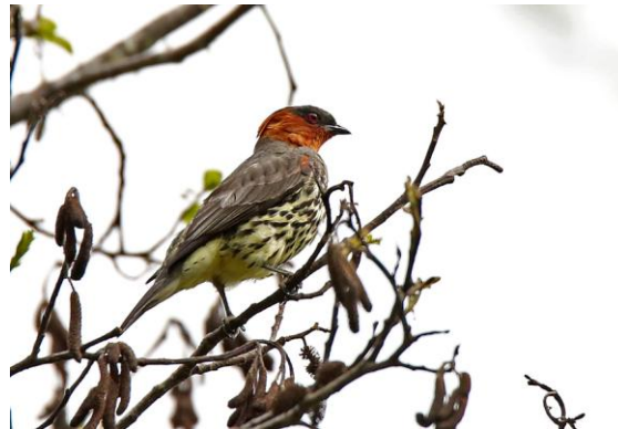
Chestnut-crested Cotinga.

Vi gjorde flera stopp på vägen upp men det var överlag tämligen dålig aktivitet. Från bussen såg vi en Golden-headed Quetzal och gick ut för att fotografera den. Jag hörde ett avlägset knarrande och berättade att det var något bra på gång. Efter lite playback kom en irriterad Chestnut-crested Cotinga inflygande och visade sig fint, dagens art utan tvekan. Efter en trevlig packad lunch vid Acjanco passet var det mest en transport tillbaka till Cusco.