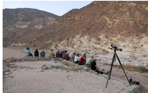
Wadi Ashawq, i väntan på västlig klippuggla.

mörkret. Det var riktigt mysigt. Det hann bli rätt ordentligt mörkt när vi fick höra strimmiga flyghörens hålla kontakten med varandra genom lätet ”poit” än här, än där i vår närhet. Plötsligt hördes ganska svagt ett par av västlig klippuggla kommunicera. De var inte riktigt på det gamla vanliga stället och hördes inte riktigt lika bra som förr, men bra nog ändå. Riktigt lyckat! På återvägen till hotellet sågs en rödräv som hastigast.