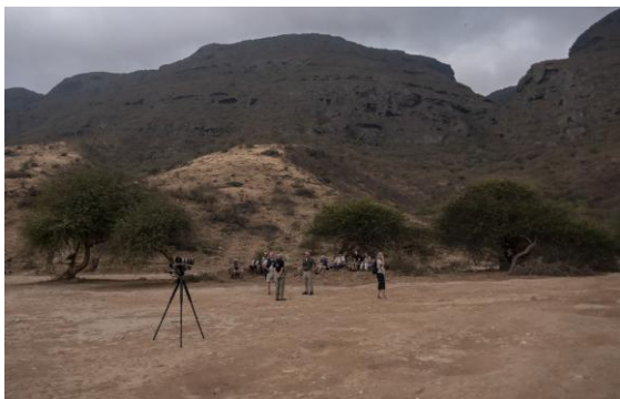
I väntan på rop från arabiska dvärguvar. Ayn Hamran.

dvärgörn och tre större skrikörnar. I närområdet uppehöll sig tre streckiga prinior, liksom två isabellastenskvättor och fyra ökenstenskvättor.