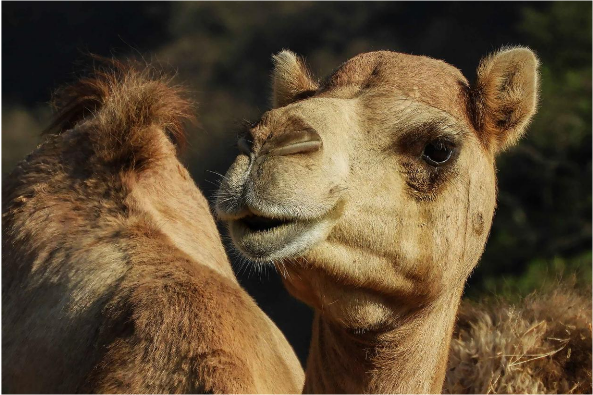
En nyfiken dromedar!