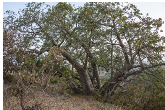
I Wadi Hanna finns några jättelika baobabträd.

Vidare österut och den vassrika kustlokalen Wadi Stimah. Vi traskade oss österut i den mjuka sanden för att få bättre sikt. Stora spökrabbor Ocyrode sp. fanns nere på havsstranden och inne i lagunen låg bl.a. sex vitögda dykänder, 30 större flamingos, ett par revhägrar, några silkeshägrar och en vardera av rallhäger och bronsibis. Tofstärnor jagade och längre upp i lagunen sågs ett 20-tal Saunders småtärna, samt en småtärna. På återvägen upptäcktes en gulärta som såg bra ut som en östlig gulärta Motacilla tschutschensis , t.ex. grå hjässa, nacke och rygg, men obsen var för kort för att vi skulle hinna ta bilder och inget läte hördes – den östliga låter vid oro som en citronärta, d.v.s. inte som t.ex. en feldegg .