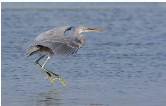
En ljusgrå revhäger vid East Khawr.

Vi satte kurs mot hotellet och redan under färden dit fick vi in tofsbivräk, dvärgörn och större skrikörn. En bra start! Efter lunch och incheckning, i den ordningen p.g.a. tiden på dagen, och därefter lite vila på rummen för den som ville det, var det dags att börja skåda. Redan innan vi gav oss av hade några kryssat sju arter vidare vid hotellet där den mest eftertraktade var svartbent strandpipare. Fiskgjuse, denna kosmopolit, sågs också, liksom 10 förbiflygande sandtärnor.