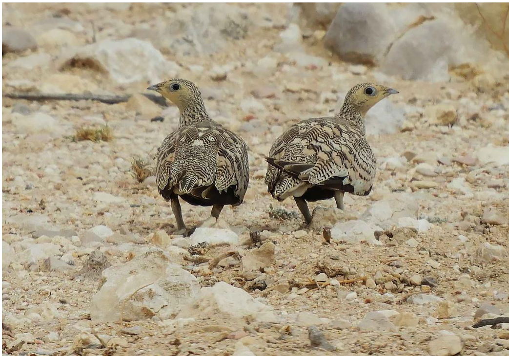
Ett par brunbukiga flyghöner i Wadi Rabkut.