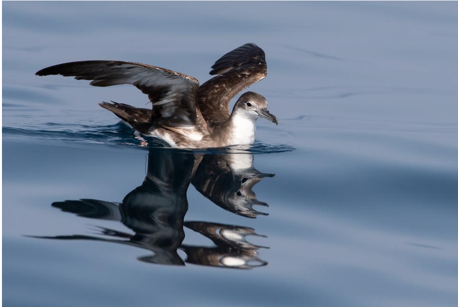
En arablira i draggläge i den lugna sjön. SV Mirbat.