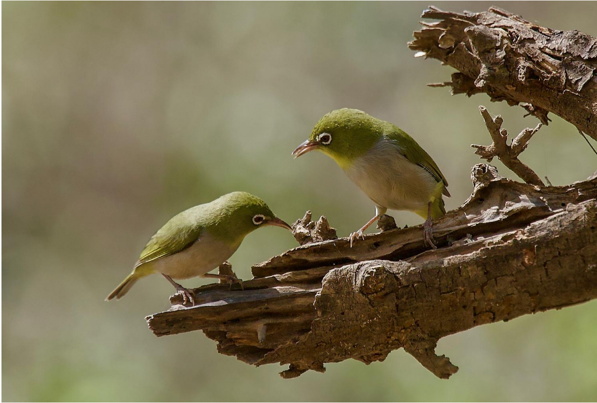
Abessinsk glasögonfågel.