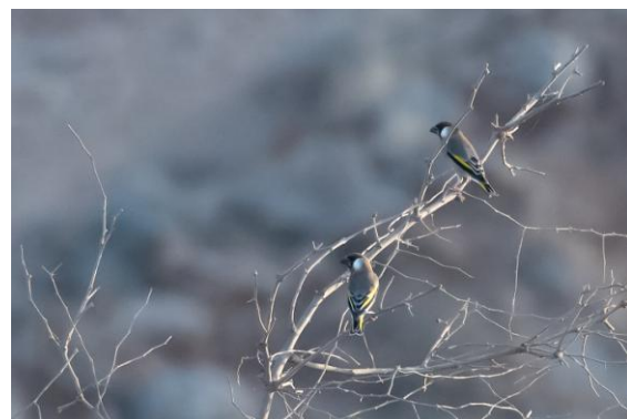
Arabisk guldvingefink, endem för södra Arabiska halvön.

Iväg 06.00 för att köra till pumpen i Tobroq Junction där fåglar kommer in för att dricka. Vi hade knappt kommit på plats förrän någon i gruppen larmade ut arabisk guldvingefink! Två fåglar flög iväg helt nära, men hann inte ses av gruppen i övrigt. För mycket hög vegetation i vägen just där. Snopet! Nåväl, det skulle väl komma fler chanser. Fåglar kom in för att dricka, väldigt ljusa gråsparvar, zebbrasparvar, rödahavsväware, afrikanska silvernabbar och abessinska solfåglar. I grannskapet noterades levantbulbyler och abessinska glasögonfåglar. En hane långstjärtaduva kollades i en liten wadi helt nära pumpen och senare sågs även en hona. En blek stensparv sågs, kanske samma som reseledaren hade vid rekande på samma plats några dagar tidigare.