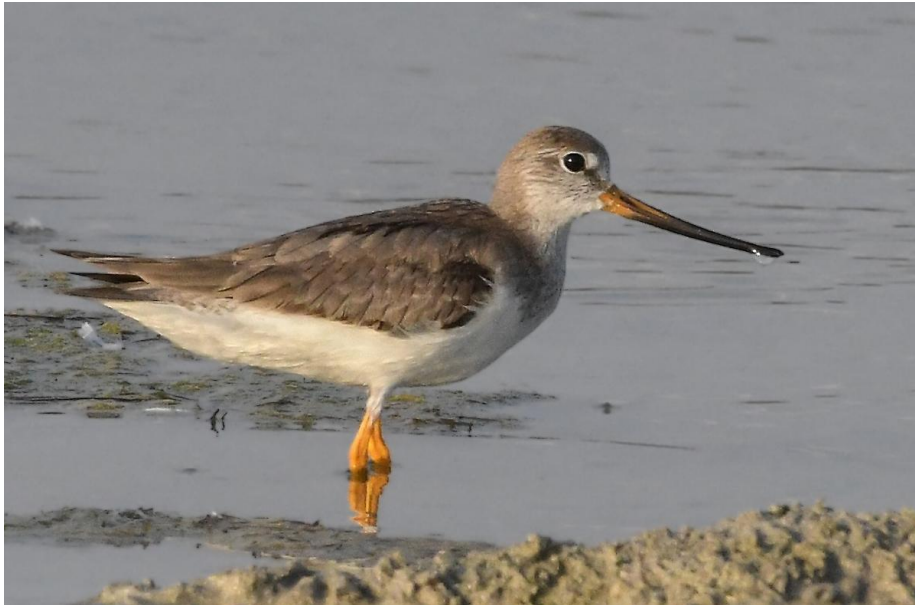
Tereksnäppa i East Khawr.