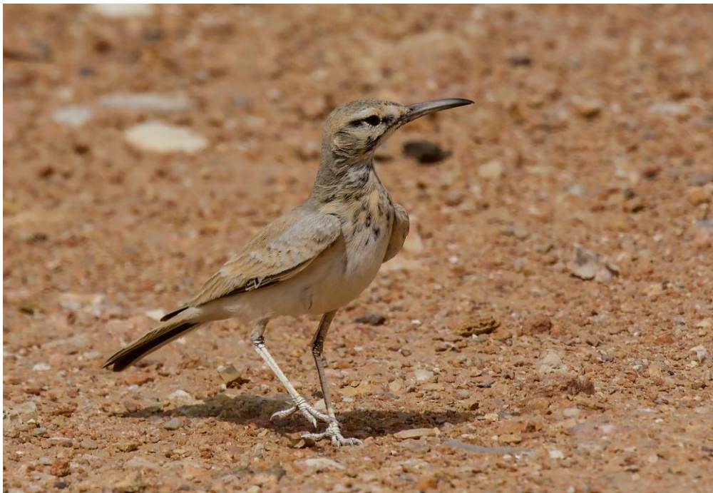
En populär fågel, både till utseende och läten, härfågellärkan.