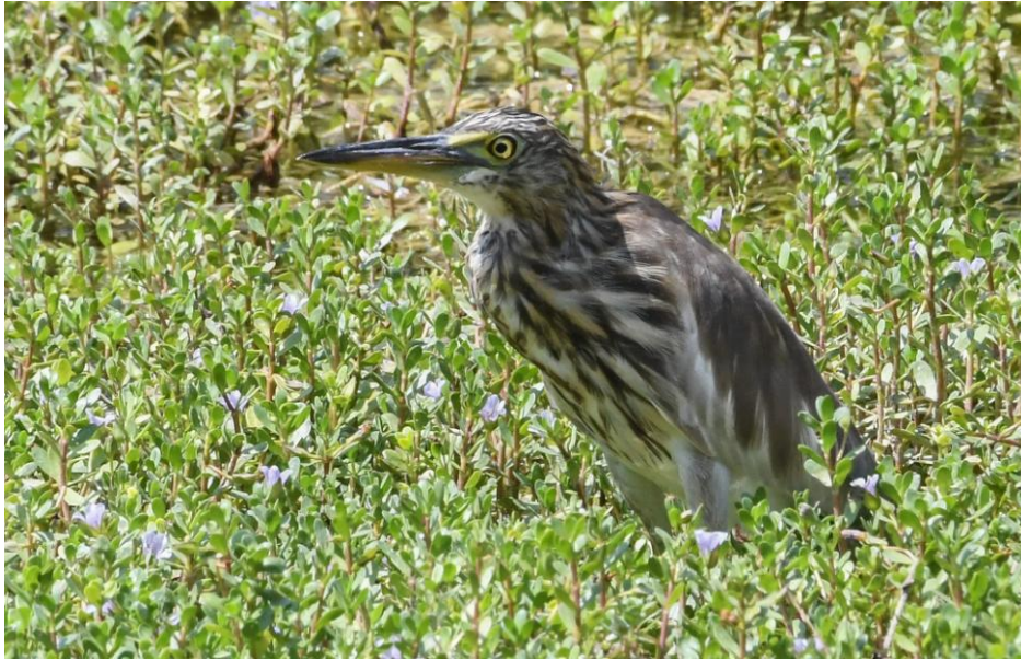
En ung rishäger i Ayn Razat.