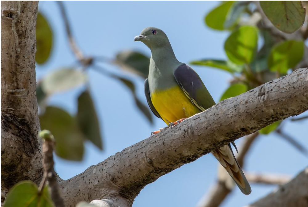
De gulbukiga grönduvorna satt alldeles stilla. Svårupptäckta.