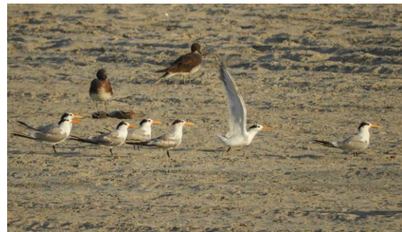
Iltärnor och sotmåsar på Taqah Beach.

Vi rullade bort till Taqah Beach för att kolla tärnor och trutar. Gott om silltrut heuglini i olika dräkter, liksom sotmåsar. En del tärnor också på plats, inklusive 21 iltärnor och fem tofstärnor, varav två juveniler. På håll, borta vid klipporna i öster, sågs flera somaliaseglare. Vi vände tillbaka och när vi närmade oss hotellet sågs två gröna dvärgbiätare.