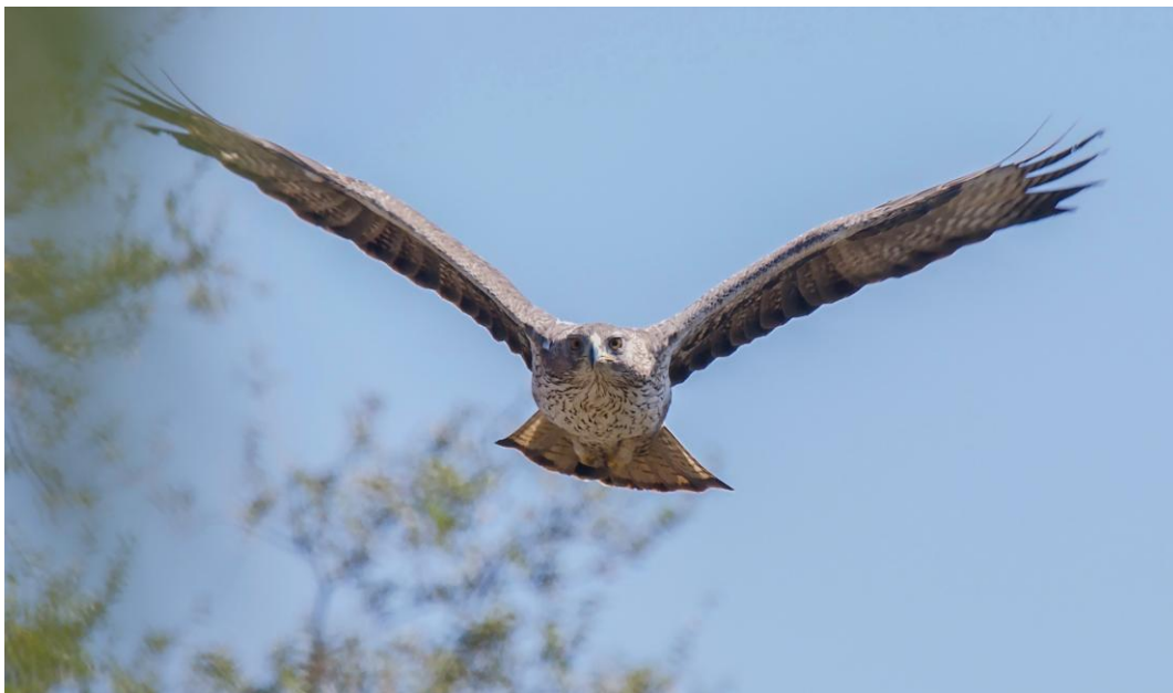
En nyfiken yngre adult hökörn vid slukhållet Tawi Atayr.