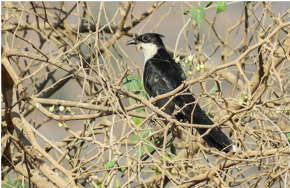
Jakobinskatgök var en trevlig obs. Tobroq Junction.