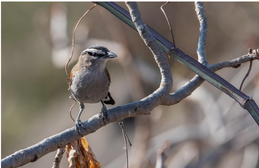
Svartkronad tchagra, håller sig gärna lite undan.