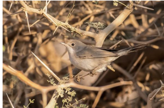
Sista obsen i Taqah Junction, östlig sammethätta.

Sista dagen på resan och ytterligare ett improviserat besök vid Tobroq Junction. Iväg 06.00, anlände 06.30. Denna gång gick det bättre och de som orkat ta sig upp i tidiga morgonen för att följa med fick alla se två arabiska guldvingefinkar under en rätt god stund. Visserligen vågade de sig inte fram för att dricka, eftersom ett grusupplag hade skapats i närheten av vattenpumpen och lastbilar körde av och an, men de sågs ändå bra på lite håll. Det kändes kanoon! Förutom gårdagens fåglar på lokalen sågs även en härfågel, en turkestantörnskata och – som allra sista fågel på lokalen – en honfärgad östlig sammethätta. Rimligen samma fågel som vi sett tidigare.