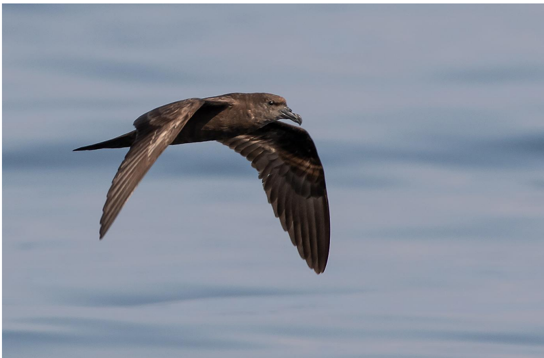
Arabpetrell är en eftertraktad art vid en resa till Oman.