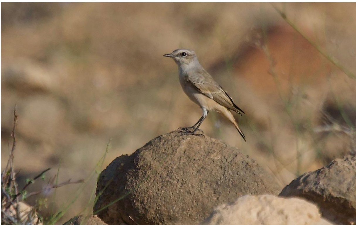
En oväntad obs av persisk stenskävta. Wadi Ashawq.