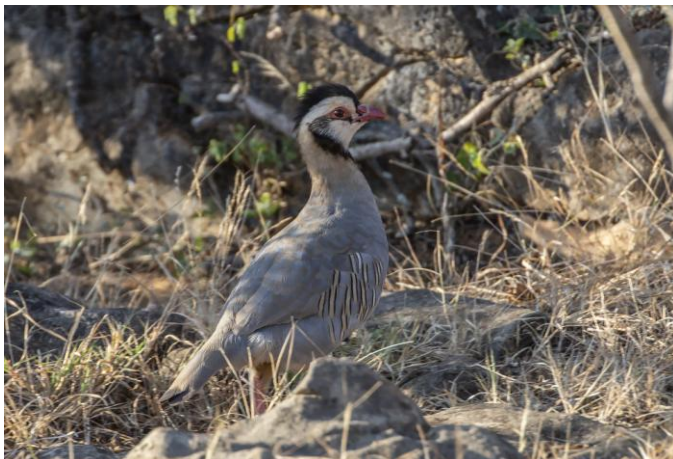
Gott om arabiska rödhönor utmed vägen österut.