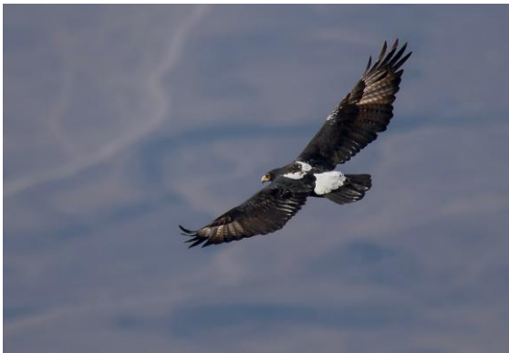
Klippörnen vid Jabal Samhan.

skvätta fanns också närvarande. Fältfrukosten satt fint med vidunderlig utsikt ner mot havet och olika wadier. Färden gick nu tillbaka västerut till ett välkänt slukhål, Tawi Atayr Sinkhole, 150 x 150 meter brett och nästan 200 meter djupt. Vi sökte först efter jemensiska, men lyckades inte hitta någon. De var lite svårare detta år, hörde jag. Ett par långnäbbade piplärkor sågs och zebra-sparvar sjöng för fullt. Här sågs även fem ödlor som splittades 2012 och ännu inte fått riktiga namn, utan kallas Pristurus sp. 1 . Sex praktkaloter sågs och en turkestantörnskata tilldrog sig intresse. Vi gick ned till slukhålet. Sinaiglansstarar, afrikanska silvernäbbar och bleka klippsvälar noterades, liksom en Tessellated Mabuya (ödlor). Nere i slukhålet häckar hökörn och även om vi inte såg till någon häckning denna gång fick vi i varje fall närbildkontakt med en fågel av mellanålder när den flög mot utsiktsplatsen där vi stod. En ljus dvärgörn och en ormörn sågs också, liksom 10-talet kortstjärtade korpar. Tillbaka vid bilarna såg vi ännu en Tessellated Mabuya, samt en Sudan Mabuya.