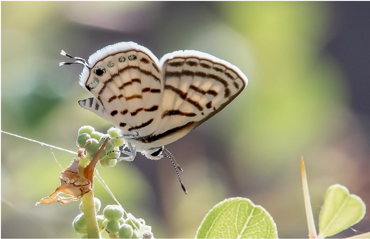
Little Tiger Blue, en svart och vit blåvinge.