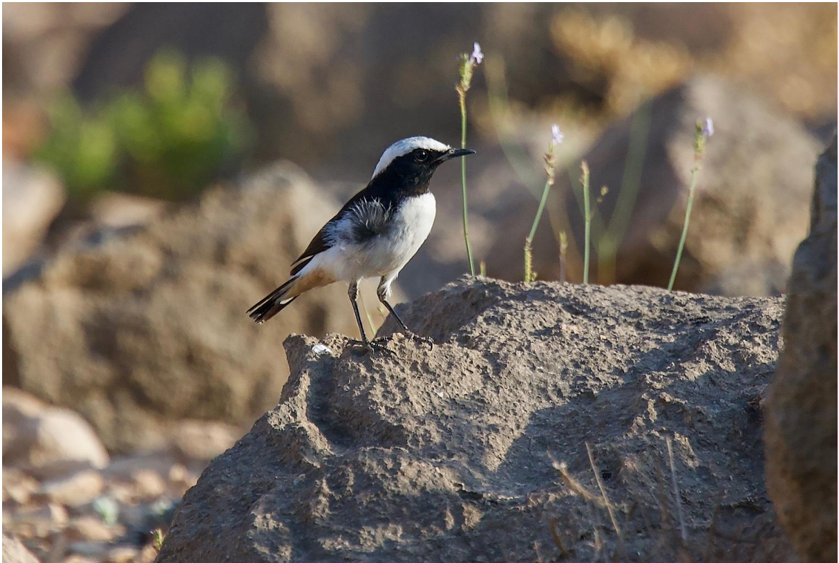
Arabstenskävta hoppas man alltid på – och det brukar gå bra.