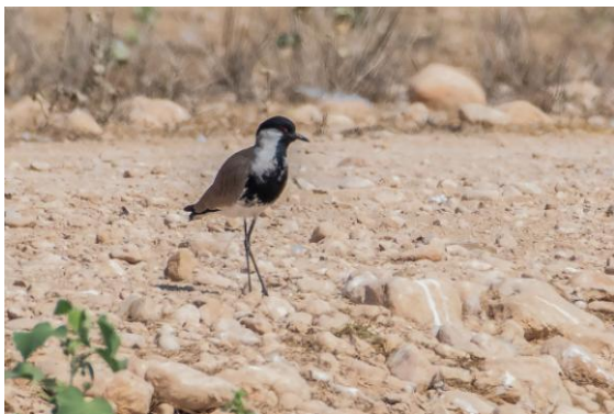
Hybrid sporrvipa x rödflikig vipa..

Frukost lite senare idag. Sokotraskarv sågs från hotellstranden, liksom ett par av Osbeck's näbbdelfin. Sen iväg mot Raysut i Salalahs västra utkant. Soptippen som tidigare är hållit väldiga mängder rovfåglar, främst stäppörnar, är numera i stort sett tom på fågel. Man lägger ut soporna när det blivit mörkt och täcker sen över dem med grus innan det blivit ljus och därmed har födoresursen sinat. Bäckan som rann igenom området och höll mycket fågel är nu torr och därmed är även de små dammarna längre ned det.