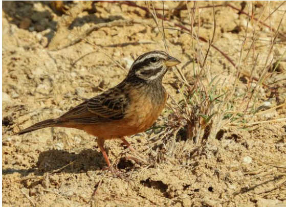
Zebbrasparv vid Mughsayl Viewpoint.

Även gott om sinaiglanstarrar, men endast två bruna majnor så här långt från lite tätare bebyggelse. En dvärgörn sågs på håll och förbi oss på nära håll flög två klippduvor som bedömdes vara äkta livia , ”rätt” fjäderdräkt – här med grå bakrygg, ej vit – och lite mindre storlek än tamduvorna här i södra Oman. Drar alltså lite åt skogsduva i flykten, men ligger närmare tamduvan än skogsduvan i utseende, så klart. Ett par av arabstenskivatta fanns också här. Den medhavda lunchen intogs på restaurangen, som till vår glädje återigen var öppen efter att ha varit stängd i många år. Mot att vi köpte lite kaffe och dylikt fick vi sitta vid deras bord. Suveränt!