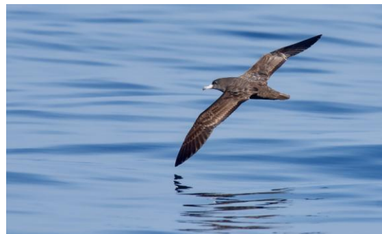
Båtturen vid Mirbat gav bra utdelning, bl.a. ljusfotad lira.

Vår lokalguide tog oss så med till en närliggande wadi där vi åt medhavd lunch i sällskap med ett par Dhofar Agama (endemisk ödla) och ett par stäppörnar. Vi körde vidare en liten bit och kollade på några ökenhönor innan vi passerade en större skrikörn och körde sen bort till ett par minervaugglor. Så söta i en väldigt lugn och fin wadi. Här sågs även stenökenlärka.