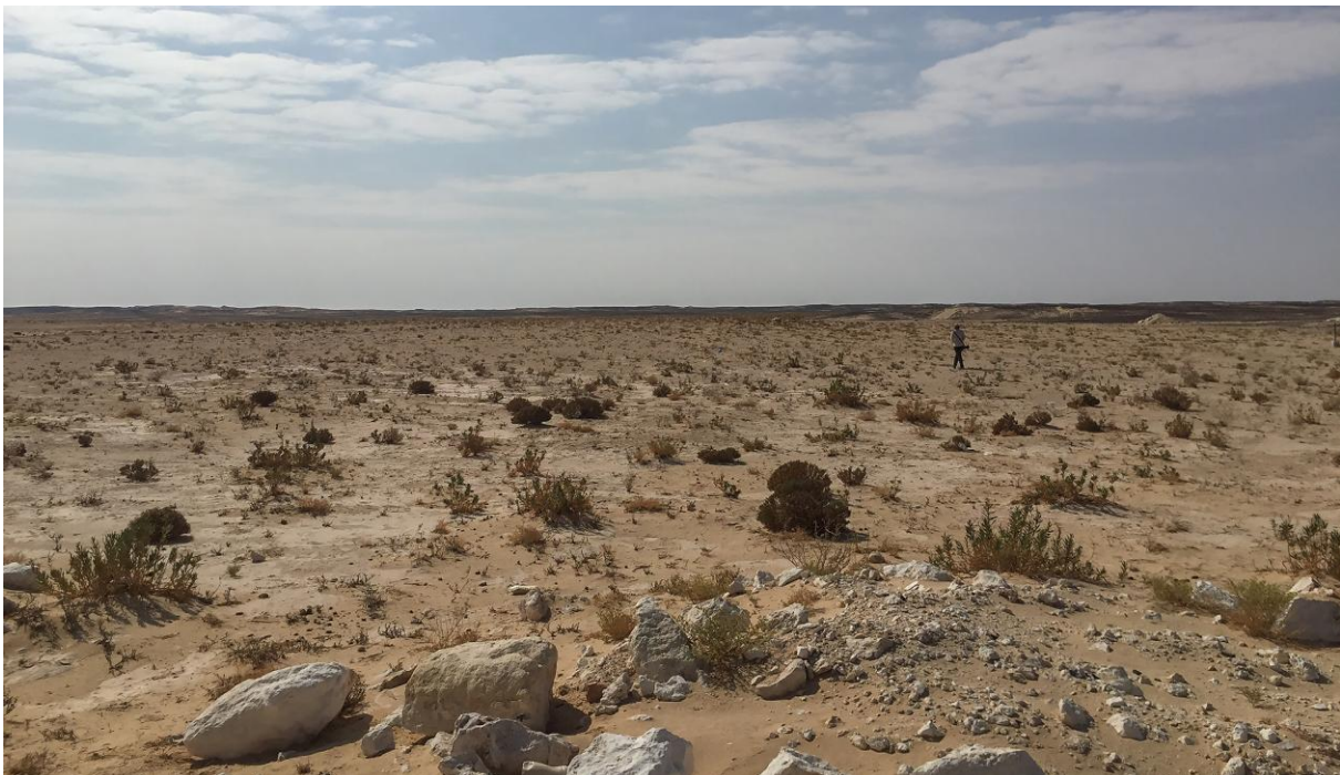
Även i grusöknen väster Thumrayt finns fåglar och kräldjur.