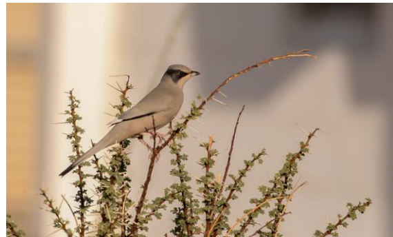
Stor lycka när vi hittade hypokolius.

Denna dag – ökendagen – har vi väntat på sen vi anlände till Oman. Anledningen till att vi väntade med att åka dit var att den eftertraktade arten hypokolius skulle ges chans att hinna anlända till sin övervintring i Mudayy. Reseledaren kollade med väderreporterna så inte sandstorm skulle ställa till med bekymmer och ökenturen behöva tidigareläggas. Allt stämde och nu var vi på väg norrut, upp till den vidsträckta grusöknen. Vi startade redan kl. 04.00 för att kunna vara framme i gryningen, en taktik som visade sig vara lyckosam. Vi började på picnicplatsen ovanför den lilla dammen vid palmlunden. Bland cirka 150 turkduvor hittade vi fem skrattduvor. En rödräv visade sig och en kohäger och en silkeshäger fanns också här. Några nordöstliga gransångare abietinus , en vanlig västlig årtsångare curruca och många rödahavsvävare och ljusa gråsparvar indicus sågs, liksom fem äkta klippduvor palaestinae .