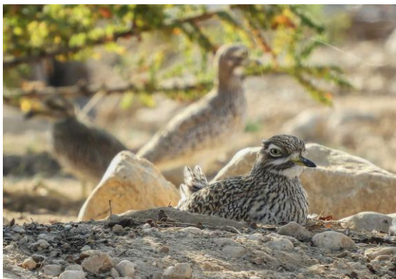
Fläcktojockfot. Helt orädda.

Senare på eftermiddagen besökte vi kustlagunen Khawr Al Baleed och för den ändan gick vi in i Al Baleed Archeological Park med sitt Frankincense Museum. Här stod några frankincenseträd vi kunde beskåda. Detta träd tappas på kåda som efter behandling används i rökelse. Denna produkt, kallad olibanum, gjorde Oman en gång i tiden till ett rikt land och den s.k. Rökelsevägen från södra Arabiska halvön till Medelhavet var en av de äldsta handelsvägarna i världen. Den hade sina hamnar i Khawr Rawri och Khawr Al Baleed. Olibanumhandels betydelse för Oman avtog under Medeltiden och idag använder t.ex. katolska kyrkan frankincense framtagen i Somalia.