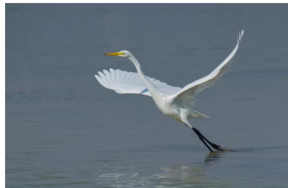
Mellanhäger i East Khawr.

Vi körde så långt in i dalen, till ett hägrande café. ☺ Med en kopp intill oss kunde vi se en gammal hökörn, ännu en gulbukig grönduva, tre skäggtärnor, en hane vitögdd dykand, två silkeshägrar och 20-talet somaliaseglare. När skymningen närmade sig dök vår lokalguide upp och vi gjorde ett försök att se arabisk dvärguv. Det lyckades inte där, men vi hörde fyra. Vi körde vidare till Ayn Athum där vi såg en arabisk dvärguv bra och hörde ytterligare en. På återvägen sågs en minervauggla flyga över vägen vid Tobroq Junction.