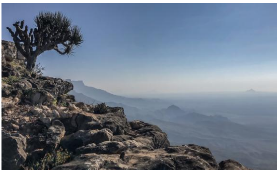
Drakblodsträd vid Jabal Samhan.

På återvägen till hotelllunchen svängde vi in till East Khawr där vi kunde lägga till sumpvipa till reselistan. En mellanhäger bockades också snart av, medan vi istället koncentrerade oss på tärnorna vilket gav bra utdelning, en vitkindad tärna, en småtärna, en Saunders småtärna, fem skäggtärnor, 15 vitvingade tärnor, en sandtärna, en skrântärna och några fisktärnor och tofstärnor. På vägen till hotellet sågs tre gröna dvärgbiätare.