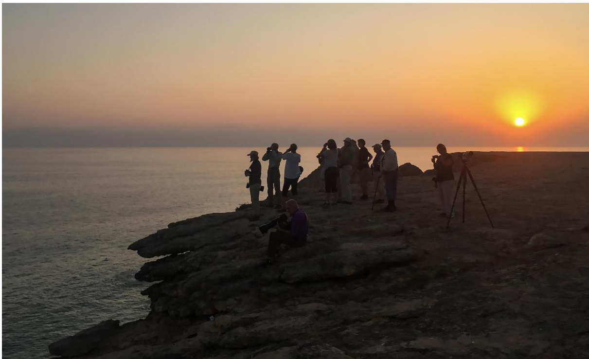
Taqah Viewpoint.