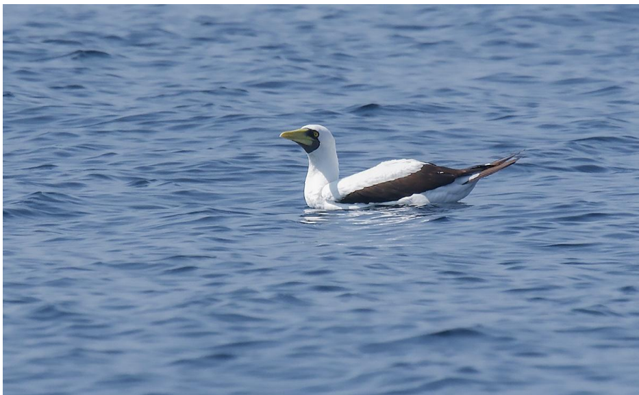
Masksula under båtturen SV Mirbat.