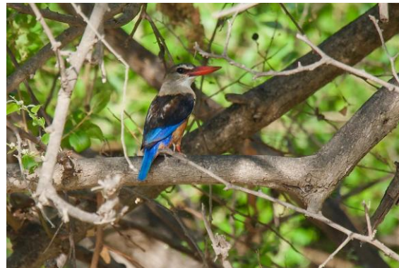
En gråhuvad kungsfiskare lyste upp i Ayn Hamran.

or, abessinska glasögonfåglar, levantbulbyler, rödahavsvävare och afrikanska silvernäbbar. Resans första gransångare och resans enda eksångare kunde beskådas. En snårsångare sågs, liksom en svartkronad tchagra som hastigast. En del av zebrasparvarna brast ut i sång, medan svartstjärtar sökte föda. 2+2 arabsångare glädde oss, liksom sinaiglandsstarar med sina härliga läten. Några abessinska solfåglar sågs och deras rätt hårda läten hördes. Även härfågel noterades. Hela fyra gråhuvad kungsfiskare var ännu kvar på lokalen, innan flytten till Afrika.