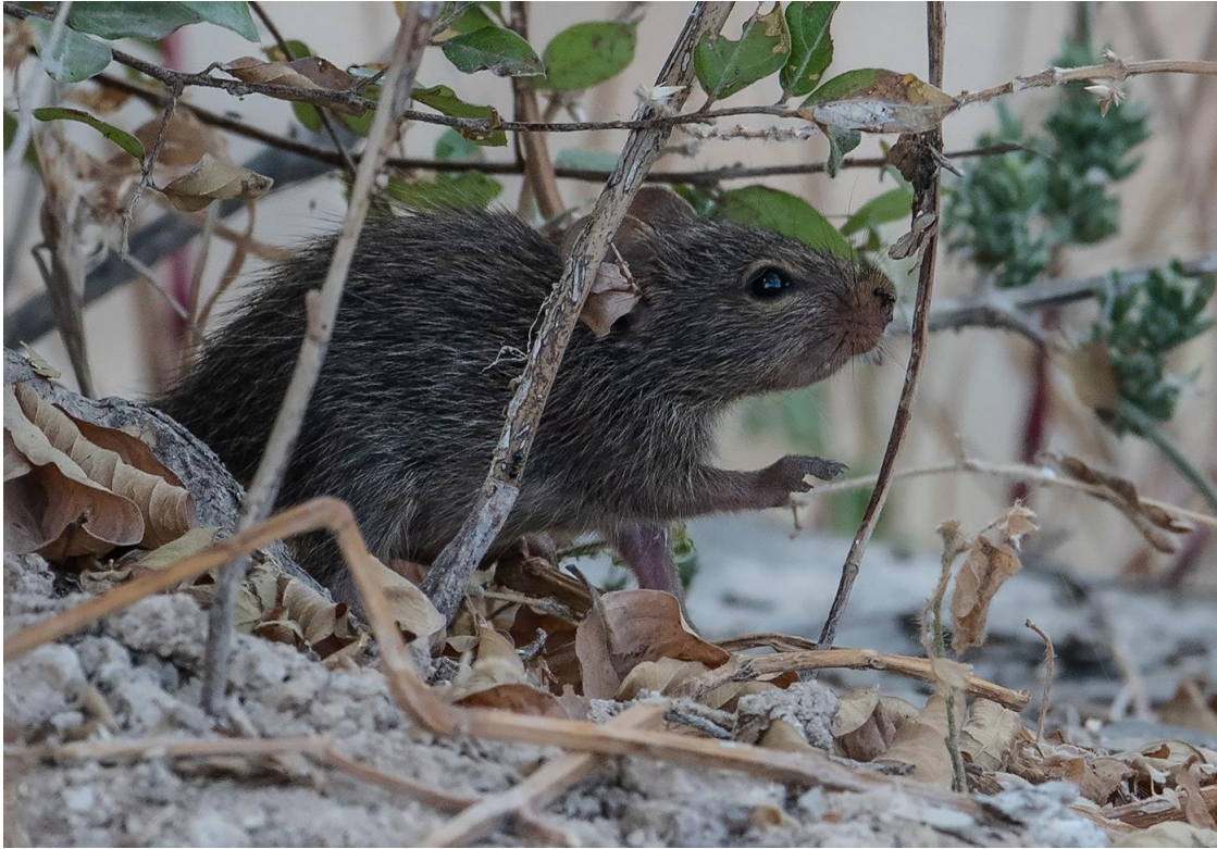
Nile Rat finns i östra Afrika, men även i Jemen och södra Oman.