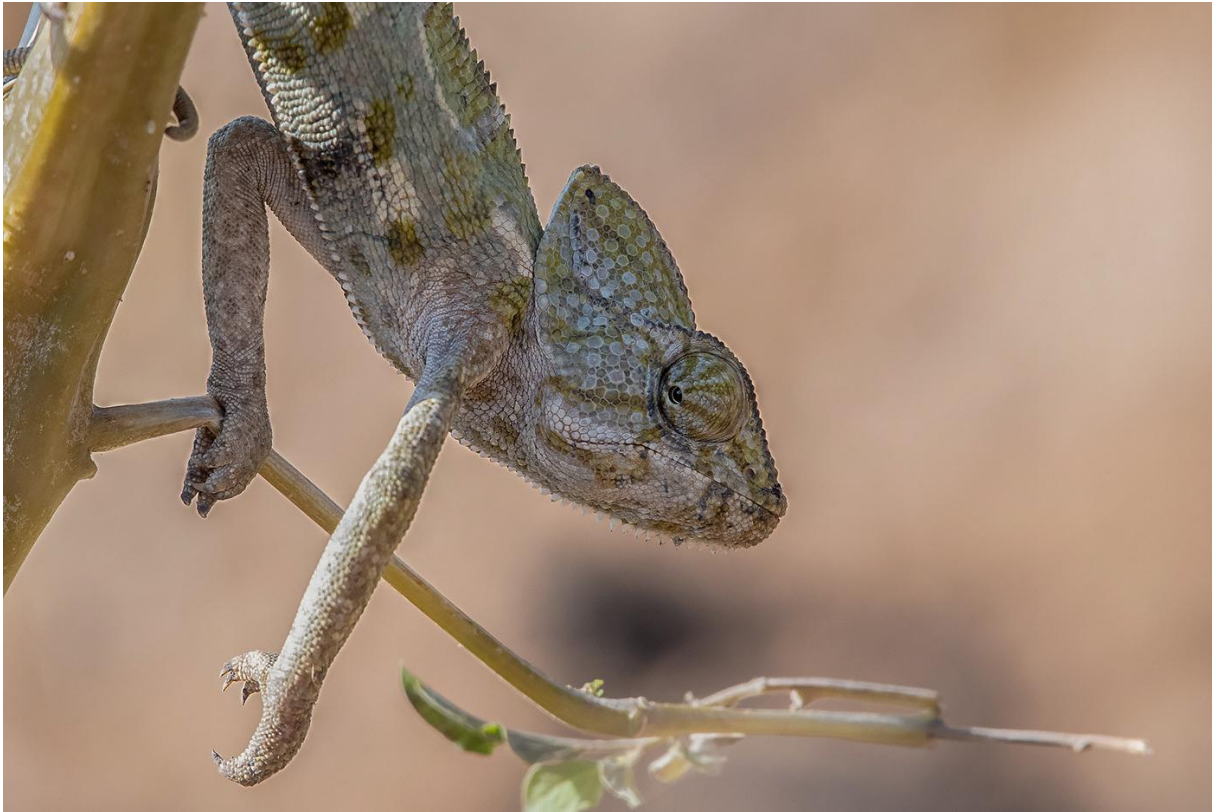
Arabisk kameleont.