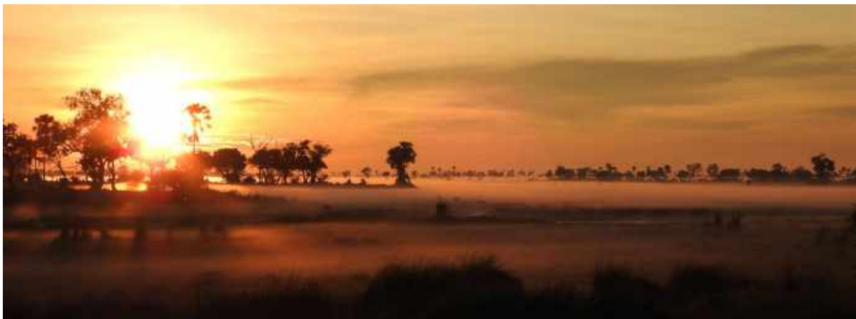
Gryning i Okavangodeltat.