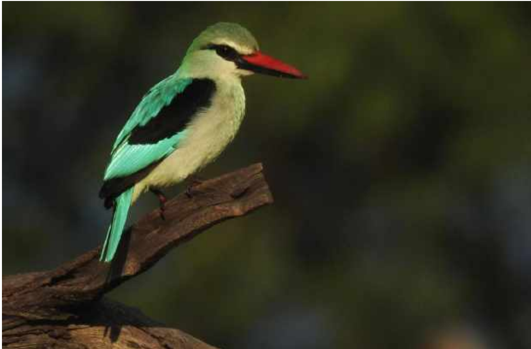
Woodland Kingfisher var vanlig udner resan. Hördes ofta ropa från skogsbrynen.