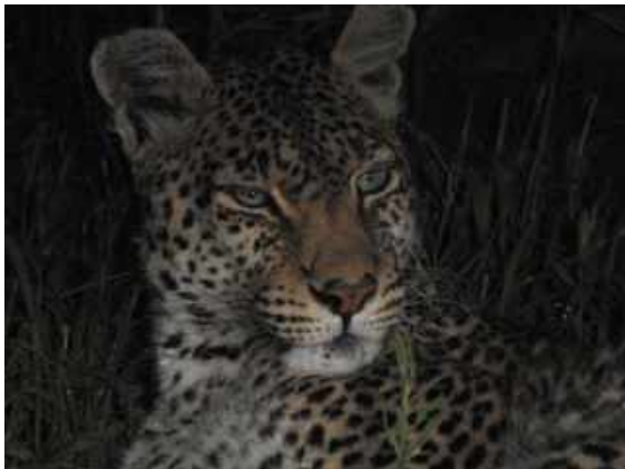
Leopard på kvällsturen. Kwai Concession Area.