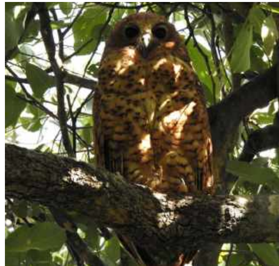
Pel's Fishing Owl. Delta Camp.

Efter lunchen var det dags för en ny promenadsafari. Nu gick vi på flygfältet. Några lejon fanns i grannskapet och försökte slå en ensam buffel. Vi kunde tillfälligtvis skymta djuren mellan täta buskar och träd. Vi retirerade dock rätt så, snart, för att inte komma i vägen för buffelns utfall. Istället gick vi till en annan lodge precis vid flygfältet och här såg vi, förutom en massa flodhästar, en mycket fin Pel's Fishing Owl. På vägen tillbaka till lodgen stötte vi på lejonen på nytt, men tyvärr såg vi bara glimtar av djuren nu också. Vid lodgen blev det fri tid fram till artgenomgången kl. 19.