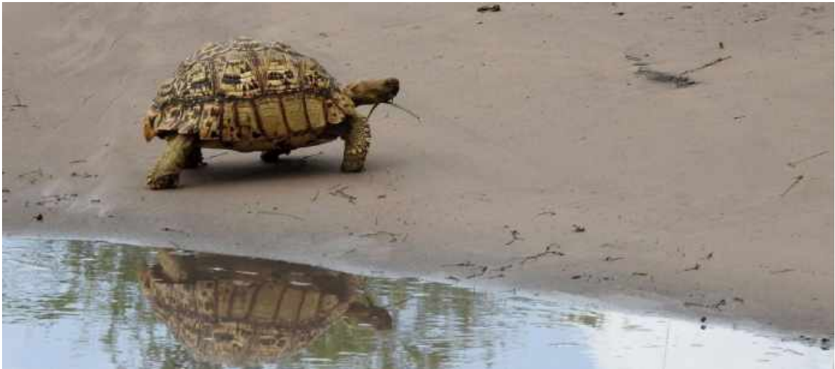
Leopard Tortoise. Kwai Concession Area.