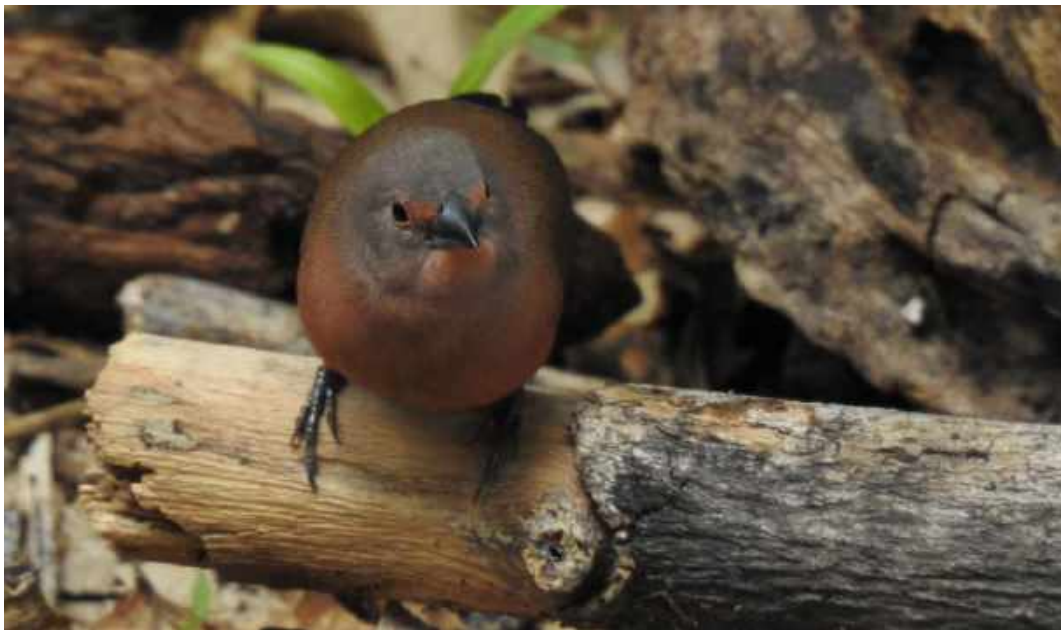
Jameson's Firefinch. Delta Camp.