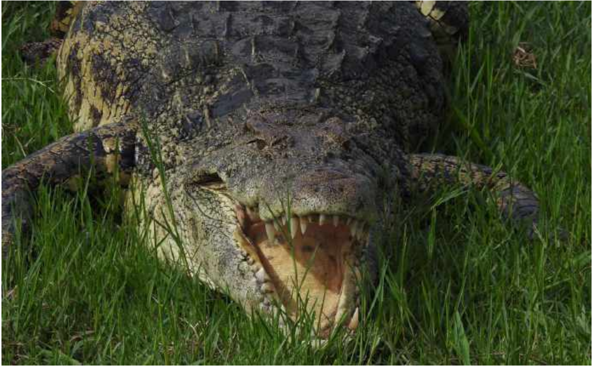
Nilkrokodil i Chobe NP.