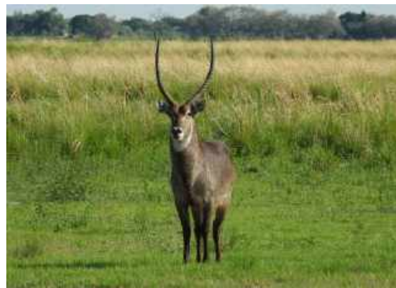
Waterbuck är en imponerande antilop. Chobe NP.

Till slut var turen över och vi körde de fem milen tillbaka till vår camp. Där väntade artgenomgång och middag.