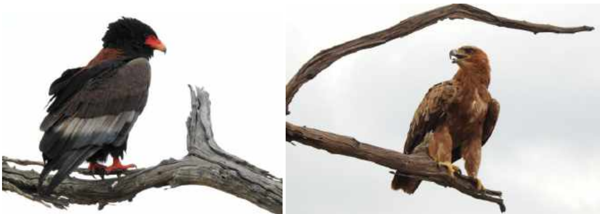
Bateleur och savannörn. Sango Safari Camo.