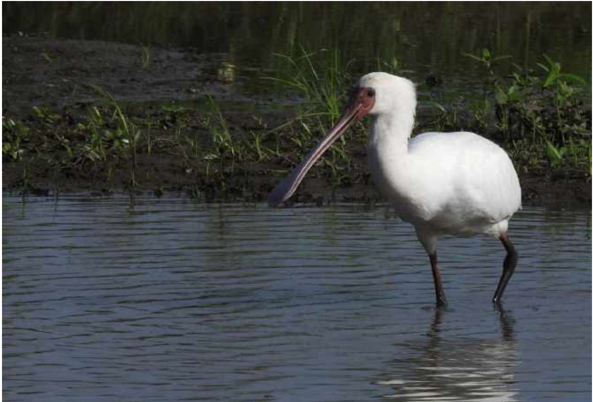
African Spoonbill. Chobe NP.