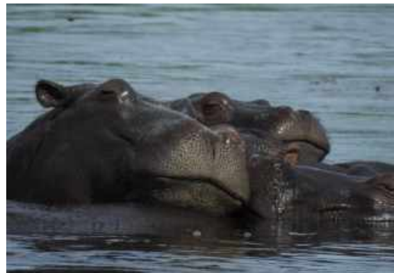
Flodhästarna myser.

Efter frukosten blev vi hämtade av gårdagens chaufför som nu tog oss till Victoriafallen. Kronjuvelen i resans program. Som vanligt möttes vi av en del lite väl påträngande försäljare. Men de insåg snart den begränsade köplusten hos gruppen. Vår chaufför agerade även guide vid fallen och vi följde honom på stigarna som leder till de imponerande scenerierna. Så här års faller den största vattenmängden på västra delarna, som man besöker från Zimbabwe. Besökarna där behövde nog handdukar för att torka sig efter sitt besök. Vatten som dånar ner över flodnacken blir som till täta fuktiga moln som stiger uppåt. Vi på den östra, och för årstiden lite torrare sidan, hade mera sikt över det hela. Red-winged Starling fanns planenligt på de för tillfället uttorkade fallväggarna. På det hela taget, en mycket fin upplevelse.