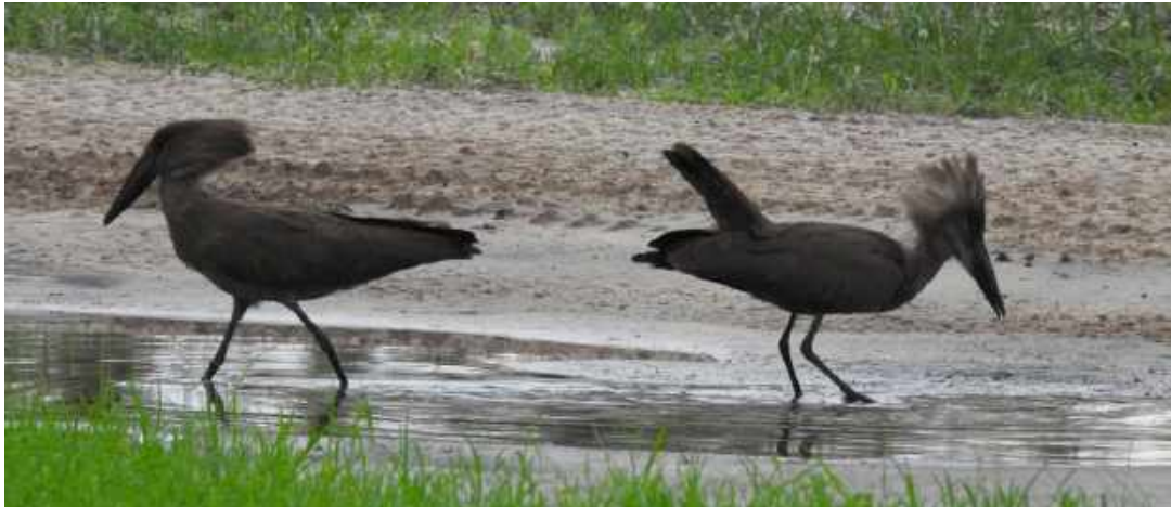
Hamerkop. Honan (till höger) gör sig till för hanen. Sango Safari Camp.