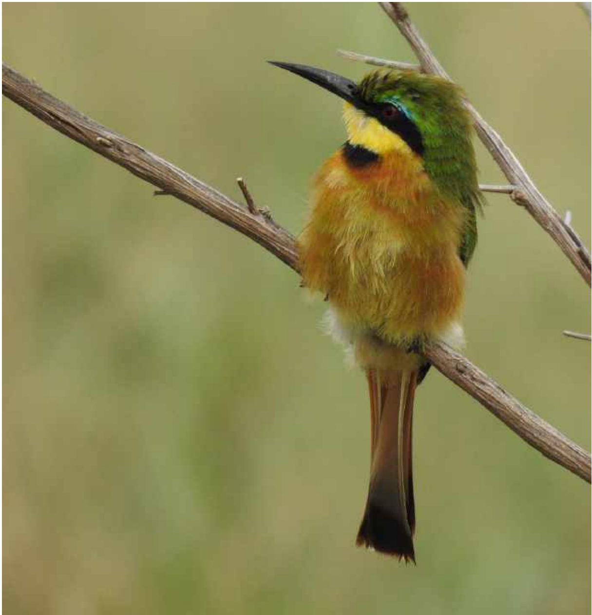
Little Bee-eater var talrik under resan.