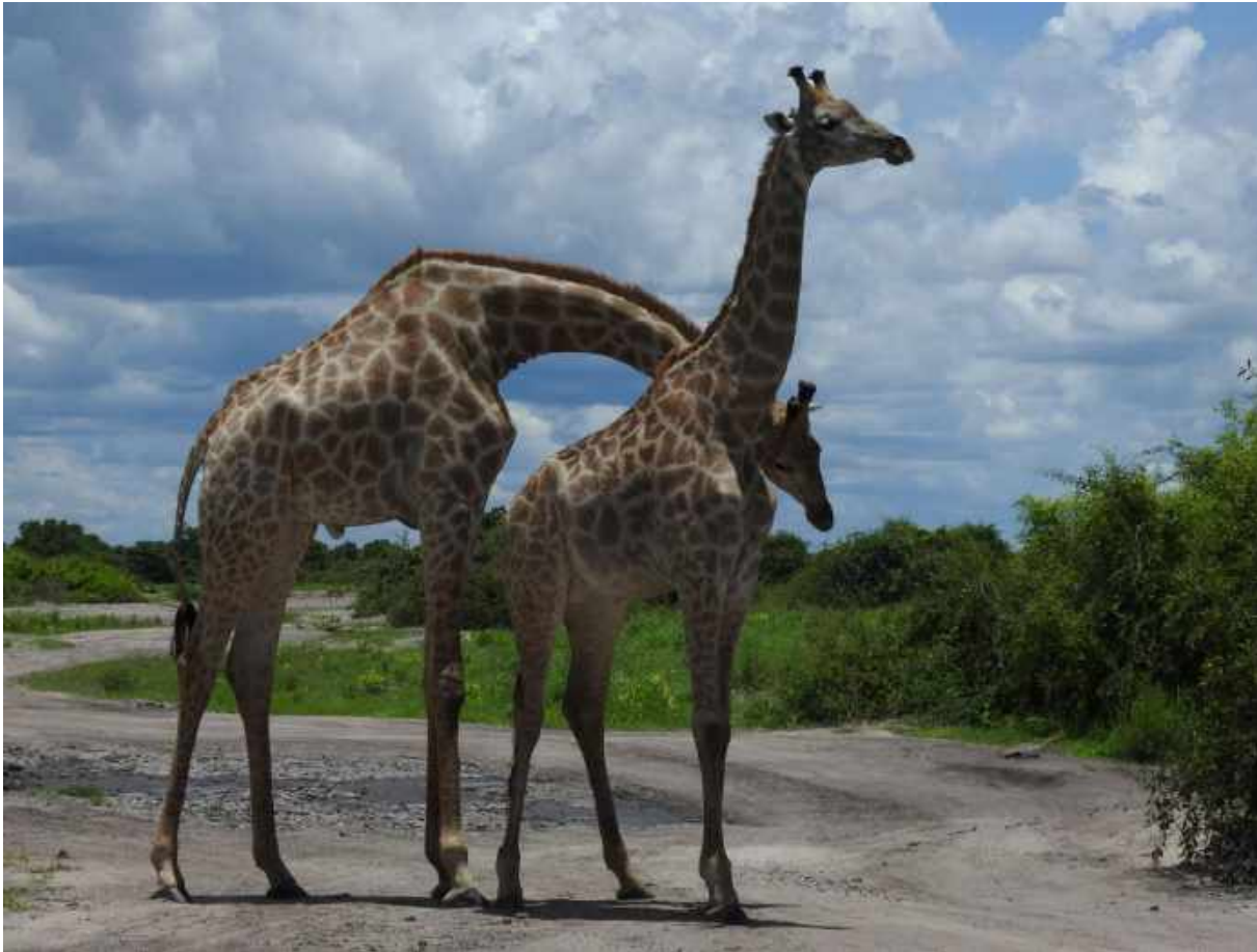
Giraffer i Chobe NP.