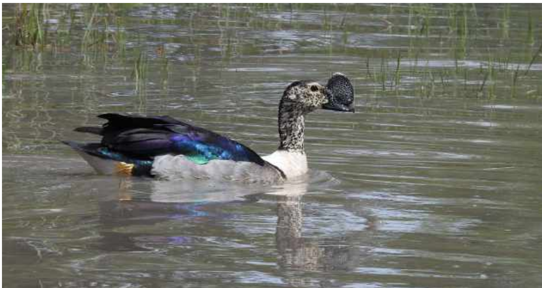
Knob-billed Duck. Moremi game Reserve.