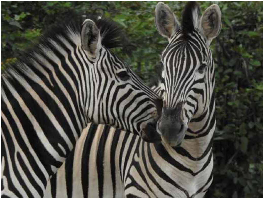
Plains Zebra.