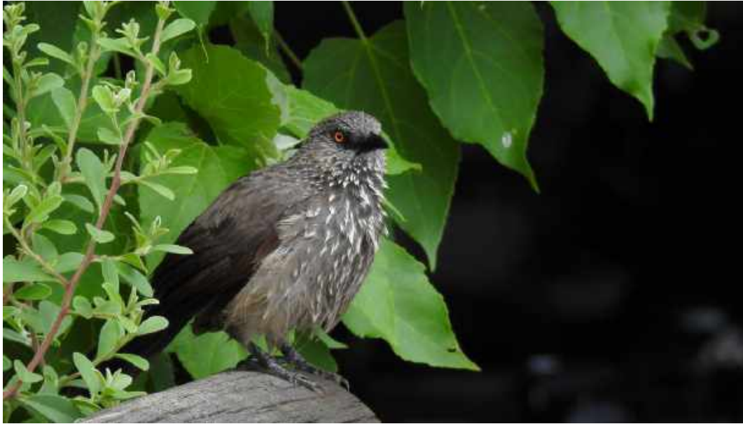
Arrow-marked Babbler. Delta Camp.