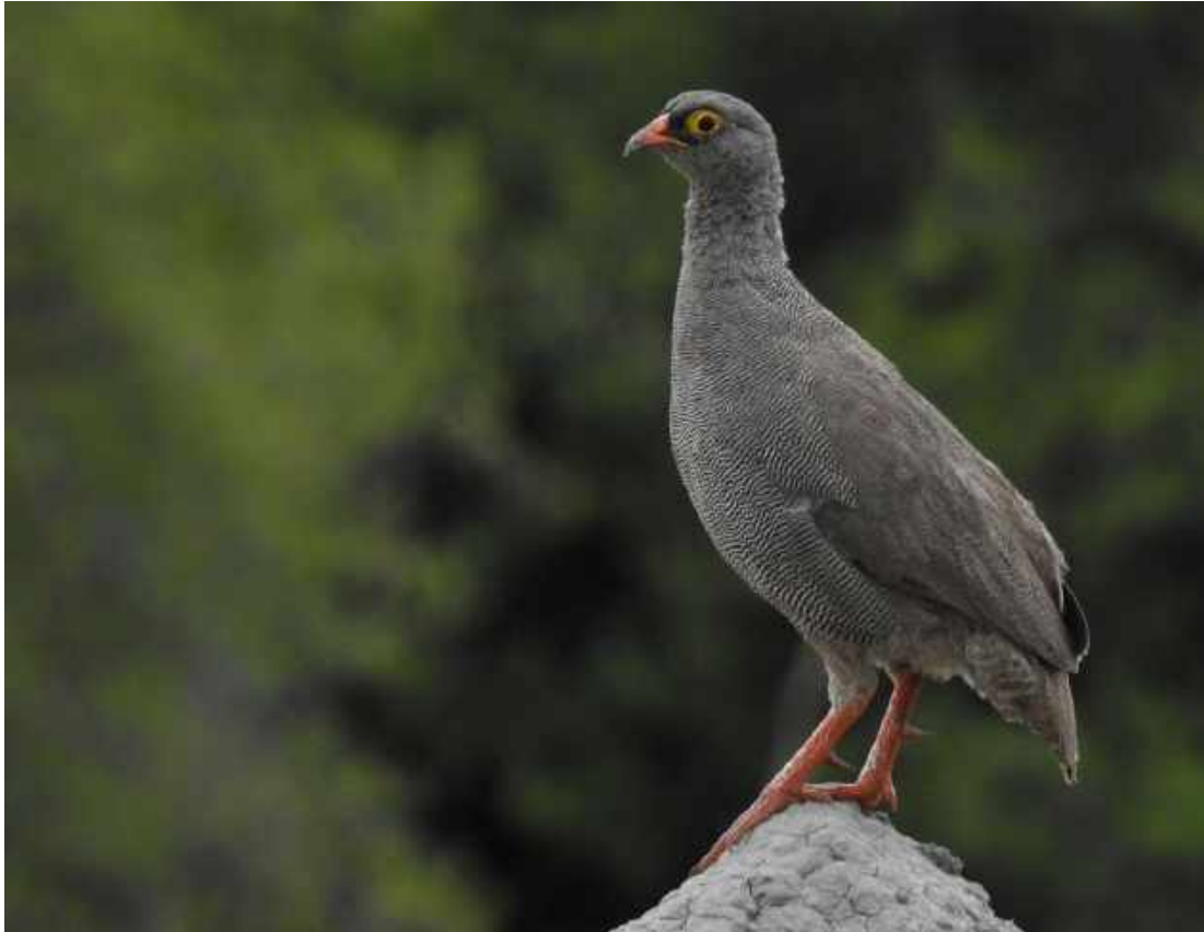
Red-billed Spurfowl. Sango Safari Camp.