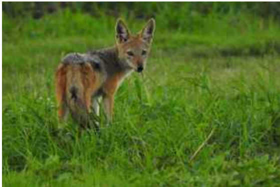
Vi såg få Black-backed Jackal under resan. Chobe NP.

På kvällen god middag på vår lodge till tonerna av två ropande Pearl-spotted Owlet.