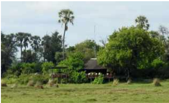
Delta camp.

Kl. 11.10 lyfte vi med vårt lilla propellerplan och kunde landa två timmar senare i Maun, i södra delarna av Okavangodeltat. Här tog vi smidigt ett nytt plan. Nu modell minimal, med botten sex platser (inkl piloten). Bakom spakarna satt tjugooctåriga Raki som jobbat som pilot i två års tid. Hon spakade planet med god omsorg. Vi såg lite däggdjur från luften under den tjugominuter långa flygningen in till Delta Camp, som skulle bli vårt hem de kommande två nätterna. Giraffer, elefanter, vårtsvin och Southern Lechwe kunde artbestämmas från luften. Dessutom två Saddle-billed Stork.