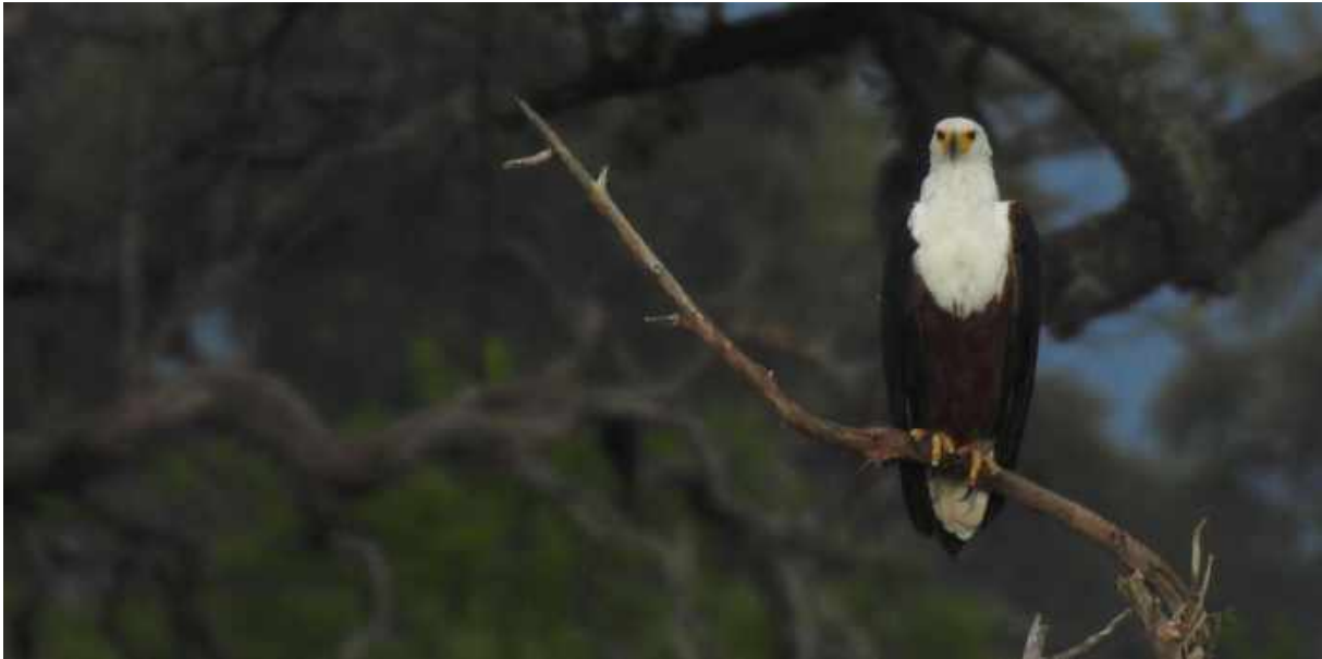
African Fish Eagle. Delta Camp.