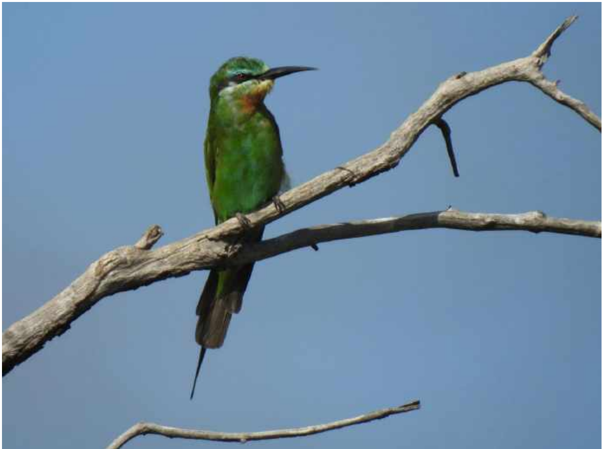
Grön Biätare är en av många läckra praktfåglar som övervintrar i södra Afrika.