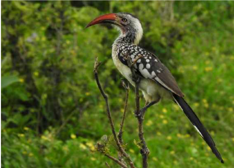
Southern Red-billed Hornbill. Vanlig i norra delarna av Okavangodeltat.