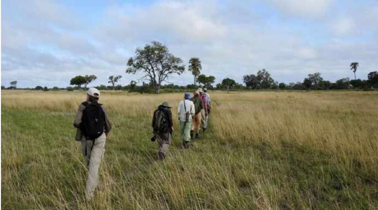
Walking Safari vid Delta Camp.