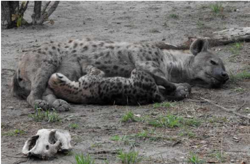
Spotted Hyaena vid lyan. Kwai Concession Area.