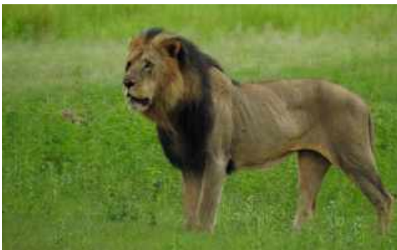
Lejonhane. Chobe NP.