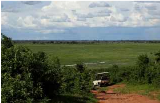
Flodslätten med Chobe River. Namibia tvärs över.

här och tog paus fram till High te! Därefter ut på vår första jeepsafari i Chobe NP 2 .