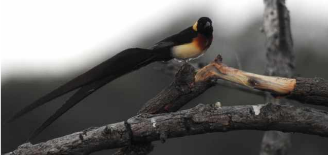
Long-tailed Paradise Whydah. Chobe NP.