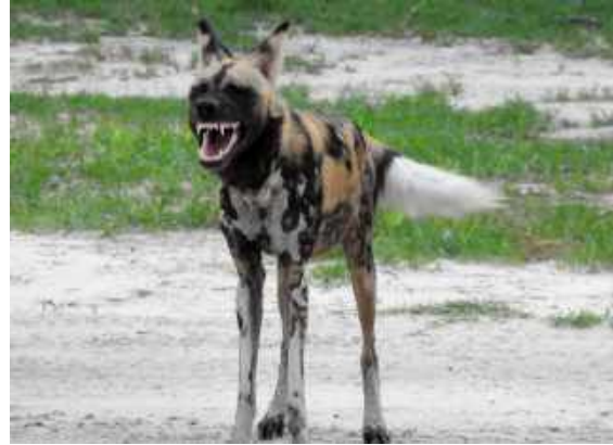
Wild Dog. Kwai Concession Area.

Tillbaka på lodgen väntade mycket god middag.