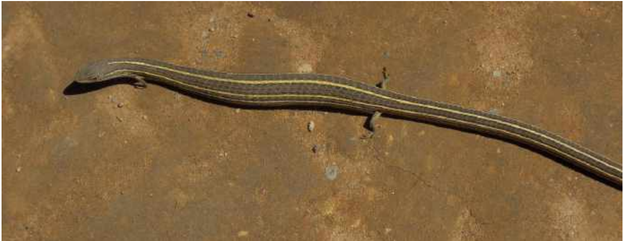
Transvaal Snake Lizard. På väg upp mot Sani Pass.