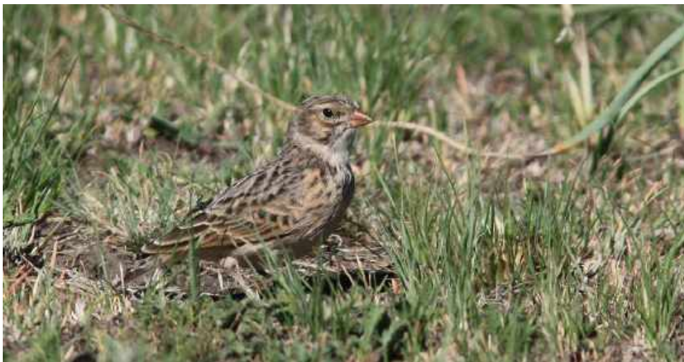
Rudd's Lark. Wakkerstroom.