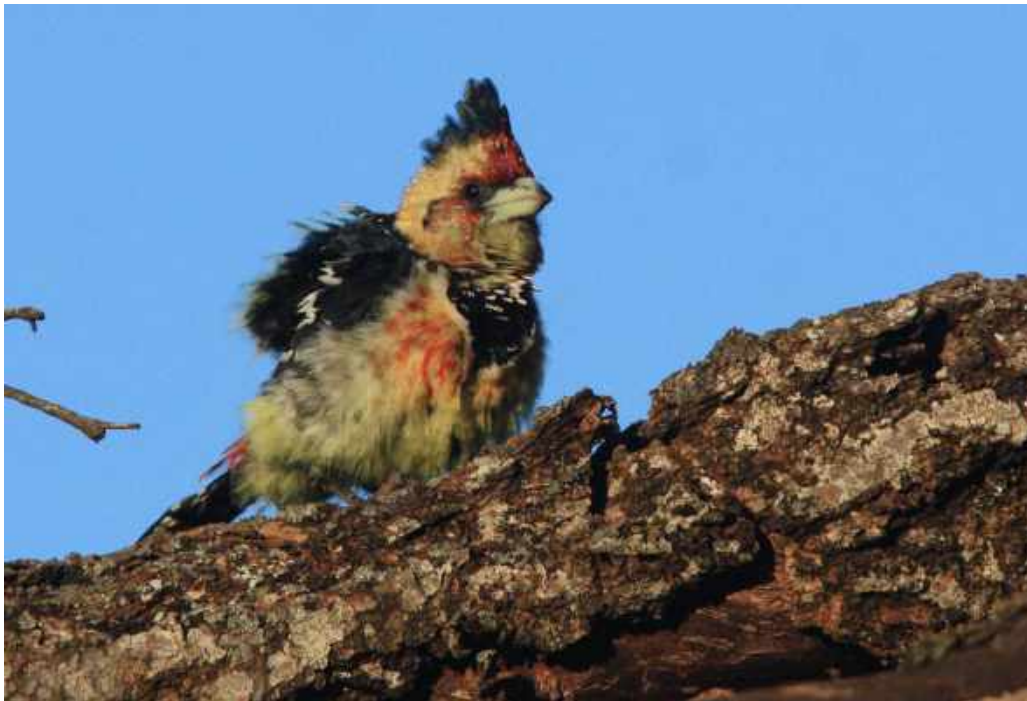
Crested Barbet. Kruger NP.