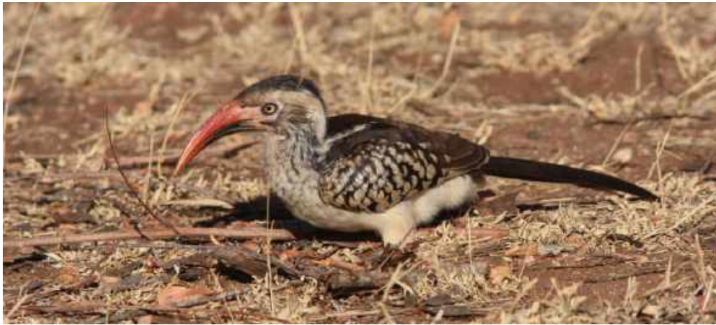
Southern Red Hornbill. Kruger NP.