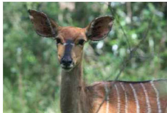
Nyala, hona. Mkuze Game Reserve.

På kvällen artgenomgång och god buffé på vårt fina logi.