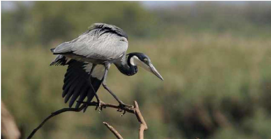
Black-headed Heron. Mkuze Game Reserve.