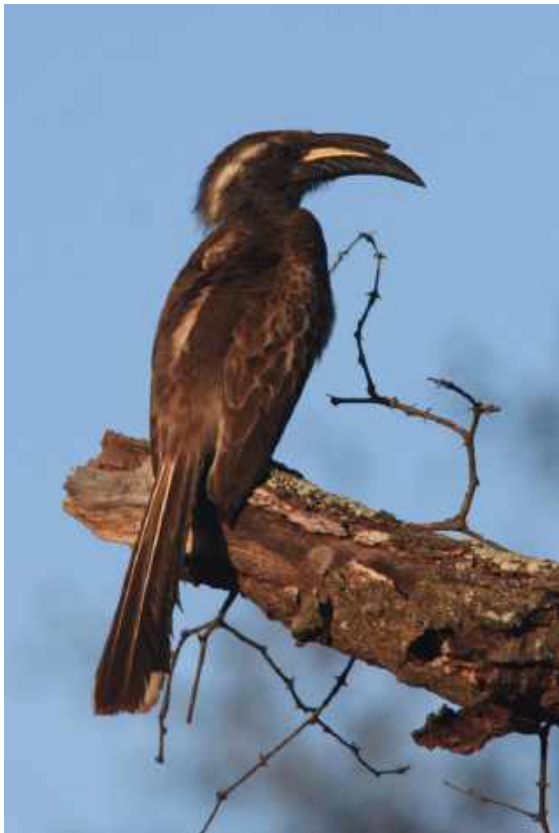
African Grey Hornbill. Kruger NP.

Efter middagen kunde vi lyssna in en African Scops Owl som knorrade inne på campområdet.