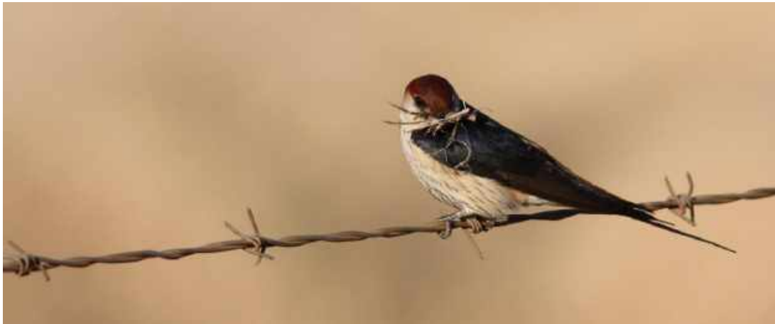
Greater Striped Swallow.