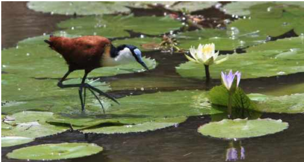
African Jacana. Kruger NP.