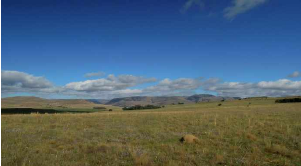
De öppna markerna runt Wakkerstrom bjöd på resans kanske finaste skådardag.