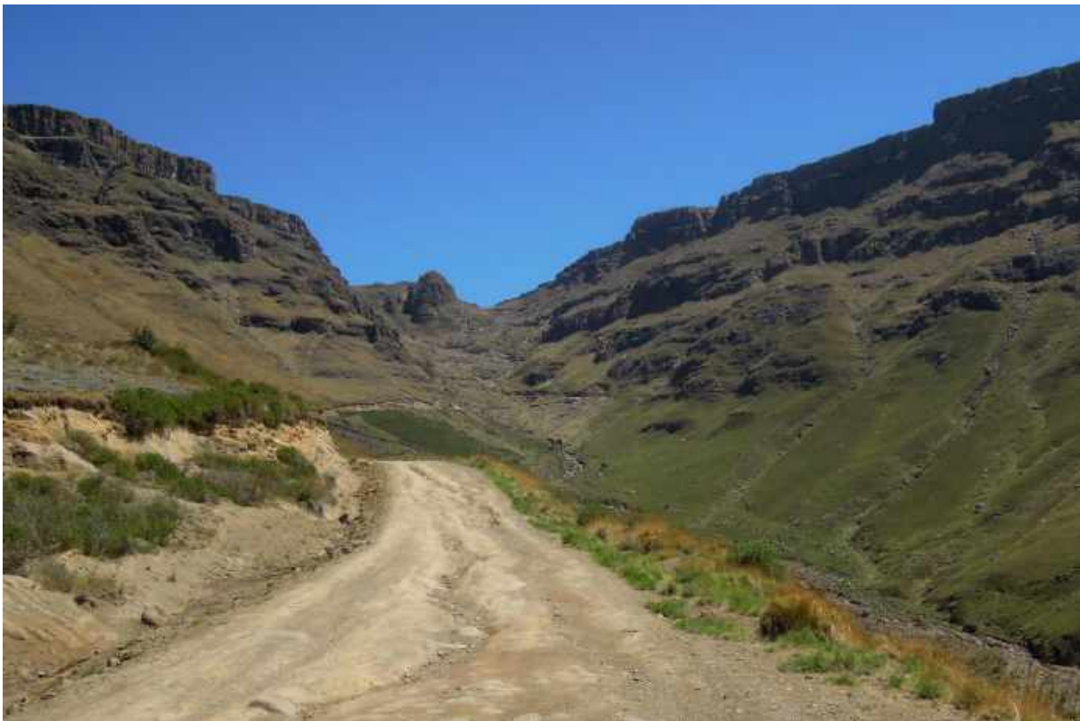
På väg upp till Sani Pass.