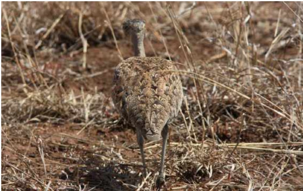
Red-crested Korhaan. Kruger NP.