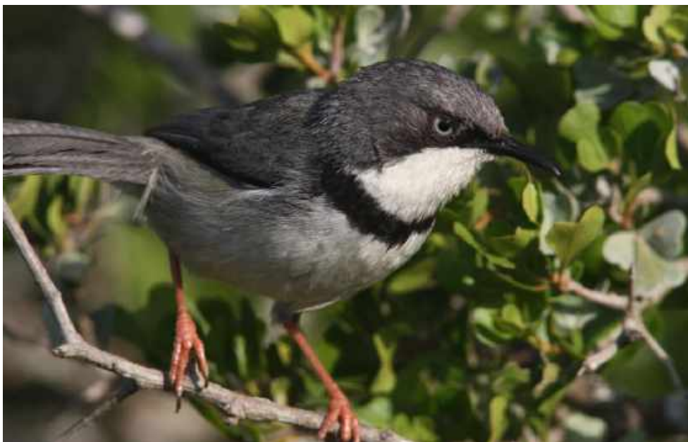
Bar-throated Apalis.