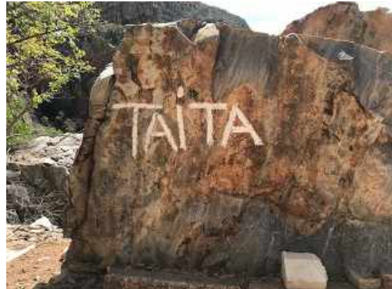
Det här här de finns!

Efter frukost checkade vi ut och påbörjade dagens transport. Vi körde långsamt ut ur Krugerparken och spanade efter fåglar och däggdjur. Nya arter för fågellistan blev bl a Southern Ground Hornbill. Så småningom nådde vi gaten ut ur parken och körde vidare mot Abel Erasmus Park. Vi hade en bonusart att spana in, nämligen Taita Falcon. Arten har varit försvunnen från lokalen sedan 2013, men har nyligen dykt upp på nytt här. En kul överraskning för gruppen!