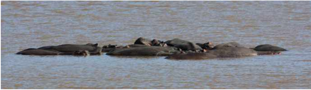
Hippos! St Lucia.