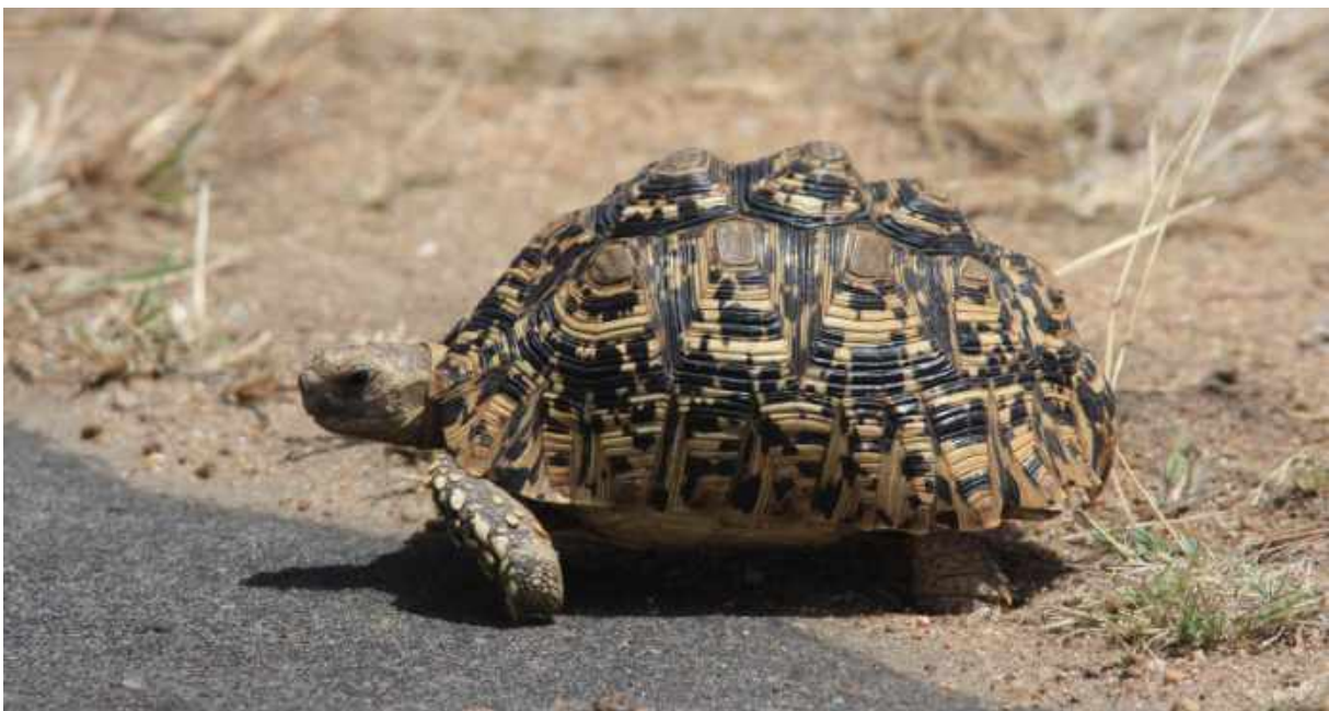
Leopard Tortoise. Kruger NP.