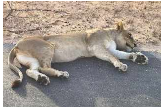
Skönt att ligga på asfaltens släta yta. Lejon på väg till Skukuza Lodge, Kruger NP.

Först vid halvfemtiden nådde vi den södra gaten till Kruger och efter en smidig registrering kunde vi köra in i denna mycket välkända nationalpark. Vi hade ungefär en timmes transport kvar till vår lodge, vilket gav oss en extra halvtimme för skådning och spaning (man får inte vara inne i parken efter kl. 18.00). Vi såg ett femtiotal elefanter som födosökte, enskilt eller i små grupper. En Klipspringer stod fint på toppen av ett granitblock på en höjd, typiskt för arten. Några bilar hade samlats vid vägkanten och där låg en Spotted Hyena med en liten unge som diade. Pappan kom snart gående. Riktigt fin obs! Lite längre fram låg ett lejonpar. Nära vägen (honan låg faktiskt på vägen). De gick sedan in en bit i den buskrika vegetationen. Hela området vi körde genom var täckt med låga träd och risiga buskar. Det var ändå så pass glest i vegetationen att man såg rätt så bra igenom. Vårt fina flyt med däggdjuren fortsatte och nu gick två vita trubbnoshörningar till vänster om vägen. De börja de med att visa bakarna, sedan vände de om och vi fick se den karaktäristiska breda munnen.