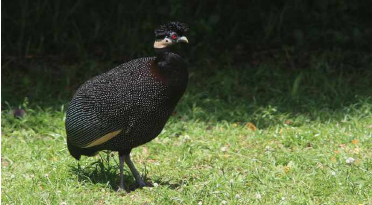
Crested Guineafowl. St Lucia.