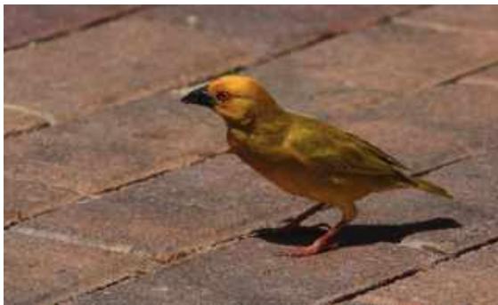
Golden Weaver. Saint Lucia.

På kvällen artgenomgång och god middag på vårt logi.