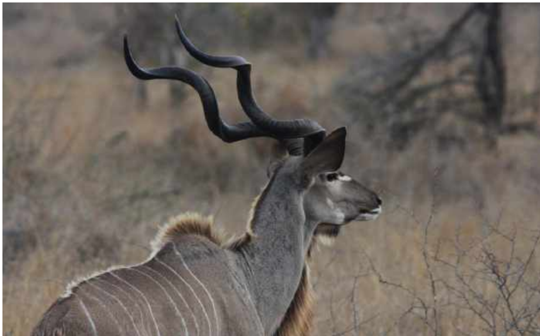
Greater Kudu. Kruger NP.