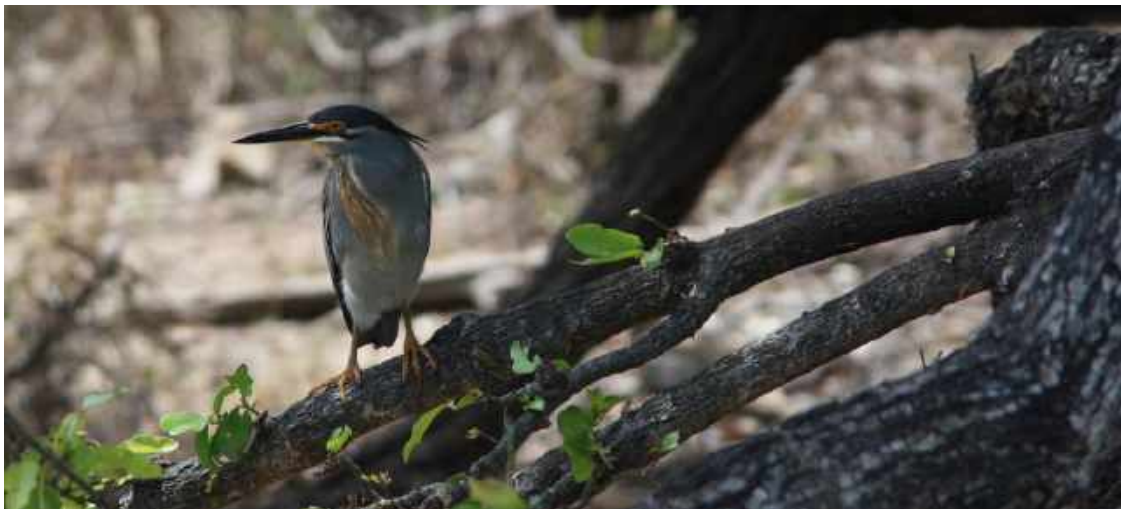
Striated Heron. Kruger NP.