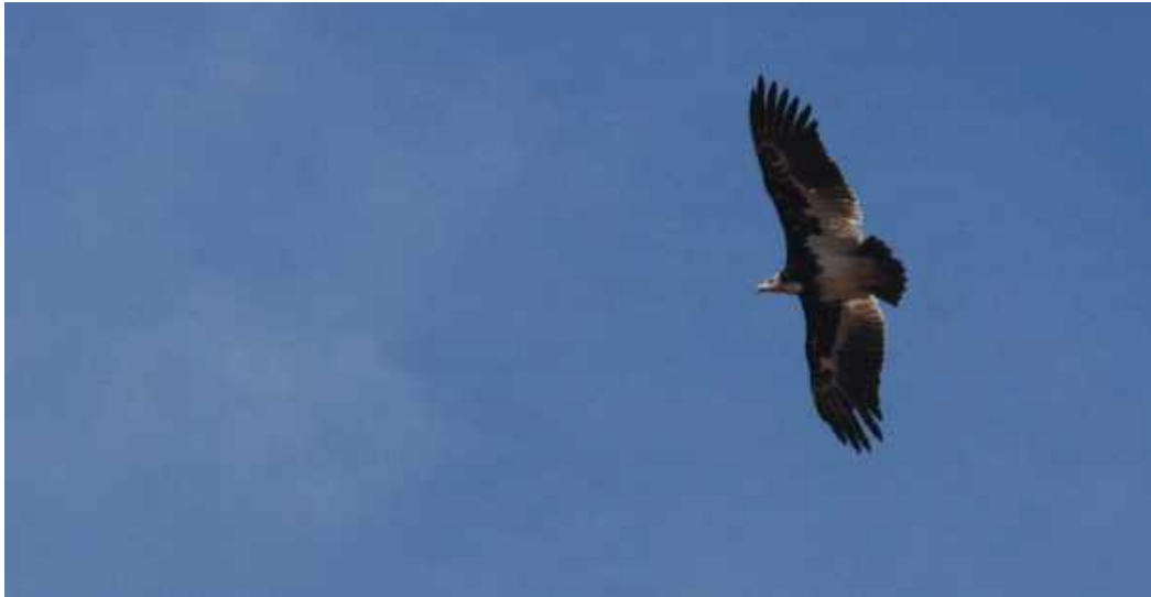
White-headed Vulture. Kruger NP.