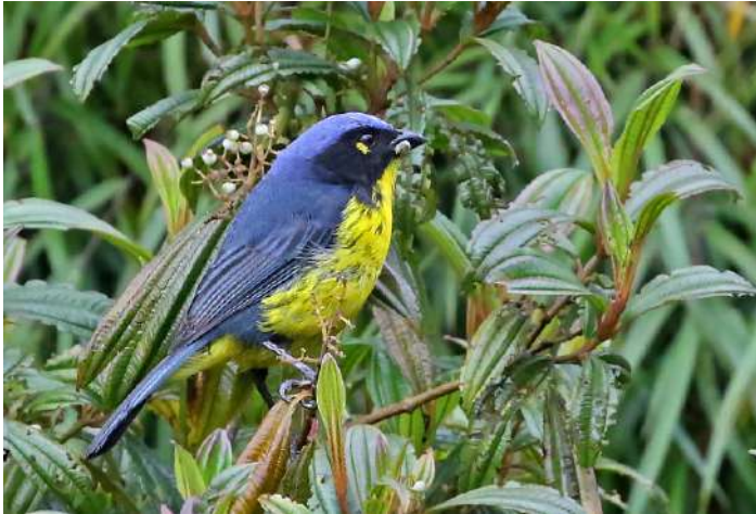
Santa Marta Mountain-Tanager