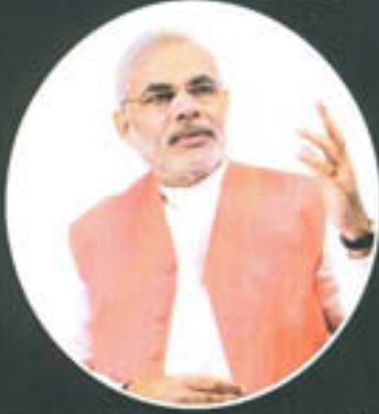
માનનીય વડાપ્રધાનશ્રી નરેન્દ્રભાઈ મોદી