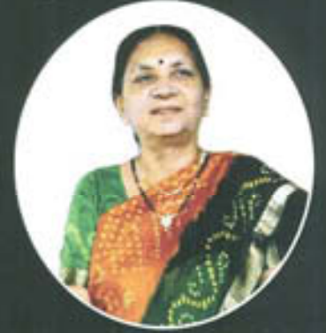
માનનીય મુખ્યમંત્રીશ્રી આનંદીબહેન પટેલ

એક સુશિક્ષિત મહિલા સમગ્ર સમાજનું નેતૃત્વ કરી શકે છે.