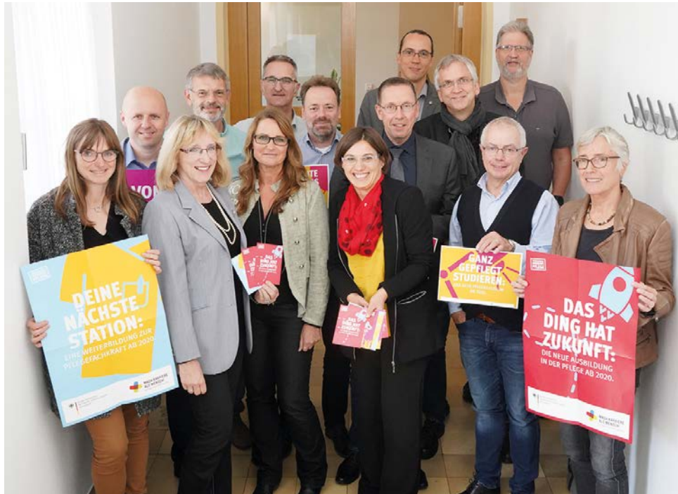
Schließt sich der Bundeskampagne für mehr Auszubildende in der Pflege an: die diözesane Arbeitsgemeinschaft der kath. Ausbildungsstätten für Gesundheits- und Pflegeberufe im Erzbistum Paderborn.