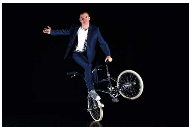
Das Highlight beim Integrativen Sportfest 2019: Die BMX Show von Frank Wolf wird die Zuschauer ins Staunen versetzen, Bildrechte: Frank Wolf

borner Sportshow, bei der diverse Paderborner Sportvereine und Institutionen die Zuschauer begeistern werden. Das Highlight wird sicherlich der Auftritt von Frank Wolf mit seiner BMX Show sein. Ob Sprünge über den Lenker, Fahren auf dem Sattel oder rasanten Herumwirbeln mit dem gesamten Bike – Frank Wolf lässt jeden Showeffekt aussehen, als würde es eine Leichtigkeit sein, mit dem BMX Rad spektakulär über die Bühne zu radeln. Der Berliner Künstler, bekannt durch einige Fernsehauftritte, wird die Zu-