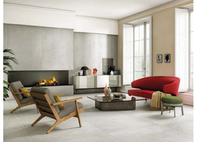
Stimmungsmacher: Je nach Farbe und Form schaffen keramische Fliesen eine besondere Atmosphäre. In der Trendfarbe Grau wirkt der Raum edel und trotzdem wohnlich.

techniken ist eine große Farben- und Formenvielfalt möglich, die gestalterisch fast alles erlaubt. Damit bietet es sowohl für junge Familien als auch Best Ager die passende Optik. Apropos Best Ager: Aufgrund ihrer Lebenserfahrung entscheiden sie sich oft bewusst für Qualität, die sich auf lange Sicht auszahlt und welche die Investition wert ist. Bodenbelag aus Keramik ist robust und belastbar, er bleibt trotz geringen Pflegeaufwands für Jahrzehnte attraktiv und ist gesundheitlich absolut unbedenklich. Damit sind keramische Fliesen im wahrsten Sinne des Wortes eine optimale Grundlage für ein wohngesundes Zuhause. Und das gilt für alle Generationen – vom krabbelnden Enkel bis zu den fiten Großeltern. Mehr Infos gibt es im Internet unter www.cerabella.de . (epr)