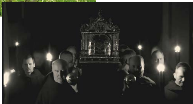
Die Paderborner Geisterprozession als schwarz-weiße Spielszene. Filmkomparsen sind die traditionsreichen Träger des Liborischreins, den nur sie dürfen die Originalrequisite tragen.