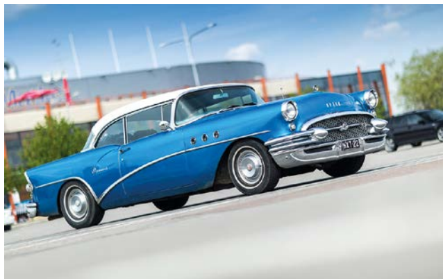
Oldtimer brauchen im Winter eine besondere Pflege.

Reifen: Damit Reifen und Radaufhängungen entlastet werden, sollte der Oldtimer aufgebockt werden. Steht das Fahrzeug auf eigenen Rädern, sollte der Reifendruck um etwa 0,5 Bar im