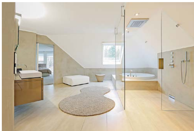
Bodenebene Duschen und großzügige Grundrisse schaffen Badkomfort in jeder Lebensphase und erleichtern die Nutzung bei körperlichen Einschränkungen.

Eine Badmodernisierung ist häufig angebracht, wenn das Haus und seine Besitzer schon ein wenig älter geworden sind. Auf der Wunschliste stehen dann ein neuer frischer Look und mehr Komfort. Nicht vergessen werden sollte auch die Barrierefreiheit. So kann man das neue Bad optimal weinternutzen, falls später einmal körperliche Einschränkungen auftreten. Doch vieles, was es barrierefrei macht, bietet auch zuvor schon Vorteile.