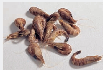
Nordseekrabben sind keine Krabben, es handelt es sich vielmehr um Sandgarnelen oder Granate. Sie zählen zu den besten Garnelenarten.

Garnelen unterscheiden sich von anderen Krustentierarten durch ihren langen ausgestreckten oder eingekrümmten Hinterleib. Ein weiteres typisches Merkmal ist das nicht immer vorhandene, seitlich abgeplattete Stirnhorn. Verbreitet sind Garnelen in allen Meeren der Erde, Süßwassergarnelen hingegen kommen nur in den Tropen und Subtropen vor. Garnelen unterscheidet man noch einmal in Geißelgarnelen und Eigentliche Garnelen. Bei den Geißelgarnelen überlappen sich die Seitenplatten der Segmente 1 bis 3 dachziegelartig. Zu ihnen zählen beispielsweise die auf beiden Seiten des Atlantiks weit verbreiteten Roten Riesengarnelen , deren Weibchen bis zu 33,5 cm lang werden können. Im Mittelmeer kommt diese Art nicht vor, wird jedoch von spanischen Fischern vor der Küste