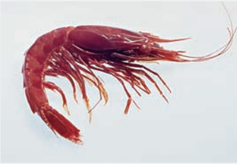
Rote Riesengarnelle – zu erkennen an den scharfen Kanten auf den Rückenpanzerflanken. Große Exemplare werden selten, aber teuer gehandelt.