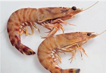
Radgarnelle. Sie hat eine hervorragende geschmackliche Qualität und ist vor allem in Japan und Ostasien von großer wirtschaftlicher Bedeutung.