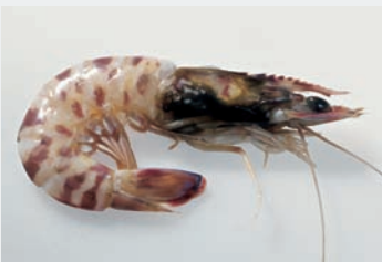
Die Furchengarnelle – eine hochwertige Art – wurde früher in Europa am häufigsten angeboten. Durch Import von Tiefkühlware veränderte sich dies.