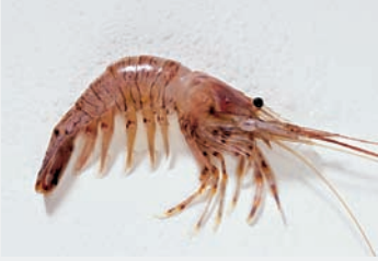
Sägegarnelle. An den Küsten des Mittelmeeres und des südlichen Atlantiks eine geschätzte Delikatesse. Am besten ist sie kurz in Salzwasser gekocht.