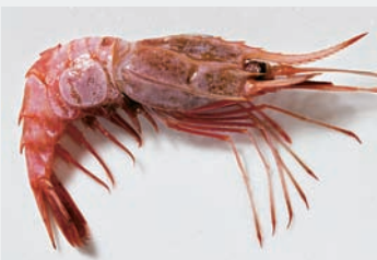
Chilenische Kantengarnelle. Die kulinarisch hochwertige Art kommt bei uns nicht im Ganzen auf den Markt, sondern nur ihr tiefgefrorenes Fleisch.