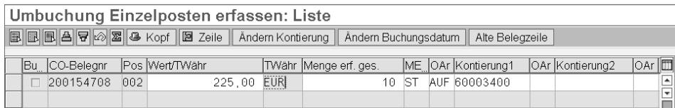
Abbildung 3.7 Ändern der Kontierung bei der Umbuchung von Einzelposten

Das System zeigt Ihnen nun alle Belegzeilen des Belegs an, die mit einer Kostenart gebucht wurden und somit auf ein Controllingobjekt kontiert wurden (siehe Abbildung 3.7). Für jede Belegzeile sehen Sie in der Spalte OAR die Objektart (z. B. KST für Kostenstelle oder AUF für Auftrag) und in der Spalte KONTIERUNG1 das kontierte Objekt. Sie können die Kontierung nun ändern, indem Sie entweder ein anderes Kontierungsobjekt derselben Art eingeben (also einen anderen Auftrag oder eine andere Kostenstelle), Sie können aber auch die Objektart ändern und dann anstelle eines Auftrags eine Kostenstelle eingeben und umgekehrt.