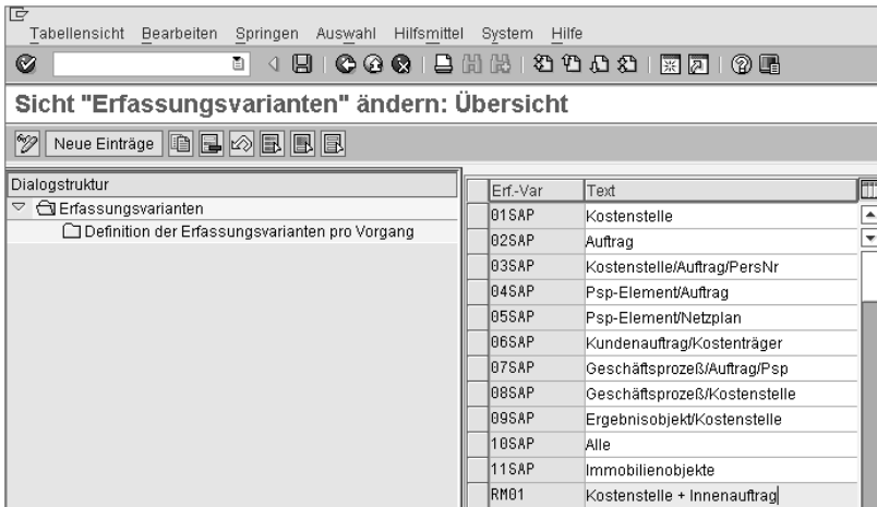
Abbildung 3.3 Erfassungsvariante anlegen

Wie in Abbildung 3.3 dargestellt, habe ich zunächst eine eigene Erfassungsvariante RM01 als Kopie von 01SAP angelegt und die Bezeichnung »Kostenstelle + Innenauftrag« vergeben.