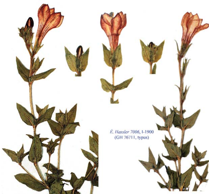
É. Hassler 7006, 1-1900 (GH 76711, typus)

Adumbrationes ad Summæ Editionem 56: 1-46 La Guarda (Badajoz), 06-VI-2014