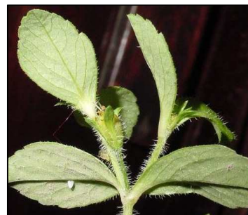
Figura 7. Heterosperma ovatifolium Cav.