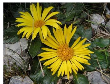
Figura 10. Paranephelius uniflorus Poepp. & Endlicher.