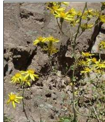
Figura 13. Lomanthus cantensis (Cabrera) P. Gonzáles.