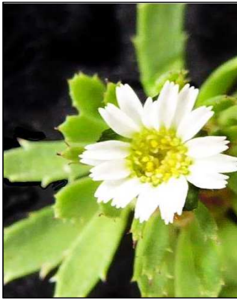
Figura 11. Chaetanthera peruviana A. Gray.