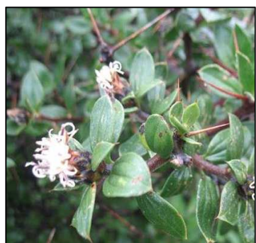
Figura 5. Dasiphyllum ferox (Wedd.) Cabrera.