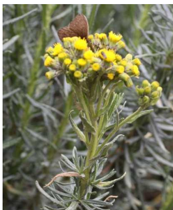
Figura 17. Senecio collinus DC.