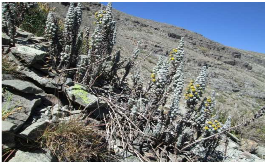
Figura 22. Xenophyllum staffordiae (Sandwith) V.A. Funk.