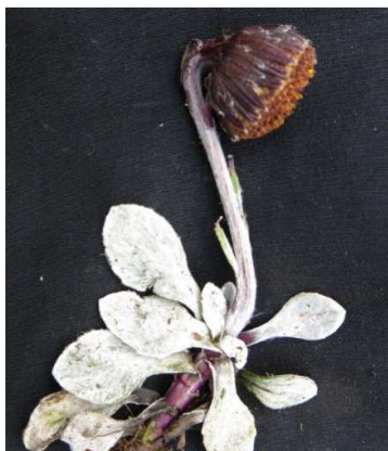
Figura 20. Senecio modestus Wedd.