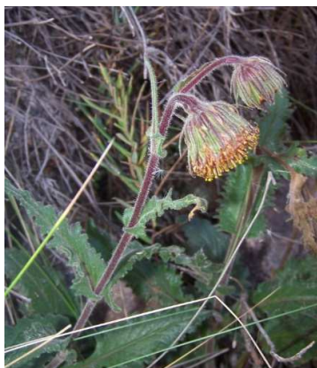
Figura 21. Senecio rhizomatus Rusby.