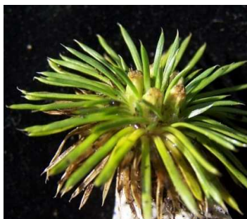
Figura 3. Novenia acaulis (Wedd. ex Benth.) Freire & Hellwig.