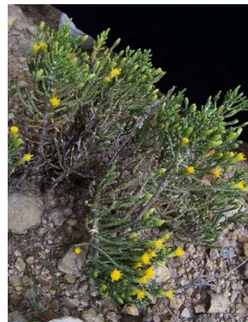
Figura 4. Parastrephia quadrangularis (Meyen) Cabrera.