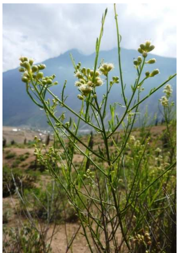
Figura 2. Baccharis sparteae Benth.