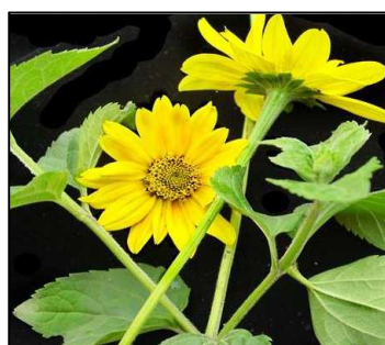
Figura 6. Heliopsis buphthalmoides (Jacquin) Dunal.