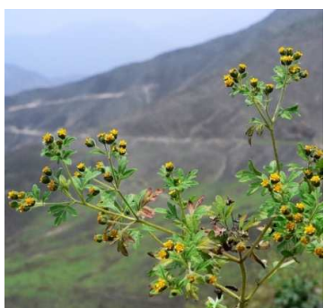
Figura 8. Villanova oppositifolia (Lag.) S.F. Blake.