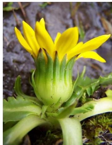
Figura 16. Senecio breviscapus DC.