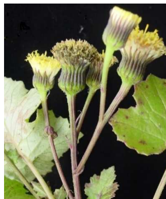
Figura 18. Senecio gracilipes A. Gray.