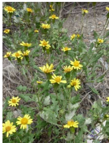
Figura 15. Lomanthus tovarii (Cabrera) B. Nord. & Pelsler.