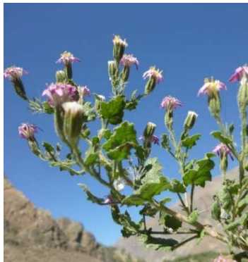
Figura 12. Jungia axillaris (Lag. ex DC.) Spreng.