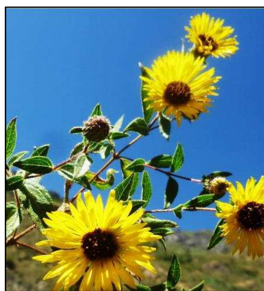
Figura 9. Chionopappus benthamii S.F. Blake.