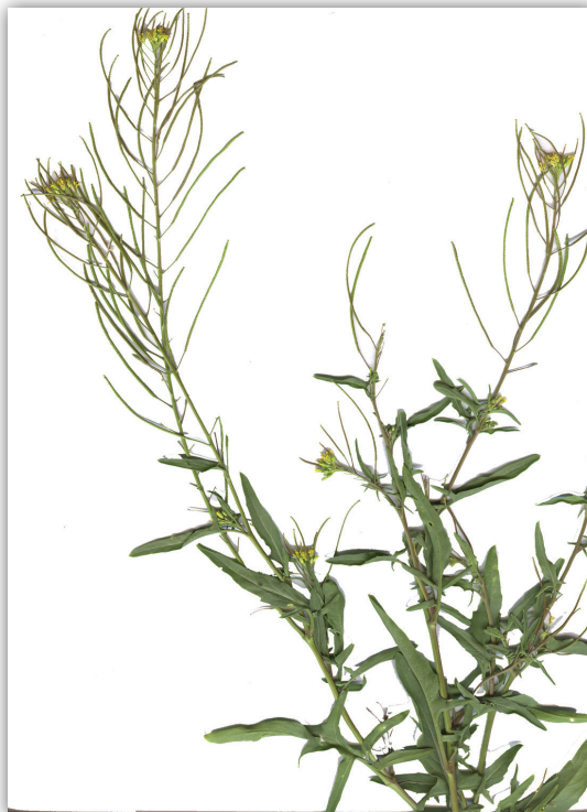
Figura 5. Sisymbrium irio L.

Al analizar los datos obtenidos se observó que en el municipio de Aguascalientes se encontró el mayor número de especies, debido a que éste cuenta con un gran número de habitantes, hecho que ha ocasionado mayor disturbio. Por el