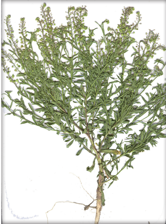
Figura 6. Lepidium virginicum L.

las silicuas tienen el pico abultado a diferencia de B. nigra que no lo tiene. Debido a las semejanzas entre estas dos especies todavía no está bien definido si H. incana pertenece a un género propio o debe ser parte del género Brassica (SIIT, 2009).