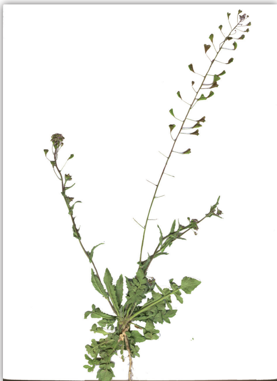
Figura 4. Capsella bursa-pastoris L. Medic.

Las especies de crucíferas encontradas en época de invierno fueron: Brassica rapa , Capsella bursa-pastoris y Sisymbrium irio (Figura 5).