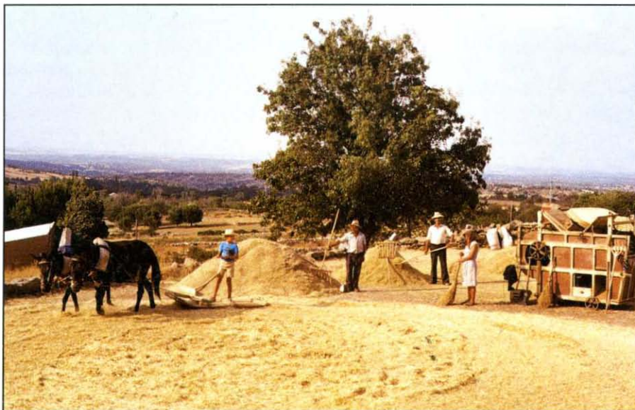
La trilla en la era.