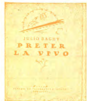
Poemaro, dua eldono 96 pĝ. bind. P 3.30 broŝ. P 2.20