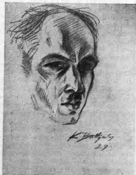
K. Baltgailis: Aŭtoportreto