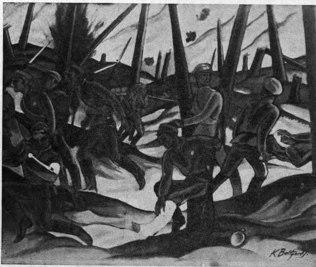
K. Baltgailis : Latvaj militistoj dum la milito

Halinjo sidis sur la benko kaj atente rigardis ĉirkaŭen. Aŭtuna vento pelis amasetojn de falintaj folioj kaj turnadis ilin spirale ĉirkaŭ nevidebla akso. Sur nudaj branĉoj ĝrakis kornikoj, are flugantaj de arbo al arbo. Gajaj infanoj serĉis sur la herbejoj kaŝtanojn por fari el ili longajn kolringojn. La aleon trapasis bela, rozvanga knabeto, per unu mano konduk-