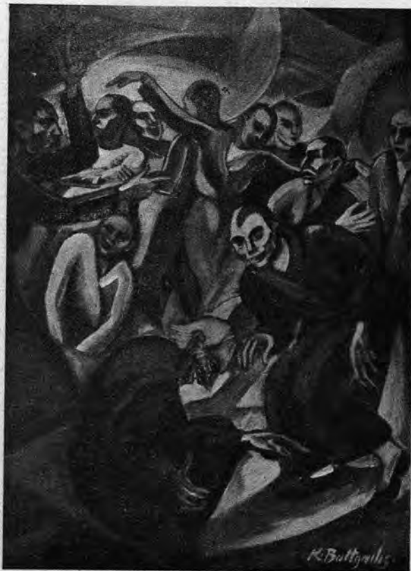
K. Baltagyalis: Frenezuloj

— Mi ne havas tempon, mia kara, — diris milde