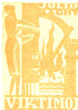
Romano, dua eldono 240 pĝ. bind. P 8.20 kaj P 6.50 broŝ. P 5.50