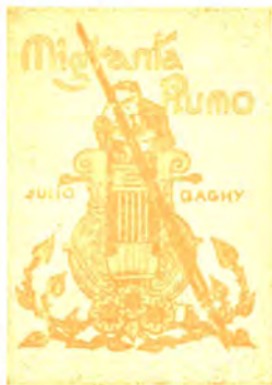
Novelaro 160 pĝ. bind. P 5.— broŝ. P 3.—

C. D. (Catania): Bone ekvilibrata, diŝigenta, ĝentila naturo, kiu sin sentas super la aliaj, kun egoismo, bona observokapablo, sento al realo kaj pasieca parolmaniero.