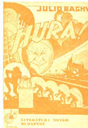
Romano 416 pĝ. bind. P 11.20 kaj P 9.30 broŝ. P 8.20