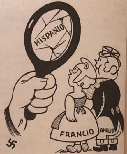
Atendante vidi sian bildon en la rompita spegulo, kiun prezentas la Faŝismo

Kvankam ni ne deziras polemiki, ni nepre bezonis konstati tiun ĉi fakton, almenaŭ por trankviligi nian konsciencon de sinceraj homoj, kies konscio ne bezonas instigojn por plenumi la pezajn devojn, kiujn postulas kruele la milito, sed kies fido al efiko de principoj suferas disreviĝon en la solena horo de la kruda realo.