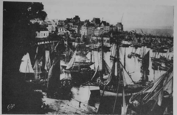
An drañ-man ar bagoù toñ er porzh, en aod vihen... Ar re men 'zo bagoù toñ.

Gouel ar Zakraman a va... gotet... ar Pantekost, goude sulvezh an Drinded, Pardon Ploare hag ar zulvezh goude sulvezh an Drinded e ar c'hentañ sul ar Zakraman. Ha gwechall a vie div zulvezh ar zakraman. Da gentañ, evit kêr a vie fichet tre ar straedoù. Lakeet a vie zirak an ti pe liserioù gwenn pe ollec'henn kotoñs gwenn ha ru staget. Var an drae a vie peget bleunioù. Ha var ar straed ue a vie lakeet glachenn var ar zan hag e kreiz an hen vie graet tresadennoù gad ar bleunioù. Goude, on tammig duvetac'h a vie livet brenn-esken a bep sort liv evit obar tresadennoù. Setu an dud a gemere plas neuze var ar riblennoù da c'hotoz ar prosesion da zon. Da gentañ a vie or groaz douget gad or gwaz ha bugale ar skoulioù deus pep tu, ar botred da gentañ, ar merc'hed goude. Vie kaset memes bugaligoù tri pavar 'loa, toud e gwenn ar merc'hed bihen gad paneroù bihen var o feultrin ga' delioù roz e-barzh. Goude vie ar merc'hed brasac'h deus ar skoul, goude a vie ar vugale a noe graet o fask kentañ er blavezh -se, goude a teuye bugale Mari, goude an drae a teuye potred ar sonerezh gad or beleg hag a teuye neuze ar vachikoted hag ar veleien. Neuze da gentañ 'va ar groaz aour, ar merc'hed yaouenk a zouge banniel ar Verc'hez, banniel bugale Mari, bannieloù a vie a-hed al likerzh. Da prosesion ar pardon a vie douget delwenn Santez Ana hag ar Verc'hez gad ar bannieloù, me paz devezh ar Zakraman.