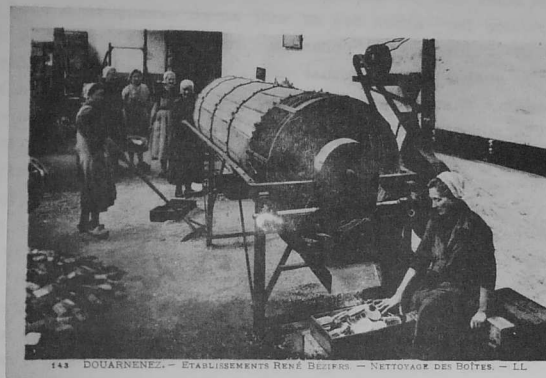
143 DOUARNENEZ. — ÉTABLISSEMENTS RENÉ BEZIER. — NETTOYAGE DES BOÎTES. — LL

An ta' kuññ zo deut da Zouarnenez 'vel mous bihen en or fritur. O, reuzeudik awac'h va e stad pa e deut, uzet awac'h 'va e otou var e fesken hag or botoù koad en e dreid. Me, tamm ha tamm, n'eus graet e blas 'vel just hag e be dimeet d'or c'henitervez defñ, a deus ar mare-se a noe me choñj dign pavar ugen mil lur danve, a vei minorez, acour 'vel just. Ha deus ar pavar ugen mil lur-se n'eus saet or fortun spontus. Me, va ke re onest en e aferioù. Da skouer, ar re a verzhe defñ eol pe houarn gwenn evit ar bouestoù, ar pezh a noe im en e fritur, a va an Otrou P... a noe ar garg da verzhiñ an drae evit on ti. Ha Beziere