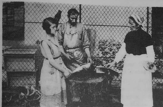
142 DOUARNENEZ - ÉTABLISSEMENTS FINE DÉTÉS. - LA GOUPE DU THON. - LL