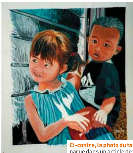
Ci-contre, la photo du tableau de Maurice H. représentant une photo parue dans un article de « Enfants de Partout ».

C'est pourquoi le Bice, à l'occasion du 20 ème anniversaire de la Convention, a invité d'autres organisations et personnalités à lancer aux Etats, à la communauté internationale, aux médias, aux autorités morales et religieuses et aux organisations de la société civile, un appel à une nouvelle mobilisation en faveur d'un monde où la dignité et les droits des enfants soient pleinement respectés.