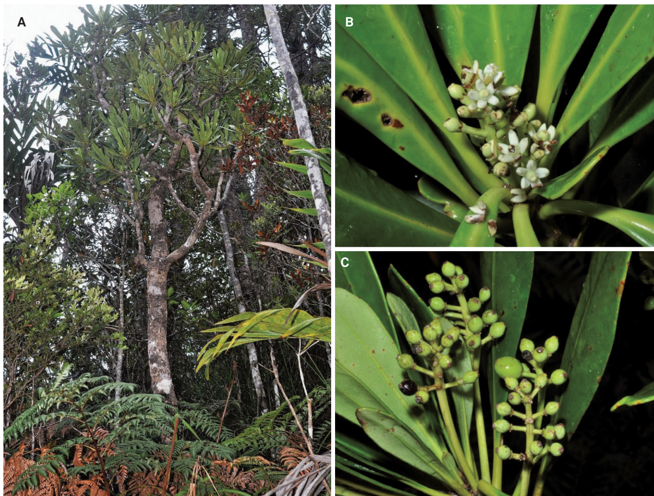
Fig. 2. – Phelline barrieri Barriera & Schlüssel. A. Habitus; B. Inflorescence femelle; C. Jeune infrutescence. [A, C: Callmander et al. 1260; B: Callmander et al. 1262]

Phénologie. – Les fleurs mâles au stade boutons uniquement ont été récoltées en avril, juillet et octobre. Les fleurs femelles ont été récoltées au stade boutons en août et octobre et à maturité en juillet et novembre. Une seule collection récoltée en juillet contient des fruits immatures et mûrs (Schmid 5310), tous les autres spécimens n'ont que des ovaires fécondés ou des fruits immatures et ont été récoltés en janvier, juillet, août, novembre et décembre.